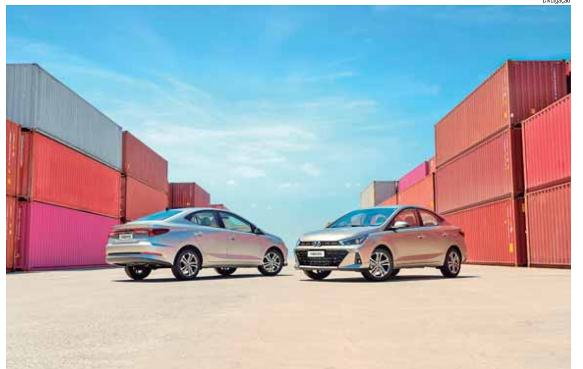
O primeiro lote do HB20S já está em território argentino

O Hyundai HB20S chegará às lojas argentinas em duas versões: Comfort, com câmbio manual, e Platinum Safety, topo de linha, com transmissão automática de seis