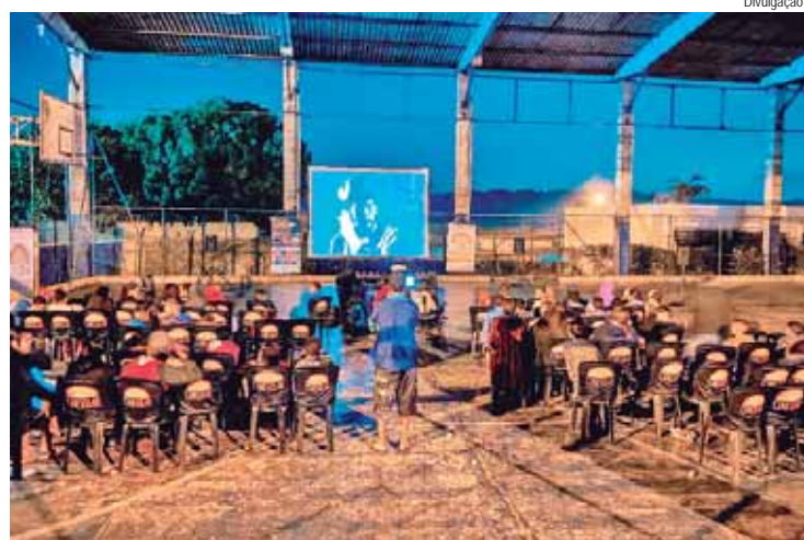
Sessão com entrada gratuita será no Varejão do Cecap, a partir das 18h30

O CineSolarzinho é viabilizado por meio do ProAC (Programa de Ação Cultural), com patrocínio do Grupo CPFL Energia, apoio do Instituto CPFL e reali-