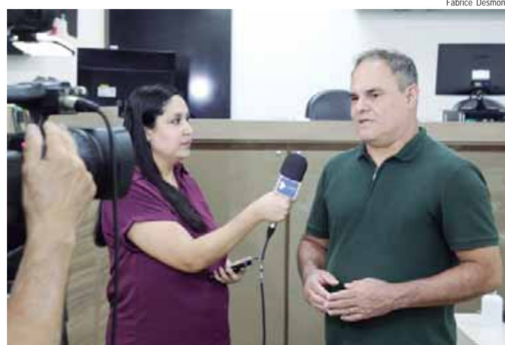
Vereador detalhou ações no distrito de Artemis e defendeu transparência nas atividades parlamentares

Na educação, destacou o restauro do Grupão, prédio tombado que abrigou a segunda escola rural de Piracicaba e a primeira escola mista do município. As obras