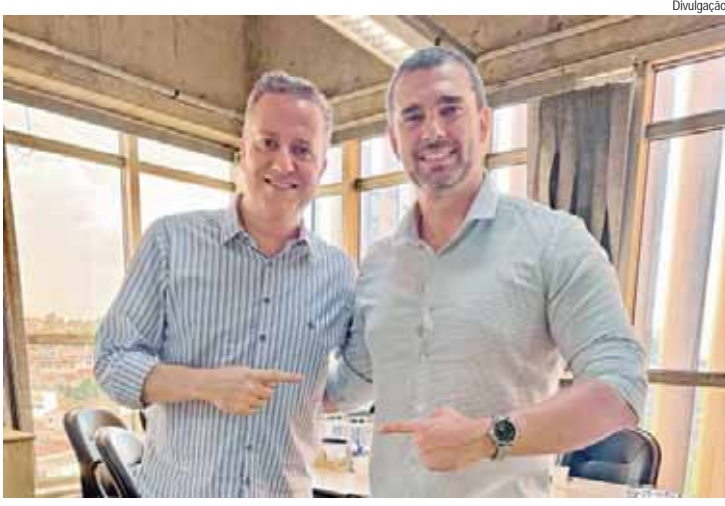
Renan solicitou melhorias e modernização dos atendimentos nas UPAs