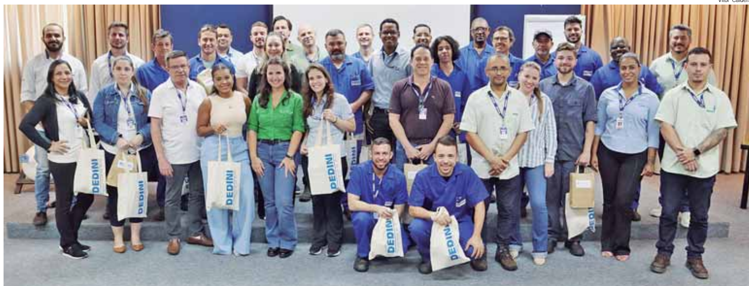
Funcionários da empresa participaram de atividade no Dia Mundial da Água