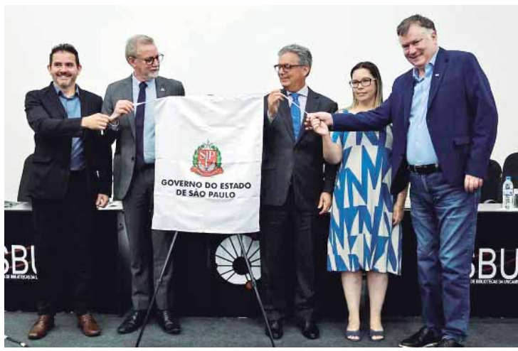
Cerimônia de entrega reuniu autoridades, especialistas e representantes da sociedade