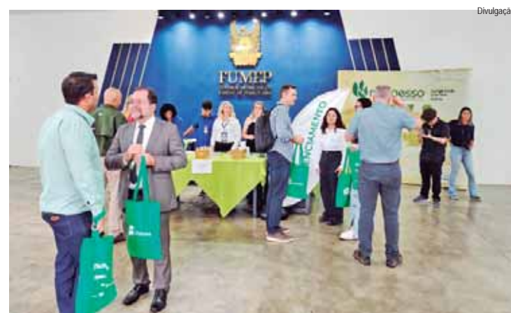
O 2º Fórum reuniu agrônomos, consultores e pesquisadores

Mais de 280 pessoas participaram, em fevereiro, do 2º Fórum Nacional sobre Corretivos de Solos, no Salão Nobre da Fundação Municipal de Ensino de Piracicaba (Fumep). O evento, da Associação Brasileira de Produtores de Calcário Agrícola (Abracal) e organizado pelo Grupo de Apoio à Pesquisa e Extensão (Gape) da Esalq, reuniu engenheiros agrônomos, consultores, pesquisadores e membros da comunidade acadêmica.