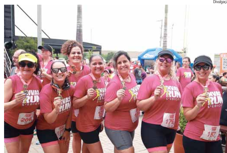
A Divas Run é realizada para comemorar o Mês da Mulher

Uma das principais corridas do ano acontecerá no próximo domingo, 30, com saída ao lado da antiga estação de trem. A 6ª edição do Divas Run é realizada para comemorar o Mês da Mulher e tem toda uma temática voltada à elas. A largada está prevista para acontecer às 7 horas, com percurso de 5 quilômetros pelas ruas da cidade. Além da corrida o evento conta com