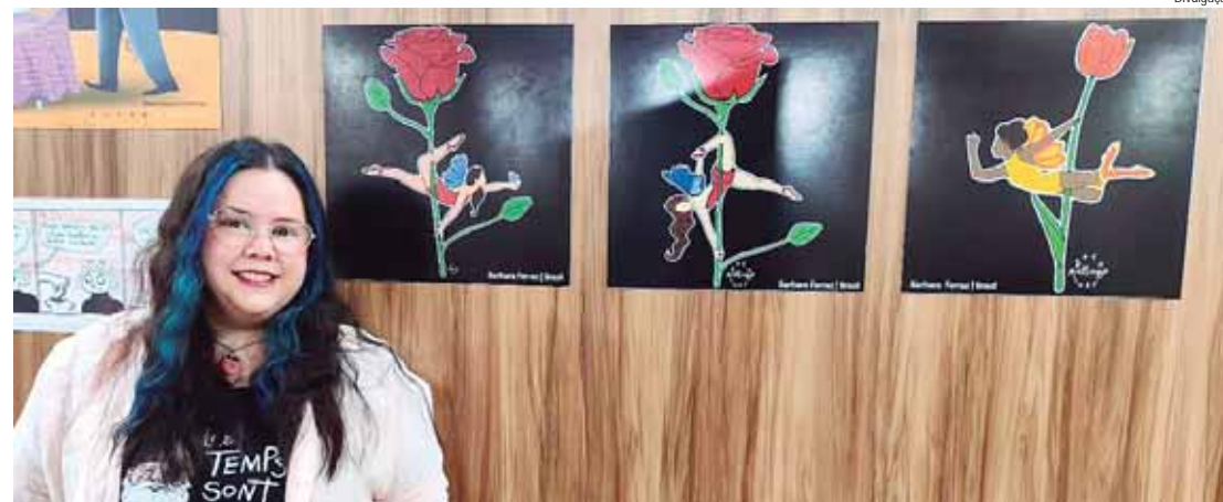
Com 15 anos de história, exposição se consolida como referência mundial na valorização do humor gráfico feito por mulheres

A diversidade é uma das marcas da edição 2025, que reúne cartuns, charges, tiras e caricaturas, abordando desde o empoderamento feminino até temas sociais e culturais contemporâneos. Entre os destaques estão nomes consagrados, como Laerte