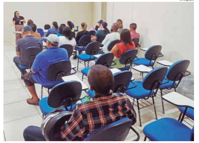
Para as próximas semanas, novos mutirões já estão agendados

pré-definidas no Saresp (Sistema de Avaliação de Rendimento Escolar do Estado de São Paulo). A avaliação leva em consideração, por exemplo, a evolução das notas, a complexidade e o tamanho de cada escola, o grau de vulnerabilidade, além da oferta de aulas.