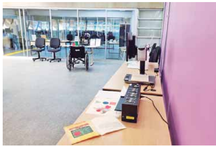
Ambiente é mais inclusivo e adequado às necessidades acadêmicas