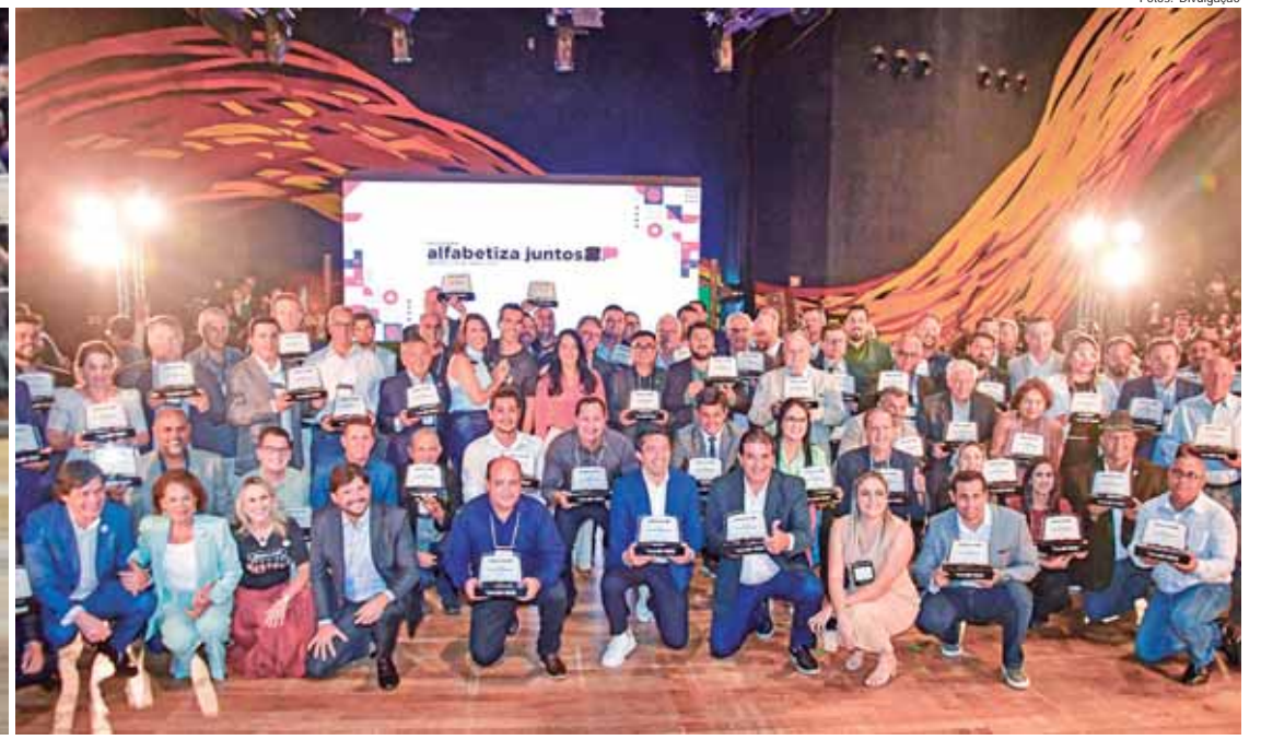
Na região de Campinas, 64 cidades receberam o prêmio Excelência Educacional pelos resultados no Saresp