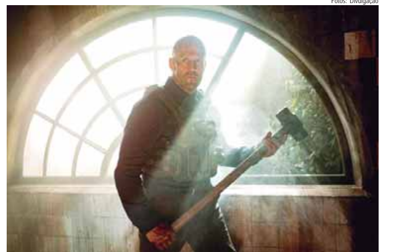
Jason Statham volta às telas no suspense Resgate Implacável, como um ex-agente secreto em busca de uma adolescente desaparecida

PRÉ-ESTREIA - Na próxima quarta-feira (2) haverá a pré-estreia, nas salas 2 e 7 do Cine Araújo, da aguardada comédia de aventura e fantasia "Um Filme Minecraft", baseado no videogame "Minecraft!" de 2011 e protagonizado por Jason Momoa e Jack Black.