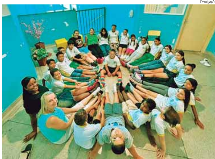
Professores, diretores, funcionários e famílias se envolveram nas atividades

Para celebrar o Dia Internacional da Síndrome de Down, no dia 21 de março, diversas escolas da cidade realizaram atividades. A iniciativa é de fazer com que os alunos compareçam às aulas usando meias trocadas, numa referência ao cromossomo extra e "desparceirado" que caracteriza a síndrome.