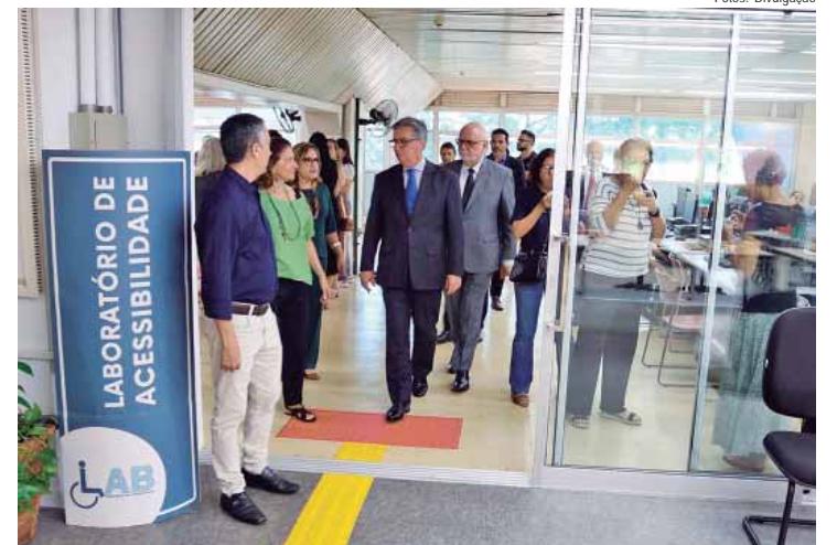
Secretários estaduais participaram da entrega do laboratório