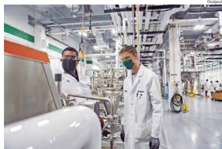
GreenLight Biosciences está sediada nos Estados Unidos