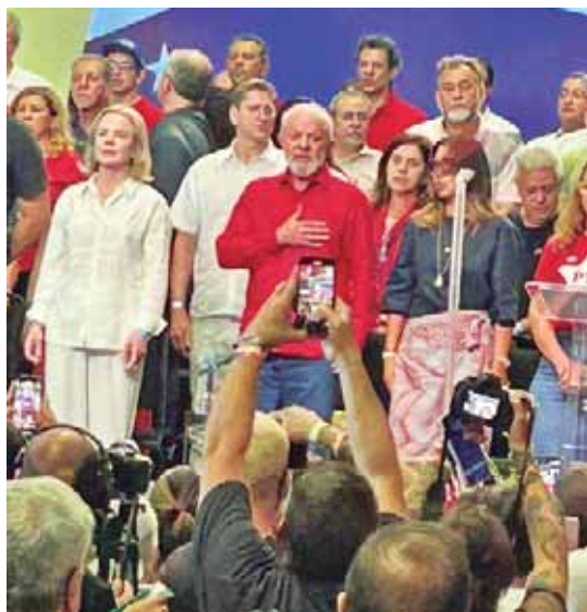
O presidente Lula durante o ato de comemoração dos 45 anos do PT, no Rio de Janeiro