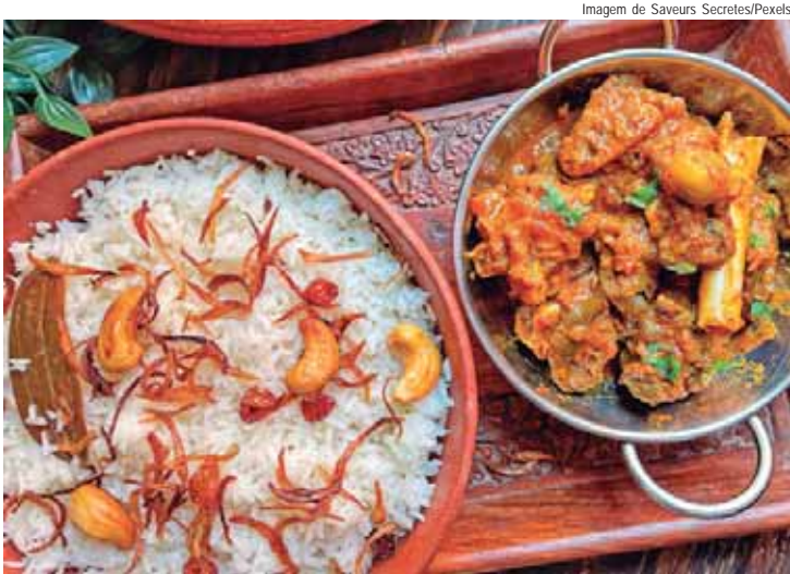
Restaurantes de todo o país têm até o dia 24 de abril para serem inscritos no maior festival gastronômico do Brasil

A partir desta terça-feira, 25, restaurantes de todo o país poderão se inscrever para a 19ª edição do Brasil Sabor, o maior festival gastronômico do país, promovido pela Abrasel. Com o tema "A Celebração da Cozinha Brasileira", o evento será realizado entre os dias 15 de maio e 1 de junho, reunindo estabelecimentos de todas as regiões em uma grande celebração da gastronomia nacional.