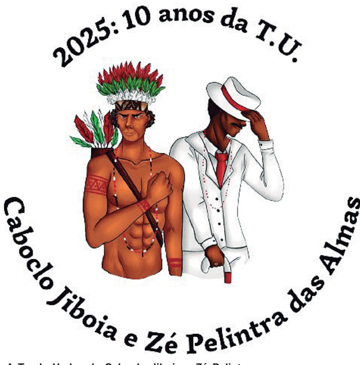
A Tenda Umbanda Caboclo Jiboia e Zé Pelintra das Almas foi aberta no dia 23 de abril de 2015