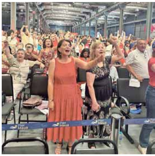
A deputada estadual Professora Bebel durante o ato público em comemoração aos 45 anos do Partido dos Trabalhadores, no RJ