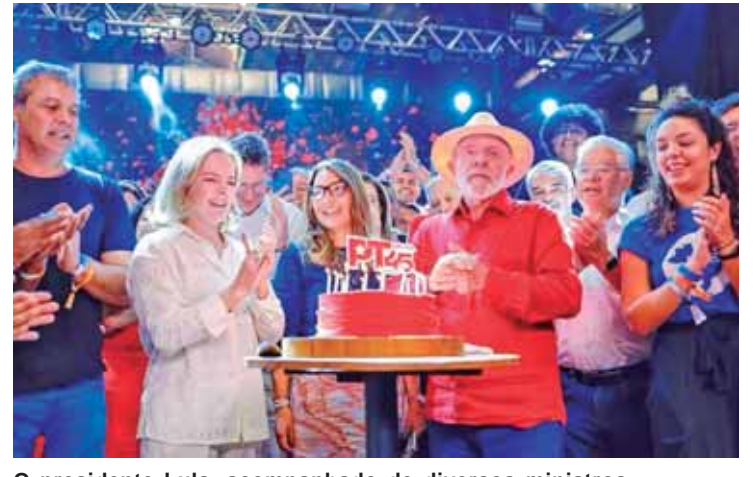
O presidente Lula, acompanhado de diversos ministros, e da presidenta do partido, Gleise Hoffmann, no ato político de comemorações dos 45 anos do PT