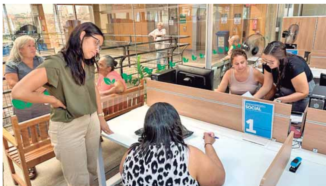
Há cerca de 1.600 mutuários com contratos de financiamento de imóveis inadimplentes

Os empreendimentos para regularização de contratos ficam nos bairros Altos do Tatuapé, Vila Liberdade, Jardim Vitória, Jardim Morada do Sol, Parque dos Sabiás, Jardim Oriente, Mário Dedini, Jardim Algodal, Bosques do Leão, Jardim dos Ipês, Jardim