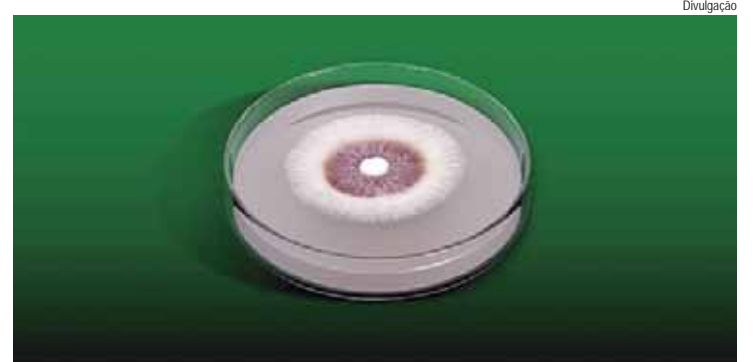
Octane será um dos produtos do portfólio Koppert que serão apresentados na edição 2025 do Coplacampo, que começou ontem

Os dois produtos fazem parte do Sistema Integrado Koppert (SIK), que oferece soluções completas para o agro, incluindo monitoramento, inoculantes, bioativadores, micro e macrobiológicos, além de ferramentas tecnológicas como drones e aplicativos que garantem a compatibilidade de produtos.