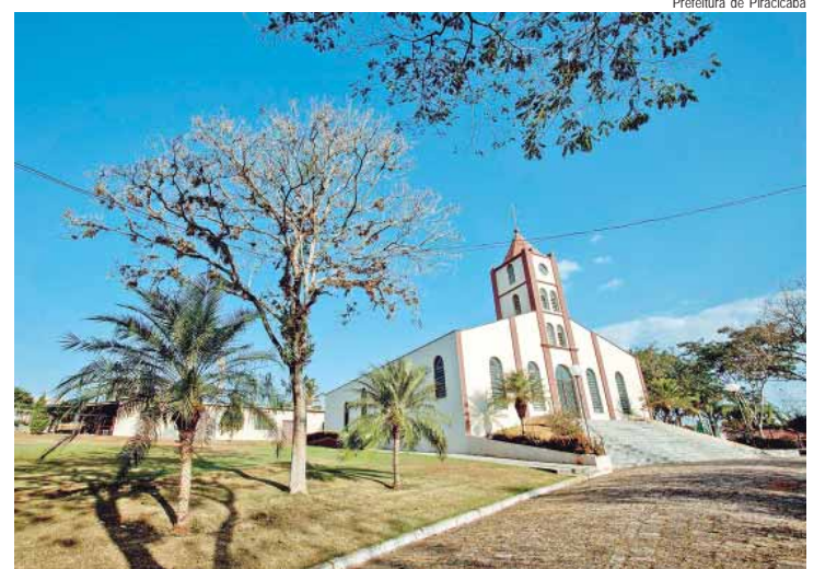
Bairro Tupi é um ponto para desenvolvimento do turismo rural