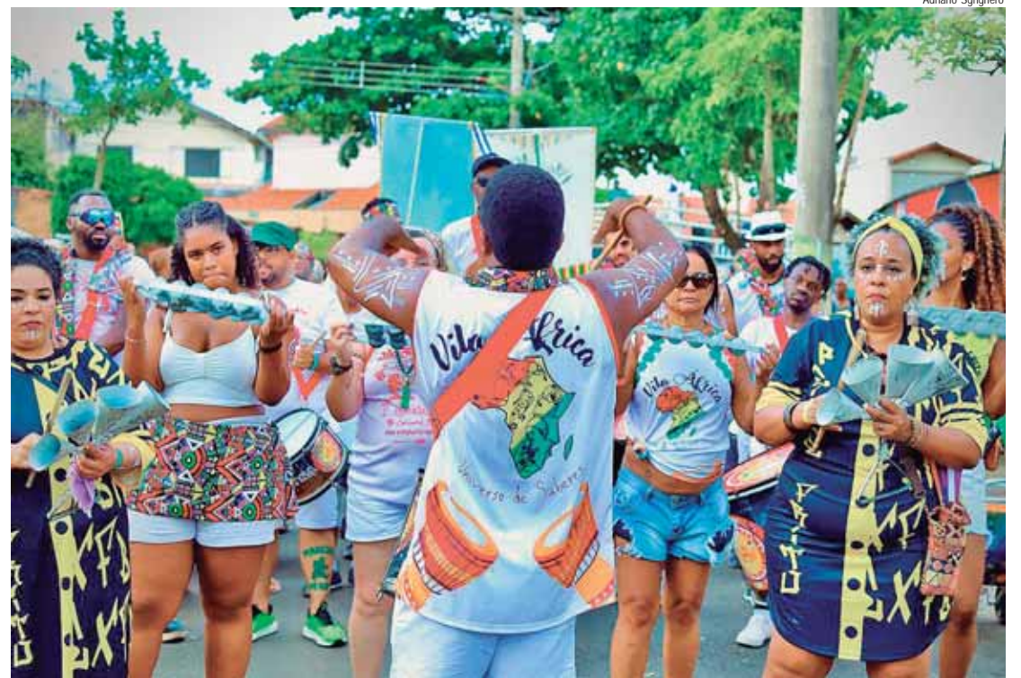
Vila África se apresentou no sábado (22)

Ao todo, a programação de Carnaval 2025 de Piracicaba tem a participação de 16 blocos, que são: Bloco da Salomé, Bloco do Peixe Frito, Bloco Green, Bloco Vila África, Maracatu Baque Caipira, Bloco do Bagaço, Saputeda Mete Marcha, Cordão Mestre Ambrósio/Amigos da Rua do Porto, Unidos de Santa Olímpia, Bloco Afropira, Pira Pirou/Primo Luiz, Bloco dos Boçais, Bloco da Ema e Bloco do Amor.