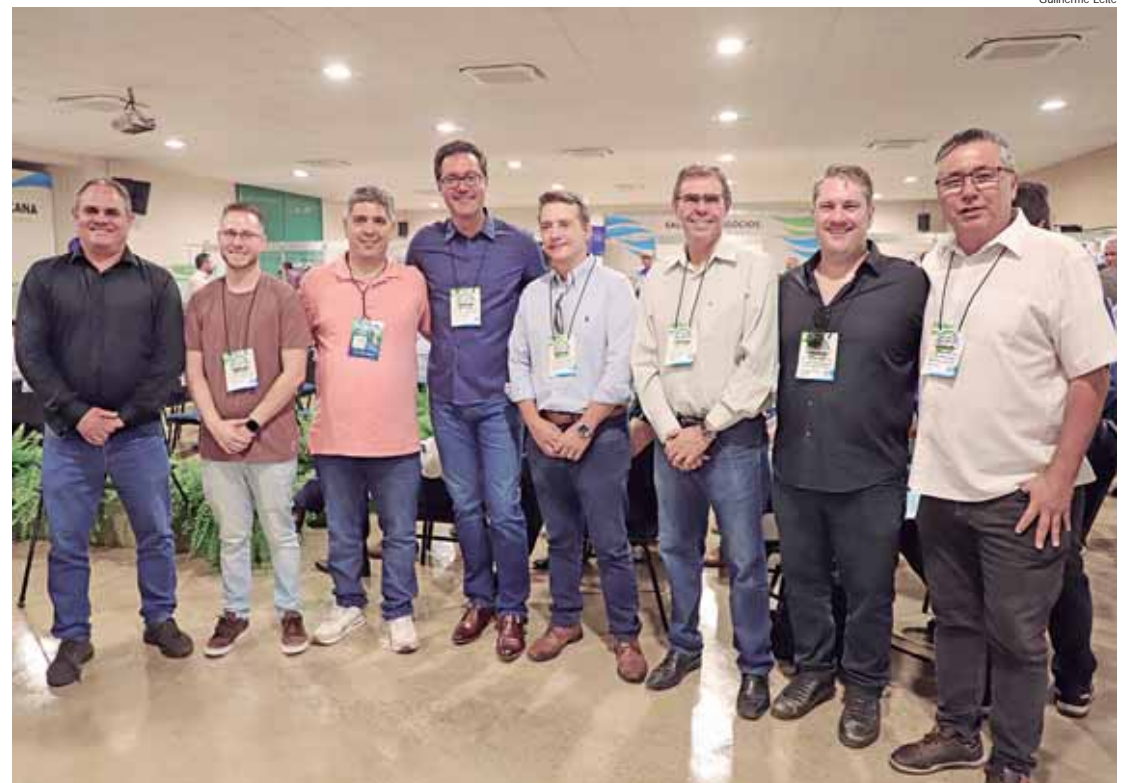
Evento ocorre das 8h às 17h na Unidade de Grãos da cooperativa, na Rodovia do Açúcar, km 157, Taquaral