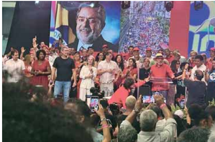
O presidente Lula disse que a elite não suporta o PT 'porque fazemos políticas de inclusão social'