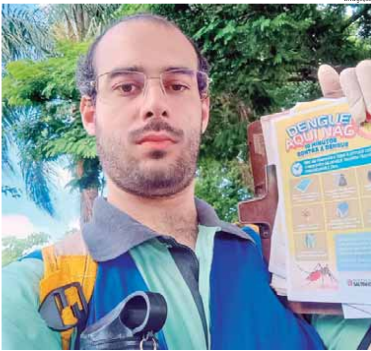
Saltinho participou da 8ª edição da Campanha Regional de Combate à Dengue