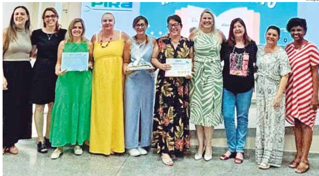
Educadores receberam certificados e livros como reconhecimento pelo bom desempenho na avaliação de Fluência Leitora

A avaliação de Fluência Leitora identifica se as crianças são preleitoras, leitoras iniciantes ou leitoras fluentes. O teste consiste na leitura de textos pré-definidos, e considera fluentes os alunos que con-