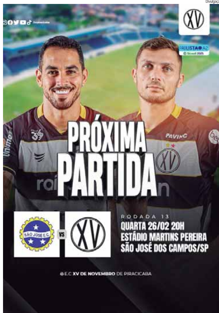
Próxima partida do XV é amanhã contra o São José