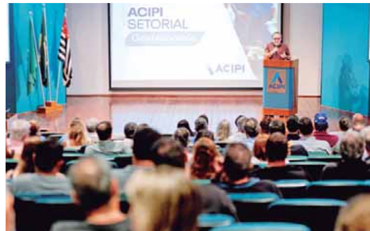
O lançamento do Acipi Setorial consolidou a iniciativa como uma ferramenta estratégica para o fortalecimento do segmento gastronômico