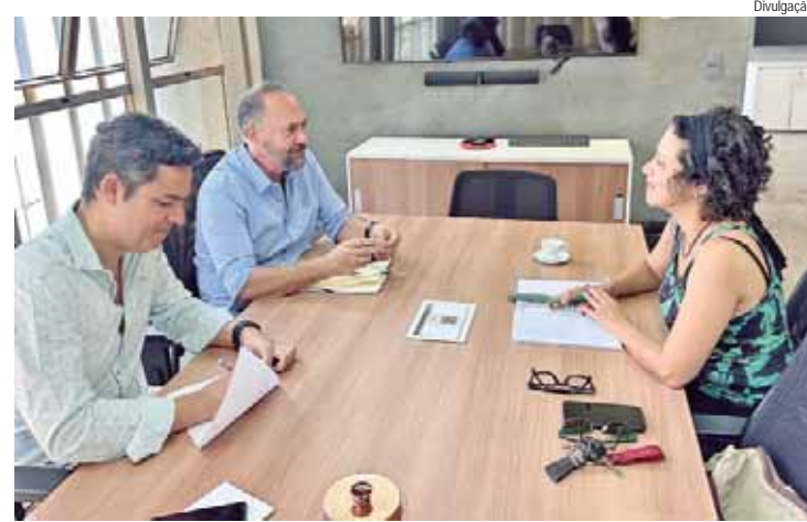
Reunião ocorreu na Secretaria-executiva de Meio Ambiente, no Centro Cívico

Em segundo lugar no ranking de países que mais mandaram turistas ao Brasil, no período, está o Paraguai, com 108.118 visitantes, seguido do Chile (103.620) e Uruguai (62.848). Em quinto, os Estados Unidos registraram 51.919 chegadas. Além disso, os turistas de países europeus como Portugal, Alemanha, França, Reino Unido e Itália somam, juntos, 91.042 no período.