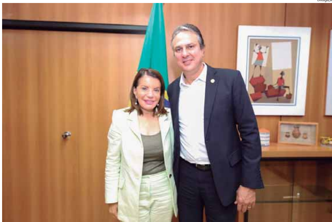
A deputada Professora Bebel com o ministro da Educação, Camilo Santana, durante encontro em Brasília

Na mesma postagem, a deputada Professora Bebel também destacou que, por sua vez, é fundamental que Estados e Municípios cumpram a lei do piso salarial profissional nacional, tanto em relação ao valor dos salários, quanto em relação à jornada de trabalho,