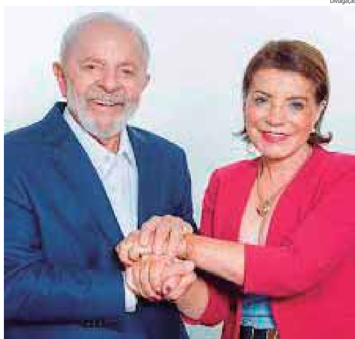
A deputada Professora Bebel fez questão de cumprimentar o presidente Lula pela brilhante iniciativa

O ministro elogiou o presidente Lula por colocar a educação como prioridade e citou avanços recentes, como a sanção da lei que restringe o uso de celulares em sala de aula e a ampliação de programas de alfabetização. Uma das metas apresentadas no programa é garantir que 80% das crianças brasileiras