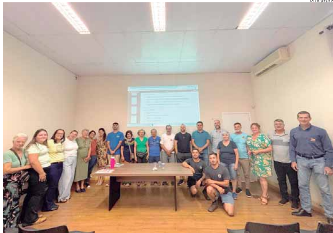
Primeira reunião de 2025 do Comtur (Conselho Municipal de Turismo) aconteceu na segunda-feira (13)

O quarto eixo temático apresentado foi a Expansão do Turismo Contemplativo, para utilizar as paisagens naturais de São Pedro como atrativo para relaxamento, observação e contemplação. Neste item, as ações prioritárias incluem a criação de rotas cênicas, com desenvolvimento e mapeamento de trajetos que passem por pontos de interesse paisagístico, como mirantes naturais e trilhas em áreas preservadas e a implantação de infra-