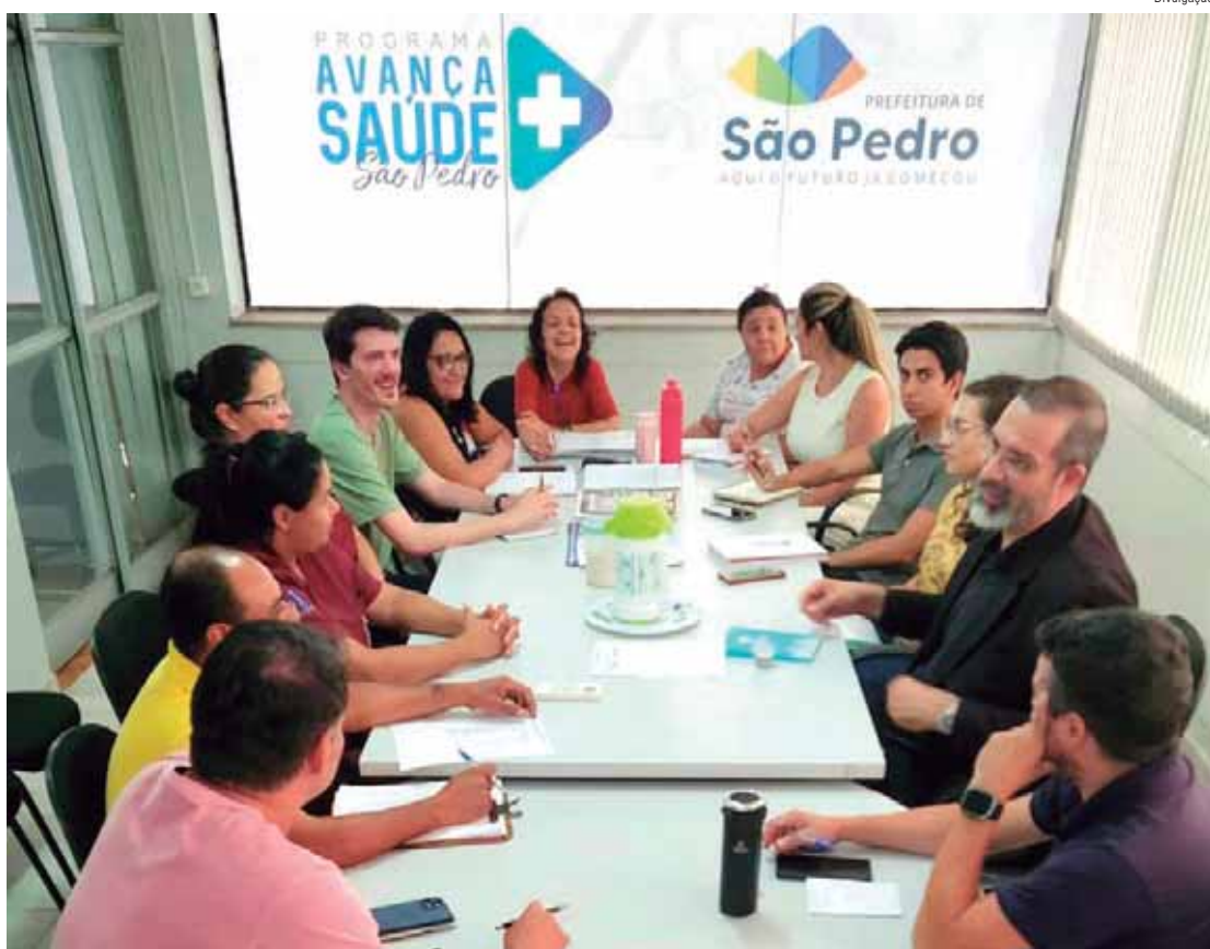
Reunião do Comitê de Combate às Arboviroses contou com a participação de representantes de diversos segmentos de São Pedro

Medidas de prevenção e combate às arboviroses serão desenvolvidas e outras ações serão ainda mais intensificadas, como o cronograma de avaliação de densidade larvária, das visitas "casa-a-casa", em imóveis especiais e em pontos estratégicos, nebulização e bloqueio de criadouros, fiscalização, notifi-