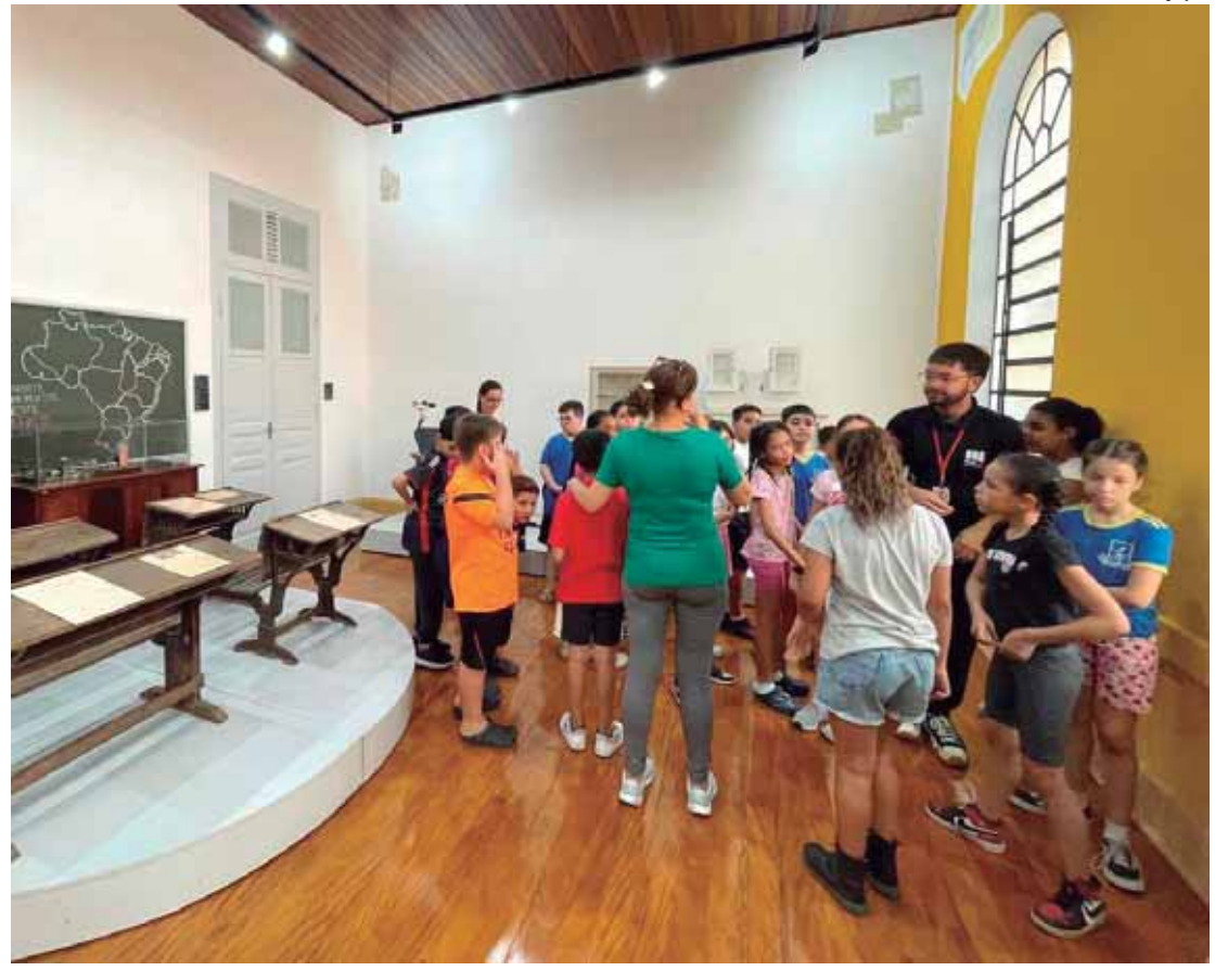
O Museu Gustavo Teixeira está localizado na área central de São Pedro