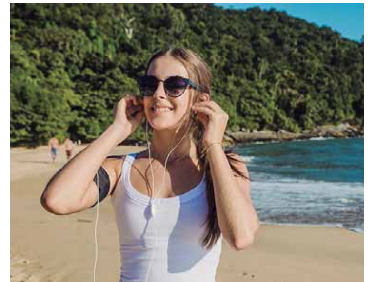
Nesta época do ano aumentam os casos de doenças oculares, alerta oftalmologista

Comunicação/Câmara Municipal de São Pedro