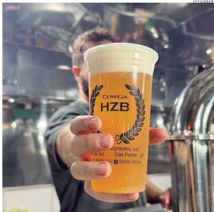
Tour visitará cervejarias HZB, na cidade vizinha, e Osteria Tirolesa

SERVIÇO Rota Cervejeira de Piracicaba Dia 18 de janeiro (sábado) Saída às 10h Local: embarque no 1º bolsão de estacionamento da Rua do Porto, em Piracicaba/SP Destino: HZB e Stella Alpina Valor: R$ 110 por pessoa Ingressos e informações: @rota.cervejeira.piracicaba