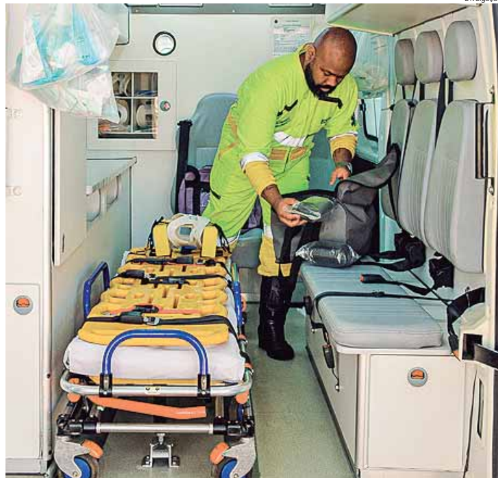
Inspeção de tráfego, socorro mecânico e apoio por guincho foram os serviços mais solicitados ao longo do ano em 1,2 mil km de malha

almente simulados de produtos perigosos, com o intuito de reforçar, de maneira prática, os protocolos de segurança e as ações para resposta rápida a emergências. Esses simulados envolvem toda a equipe operacional, assegurando que estejam totalmente capacitados para atuar com eficiência e segurança em situações críticas", acrescenta Raquel.