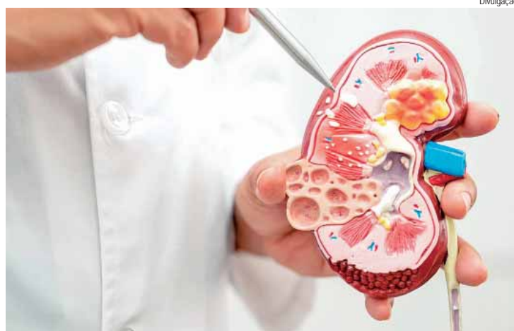
O calor e uma maior predisposição à desidratação tornam mais vulnerável a saúde dos rins e do trato urinário

TAMENTOS - Com o avanço da medicina, os diagnósticos e os tratamentos têm garantido mais conforto e eficácia aos pacientes. "Hoje, a cirurgia minimamente invasiva é uma grande aliada no tratamento de cálculos urinários e outros problemas urológicos. Ela permite maior precisão e recuperação mais rápida, o que reduz os riscos e melhora os resultados", destaca o urologista.