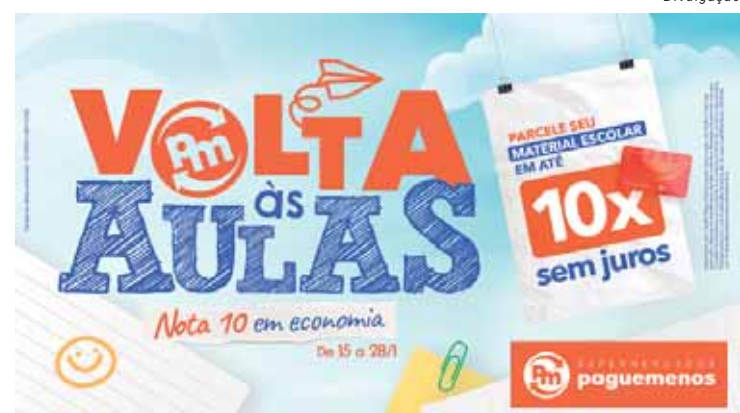
Os Clientes do Cartão Pague Menos têm a vantagem de parcelar suas compras em até 10 vezes para itens de bazar

demia de Covid-19, que agravou os desafios no aprendizado das crianças. "Se não cuidarmos da alfabetização na base, essas crianças ficarão ainda mais vulneráveis no futuro. E não podemos permitir que o destino delas seja a marginalização", finalizou o ministro