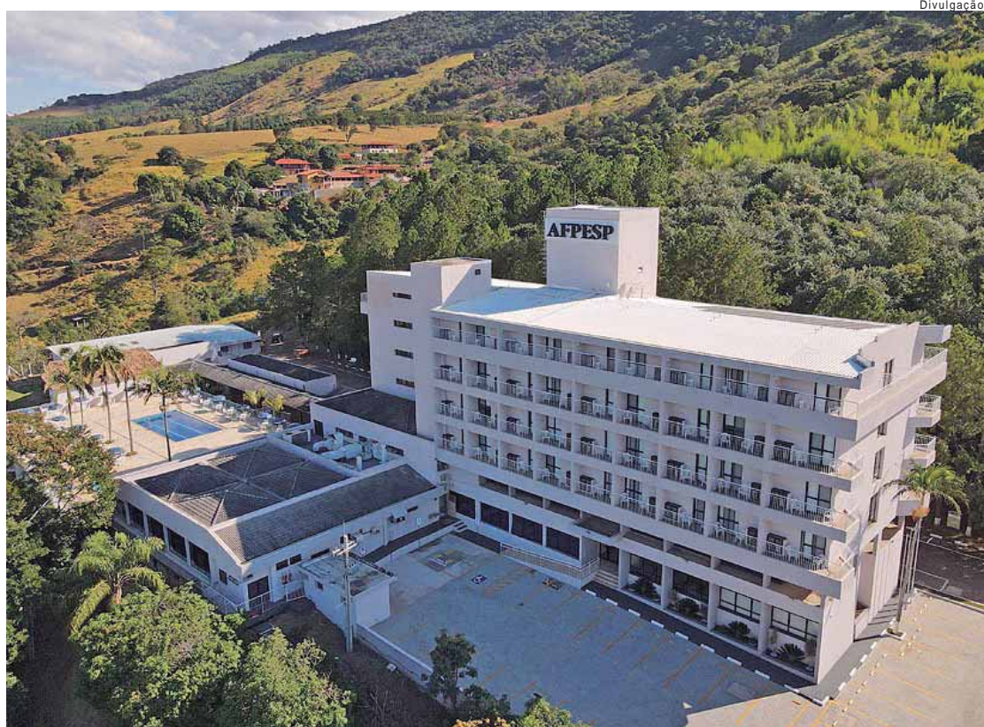
A cidade de São Pedro conta com uma unidade de lazer da Associação dos Funcionários Públicos do Estado de São Paulo (AFPEPSP)

Para o presidente da AFPEPSP, longe de ser apenas motivo de polêmica e preocupação para alguns setores de atividade, os feriados devem ser encarados também como oportunidades para impulsionar a economia e melhorar o quadro psicoemocional dos brasileiros. "A conciliação entre descanso, lazer e trabalho é um sinal de maturidade de uma sociedade que valoriza seus cidadãos", afirma.