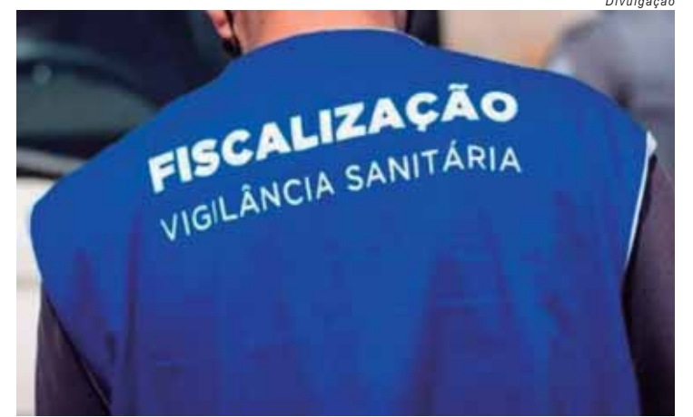
A fiscalização sem essa autorização é ilegal e considerada crime

O problema persistirá se a polícia e o Ministério Público do Estado de São Paulo forem corruptos. Fiquem atentos e denunciem.