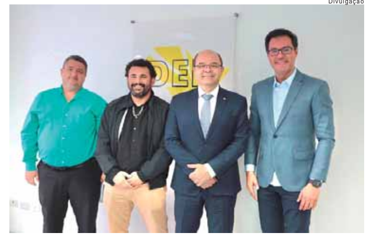
O encontro aconteceu na quarta-feira (8) no Departamento de Estradas de Rodagem (DER)