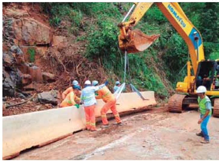
Rodovia teve trechos destruídos por fortes chuvas em dezembro, entre Torrinhã e Santa Maria da Serra