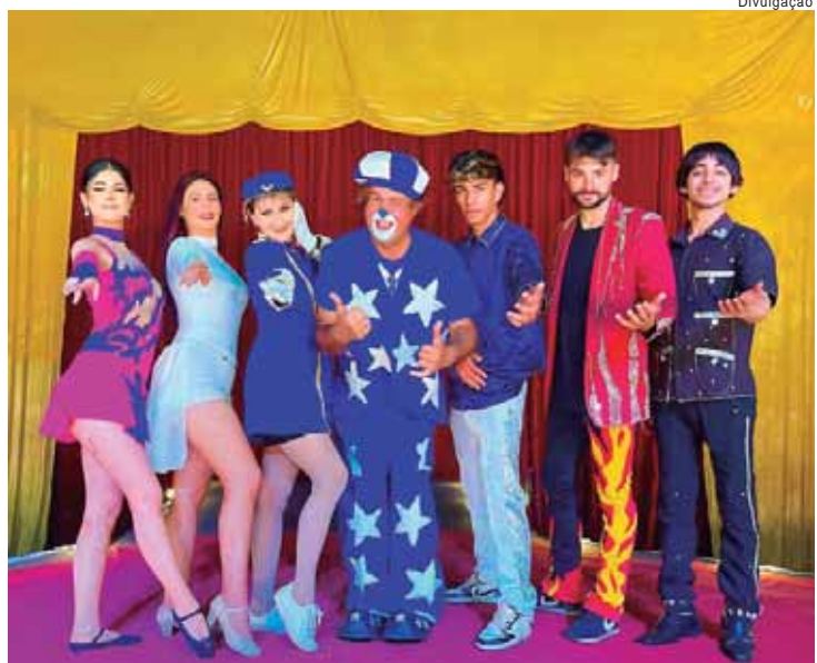
Em curta temporada, o espetáculo, de 1h30, traz apresentações de mágica, malabares, globo da morte, trapezista, palhaços, bambolé, balé e mais

Ingresso: R$ 10 / Meia entrada: R$ 5 @circosensacional / @gauchanice7