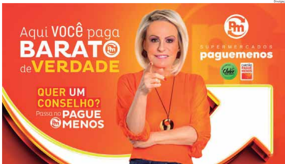
O Clube Leve Mais é um diferencial pensado para recompensar a fidelidade dos consumidores

O Clube Leve Mais é um diferencial pensado para recompensar a fidelidade dos consumidores. Por meio dele, os Clientes têm acesso a ofertas personalizadas e descontos exclusivos em produtos