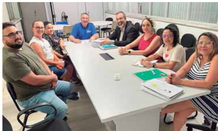
Reunião com o Conselho Municipal de Saúde