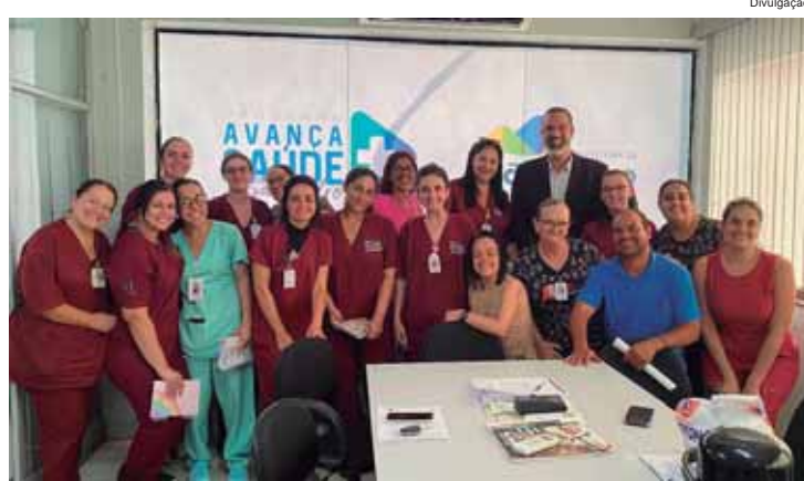
Reunião com equipes de enfermagem da Atenção Básica

ENFERMEIROS - Na quarta-feira, a reunião foi com os enfermeiros da rede de Atenção Básica e as equipes da Vigilância Epidemiológica e Controle de Endemias. A reunião mensal faz parte da rotina das equipes para afinar o funcionamento de atividades nas unidades e o secretário ouviu todas as informações e colocou-se a disposição da equipe.