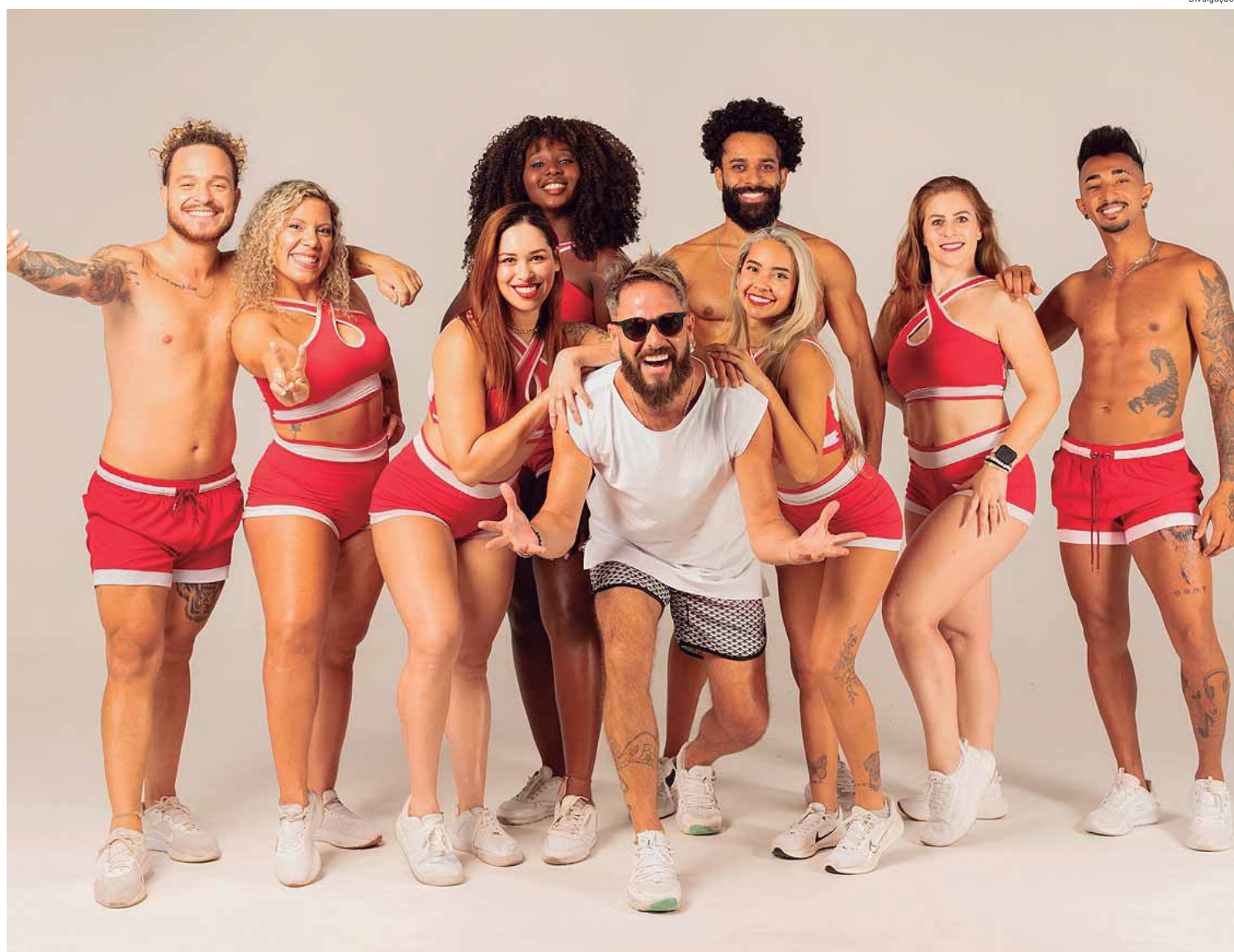
Últimos ingressos do festival que celebra os 25 anos do grupo estão disponíveis nos canais de venda

Na Onda Festival - Axé 40° Data: 25 e 26 de janeiro Horário: das 9h30 às 17h Ingressos: Adulto (a partir de 12 anos): R$ 99,99 / Teen (de 7 a 11 anos): R$ 59,99 / Kid (de 1 a 6 anos): R$ 34,99 Endereço: O Thermas de São Pedro fica na Rodovia Geraldo de Barros - SP 304 - Km 189 - Fazenda Limoeiro, São Pedro (SP). Mais informações pelos números 4000-2998 (sem DDD), (19) 3112-3388, (19) 3181-2111, (19) 3481-0900 ou site.