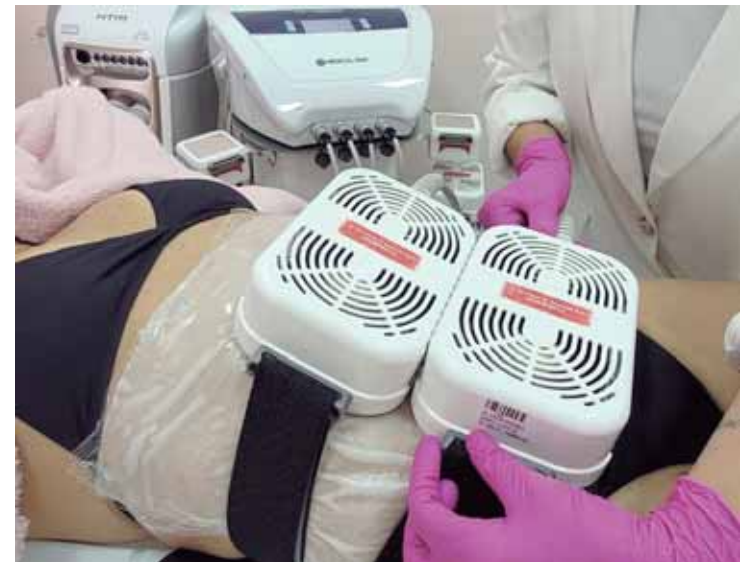
O programa de harmonização facial e corporal é feito com o aparelho de criolipólise que utiliza temperaturas baixas para congelar a gordura