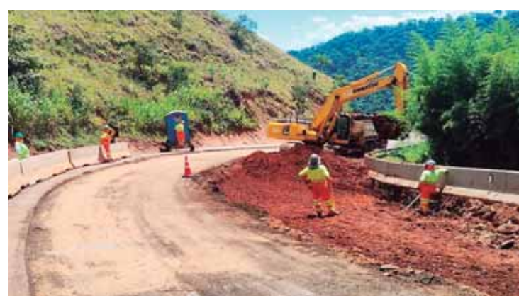
Restauração da estrutura é mais uma etapa no cronograma de recuperação do trecho entre Torrinhã e Santa Maria da Serra