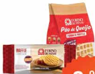
Pão de Queijo Waffle Forno Minas 200g ou Waffle Forno Minas 280g Sabores