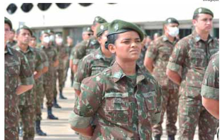
Forças Armadas oferecem 1.465 vagas para mulheres que completam 18 anos em 2025

MULHERES NAS FORÇAS - As Forças Armadas têm atualmente 37 mil mulheres, cerca de 10% do efetivo. Atualmente, as mulheres atuam principalmente nas áreas de saúde, ensino e logística ou têm acesso à área combatente por meio de cursos específicos em estabelecimentos de ensino, como o Colégio Naval, da Marinha, a Escola Preparatória de Cadetes do Exército e a Escola Preparatória de Cadetes do Ar, da Aeronáutica.