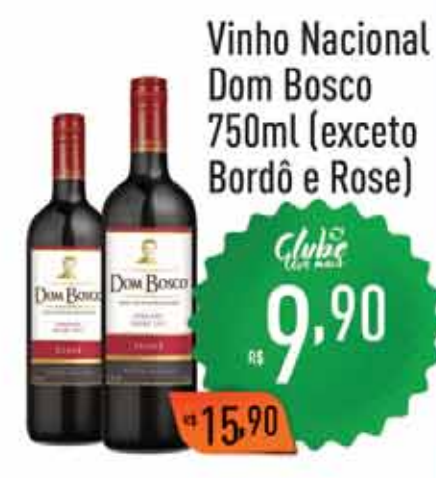
Vinho Nacional Dom Bosco 750ml (exceto Bordô e Rose)