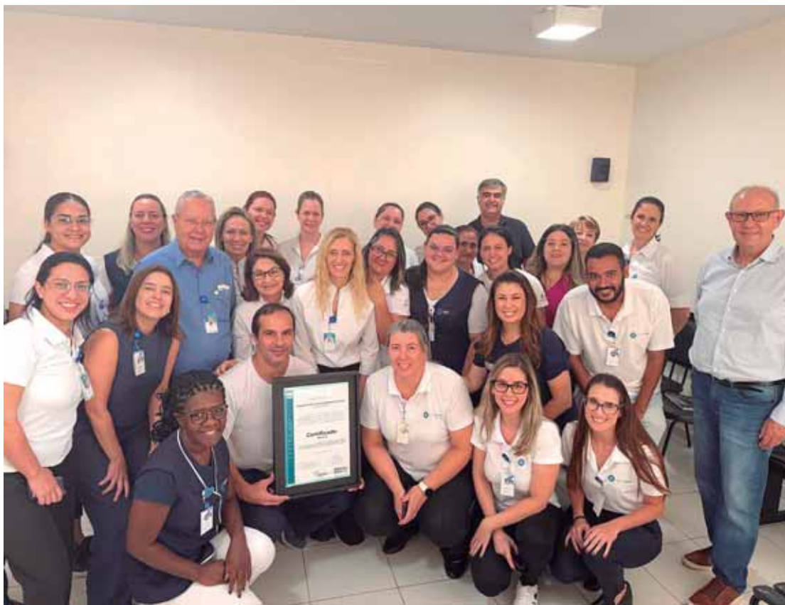
Equipe recebe certificação da Escola Ocra Brasileira

Ao longo desses anos, o hospital investiu em treinamentos, equipamentos e na adaptação de seus processos de acordo com a ferramenta ergonômica Mapho qual é referendada por esta ISO, sempre com o objetivo de garantir a movimentação segura de todos os pacientes, junto com os colaboradores. "A jornada foi desafiadora, mas os resultados foram recompensadores. A redução de incidentes, a melhoria nas condições de trabalho dos colaboradores e a publica-