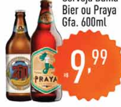
Cerveja Dama Bier ou Praya Gfa. 600ml