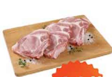
Bisteca Suína LeveMais Kg