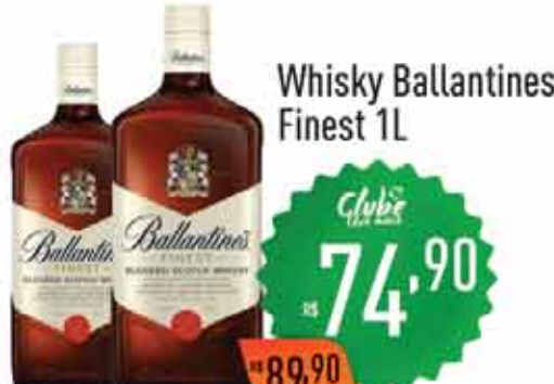
Whisky Ballantines Finest 1L