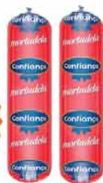
Mortadela Seara Confiança 1Kg