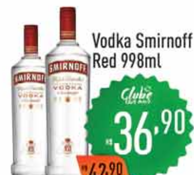
Vodka Smirnoff Red 998ml