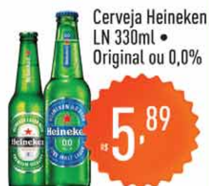
Cerveja Heineken LN 330ml • Original ou 0,0%