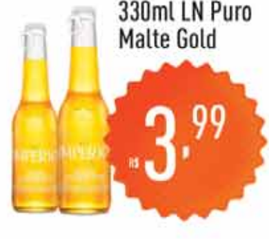
Cerveja Imperio 330ml LN Puro Malte Gold