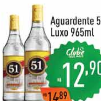
Aguardente 51 Luxo 965ml