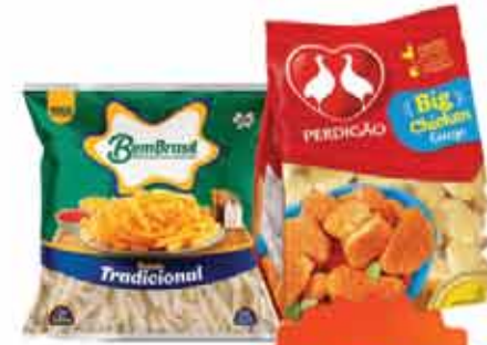
Batata Palito Bem Brasil Trad. Cong 1,5 kg Ou Big Chicken Perdigão 1Kg