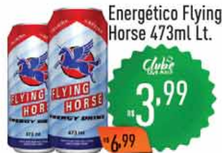
Energético Flying Horse 473ml Lt.