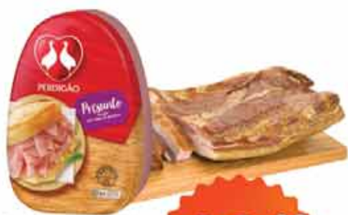
Bacon Def M M Kg ou Ling. Calabresa Perdigão Def Kg ou Presunto Perdigão Kg