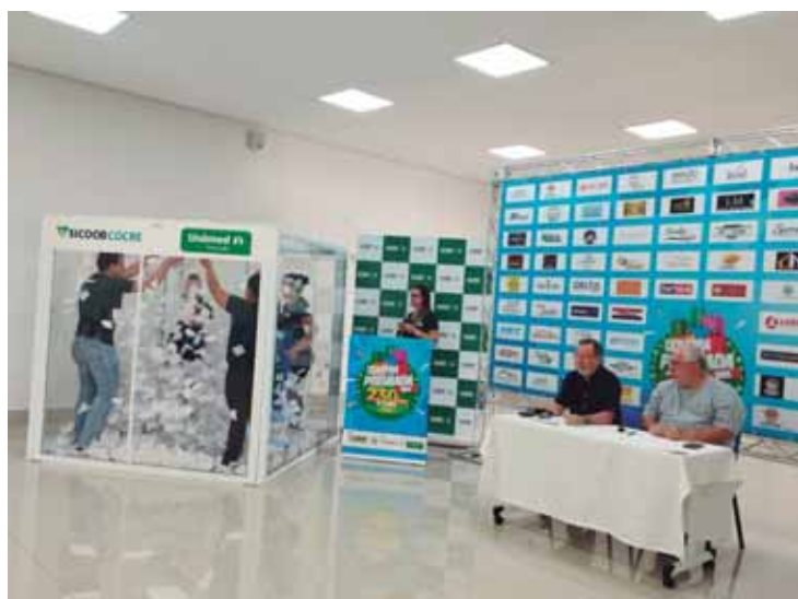
Natal da Compra Premiada fará 45 ganhadores com transmissão ao vivo