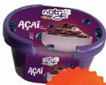
Açaí Nuty 1L Guarana