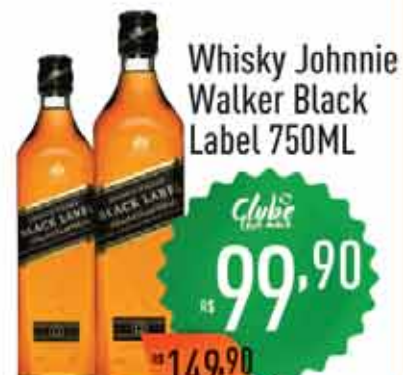
Whisky Johnnie Walker Black Label 750ML