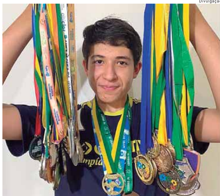
Obmep é a maior competição científica do país e neste ano voltada a alunos do 6º ano do Ensino Fundamental até último ano do Ensino Médio

Alunos de escolas públicas e privadas serão premiados separadamente. Os estudantes de escolas públicas receberão 6,5 mil medalhas, sendo 500 de ouro, 1.500 de prata e 4.500 de bronze, e até 45 mil certificados de menção honrosa. Já os estudantes de instituições particulares receberão 1.950 medalhas: 150 de ouro, 450 de prata e 1.350 de bronze, e até 6 mil certificados de menção honrosa. Escolas, secretarias municipais de Educação e professores que se destacaram pelo desempenho dos alunos serão também contempladas.