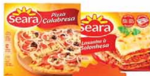
Pizza Seara 440G ou Lasanha Seara 600G