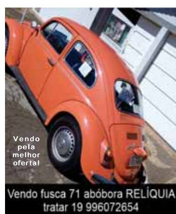
Vendo para melhor oferta! Vendo fusca 71 abóbora RELÍQUIA tratar 19 996072654