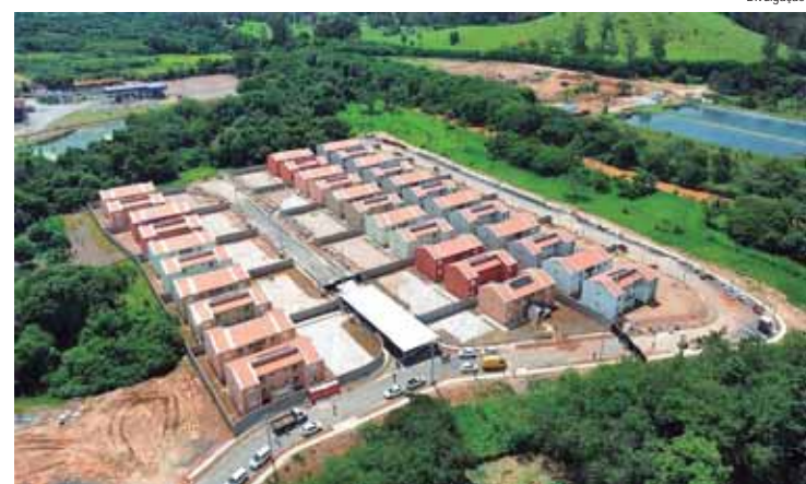
Empresas interessadas devem enviar propostas entre os dias 2 e 31 de janeiro de 2025