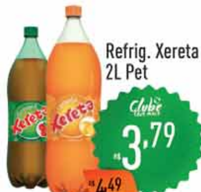
Refrig. Xereta 2L Pet