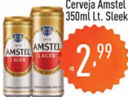
Cerveja Amstel 350ml Lt. Sleek