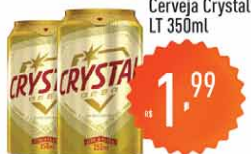
Cerveja Crystal LT 350ml