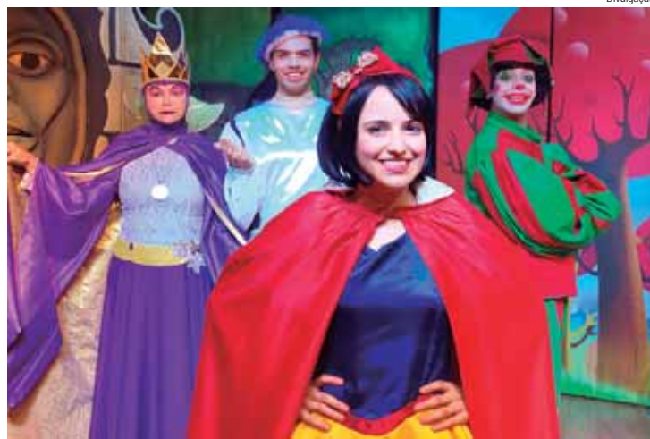
A intensa programação de janeiro inclui 19 espetáculos para as crianças, sempre às 15h, 11 shows de humor e dois musicais