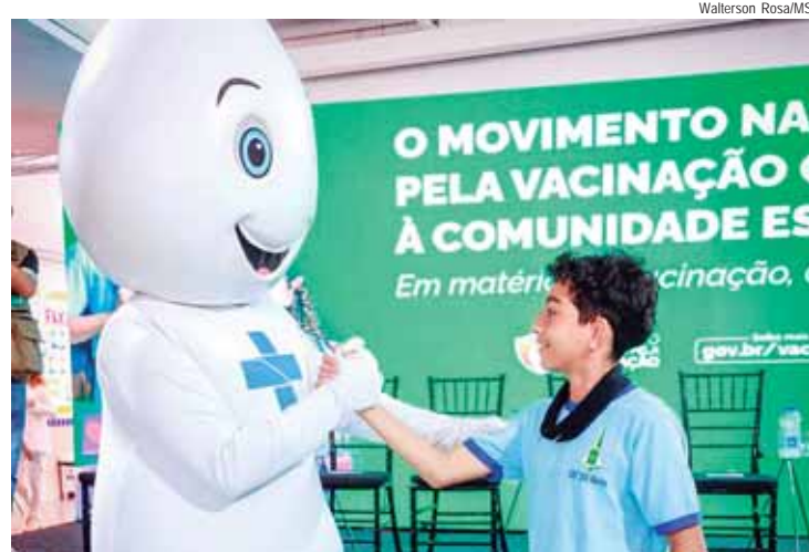
Zé Gotinha foi recuperado como um dos símbolos da importância da vacinação no país

ESTOQUES ABASTECIDOS — Em dezembro, o Ministério da Saúde enviou 100% da demanda de imunizantes apresentada pelos estados. Todas as vacinas do calendário básico estão com estoques abastecidos. Segundo o painel de distribuição, entre 2023 e 2024, foram enviadas mais de 604 milhões de doses a todos os estados. No caso