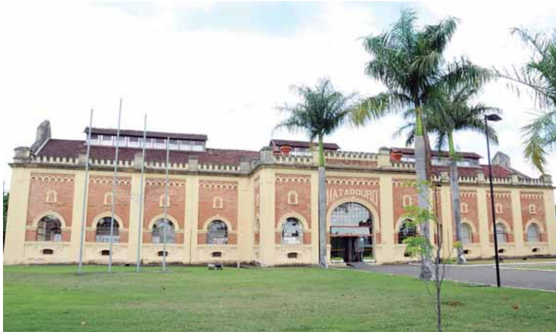
Atendimento ao público do Departamento de Obras Particulares vai para o prédio do antigo Matadouro

No novo espaço, os atendimentos serão de segunda a sexta-feira, das 8h30 às 16h30, sem necessidade de agendamento. O Departamento de Obras Particulares oferece serviços de recebimento e tramitação de processos; emissão de vistas e cópias de processos; esclarecimentos sobre avaliação de imóvel, vistoria de obra, consulta de custo, histórico do imóvel, certidão de numeração, pequenos reparos, registro profissional, retirada de obras, desdobra, unificação, croqui de desenho e certidão de uso e ocupação do solo.