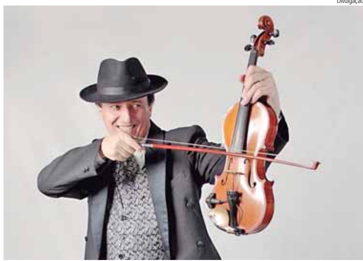
Músico apresenta obras musicais em versões únicas, shows acontecem no sábado e domingo, no restaurante Capitão Gancho