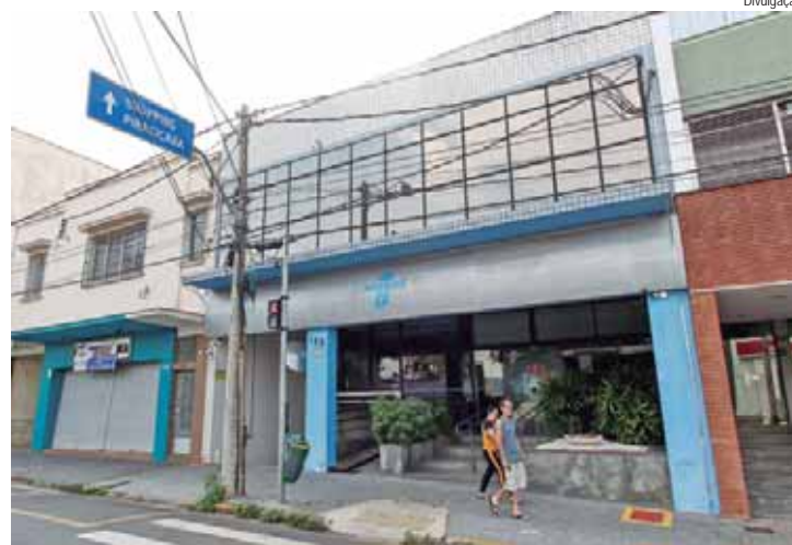
Além do Escritório Regional de Piracicaba, cidades da região somam 19 postos do Sebrae Aqui

Nessas unidades, assim como no Escritório Regional, o empreendedor tem à disposição serviços de orientações sobre abertura e desenvolvimento de empresas (MEI, ME e EPP), esclarecimentos sobre o processo de registro, regulamentação e serviços MEI, além de palestras, oficinas e cursos para quem já tem ou deseja ter uma empresa. Os postos também orientam os empresários sobre como acessar linhas de crédito, como elaborar um bom plano de