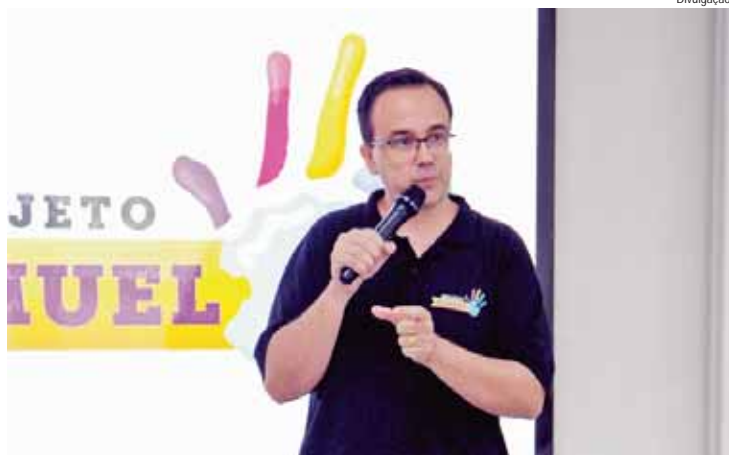
Evento é uma realização do Projeto Samuel em parceria com o Pecege e a Ong Gaia+