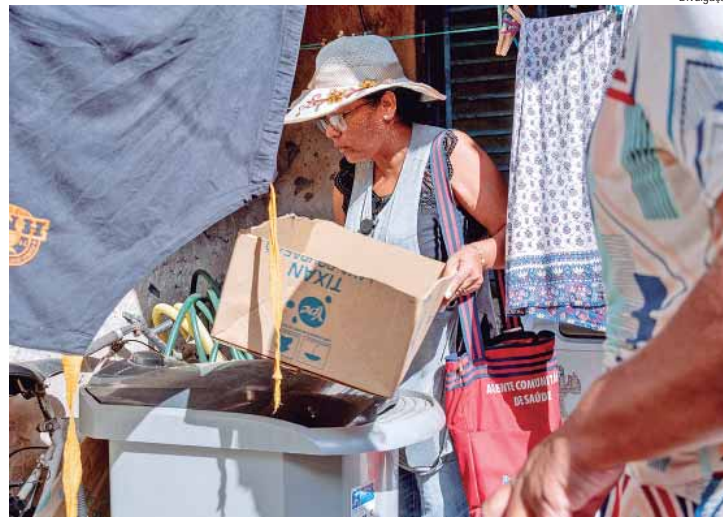
O mutirão acontecerá em Santa Terezinha neste sábado (25)

PREVENÇÃO – Alguns dos cuidados mais importantes para a prevenção da dengue são