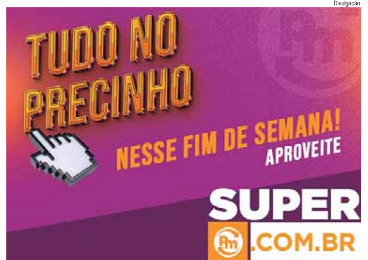
De 24 a 26 de janeiro, o cliente tem um encontro marcado com os melhores preços do e-commerce

A Rede de Supermercados Pague Menos reforça seu compromisso com a economia e a conveniência, especialmente em um momento do ano em que cada economia faz a diferença. Com descontos exclusivos, cupons vantajosos e uma experiência completa de compra, a campanha "Tudo no Precinho" é a oportunidade ideal para começar