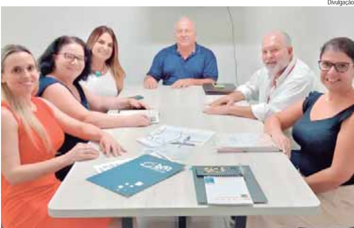
Apresentação da Sigemec para as equipes dos departamentos da Prefeitura de Saltinho

é possível emitir comunicados e orientações técnicas específicas para cada programa disponível, oferecendo informações detalhadas sobre o passo a passo para a solicitação de novos projetos e a prestação de contas de cada ação. O sistema também disponibiliza um canal exclusivo para suporte técnico relacionado aos projetos e programas disponíveis em plataformas federais, como a Plataforma +Brasil, FNS/SISMOB, SI-GARP, FNDE e MEC. Além disso, o Sigemec promove uma comunicação mais ágil e eficaz entre os técnicos municipais responsáveis pelos programas, dirigentes e diretores municipais, chefias e outros gestores. Por meio desse suporte integrado, os profissionais recebem informações e orientações técnicas de diversos programas e setores, proporcionando as condições necessárias