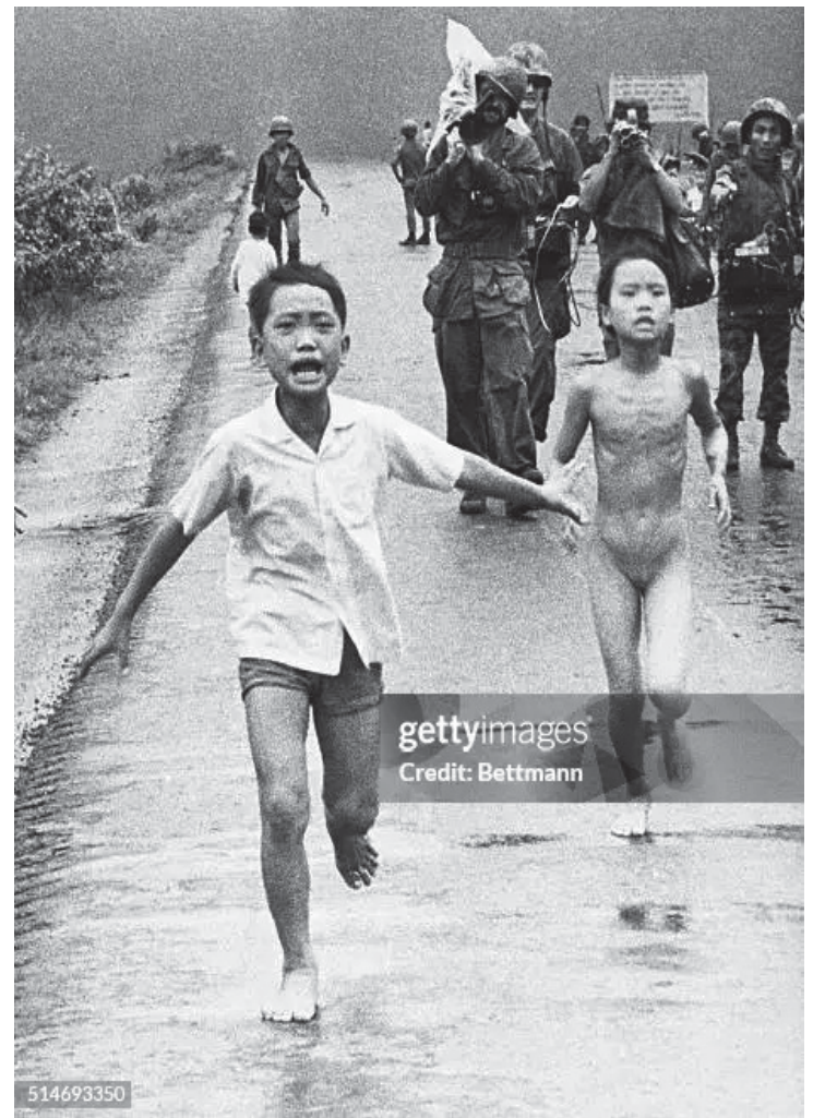
A foto que acabou com uma guerra

A contrapropaganda caracteriza-se como uma propaganda contra os interesses dos adversários e é amparada por técnicas tais como atacar os pontos fracos, assimilar as características do adversário, atacar e desconsiderar o adversário, jamais atacar quando a propaganda for muito forte e colocar a propaganda do adversário em contradição com os fatos. Do ponto de vista teórico, Domenach avança no conceito ao discutir que não existe réplica mais desconcertante que a suscitada pelos fatos.