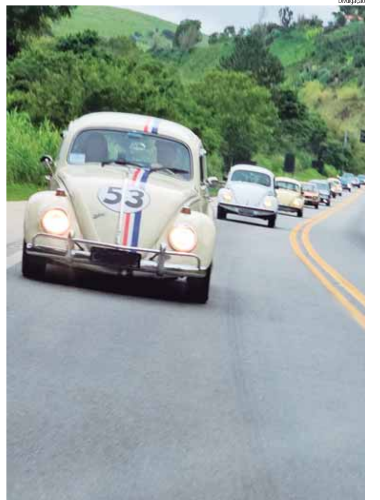
Encontro Fuscas por Aí no Complexo Dream Car