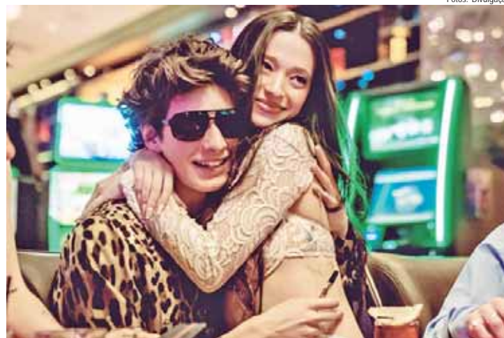
A elogiadíssima comédia dramática Anora mostra o envolvimento de uma profissional do sexo com o filho de um oligarca russo

"CONCLAVE" (Reino Unido/Estados Unidos, 2024) é um suspense político-religioso que acompanha um dos eventos mais secretos do mundo: a escolha de um novo Papa. Dirigido por Edward Berger e escrito por Peter Straughan, com base no romance de 2016 do autor Robert Harris. Na trama, o cardeal Thomas Lawrence (Ralph Fiennes) é encarregado de executar o processo secreto de escolha do novo pontífice após a morte inesperada do amado Papa. Uma vez que os líderes mais poderosos da Igreja