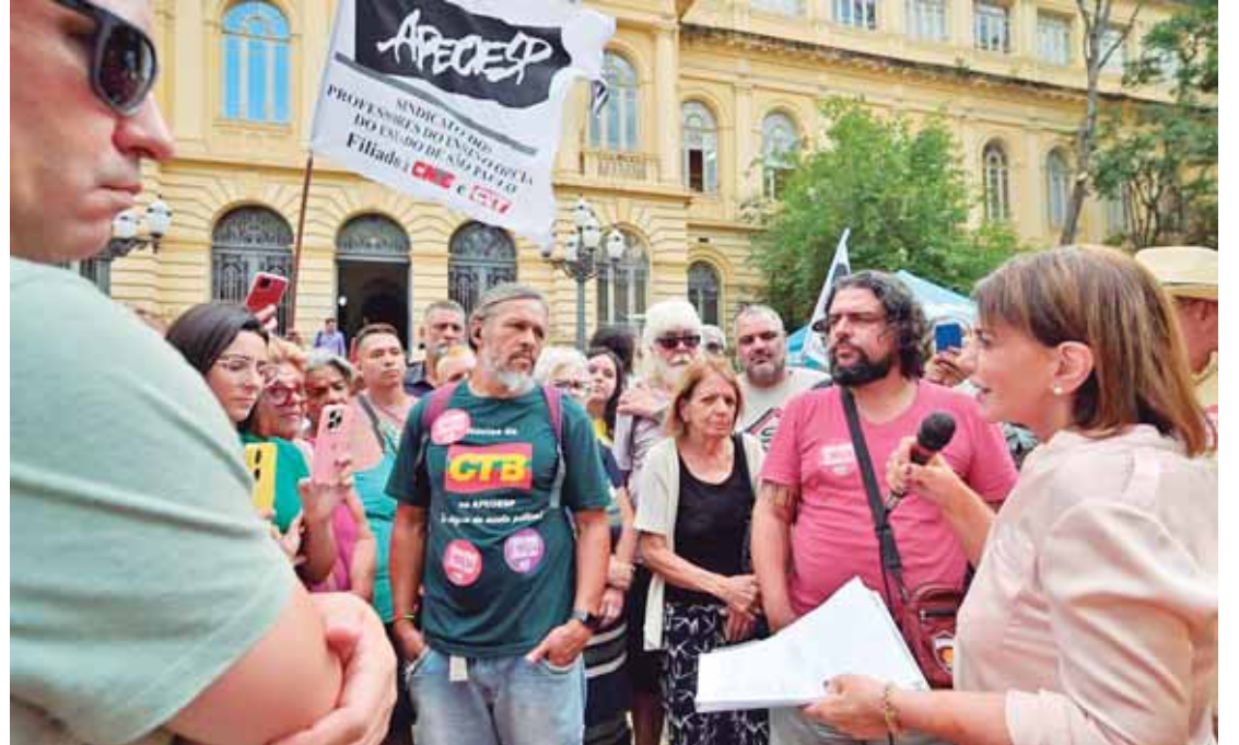
Bebel: é necessário intensificar a mobilização para garantir o respeito e a valorização