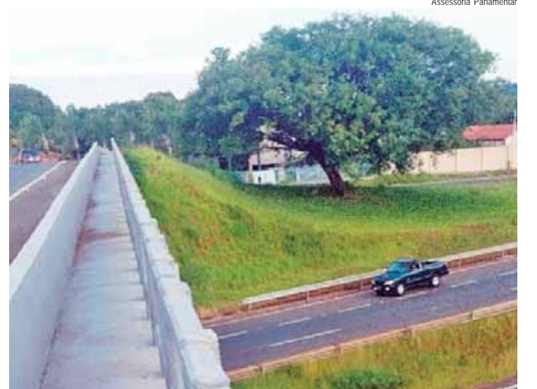
Pedido visa reforçar segurança no guarda-corpo para pedestres