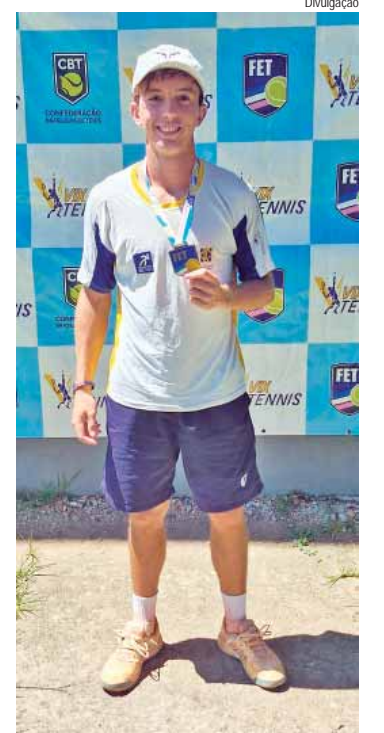
Tenista de Piracicaba brilha em campeonato nacional

Essa conquista representa um início de ano promissor para o jovem tenista, que demonstrou talento, dedicação e maturidade em cada partida. Além disso, o feito reforça a importância do CCP/CLQ no cenário nacional do tênis.