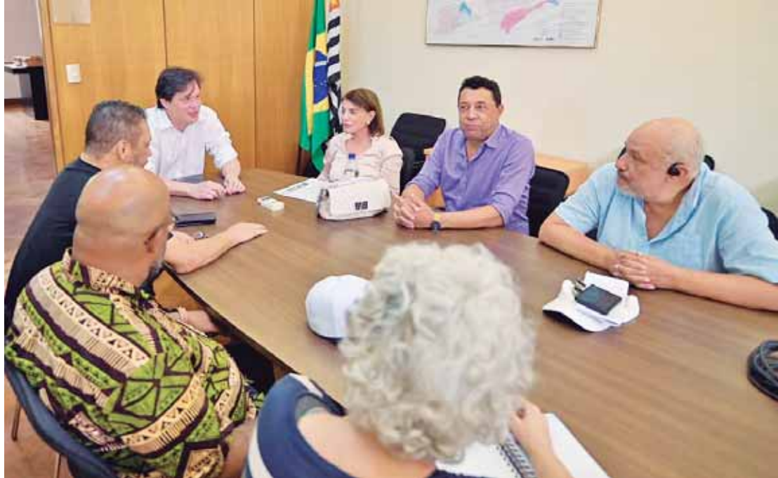
Apresentadas diversas demandas do magistério paulista pela Diretoria da Apeoesp