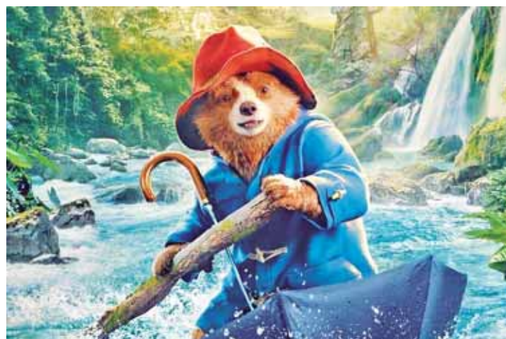
Com seu charme irresistível o pequeno e amado urso de casaco azul está de volta ao cinema com Paddington - Uma Aventura na Floresta