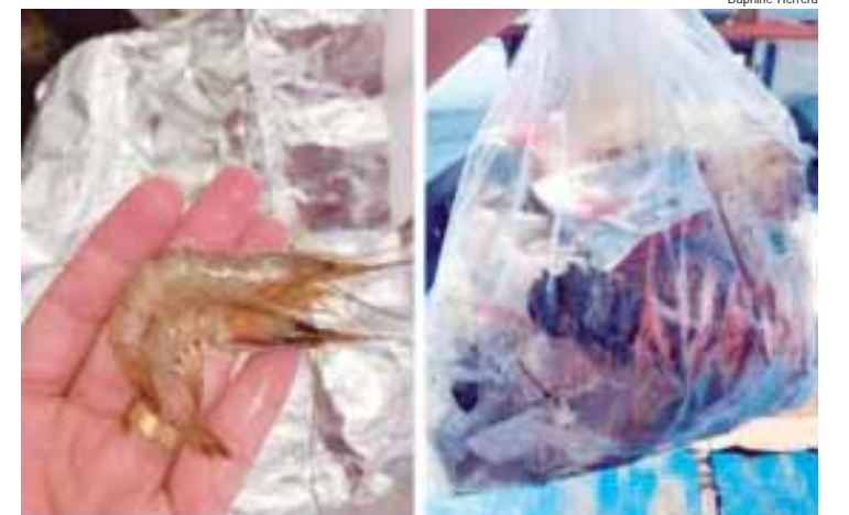
À esquerda, espécime de Xiphopenaeus kroyeri coletado no litoral paulista; à direita o lixo coletado com as amostras de pesquisa

O trabalho também inclui a análise da história evolutiva dessas espécies, com foco em ecossistemas de importância para a sua preservação, como manguezais, estuários e bacias hidrográficas. A integração entre as respostas geradas nesse estudo deve auxiliar na compreensão de aspectos de relevância ambiental e social, como conservação de espécies e de ecossistemas, além de tratar da qualidade de produtos que chegam ao consumidor.