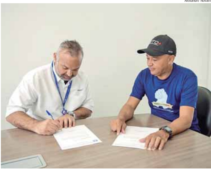
Sindicato protocolou ofício do benefício PLR