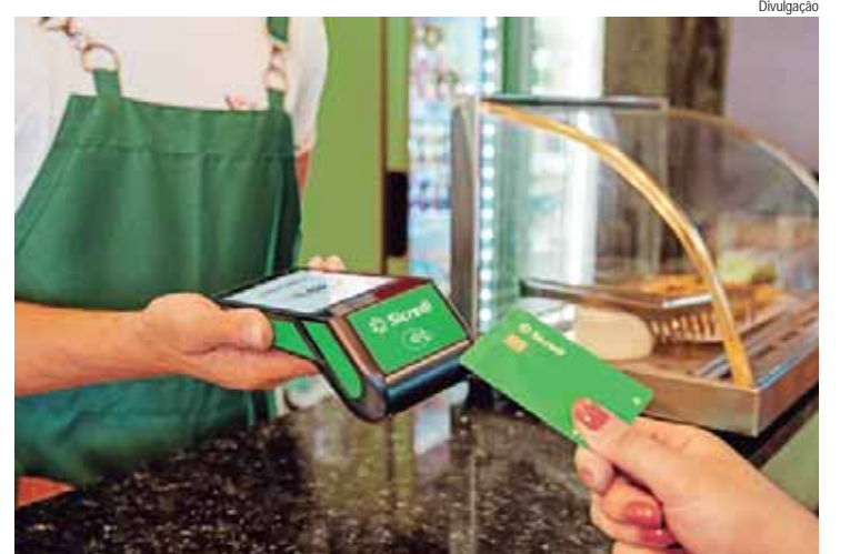
Maquininhas do Sicredi têm alta de 62,6% em transações durante o mês do Natal e registram quase R$ 5,5 bi em vendas

SICREDI - O Sicredi é uma instituição financeira cooperativa comprometida com o crescimento