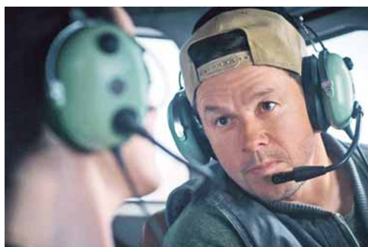
No suspense de alto risco Ameaça no Ar, dirigido por Mel Gibson, o ator Mark Wahlberg é um piloto de avião e assassino psicótico

Católica se deslocaram de todas as partes do mundo e estão trancados nos salões do Vaticano, Lawrence encontra-se no centro de uma conspiração e descobre um segredo capaz de abalar a própria fundação da Igreja. No site agregador de resenhas Rotten Tomatoes, o filme obteve uma aprovação de 93% dos críticos. O consenso do site diz: