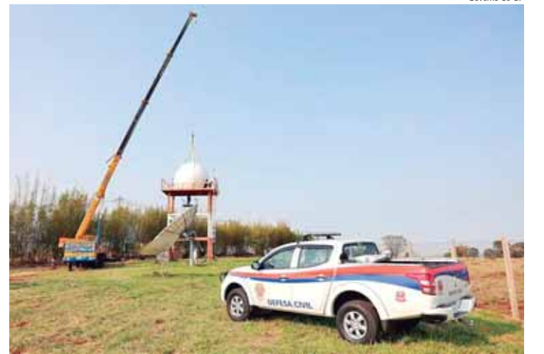
O novo Centro vai funcionar sob a gestão da Defesa Civil estadual e contará com apoio de profissionais dos institutos paulistas, como geólogos, hidrólogos e meteorologistas

"Temos planejado e trabalhado por essa integração desde o início da gestão do governador Tarcísio de Freitas. Esse foi um pedido direto dele. A integração entre a