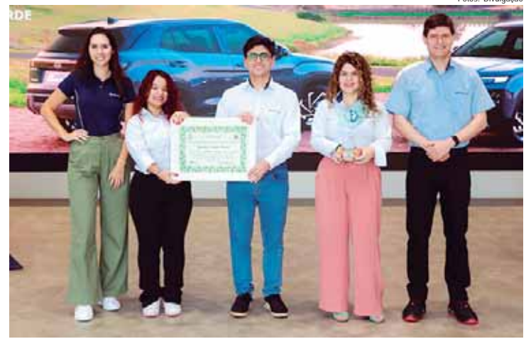
No último mês de 2024, a Hyundai também tornou-se a primeira montadora a vencer o Prêmio Socioambiental Chico Mendes