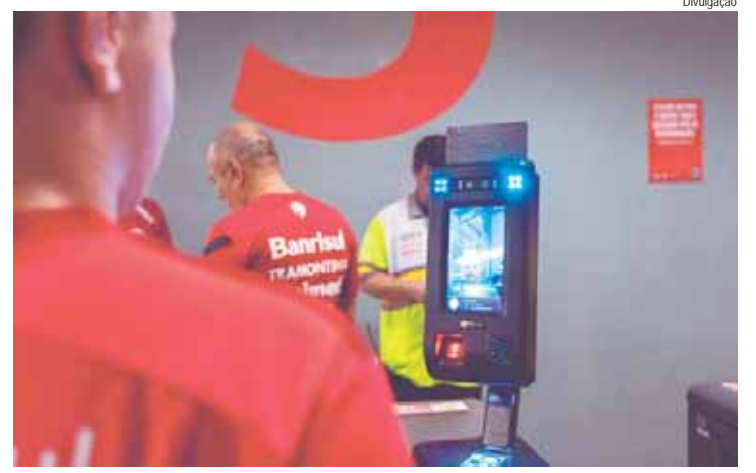
A tecnologia revoluciona os acessos aos aeroportos, estádios e shows

O coletivo já está em contato com os gabinetes da Câmara Municipal de São Paulo (CMSP) para que o projeto seja aprovado em breve. Com o vídeo publicado, a entidade conta com o apoio da sociedade civil organizada para transformar o projeto em realidade, através do compartilhamento do vídeo supracitado e da aproximação dos paulistanos com a Câmara Municipal.