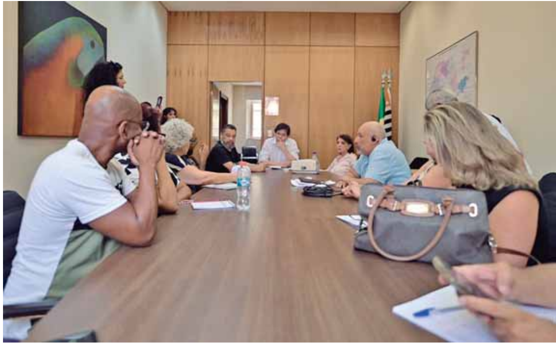
A reunião contou com a participação de diversos diretores da Apeoesp