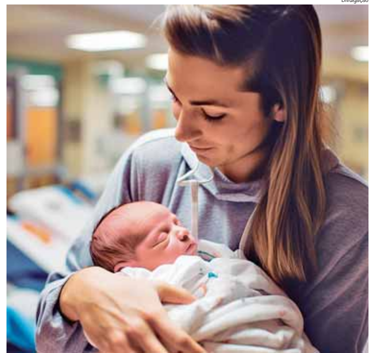
Opção por adiar a maternidade e dificuldade para engravidar são as principais causas dessa redução

Indicando para casais saudáveis, o lubrificante deve ser utilizado na região íntima (tanto do homem quanto da mulher) de 10 a 15