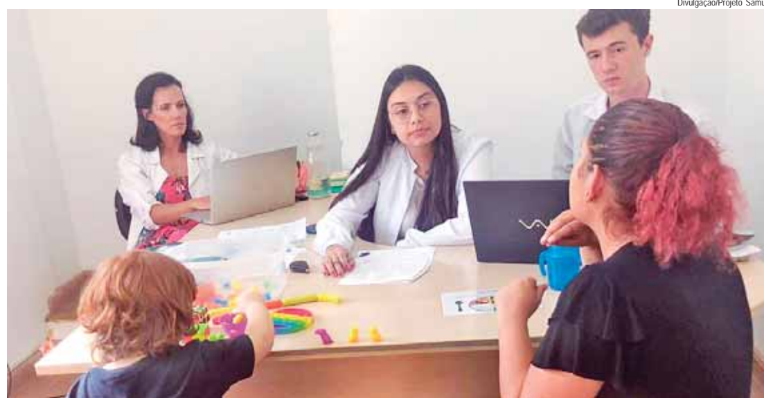
Iniciativa busca conscientização e tratamento adequado de crianças com Transtorno do Espectro Autista (TEA)