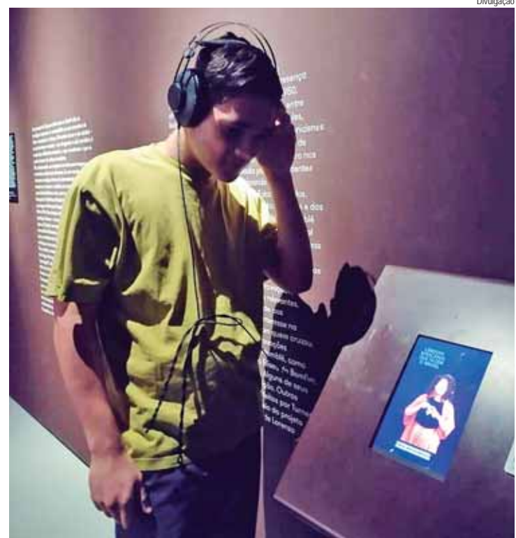
Jovens da Fundação Casa de Campinas exploram riqueza e história da língua portuguesa

Só em 1980, surgiu a cura para a doença, que deixou de ser chamada de lepra e passou a ser chamada de hanseníase. O tratamento é feito por meio da poliquimioterapia (PQT), uma espécie de coquetel de medicamentos que, além de curar, interrompe a transmissão e previne as deformidades. Foi neste período que os pacientes deixaram de ser isolados e a sociedade passou a conviver melhor com as pessoas em tratamento.