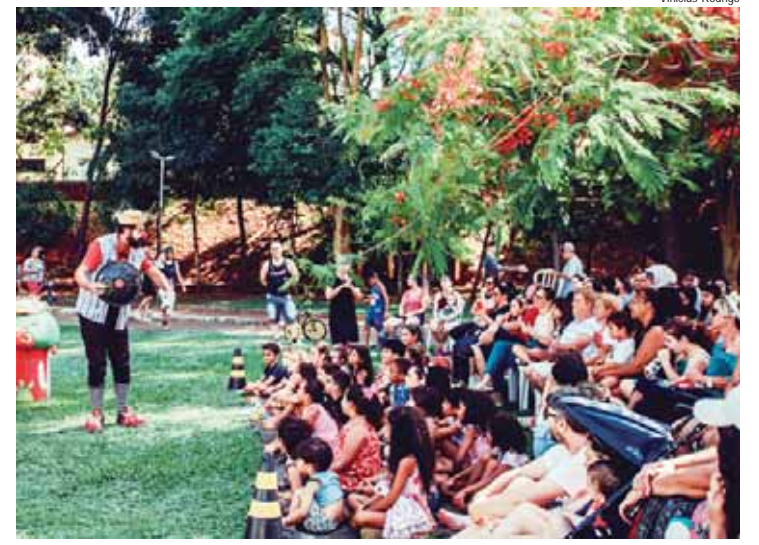
Kombi no Circo encanta crianças e adultos com a arte circense

Questionado pela A Tribuna Piracicabana e TV Metropolitana, o Centro de Comunicação Social da Prefeitura de Piracicaba e também o Pelotão Ambiental, até o fechamento dessa edição não se manifestaram sobre o ocorrido.