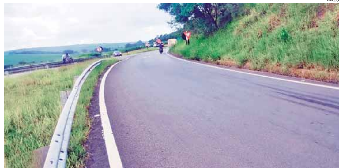
Bloqueio acontece no dispositivo do km 150, no sentido Salto

As obras contam com aprovação da Agência de Transportes do Estado de São Paulo (Artesp) e da Polícia Militar Rodoviária (PMR). Toda a movimentação