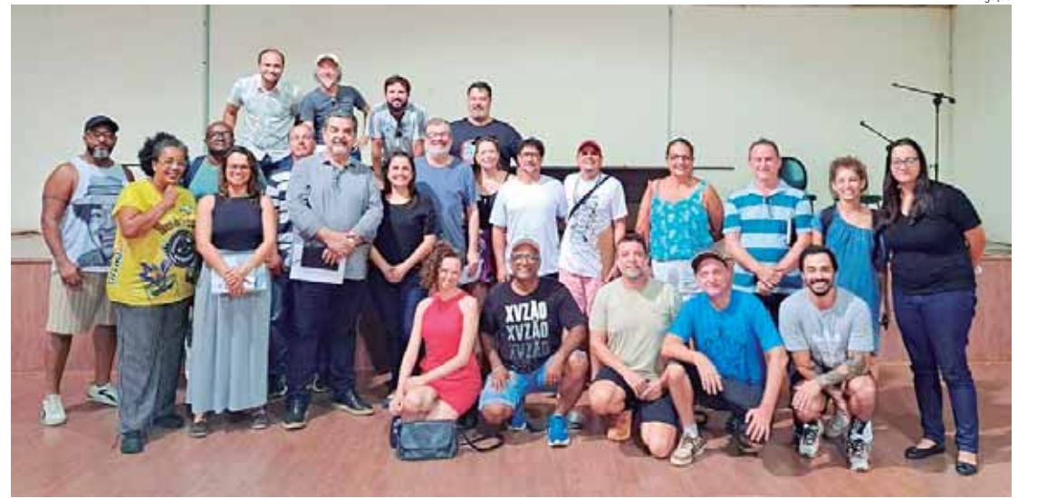
O encontro serviu para discutir questões relativas ao Carnaval 2025

Essa parceria entre os Coletivos de Cordões e Blocos de Carnaval e a Piracerva nasce com os objetivos de valorizar a cultura do carnaval, que já foi tão importante para a cultura da cidade e que há 15 anos tem retomado o seu valor através dos blocos e cordões de car-