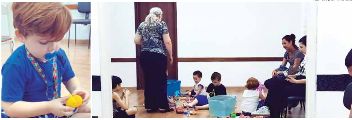
O diagnóstico precoce e o tratamento adequado são fundamentais para o desenvolvimento saudável de crianças com TEA