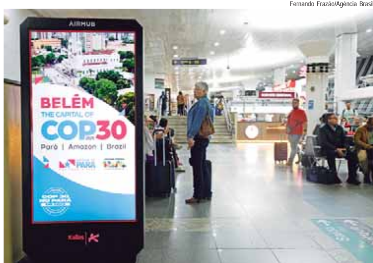
Propaganda da COP 30 no saguão de embarque do Aeroporto Internacional de Belém.

Uma delegação com 24 especialistas de alto nível da Organização das Nações Unidas (ONU), está em Belém, no estado do Pará, em missão para acompanhar os preparativos para a 30ª Conferência da sobre Mudança do Clima (COP30), que será realizada entre os dias 10 e 21 de novembro.