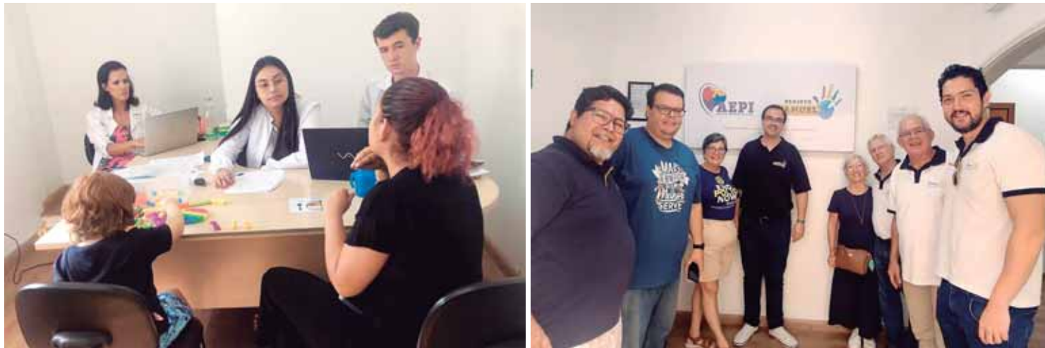
Foram doados aparelho de ar condicionado, câmeras de segurança, brinquedos sensoriais e balanças digitais