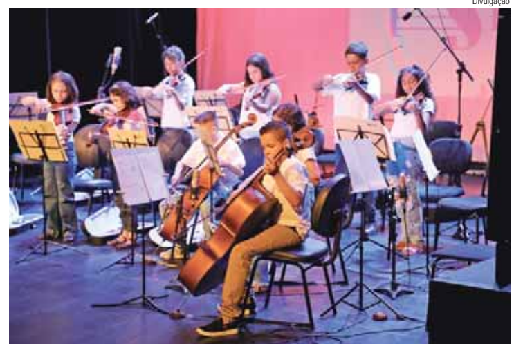
Na unidade de Piracicaba, as oportunidades são para aulas de cordas friccionadas

Os cursos de cordas friccionadas acontecem nas unidades Sesi A. E. Carvalho, Araras, Bau-