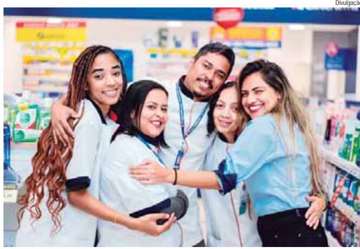
Programa inovador democratiza acesso à educação para time de colaboradores e seus dependentes