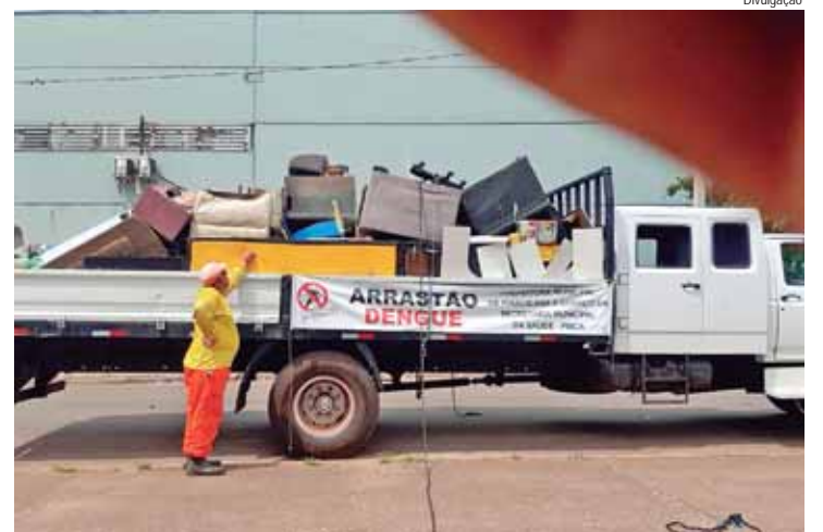
O arrastão recolheu 6,3 toneladas de inservíveis em oito bairros

Para denunciar imóveis abandonados ou locais que tenham possíveis criadouros da dengue basta registrar solicitação no SIP 156 e outras orientações no PMCA pelo telefone (19) 3427-3351.