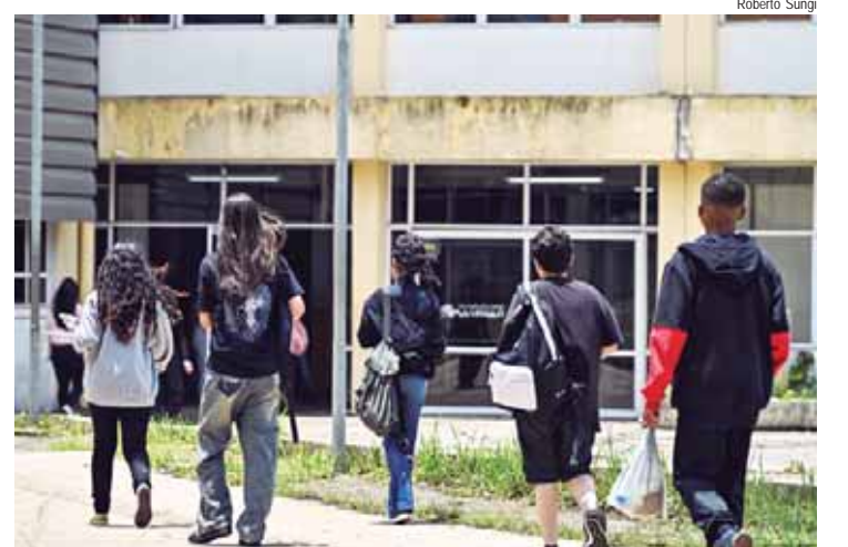
Etecs fazem a segunda convocação para matrículas nesta quarta-feira, 22, por e-mail e SMS

Para os cursos de Especialização Técnica de Nível Médio: Documento de identidade (RG) ou Carteira de Registro Nacional Migratório (CRNM) ou Carteira Nacional de Habilitação (CNH); CPF ou documento que contenha esse número; Uma foto 3x4 recente, com fundo neutro; Histórico Escolar com Certificado de Conclusão de Curso Técnico equivalente ao curso escolhido conforme lista disponível no site vestibulinhoetec.com.br. Também