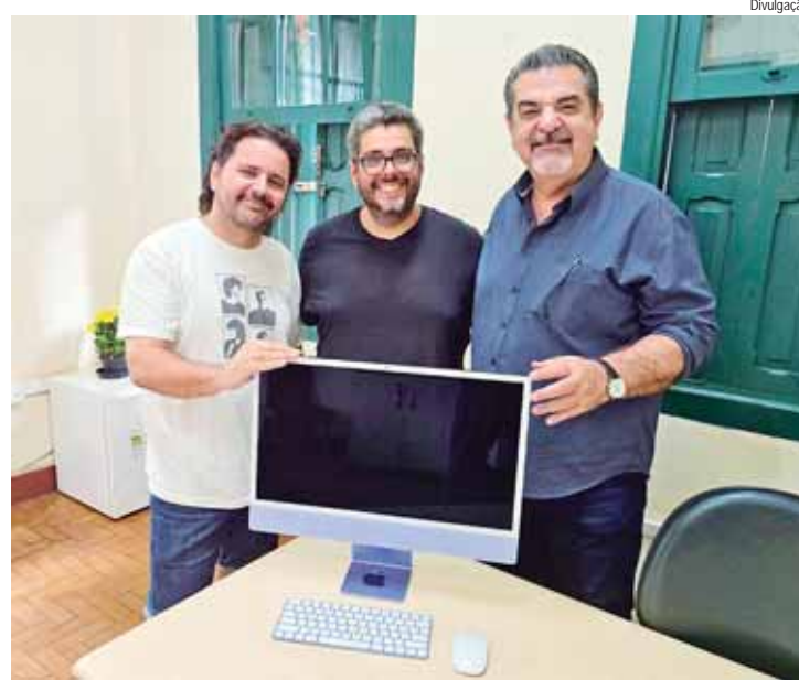
Presidente da AHA entrega equipamento para fortalecer Centro de Humor

O computador será fundamental para as ações do Salão de Humor em 2025, cujo calendário inclui a exposição, Batom, Lápis & O Que Elas Quiserem, prevista para março, e outras atividades que visam promover o humor gráfico como expressão artística e cultural. A doação reflete a parceria e o compromisso da AHA com a valorização do CEDHU e arte gráfica em Piracicaba.