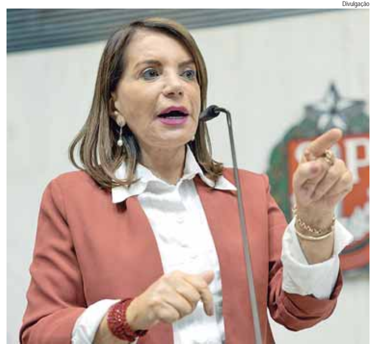
Bebel diz que o atual governo tem como política de ensino o fechamento de salas do noturno, a aglutinação de salas de aula e o encerramento do EJA

Para Bebel, "é intolerável que assistamos calados qualquer política de desmonte da educação pública em nosso estado. O que se vê em demasia é que o atual governo tem como política de ensino o fechamento de salas do noturno, a aglutinação de salas de aula, o encerramento do EJA, e, quando pensa em algo, pensa logo em militarizar as escolas, e isso é inaceitável. O projeto que ora apresento se preocupa com os estudantes, e quer que eles sejam ouvidos, e, se após