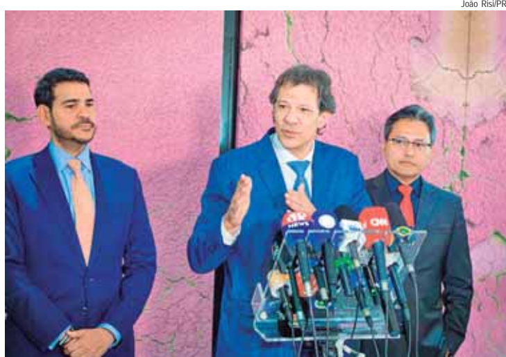
O ministro da Fazenda, Fernando Haddad, explicou que a Medida Provisória reforça a gratuidade do uso do Pix e todas as cláusulas de sigilo bancário em torno do método