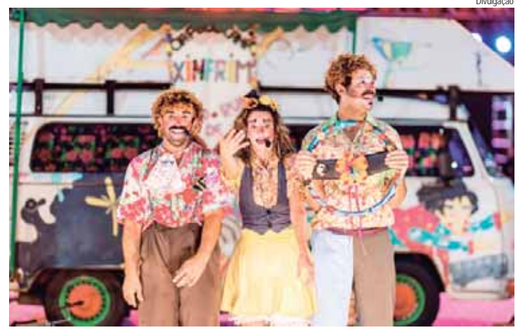
Inspirado na vida itinerante dos artistas mambembes Cia Pé de Cana apresenta Xinfirim

Vistoria de vans escolares. De segunda a sexta, das 13h às 15h, de 20 a 31/01, na rua Juçeli Aparecida Sacaro, 313, bairro Jardim Califórnia. Não é necessário agendar. Informações sobre os veículos autorizados podem ser consultadas no site: piracicaba.sp.gov.br/servicos/veiculos-escolares-autorizados/ . Mais informações podem ser consultadas na página da Semuttran, no link piracicaba.sp.gov.br/servicos/? , botão Mobilidade Urbana e depois Transporte Escolar.