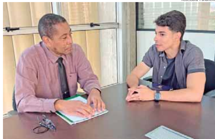
Gesiel de Madureira fez visita institucional ao corregedor-geral do Município, Haroldo Amaral, na manhã desta quarta-feira (15)

"Essa visita reforça meu compromisso com a transparência e com o aprimoramento da administração pública em Piracicaba. Tenho me dedicado a conhecer melhor as diversas áreas do município para, assim, desempenhar um papel ainda mais atuante e colaborativo como representante da população", comentou o parlamentar.