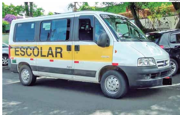
Vistoria de vans escolares começa na segunda, 20, e segue até o dia 31

PROCEDIMENTOS PARA A VISTORIA - As vistorias são realizadas pela Secretaria Municipal de Segurança Pública, Trânsito e Transportes, na rua Juçeli Aparecida Sacaro, 313, bairro Jardim Califórnia, de segunda a sexta-feira, das 13h às 15h. Não é necessário agendar. Os veículos devem ser apresentados devidamente padronizados para este serviço confor-