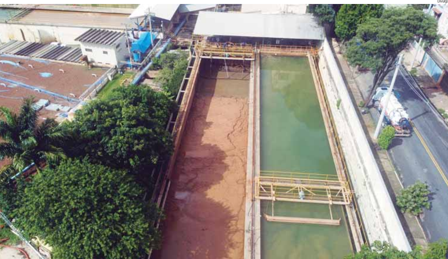
Um dos tanques da ETA Luiz de Queiroz, que estava lotado de lodo, já foi limpo e o outro está em fase final

(CCZ), da Secretaria Municipal de Saúde, realizarão mais um arrastão e mutirão da dengue no próximo sábado (18).