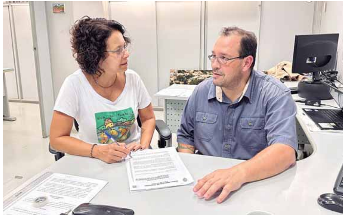
Equipe do Mandato Coletivo protocolou o requerimento nesta quinta-feira (16)

O Mandato Coletivo também pergunta qual ação específica será adotada imediatamente para sanar