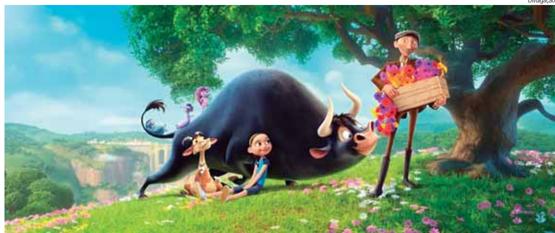
A animação O Touro Ferdinando é a atração do Cine Céu

Com infraestrutura alimentada por energia solar, o Cine Céu reafirma o compromisso com a sustentabilidade. Placas solares instaladas em um caminhão adaptado geram toda a energia necessária para as projeções, permitindo