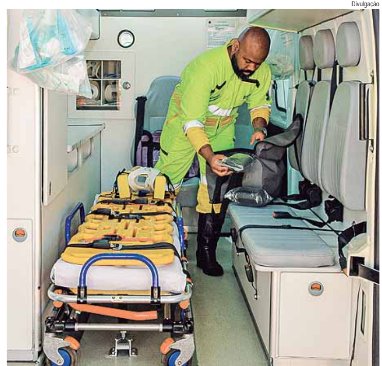
Inspeção de tráfego, socorro mecânico e apoio por guincho foram os serviços mais solicitados ao longo do ano em 1,2 mil km de malha

almente simulados de produtos perigosos, com o intuito de reforçar, de maneira prática, os protocolos de segurança e as ações para resposta rápida a emergências. Esses simulados envolvem toda a equipe operacional, assegurando que estejam totalmente capacitados para atuar com eficiência e segurança em situações críticas", acrescenta Raquel.