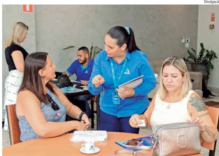
Aberto para empresas associadas e não associadas, o evento acontece na sede da Acipi, com o objetivo de impulsionar conexões comerciais