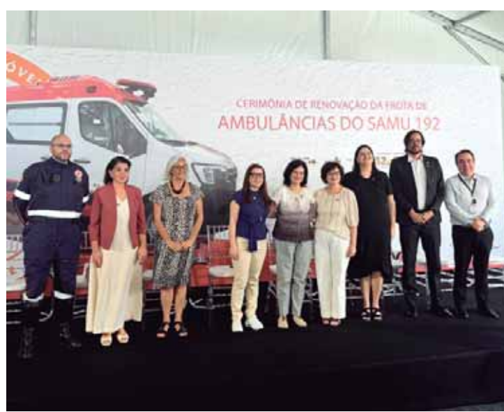
Bebel na solenidade de entrega das ambulâncias, realizada em Sorocaba, pela ministra Nísia Trindade, representando o presidente Lula

ALINHAMENTO - A secretária e o secretário-executivo também se reuniram com diretores e coordenadores da secretaria no Anfiteatro da Secretaria, no último dia 11. O objetivo foi conhecer os servidores e alinhar as diretrizes e metas do Governo.