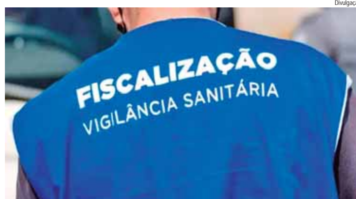
A fiscalização sem essa autorização é ilegal e considerada crime

O problema é sério, visto que falsos fiscais colocam risco a saúde da população, causam prejuízos financeiros às vítimas entre outros problemas.