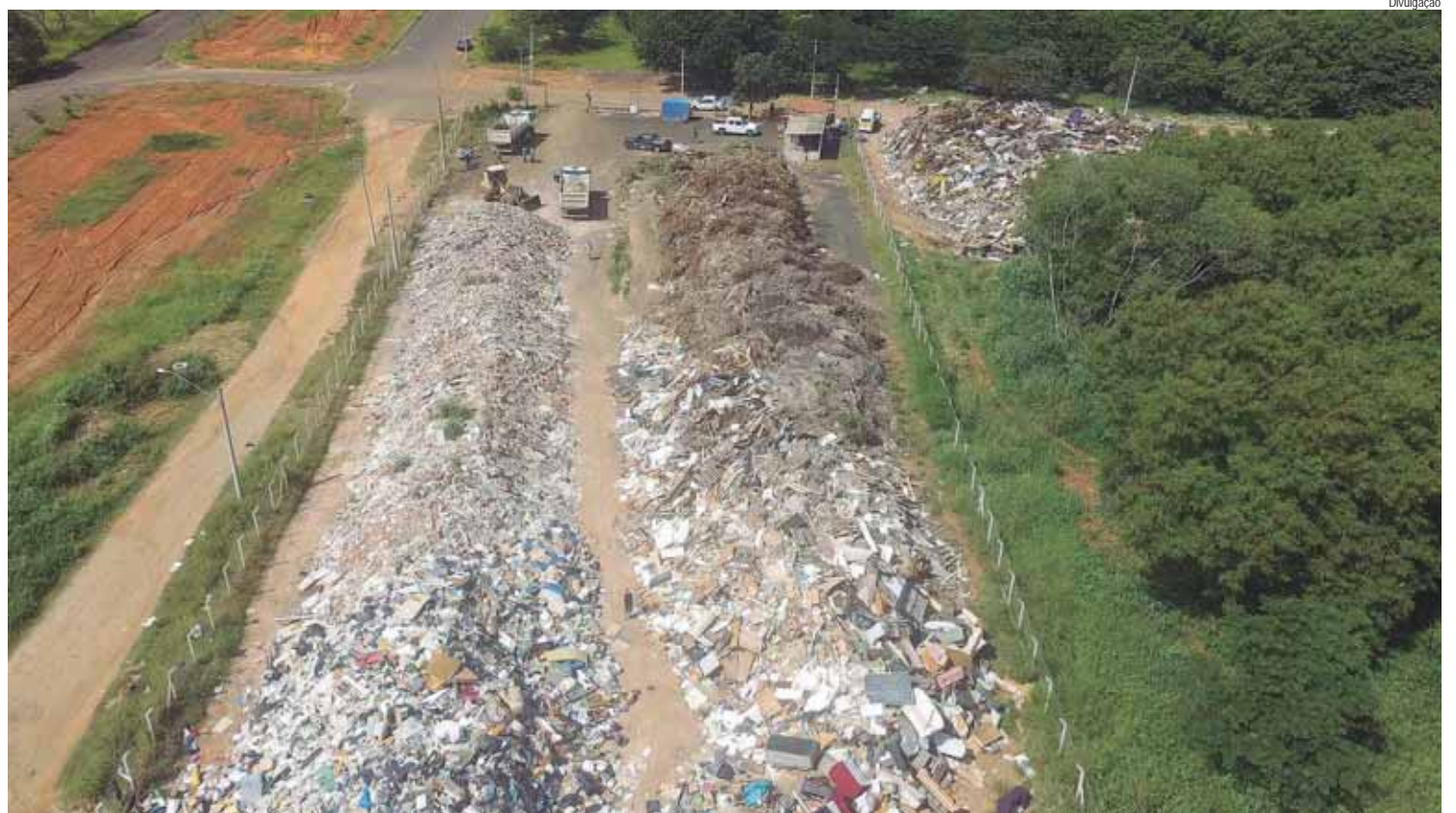
Ecoponto do Jardim Oriente foi um dos primeiros a receber a limpeza