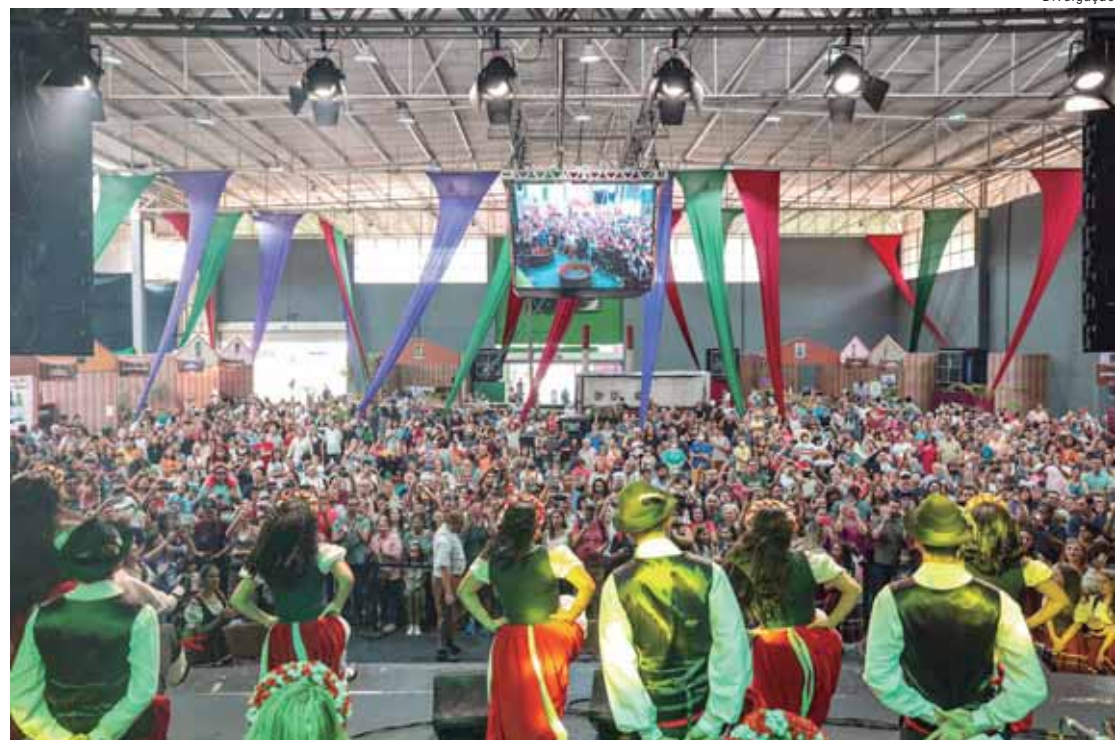
Em 2024, o evento recebeu quase 250 mil visitantes de todos os estados brasileiros

Onde tem uva, certamente tem vinho se estivermos falando de algumas propriedades de Jundiá. Essa produção é a base da Expo Vinhos que conta com diversos produtores de Jundiá. Quem visitar o espaço pode degustar dezenas de variedades de vinho - basta adquirir uma taça para poder visitar os expositores e provar vinhos e espumantes.