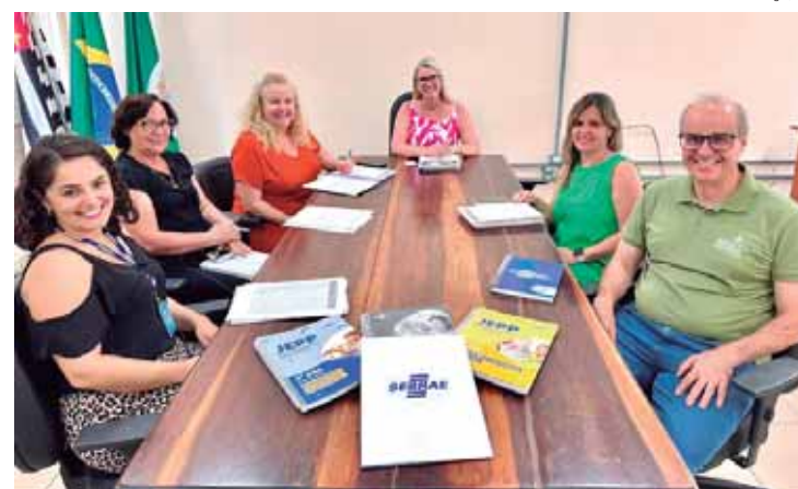
Encontro reuniu representantes da Secretaria Municipal de Educação e do Sebrae

PROGRAMA - Programa Jovens Empreendedores Primeiros Passos, alinhado à educação empreendedora, propõe atividades e a criação de projetos empreendedores que, de diferentes formas, trabalham a cultura local, a responsabilidade e a cidadania, buscando desenvolver atividades que envolvam