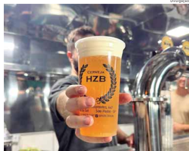
Tour visitará cervejarias HZB, na cidade vizinha, e Osteria Tirolesa

Com o tema férias, os dois próximos destinos da Rota Cervejeira de Piracicaba que serão percorridos no sábado, dia 18 de janeiro, serão as cervejarias HZB, na vizinha cidade de São Pedro, e a Osteria Tirolesa, que fabrica a cerveja Stella Alpina, no bucólico distrito de Santa Olímpia.