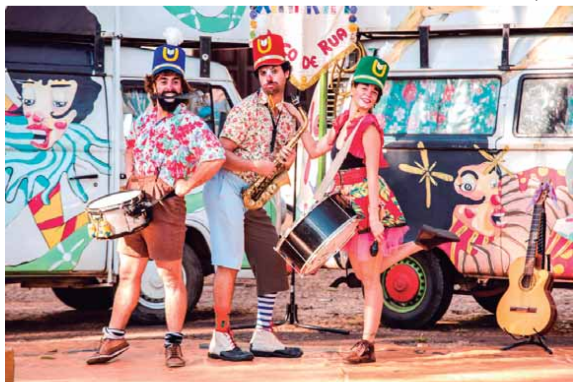
No Xinfrim o respeitável público confere as peripécias de uma trupe mambembe após ter percorrido treze estados brasileiros.