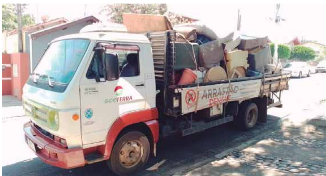
O arrastão recolheu mais de 5 toneladas de inservíveis

A Secretaria de Saúde, por meio do CCZ, reforça que os agentes do PMCA seguem com seu trabalho preventivo o ano todo. Eles visitam os imóveis do município, orientando, retirando criadouros e, quando necessário, colocando larvicida em possíveis criadouros, além da realização de mutirões e arrastões de combate à dengue. Também visitam constantemente pontos estratégicos nos bairros onde há mais risco para a doença, imóveis especiais (como escolas e creches),