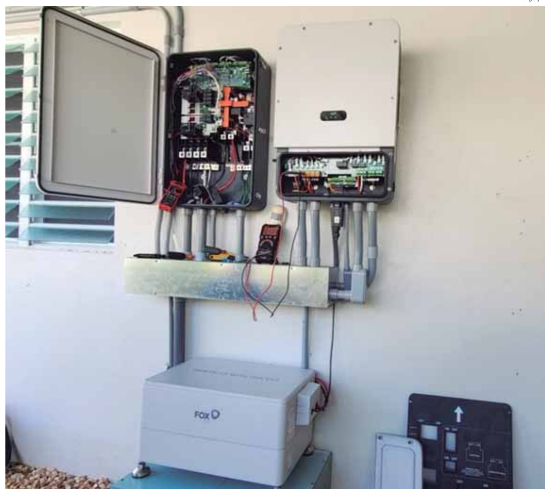
Alternativa para queda de energia é a instalação de um sistema de armazenamento de energia com baterias

"Neste caso, a bateria é instalada com um inversor híbrido, que aqui atua como equipamento de acoplamento em corrente alternada (CA), e assim as baterias trabalham em um