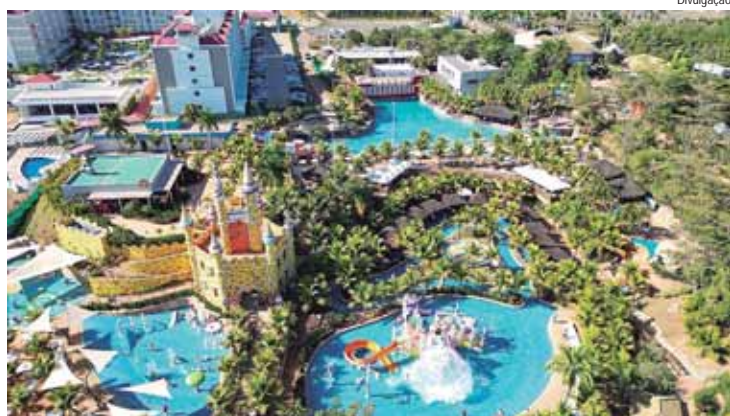
Inédito no Thermas, o evento combina esporte, diversão e natureza