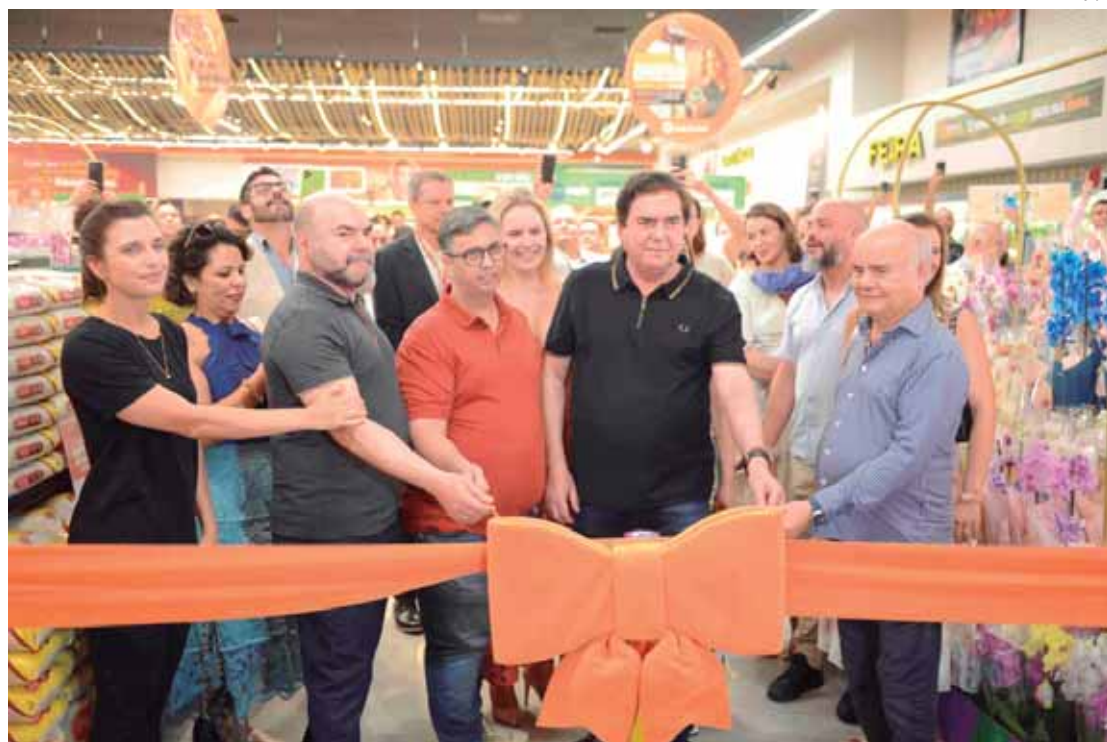
Loja inaugurada em Ribeirão Preto

Essa expansão reafirma o compromisso do Supermercados Pague Menos em oferecer variedade, qualidade e preços competitivos, levando conveniência e uma experiência de compra única a mais famílias do interior paulista. Com trabalho, inovação e foco no Cliente, a Rede segue com confiança para 2025, prontos para novos desafios e conquistas. Atualmente, são 37 lojas da Rede de Supermercados Pague Menos em funciona-