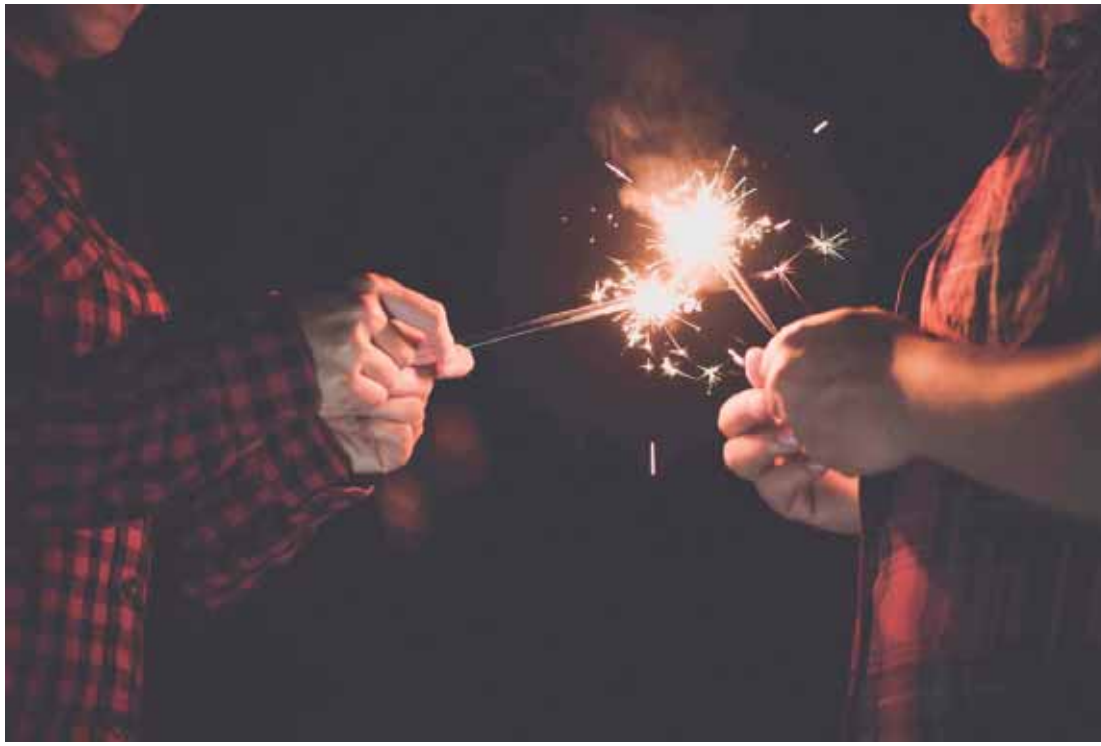
As queimaduras resultaram em 4.809 internações e 34.567 atendimentos no Sistema Único de Saúde (SUS) entre janeiro e março de 2024

Tratamento e reabilitação - Dependendo da gravidade do acidente, o tratamento pode exigir mais do que apenas um atendimento emergencial. Em casos graves, cirurgias avaliam fatores como a extensão da lesão, o comprometimento dos tecidos e as condições clínicas