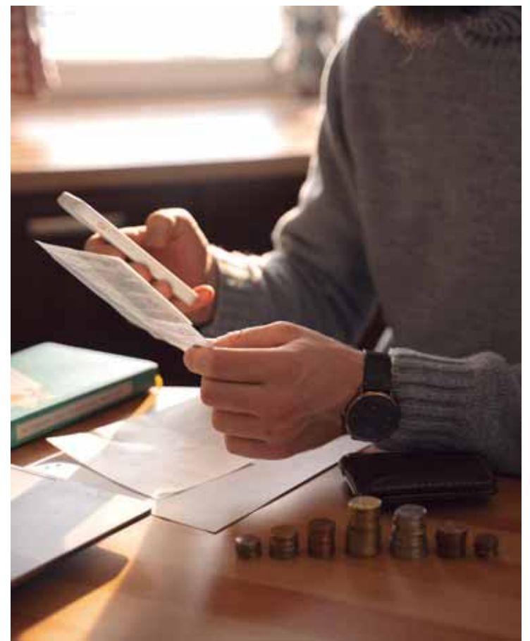
Especialista explica como fazer essa promessa de ano novo virar realidade

vos, Seu Francisco costuma dizer com bom humor que só aceita ser fotografado "se tirarem mil fotos" com ele. E detalhe: o maratonista de 91 anos tem uma "marca" nos registros fotográficos: ele sempre faz pose com a perna levantada, um ritual que ele próprio define como uma forma de "celebrar sua vitalidade graças à corrida".