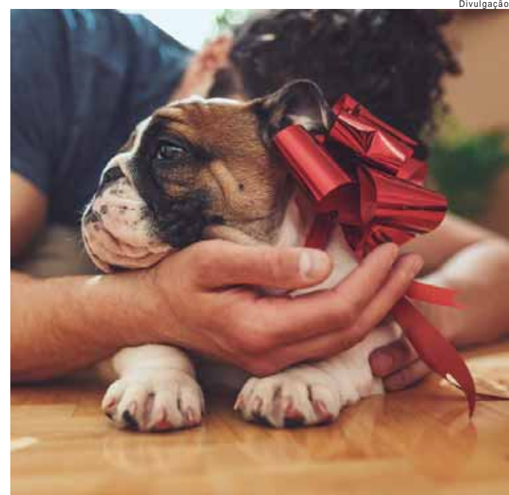
Coordenadora do projeto Chico Adota revela que há um padrão nos casos de abandono e pedidos de resgate