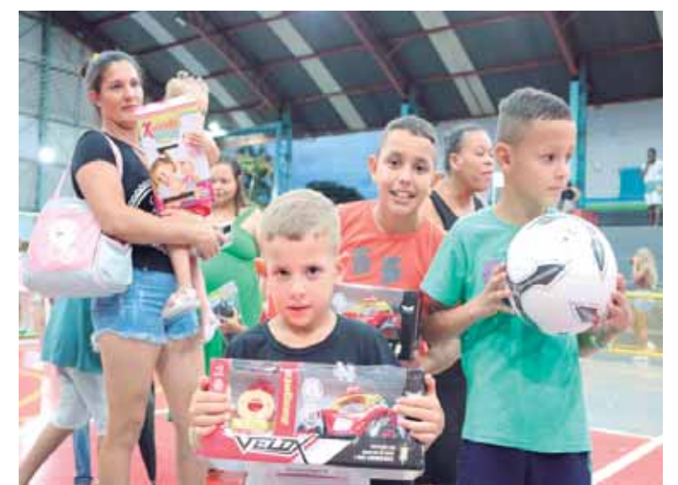
Foram entregues mais de 800 presentes