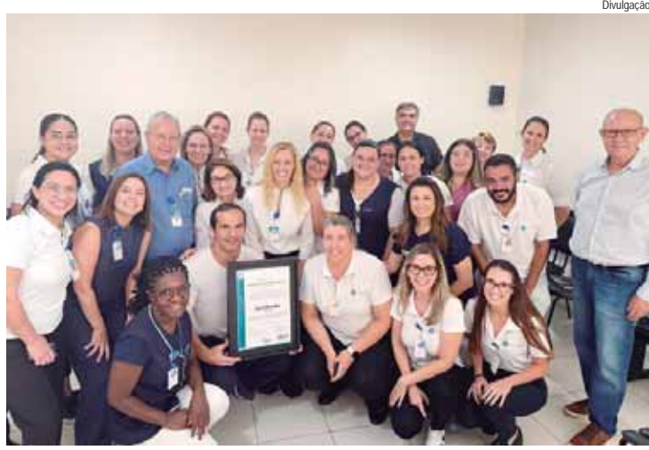
Equipe recebe certificação da Escola Ocrá Brasileira