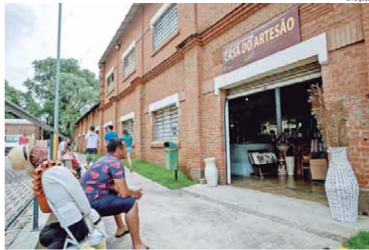
Casa do Artesão do Engenho estará aberta no primeiro dia de 2025

Mercado Municipal – 31/12, das 6h às 14h e 01/01/2025, das 6h às 12h