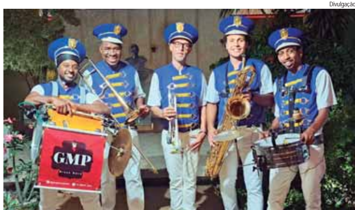
GMP Brass Band vai percorrer o Grande Pátio do Engenho Central durante a festa de Ano Novo

O inédito Réveillon no Engenho Central, com realização da Prefeitura de Piracicaba, por meio da Secretaria Municipal da Ação Cultural (Semac), acontece hoje, 31, das 17 horas à meia-noite. O evento, que terá apoio da Guarda Civil Municipal e da Polícia Militar para fazer a segurança dentro e nos arredores, terá shows musicais, queima de fogos (sem estampido) e espaço kids. As entradas serão pelas passarelas Pênsil e Estaiada e pelo Portal do Engenho (avenida Dr. Maurice Allain, 454). A entrada é gratuita, com sugestão de doação de 1 quilo de alimento não perecível.