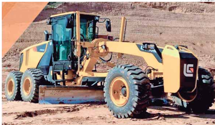
Motoniveladora para manutenção de estradas rurais

A Prefeitura de Piracicaba, por meio da Secretaria Municipal de Agricultura e Abastecimento (Sema), vai receber novas máquinas para manutenção de estradas e pontes da área rural. Uma retroescavadeira, uma motoniveladora e duas roçadeiras foram adquiridas através de adesão à Ata de Registro de Preços, gerenciada pela Secretaria de Agricultura e Abastecimento do Estado de São Paulo (SAA-SP).