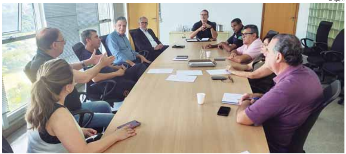
Prefeito reuniu secretariado para organização de estratégia de apoio a população em caso de temporais e extravasamento de rios e ribeirões

A Prefeitura, por meio da Defesa Civil, segue monitorando a situação dos rios e dos pontos que podem alagar em Piracicaba. Os pontos críticos são: avenida Armando de Salles Oliveira, entre o Terminal Central de Integração (TCI) e avenida Independência, avenida 31 de Março e rua Gomes Carneiro com rua Santa Cruz. Motoristas e pedestres devem evitar esses locais em caso de chuvas fortes.