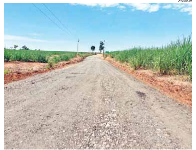
Estradas rurais são identificadas pela designação PIR