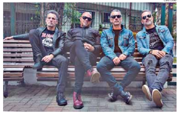
No show em Piracicaba, Inocentes apresenta os maiores sucessos dos 43 anos de carreira

Apesar do sucesso, com o acirramento das brigas de gangues entre 1983 e 1984, o Inocentes afastou-se do movimento e se aproximou da cena do rock paulista. Com uma sonoridade mais próxima ao pós-punk, chegaram à Warner, em