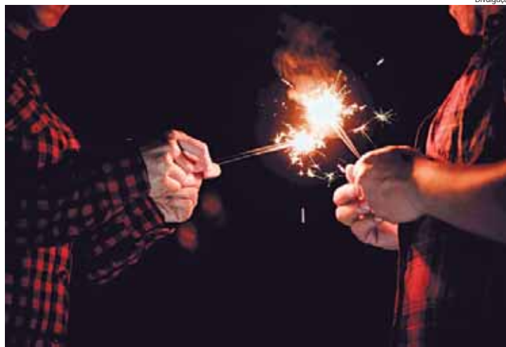
As queimaduras resultaram em 4.809 internações e 34.567 atendimentos no SUS entre janeiro e março de 2024

TRATAMENTO E REABILITAÇÃO - Dependendo da gravidade do acidente, o tratamento pode exigir mais do que apenas um atendimento emergencial. Em casos graves, cirurgiões avaliam fatores como a extensão da lesão, o comprometimento dos tecidos e as condições clínicas do paciente. A partir disso, recorrem a procedimentos como reconstrução de lacerações, fixação de fraturas e, quando necessário, amputações cirúrgicas de dedos ou segmentos. "A mão é o órgão efetor do cérebro e é usada em praticamente todas as atividades diárias, pessoais e profissionais. Técnicas microcirúrgicas e enxertos ajudam a preservar sua funcionalidade e estética, mas nem sempre é possível reimplantar membros amputados de-