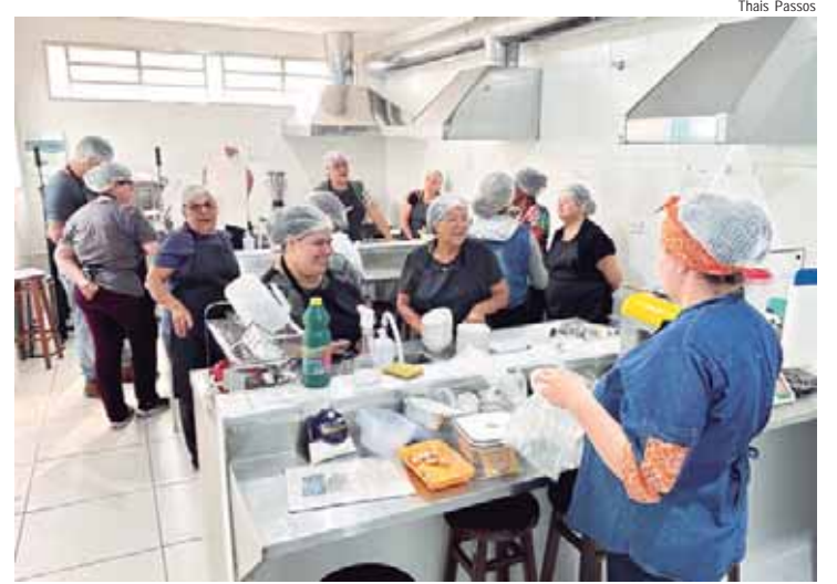
Aulas são gratuitas a população interessada

A compra segura também é fundamental para evitar tragédias. É importante adquirir fogos apenas em lojas especializadas, seguir as instruções de uso e armazenamento do fabricante e nunca combiná-los com o consumo de álcool. Caso o artefato falhe, ele deve ser descartado. "Esses cuidados são essenciais para reduzir os riscos e preservar vidas. Pequenas atitudes podem fazer a diferença entre uma celebração segura e um acidente irreparável", finaliza Novak.