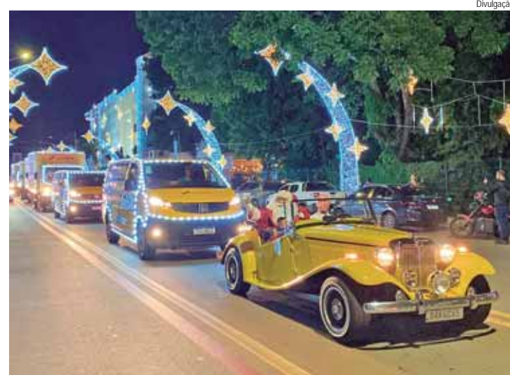
Carreata da Luz em Goiás; mais de 370 mil cartas foram adotadas em todo o País

de 91 anos tem uma "marca" nos registros fotográficos: ele sempre faz pose com a perna levantada, um ritual que ele próprio define como uma forma de "celebrar sua vitalidade graças à corrida".