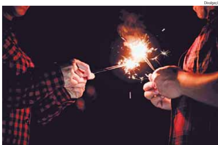
As queimaduras resultaram em 4.809 internações e 34.567 atendimentos no SUS entre janeiro e março de 2024

Casos contribuem para a sobrecarga dos serviços de saúde; queimaduras lideram emergências com dispositivos pirotécnicos; é um alerta para os cuidados com as festas