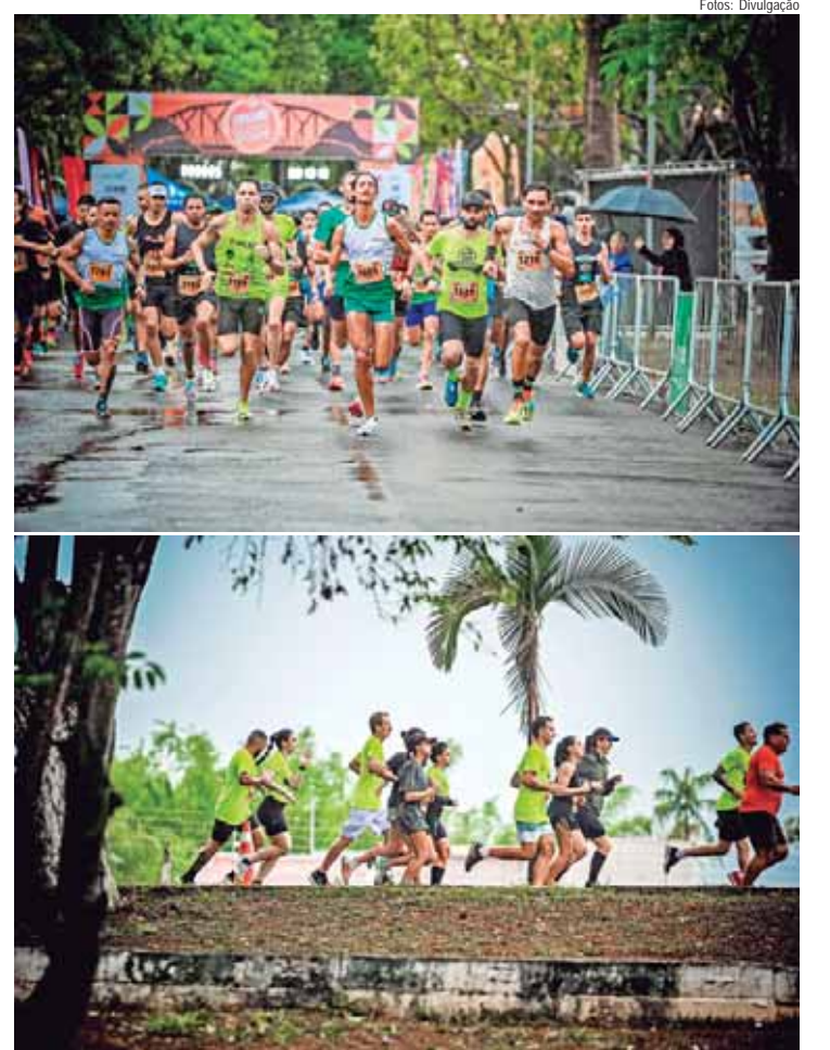
O Circuito Corridas Pague Menos 2024 aconteceu entre os meses de março e novembro

O start do Circuito Corridas Pague Menos 2025 será no dia 16 de fevereiro de 2025, domingo, no