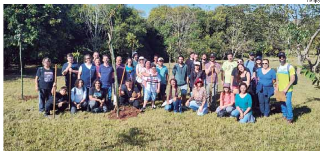
Programas de Educação Ambiental da Simap atenderam mais de 40 mil pessoas em 2024

Outro ponto importante foi a Campanha EducaPira: Comuni-