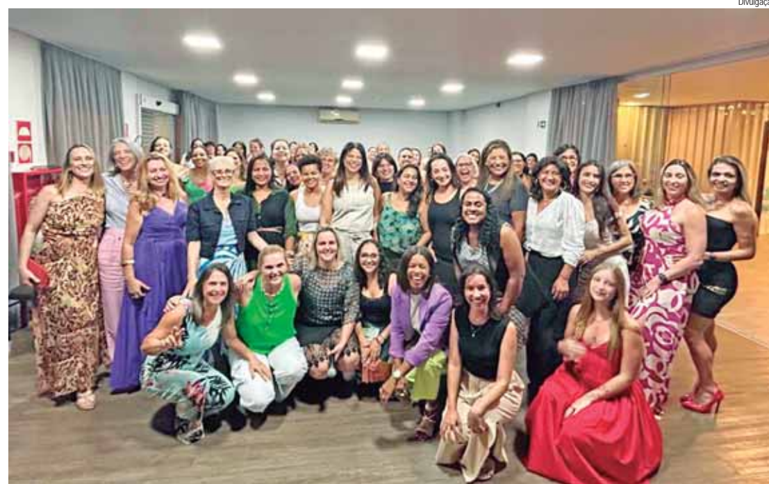
Programação contará com uma exposição diversificada de produtos

Além de promover o empreendedorismo feminino, o encontro tem um caráter solidário. A entrada será um litro de leite ou um pacote de absorventes, que serão doados a instituições de caridade. "Quem participar do evento também estará contribuindo para uma causa social muito importante", explicou Carolina Angele-