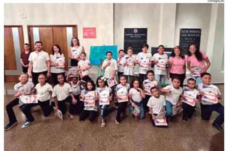
Iniciativa promoveu aulas de canto gratuitas para 80 alunos da cidade

O Governo do Estado de São Paulo, por meio da Secretaria da Cultura, Economia e Indústria Criativas, apresenta o projeto "Cantar e Afinar" com patrocínio da empresa Glovis Brasil Logística, produção da Sexteto Produções, apoio Casa do Amor Fraterno e (AFASCOM) Associação Franciscana e Assistência Social Coração de Maria.