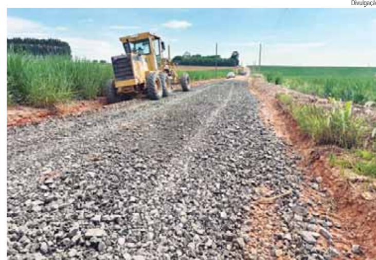
Aplicação de lajão britado na estrada Antonio Dias Rodrigues