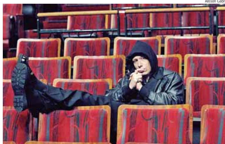
Nagalli assina 12 hits que ultrapassam a marca dos 100 milhões de reproduções

Os Menino da Nova, música que deu origem a Mixtape, foi escrita após evento de integração dos artistas e funcionários da gravadora. O momento tornou-se oportuno para que todos os composi-