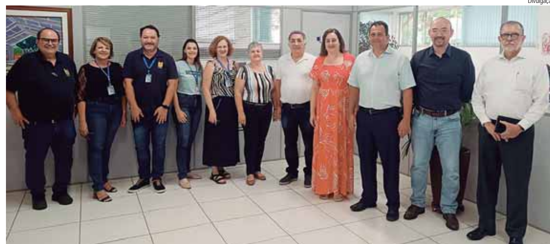
Membros do Conselho de Curadores e funcionários da Fumep participaram da cerimônia de posse

A profa. agradeceu pelo voto de confiança dado a sua pessoa