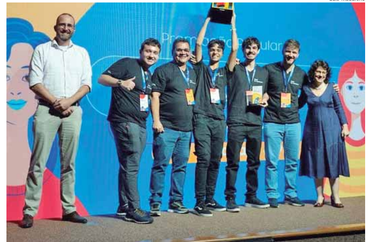
‘Pharmakos’ ficou entre os mais votados pelo Juri Popular

Em sua 11ª edição, o Solve For Tomorrow Brasil registrou um aumento de 19% no número de projetos inscritos – em comparação ao ano anterior. A iniciativa também teve crescimento no número de professores e alunos inscritos, com uma adesão 42% e 10% maior do que em 2023, respectivamente, e no número de escolas cadastradas em 22%.