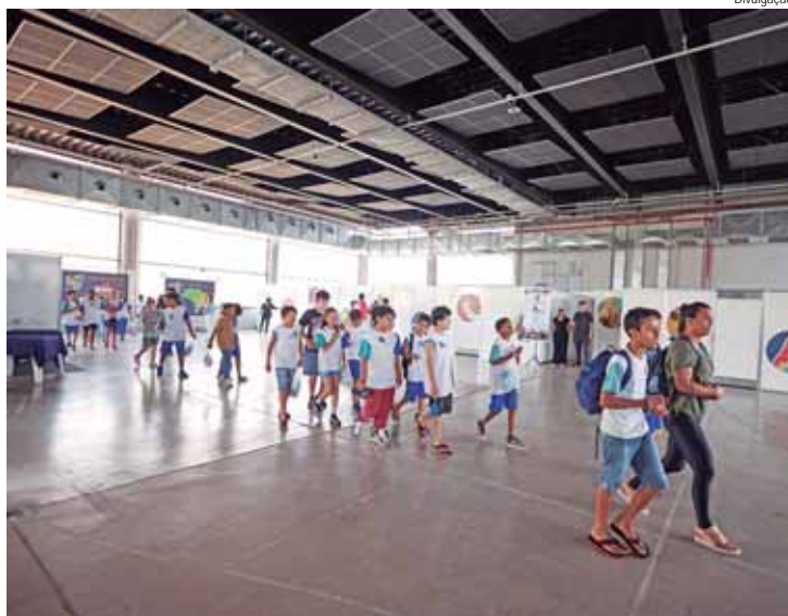
A 21ª Semana Nacional de Ciência e Tecnologia foi realizada em Piracicaba

Dando sequência à programação da 21ª SNCT - Semana Nacional de Ciência & Tecnologia, que este ano traz o tema Biomas do Brasil: diversidade, saberes e tecnologias sociais, na próxima sexta-feira, 6, das 9 às 17 horas, o Instituto Pecege e o Crecin/Esalq realizarão, gratuitamente em Limeira, uma exposição itinerante com jogos gigantes.