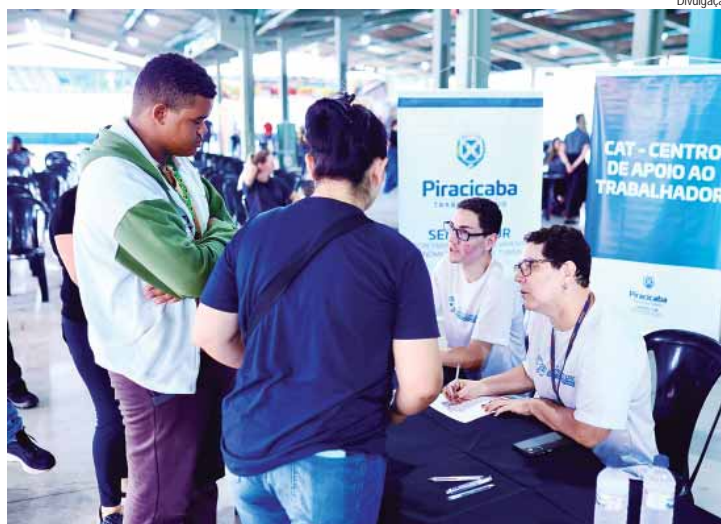
Equipe da Semdettur fizeram a recepção e orientação dos candidatos junto as empresas