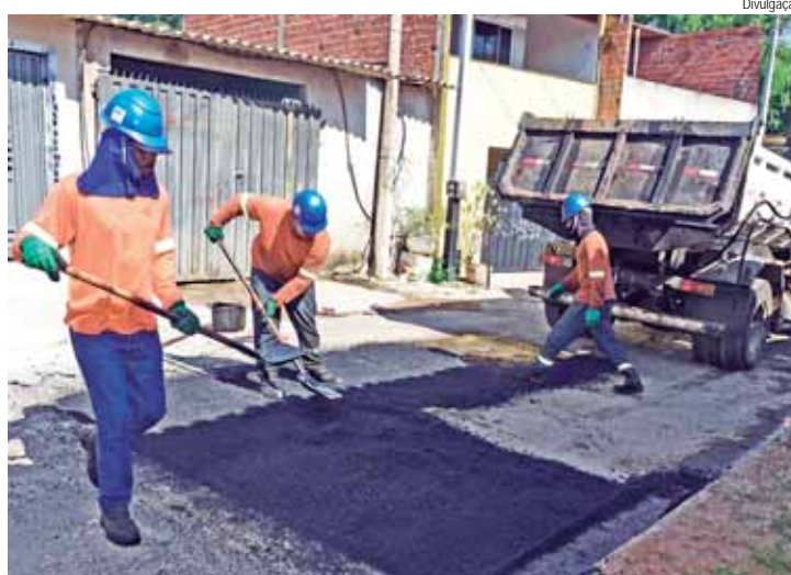
Entre os dias 25 e 29 de novembro, 12 bairros foram atendidos

Bairros e respectivas vias atendidas: Água Branca: avenida Edne Rontani Bassete; Higienópolis: travessa Flores da Cunha, rua Professor Lauro Alves Catule de Almeida e avenida Antonio Fazanaro; Jardim Belvedere: rua Silvio Ometto; Jardim Itamaraty: travessa João Batista Viziolli; Kobayat Libano: rua Dr. Miguel Vieira Ferreira; Lot. Ipanema: rua Maria Isabel da Silva Mattos; Mario Dedini: rua das Esmeraldas; Novo Horizonte: rua João Baptista de Toledo e rua Silvio Brienza; Santa Teresinha: rua Fernando Ferraz de Arruda, rua Francisco Candido Furquim de Campos, rua João Francisco de Oli-