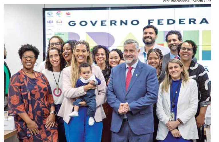
A ministra Anielle Franco (Igualdade Racial) e o ministro Paulo Pimenta (Secom): parceria e compromisso

O ministro complementou afirmando que haverá um diálogo permanente com todos os setores da administração pública federal, com o acompanhamento da sociedade civil. “Para que todas essas propostas saiam do papel e se transformem em ações, vamos construir, sob a coordenação do MRI e da Secom, um diálogo permanente com todos os demais setores da administração pública federal, mi-