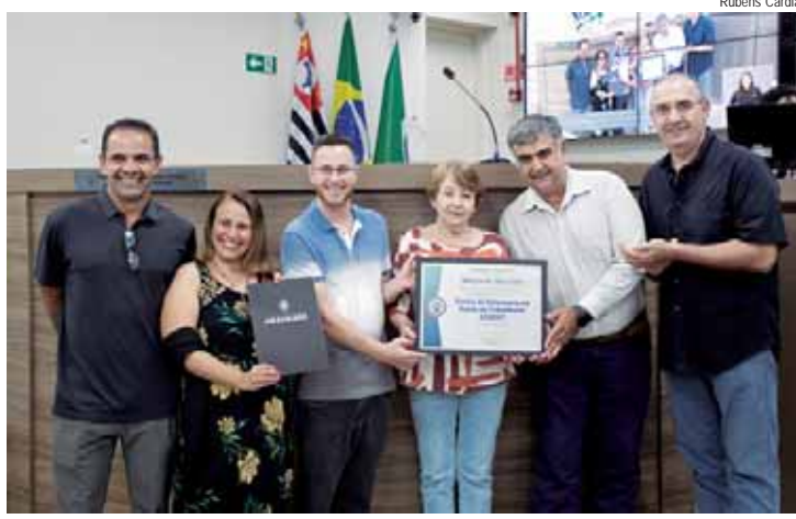
Entrega da homenagem ocorreu durante a 74ª Reunião Ordinária, nesta segunda-feira (2)