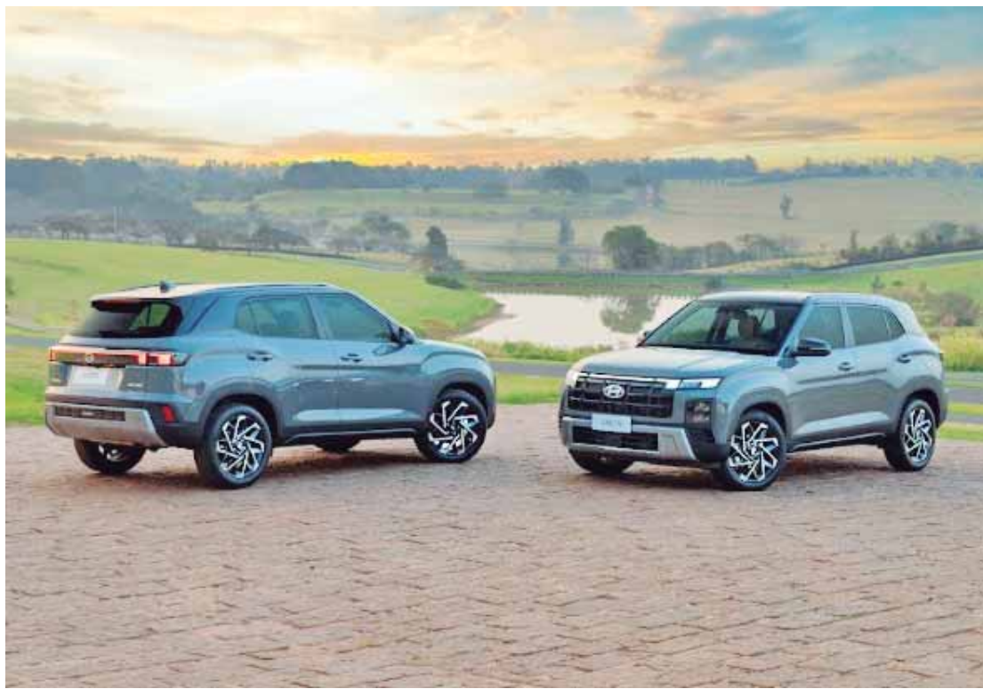
A nova geração do SUV Hyundai Creta chegou em outubro com visual externo e interno totalmente remodelados