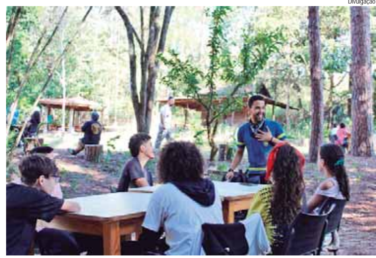
Evento vai promover uma aventura por meio da construção de personagens, protagonizados pelos participantes

A proposta do evento é construir uma aventura na qual cada participante será protagonista de um personagem, buscando desvendar a história secreta da nação. Cada bem cultural, patrimônio, ginga ou cantiga poderá conter uma pista para esse grande mistério. A mediação da atividade