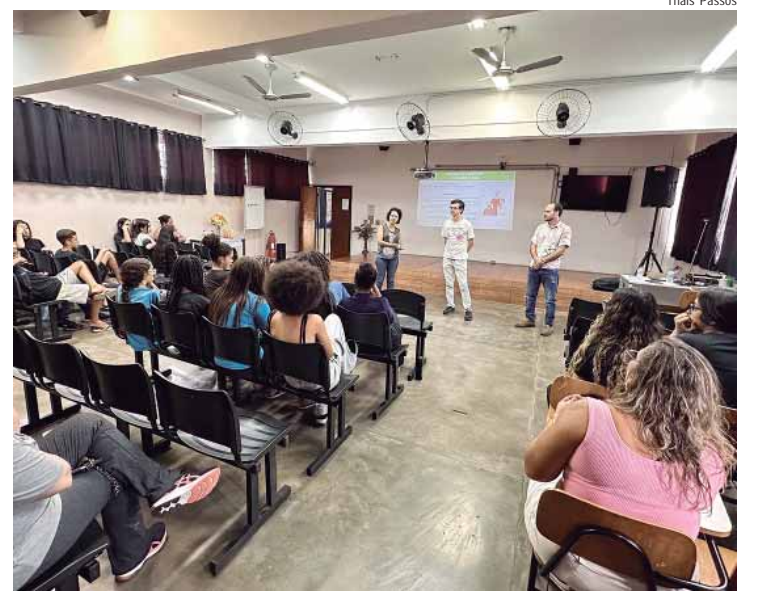
Convite para a palestra partiu do projeto extradisciplinar Um Olhar para o Futuro