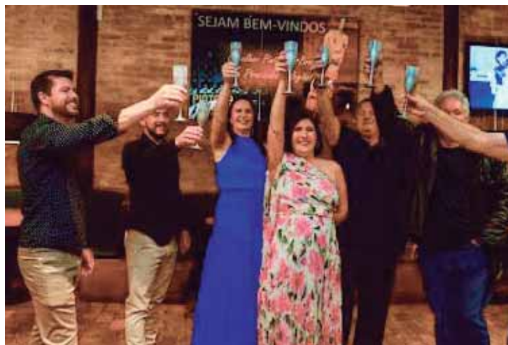
Família Camolez brindando a vida no Restaurante Pintado na Brasa