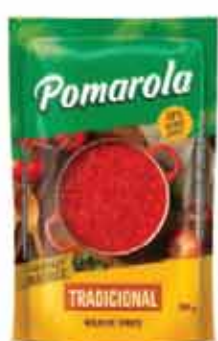
Molho Tomate Pomarola 300g Sc.Trad.