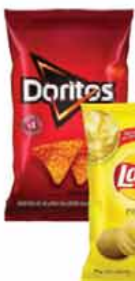
Salg. Doritos 120g ou Batata Lays 115g Classica