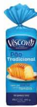
Pão de Forma Visconti Trad. 400g