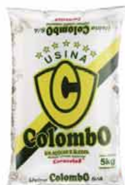
Açúcar Cristal Colombo 5kg