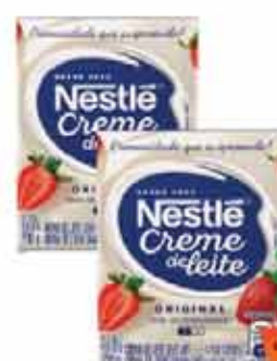
Cr. Leite Nestle 200g TP Trad.