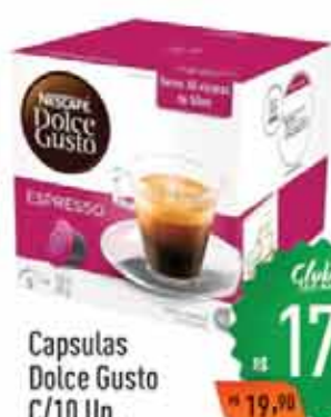
Capsulas Dolce Gusto C/10 Un.

Clube R$ 5,99 R$ 4,99 Limite por cliente: 24 unid.