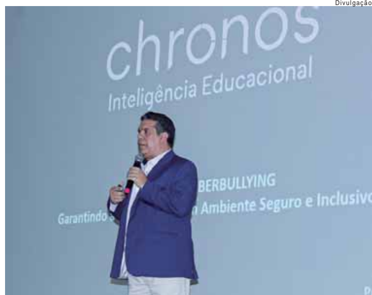
O evento aconteceu no dia 29 de outubro, no Centro de Convenções Jacintho José Fávoro

O nome do livro vencedor do Prêmio Jabuti 2024, categoria "Escritor Estreante - Romance" e em todas as demais categorias, será divulgado em uma cerimônia da Câmara Brasileira do Livro (CBL), em São Paulo, no próximo dia 19 de novembro.