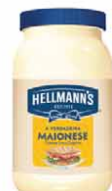
Maionese Hellmann's 500g