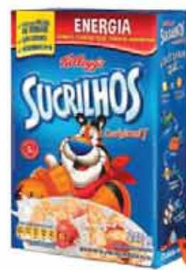
Cereal Kelloggs 240g/200g