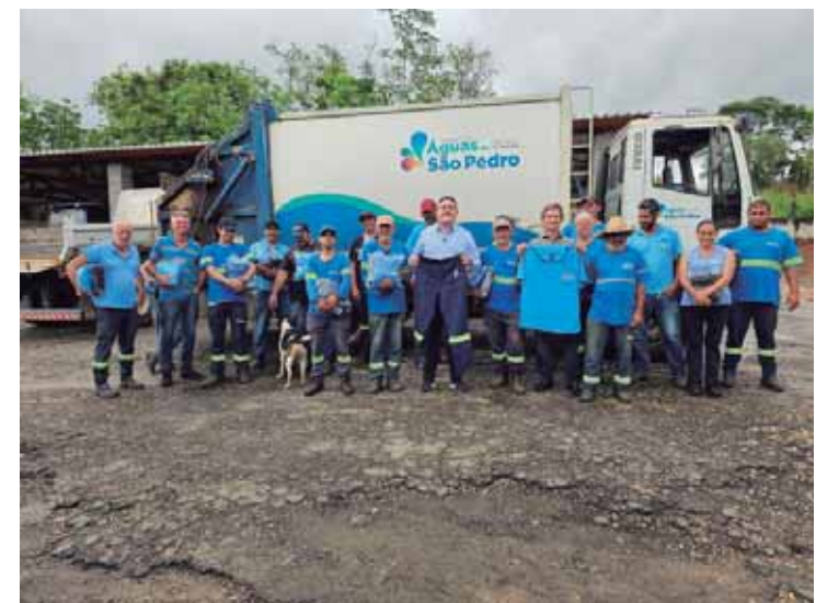
Cada colaborador recebeu um kit com cinco calças e cinco camisetas