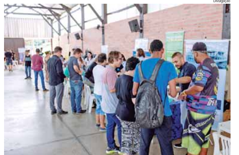
Neste ano, 30 empresas oferecem 150 vagas exclusivas para pessoas com deficiência residentes em Piracicaba

As empresas que participarão da Feira são as seguintes: Argus Solutions, Centro de Reabilitação Piracicaba – Empresa Inclusiva, Centro Educacional Piracicaba Santa Cruz (CEPSC), CJ do Brasil, Coplacana, Desktop, Drogal Farmacêutica Ltda, Duplas – Indústria de Peças Plásticas Ltda, Grupo Spss, Hospital Fornecedores de Cana de Piracicaba, Hyundai Motor Brasil, Irmandade da Santa Casa de Misericórdia de Piracicaba, Its Brasil – Polo de Empregabilidade Inclusiva, Klabin S.A., LEF Pisos e Revestimentos S.A., Link Steel – Equipamentos Industriais, Max Atacadista Piracicaba, Repono Consultoria de Gestão Empresarial Ltda-Me, Requioph, Sebrae – Serviço de Apoio às Micro e Pequenas Empresas de São Paulo, Senac Piracicaba, Sindicato dos Metalúrgicos de Piracicaba