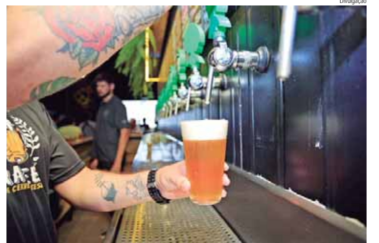
Evento traz 13 cervejarias artesanais de Piracicaba e Serra do Itaqueri

PARCERIA - Em 2024, a Semdetur traz ao evento 13 cervejarias: A Tutta Birra, Ampere Cervejaria, Cervejaria HZB, Cevada Pura, Dama Bier, Em Nome do Malte,