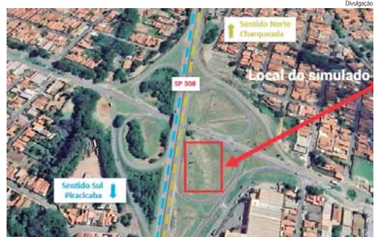
Treinamento prepara equipes para resposta rápida em acidentes com cargas perigosas acontece nesta quarta-feira

“A realização desse tipo de treinamento é fundamental para assegurar uma resposta ágil e eficaz em cenários reais, minimizan-