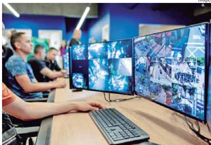
Primeira etapa da modernização do sistema de videomonitoramento inclui 442 novos equipamentos

O diretor operacional do consórcio que vai operar o CIIP explicou como funcionam as câmeras. "O sistema é moderno, com alta qualidade de software e infraestrutura. São dois tipos de câmeras, um com grande aproximação de imagem, que tem o objetivo de monitoramento remoto, podendo até verificar uso de celular e falta de cintos de segurança ao dirigir. O outro tipo, que foi ampliado para todas as entradas e saídas da cidade,