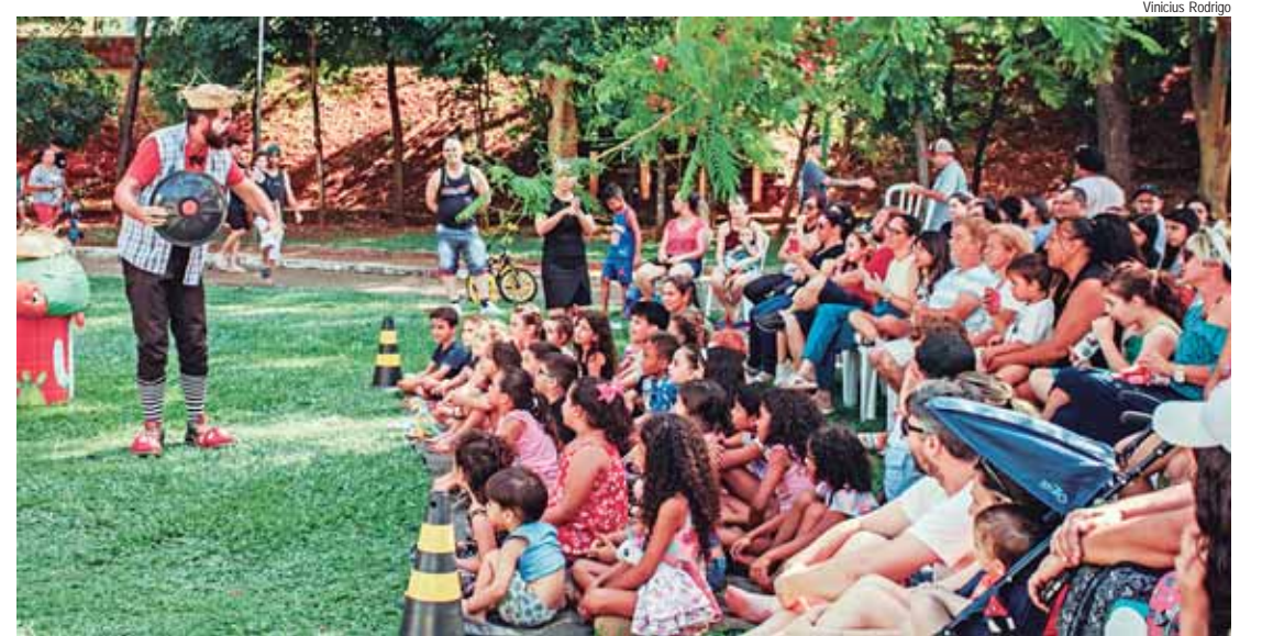
A Cia Atitude utiliza a arte, a cultura e a educação como pilares para promover interação social

Mais do que um espetáculo, o projeto da Cia Atitude inspira a comunidade a valorizar a arte do