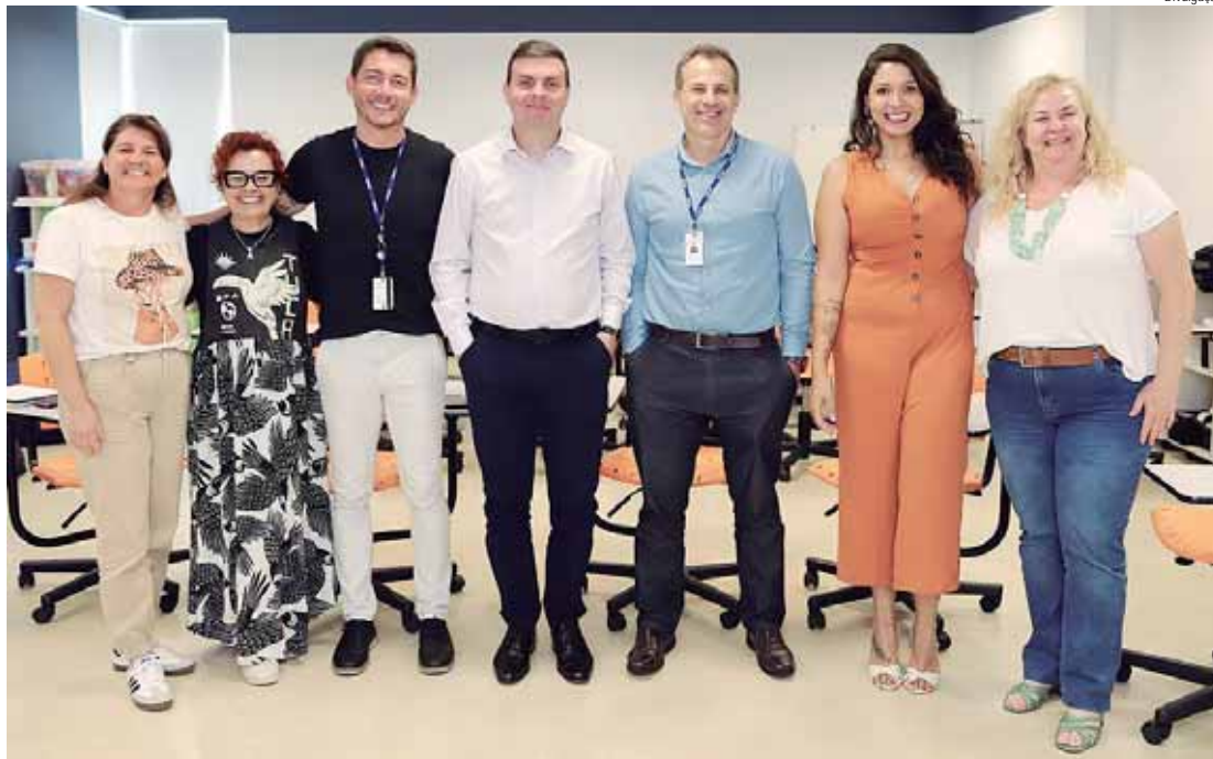
Equipe da SME esteve no Senac para apresentação de resultados da parceria em 2025

As oficinas, realizadas duas vezes por semana para cada turma, somaram 1.170 encontros e uma carga horária total de 3.660 horas desde abril. Os temas abordados incluíram linguagens artísticas, sustentabilidade, fortalecimento de vínculos e cultura de paz. Renata Prates e Erick Andrade, do Senac, foram responsáveis