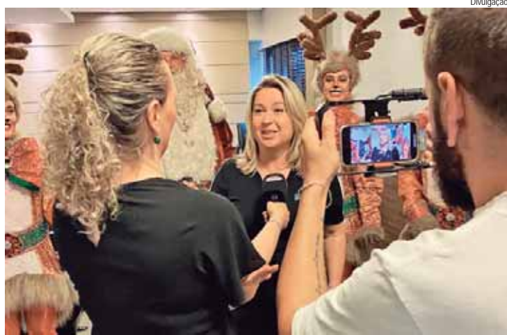
Os detalhes foram apresentados na tarde de segunda para a imprensa

Com uma programação inédita e exclusiva, a Acipi levará para Piracicaba ações especiais neste fim de ano, evidenciando as possibilidades do comércio local e valorizando manifestações artísticas natalinas de diversos formatos. A estreia será nesta quinta-feira, 28, com o acendimento da Ponte Pênsil, um dos cartões postais de Piracicaba, a partir das 18h30, em parceria com a Prefeitura de Piracicaba.