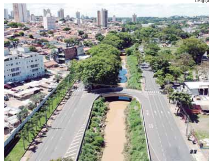
Projeto inclui levantamento de informações básicas, análise e diagnóstico da situação atual do ribeirão Piracicamirim

O Piracicamirim é um dos principais afluentes do rio Piracicaba e se estende por outros dois municípios: Rio das Pedras e Saltinho. Quarenta e quatro por cento de sua bacia hidrográfica está em Piracicaba, sendo 40% na área urbana, e 56% nos outros municípios. Toda impermeabilização que ocorre em Rio das Pedras e Saltinho tem a drenagem, ou seja, as águas de chuva, direcionadas para o ribeirão Piracicamirim na área urbana de Piracicaba.