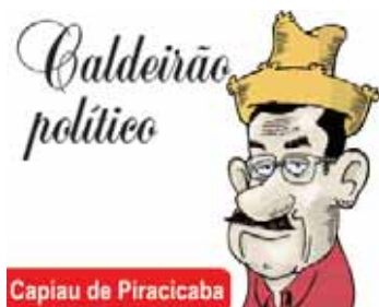
Capiau de Piracicaba

PARAGUAI — I O Ministério de Obras Públicas e Comunicações do Paraguai (MOPC) apontou para março de 2026 a conclusão das obras da Ponte da Bioceânica, que liga Porto Murtinho, no Brasil, a Carmelo Peralta, no Paraguai. A previsão foi feita após a visita ao canteiro de construção das ministras de Obras do Paraguai, Claudia Centurión, e do Chile, Jessica López. O projeto está 62% concluído.