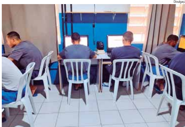
Jovens poderão concorrer a bolsas de iniciação científica em 2025