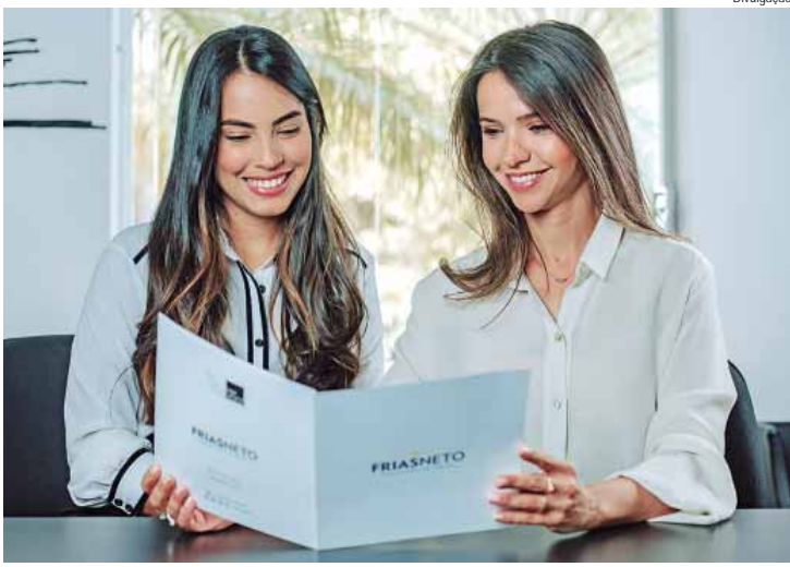
Frias Neto: imóvel é moeda forte