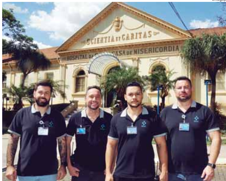
A equipe de técnicos de segurança do trabalho da Santa Casa

Ele conta que esses profissionais também realizam o monitoramento dos sistemas de alarme e combate a incêndio e os treinamentos de brigada de incêndio. "É essa a equipe da segurança do trabalho responsável pelos planos de gerenciamento de riscos, resíduos, perfurocortantes e de treinamento de trabalho em altura e espaço confinado, para atender as legislações vigentes a fim de garantir a segurança e a saúde dos funcionários do hospital", completou Acconci.