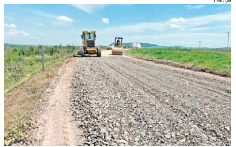
Manutenção da estrada Francisca Domingues Detoni no bairro Dini

permanente nas vistorias e a dotação orçamentária para as estradas rurais como um todo, o que envolve a manutenção das 153 pontes