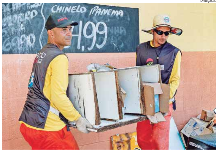
Equipes do Arrastão da Dengue estarão em nova ação no próximo sábado, 23, e que passará por cinco bairros