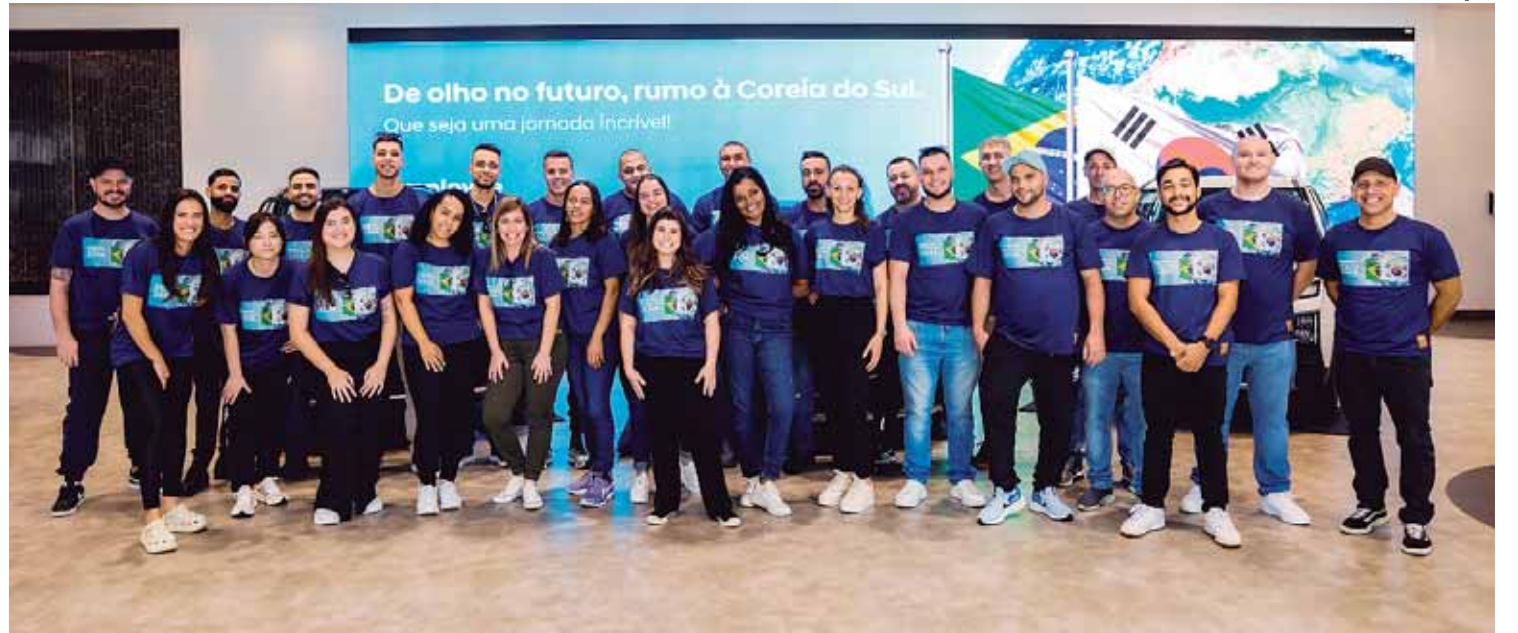
Entre os selecionados estão 17 piracicabanos e, para 20 colaboradores, esta é a primeira viagem internacional

A Hyundai Brasil é reconhecida pela consultoria Great Place to Work® Brasil (GPTW) como uma das melhores empresas para se trabalhar na indústria brasileira e prá-