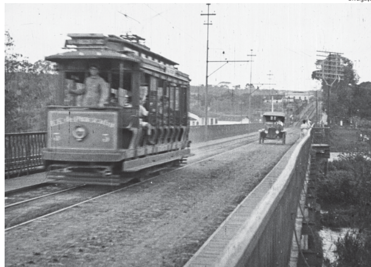
O filme será exibido de forma gratuita ao público na quinta-feira, 21

"E também lugares e estruturas que já não existem mais como o antigo Mirante, o antigo Mercado Municipal, as linhas de bonde e a