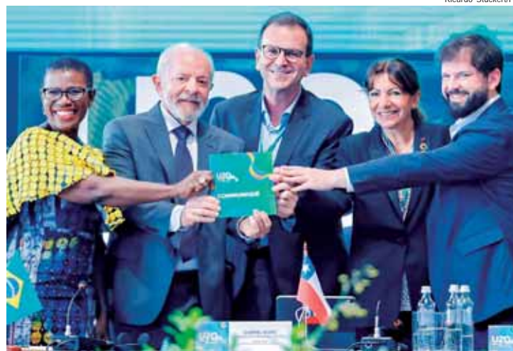
Presidente Lula durante a sessão de abertura do Urban 20, iniciativa do Grupo C40 de Grandes Cidades

AVANÇOS - Na cerimônia, o ministro das Relações Exteriores, Mauro Vieira, enfatizou que “grupos de engajamento como o U20 desempenham um papel essencial ao permitir que o G20 cumpra seu papel de dar voz e protagonismo a atores além dos governos”. Ele também apontou os principais avanços do G20 a partir da condução brasileira. “Ao nos aproximarmos