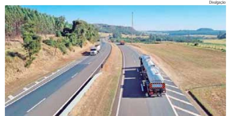
Resultado reflete trabalho contínuo em segurança e conscientização dos usuários

A Eixo SP Concessionária de Rodovias alcançou um marco positivo neste feriado da Proclamação da República. Nenhuma morte foi registrada nas 12 rodovias sob sua administração. A Operação República teve início à 0h de quinta-feira (14) e foi encerrada às 23h59 deste domingo (17) sem nenhuma vítima fatal no balanço. O resultado foi comemorado pela empresa como reflexo de seu compromisso com a segurança viária e a conscientização dos motoristas.