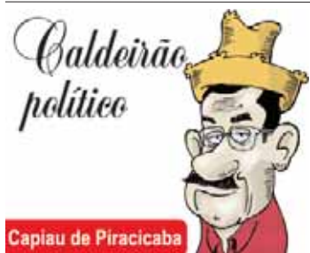
Capião de Piracicaba