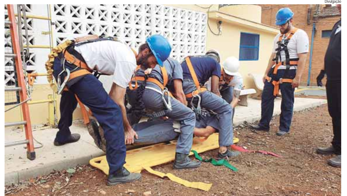
Os homens atuam em diversos setores do Hospital, onde mais de 80% dos funcionários são mulheres