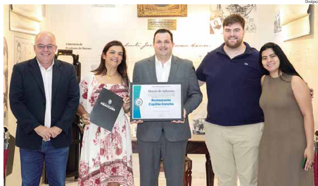
Na tradicional Rua do Porto, estabelecimento tem o desafio de disseminar a gastronomia piracicabana entre turistas e clientes da cidade

“Foram 15 anos de lutas, de sofrimento, choro, desespero, mas hoje estão colhendo os frutos disso”, disse o parlamentar. “É um dos melhores restaurantes da região, acolhimento muito bem feito, qualidade ótima. Esta moção é um agradecimento da Câmara por vocês serem parte importante da nossa cidade, por acolherem a população e visitantes com carinho, paciência e sorriso