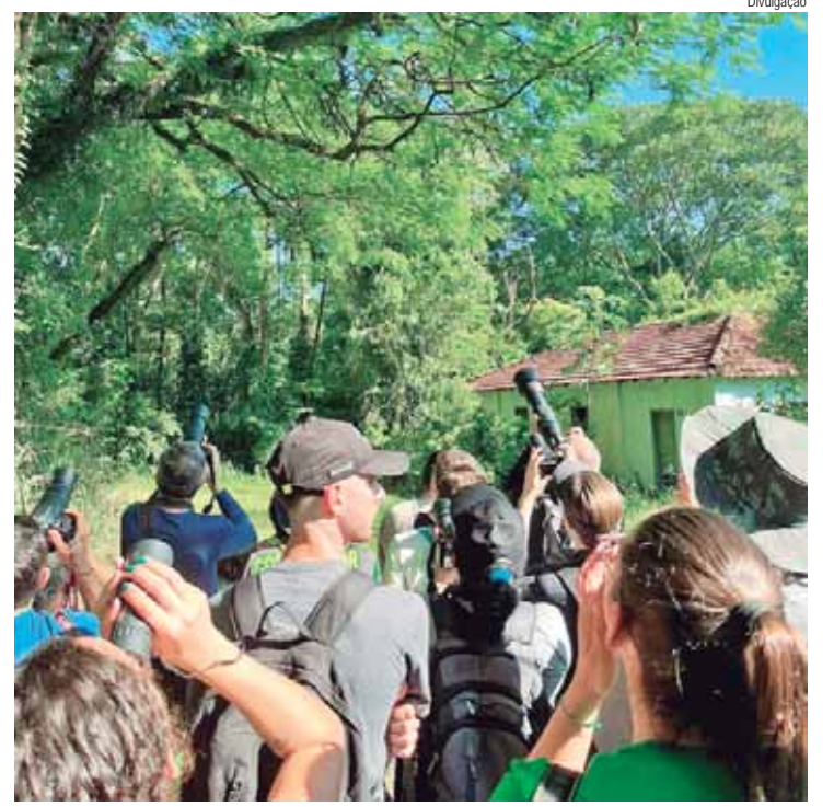
Tradicional atividade do programa Vem pro Horto é aberta ao público

Mais informações sobre o 11º Afropira podem ser conferidas no site oficial www.festivalafropira.com.br ou no Instagram: @afropira