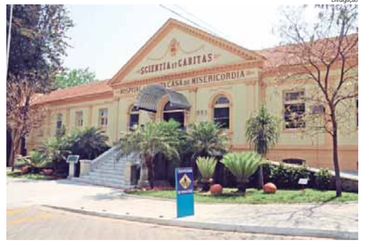
Santa Casa de Piracicaba, 170 anos dedicados à saúde pública de Piracicaba e Região