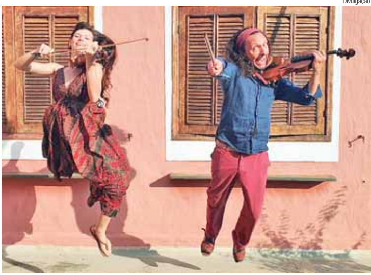
Show de música erudita acontecerá no dia 24, domingo