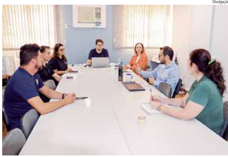
Reunião Projeto Toledo, das Minas Gerais