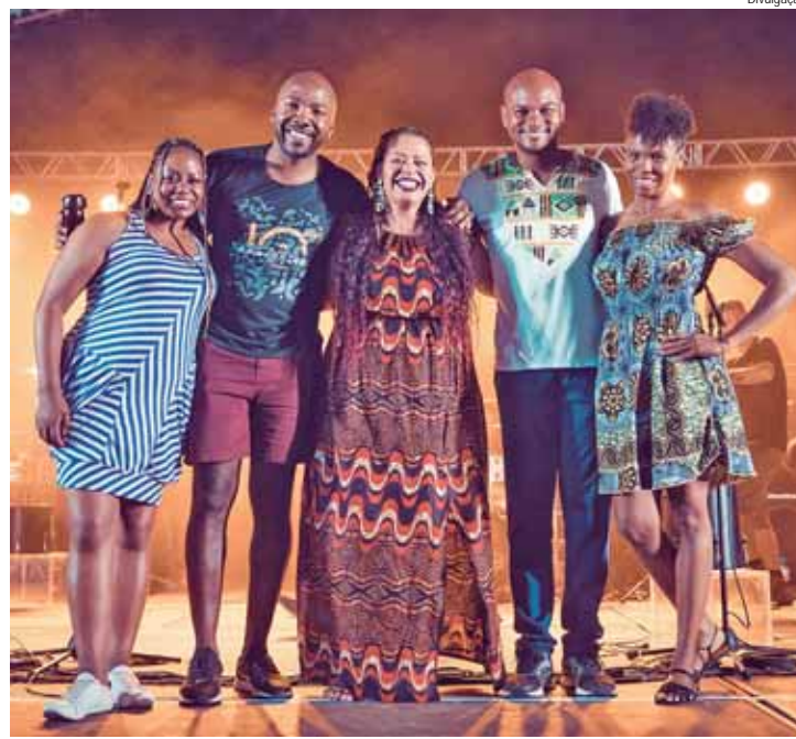
Diretores do Instituto Afropira, que organiza o festival no Engenho