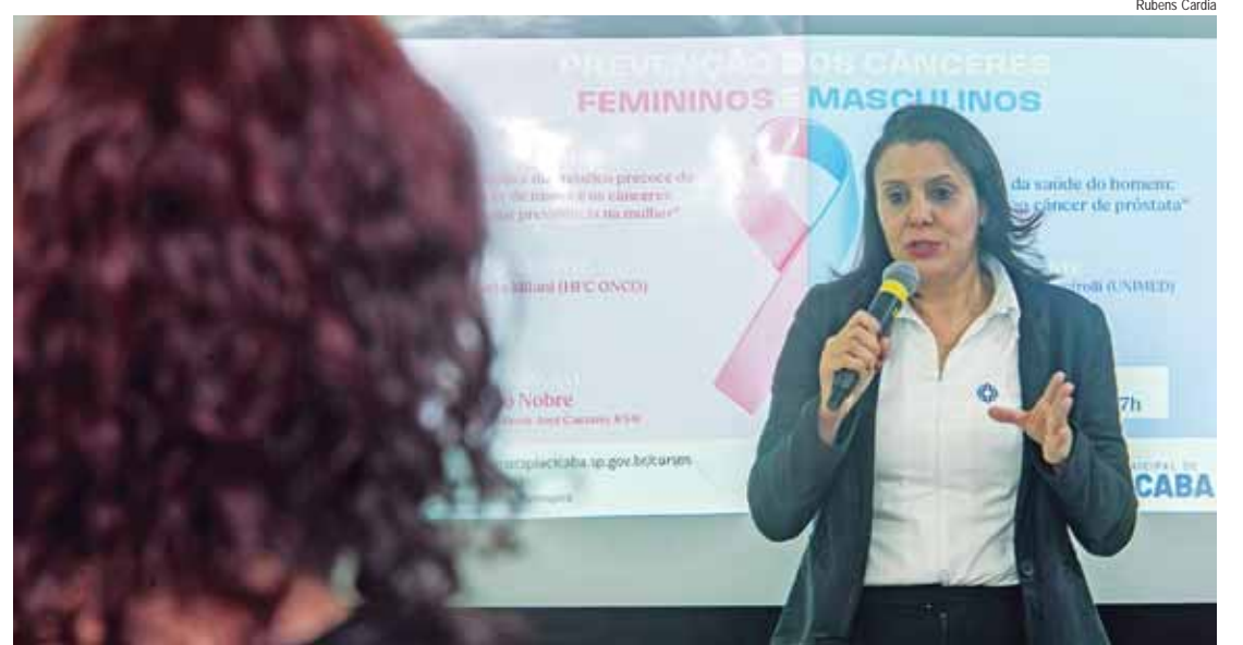
Atividade promovida pela Escola do Legislativo foi alusiva às campanhas Outubro Rosa e Novembro Azul

“Quando diagnosticado em tempo oportuno, na fase inicial, a chance de cura pode chegar a 95%. O tratamento pode ser realizado com cirurgias menores e tratamentos oncológicos menos invasivos”, colocou. A enfermeira também abordou os fatores de risco para a incidência da doença, como gené-