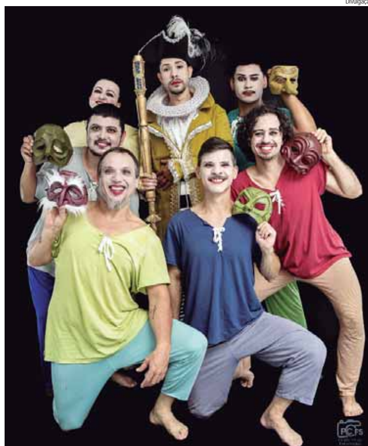
Elenco da peça A Arrombada sem o figurino

A Arrombada, da Cia Metamorfose. Domingo, 17, às 19 horas, no Teatro Municipal Dr. Losso Netto (Rua Gomes Carneiro, 1212). Entrada gratuita.