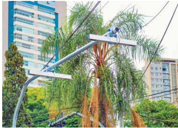
Radares estão sendo instalados em novos pontos da cidade

“É importante ressaltar que autuações só ocorrem nos casos de imprudências, somente 14% dos