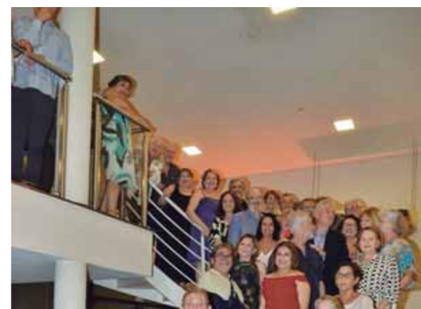
A turma toda em pose especial