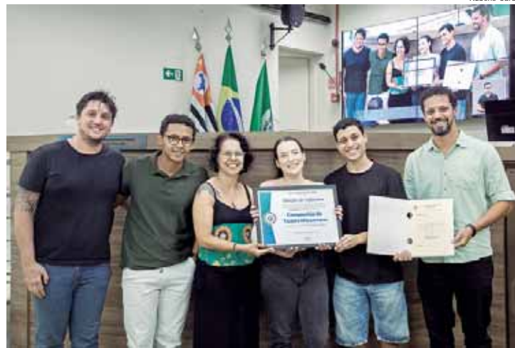
Integrantes da companhia estiveram na Câmara de Vereadores

A primeira atividade da Misancene foi um workshop de interpretação para audiovisual, seguido pela montagem do espe-