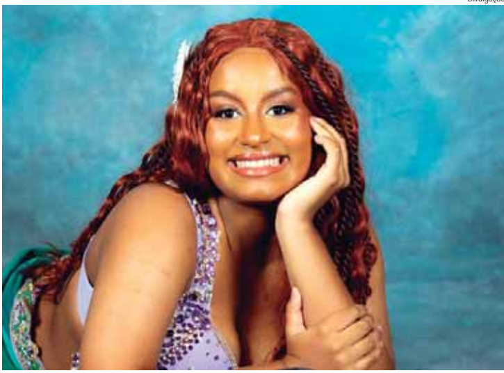
Espectáculo de música, teatro e dança será apresentado nos dias 13 e 14 de novembro, às 20h, no Teatro do Engenho