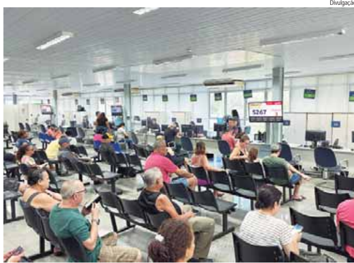
Duvidação Dos dias 18 a 22 de novembro o atendimento do Térreo 2 será suspenso para colocação de novo sistema de ar-condicionado