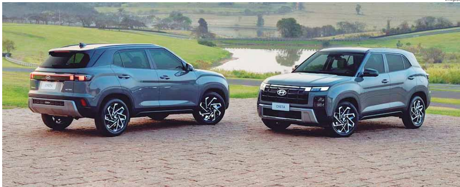
O modelo se destacou na opinião dos editores da publicação pelo design "totalmente renovado"