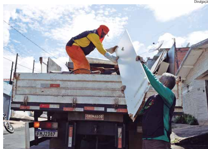
Arrastão da dengue acontece no próximo sábado (16)

ROTINA – No último sábado, 09/11, o Arrastão da Dengue esteve no bairro Jaraguá e adja-