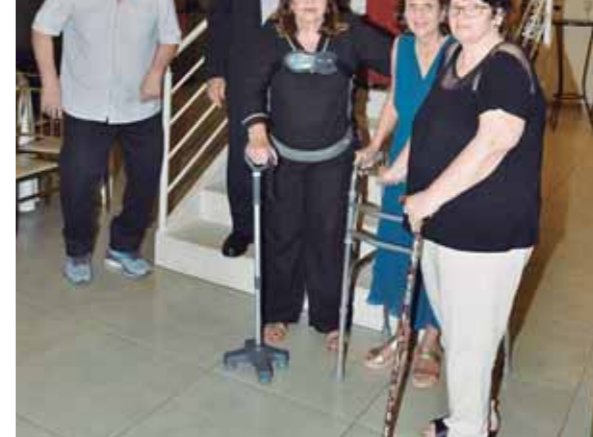
A turma toda em pose especial