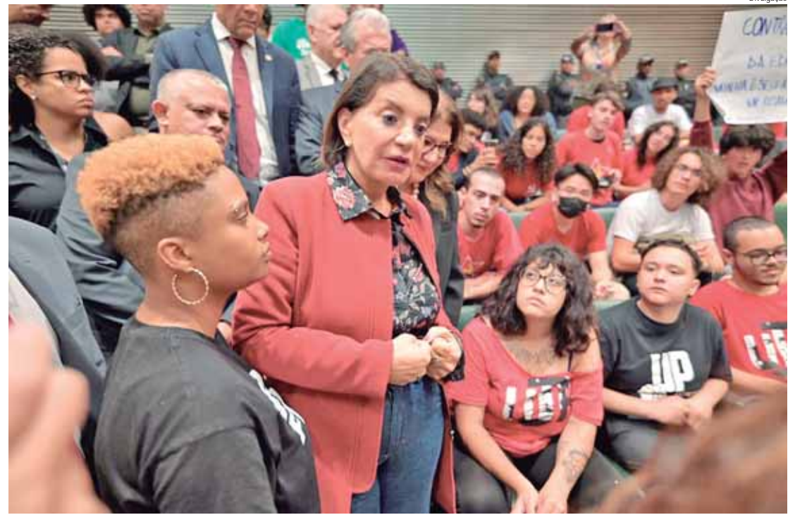
A deputada Professora Bebel conversa com estudantes na galeria da Assembleia Legislativa, na semana passada, quando ocorreram protestos contra a PEC 09-2023

Ao longo da semana passada, estudantes, professores e lideranças de movimentos sociais estiveram na Assembleia Legislativa do Estado de São Paulo, se posicionando contrários ao corte de recursos da educação pública. A deputada piracicabana Professora Bebel, por diversas vezes, expôs inúmeras ra-