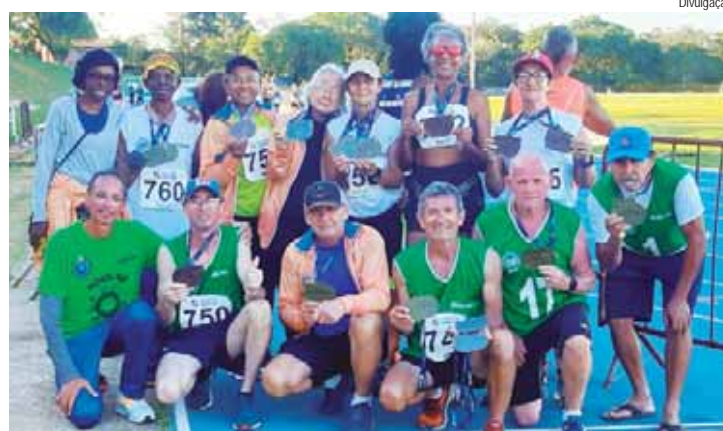
Equipe de atletismo master da Selam

Ao todo, a equipe da Prefeitura de Piracicaba participou com 27 atletas com idades entre 42 e 91 anos, numa competição que contou com 108 equipes e 822 atletas de todo o país.