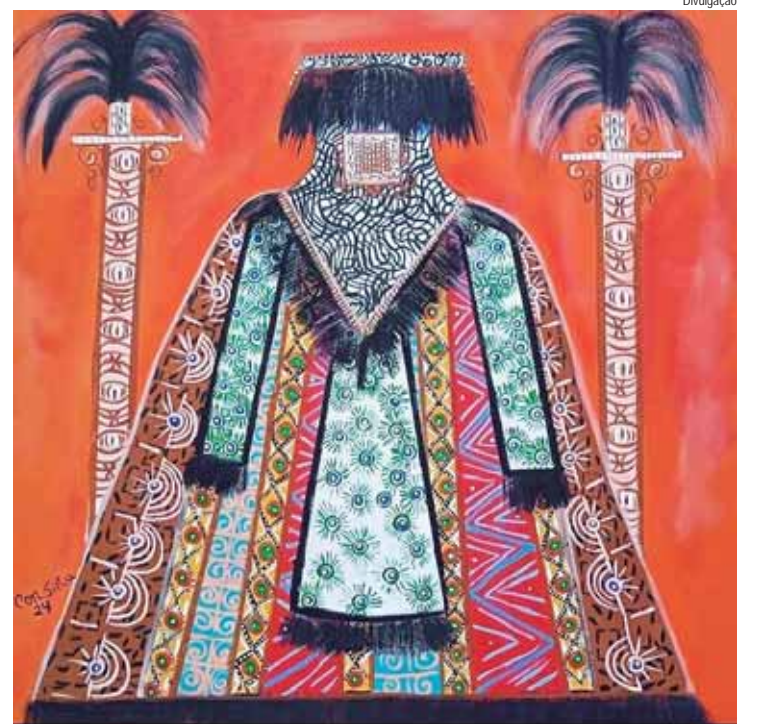
Egunun, obra selecionado de Con Silva

O 53º SAC ofertará dois prêmios aquisitivos: o Prêmio Prefeitura do Município de Piracicaba, no valor de R$ 20 mil, e o Prêmio Câmara Municipal de Piracicaba, no valor de R$ 18 mil. A mostra poderá ainda conferir até três Prêmios Especiais de Leitura Pública e Análise de Por-