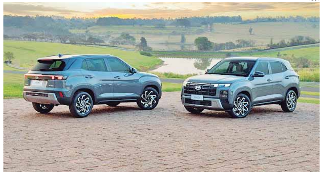
Evento é promovido pela revista CAR Magazine Brasil

Para obter informações sobre todos os modelos Hyundai, consultar a lista completa de concessionárias e encontrar a loja mais próxima, acesse: hyundai.com.br .