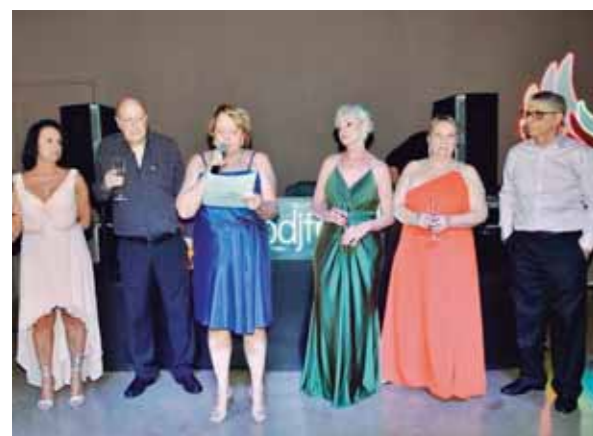
A Oradora da Turma e a Comissão Organizadora

Aconteceu no último sábado, dia 2 de novembro, na Vila Francesa, em Piracicaba, a festa de confraternização de 104 ex-alunos do "Sud Mennucci", para a comemoração de 50 anos de formados no Colegial em 1974. Com muita emoção, os eternos colegas abraçaram-se como sempre, dançaram ao som de músicas da época e se confraternizaram em encontro inesquecível a todos eles.