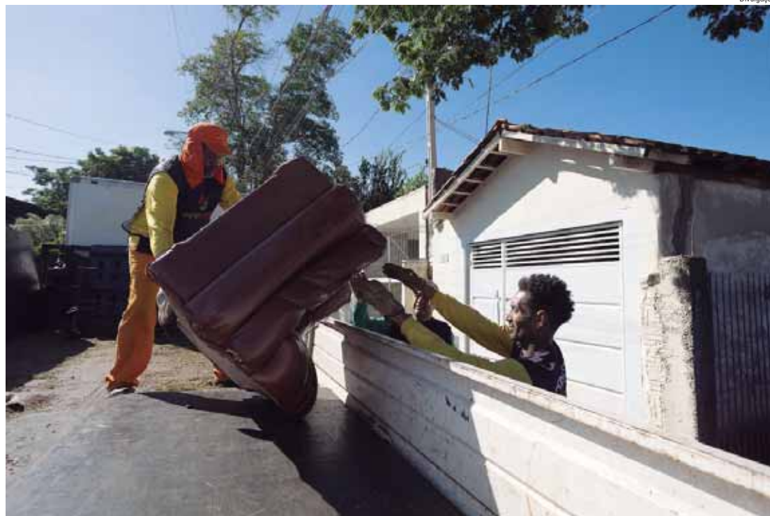
O objetivo dos arrastões é o combate ao mosquito Aedes aegypti, transmissor da dengue

VACINAÇÃO - A aplicação da vacina contra a dengue em crianças e adolescentes na faixa etária entre 10 e 14 anos segue em Piracicaba. Para receber o imunizante é necessário apresentar documento de identificação com foto, Cartão Pira Cidadão ou Cartão Nacional do SUS. A imunização acontece em todas as unidades de saúde da