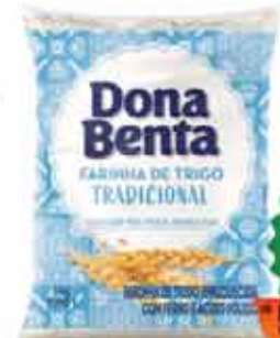
Farinha de Trigo Dona Benta 1kg Trad.