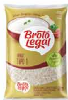
Arroz Tipo 1 Broto Legal 2Kg

Clube R$ 14,98 R$ 11,98 Limite por cliente: 15 unid.