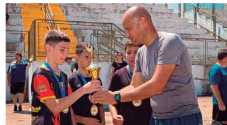
Foram formadas 20 equipes que participaram da competição realizada no dia 1º de novembro