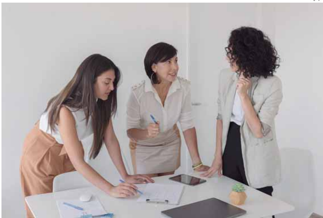
Pais registrou marca histórica do protagonismo da mulher à frente dos negócios nos últimos anos