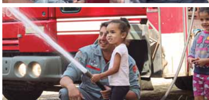
O projeto é uma parceria entre a Secretaria Municipal de Educação e a Coordenadoria de Meio Ambiente