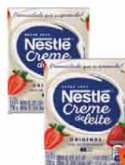
Cr. Leite Nestle 200g TP Trad.