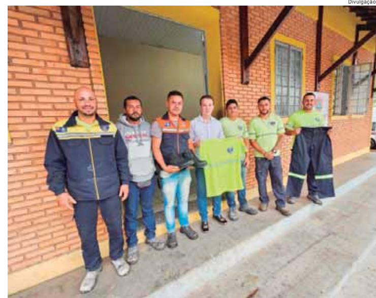
Uniformes foram recebidos na quinta-feira (7), na sede da Coordenadoria de Trânsito e Sinalização Viária