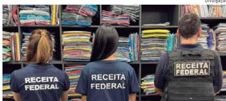
Operação "Barba Negra" entra em sua 2ª fase e aborda shopping no Brás/SP

País. A operação deve continuar nas próximas semanas. A prática dos crimes de contrabando e importação irregular lesa os comerciantes, importadores e produtores brasileiros que atuam na legalidade, havendo notória violação de direitos dos consumidores com produtos clandestinos e que não atendem aos requisitos de segurança.