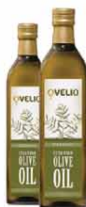
Azeite Ovelio 500ml Extra Virgem