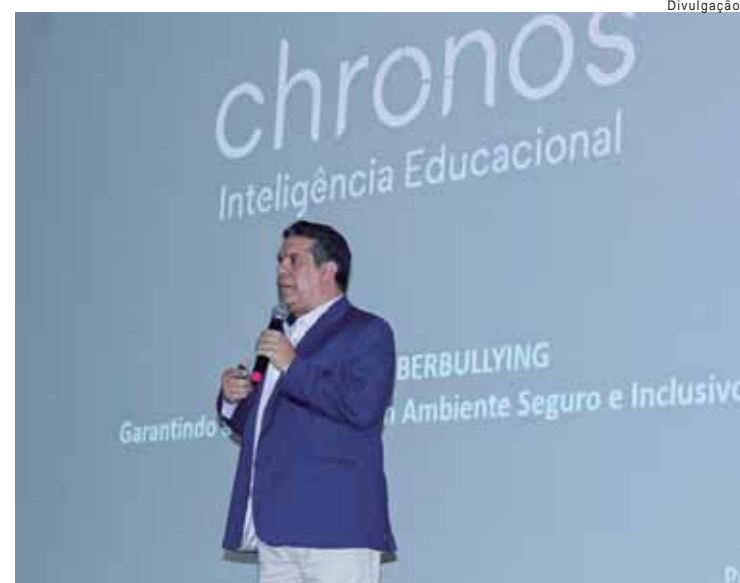
O evento aconteceu no dia 29 de outubro, no Centro de Convenções Jacintho José Fávoro

O nome do livro vencedor do Prêmio Jabuti 2024, categoria "Escritor Estreante - Romance" e em todas as demais categorias, será divulgado em uma cerimônia da Câmara Brasileira do Livro (CBL), em São Paulo, no próximo dia 19 de novembro.