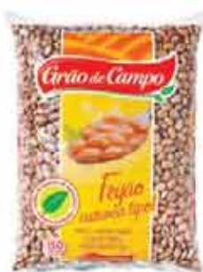
Feijão Carioca Grão de Campo 1Kg

Clube R$ 14,98 R$ 11,98 Limite por cliente: 15 unid.