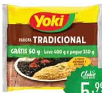
Farofa Mand. Yoki Lv. 400g Pg. 350g Trad.