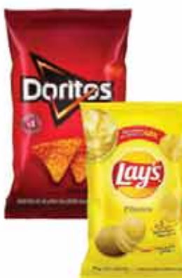
Salg. Doritos 120g ou Batata Lays 115g Classica