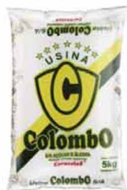
Açúcar Cristal Colombo 5kg