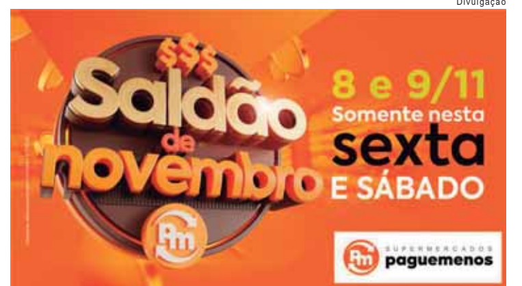
Saldão acontece nesta sexta e sábado, dias 8 e 9 de novembro