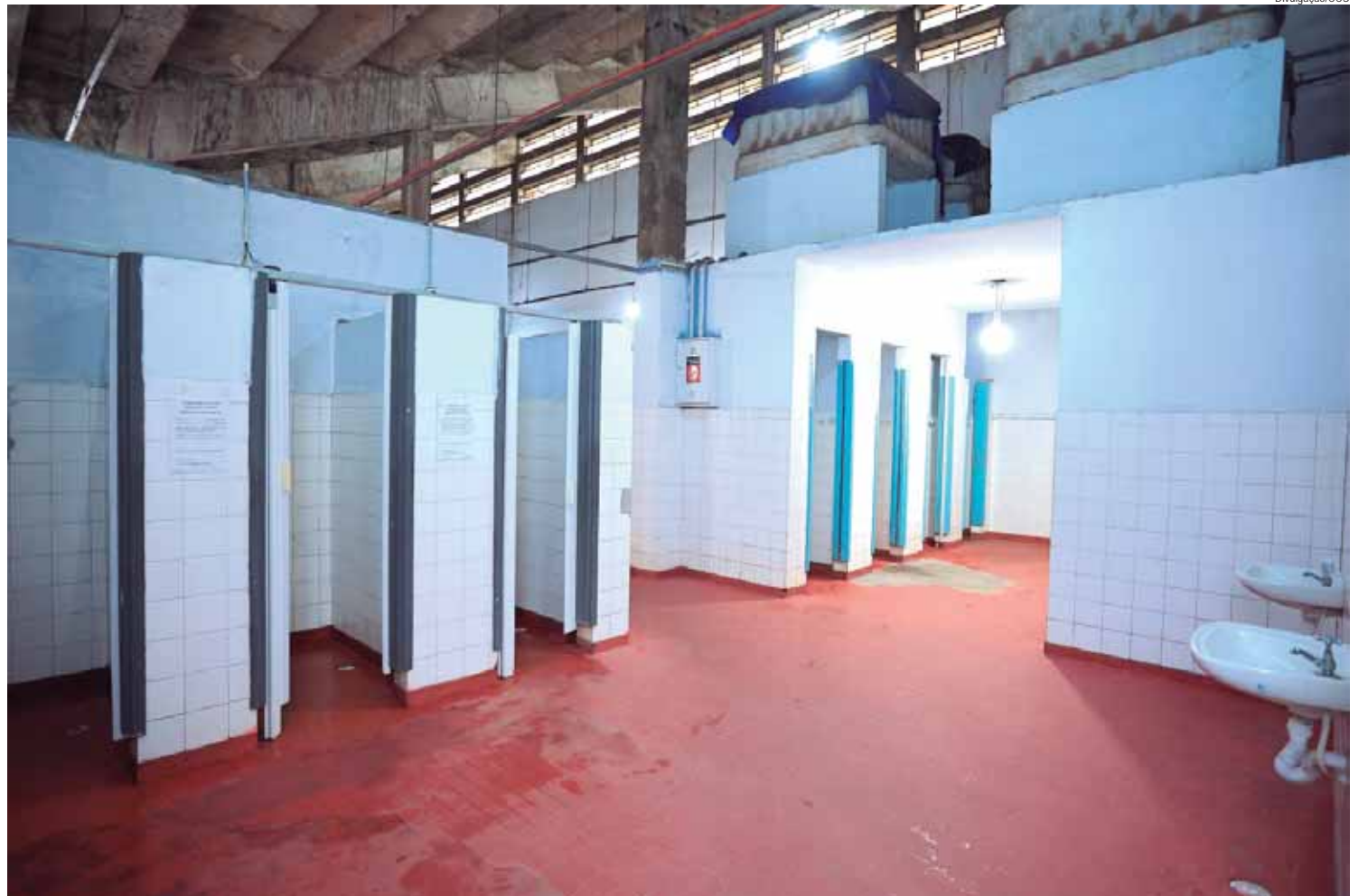
Área de vestiários que será reformada no Complexo Aquático municipal de Piracicaba

rado encontro dias passados e o tema foi: eleições de 2026. Isso é o que já corre todo o Brasil não só nas lides do MDB, mas de todos os partidos políticos.