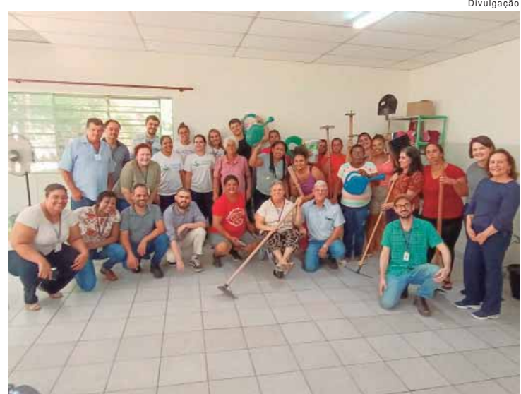
Integrantes do projeto, técnicos do Cras Mário Dedini e representantes da Smads, Sema e Esalq na entrega do kit horta