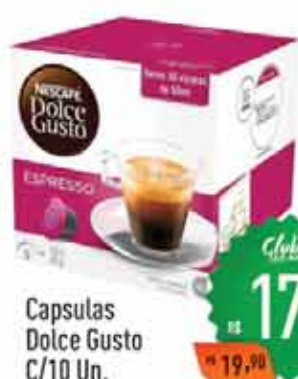
Capsulas Dolce Gusto C/10 Un.

Clube R$ 5,99 R$ 4,99 Limite por cliente: 24 unid.