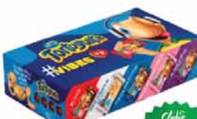
Chocolate Tortuguita Vibes Sortidos 134g