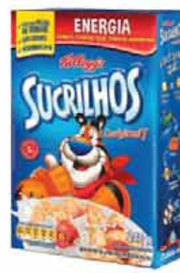
Cereal Kelloggs 240g/200g