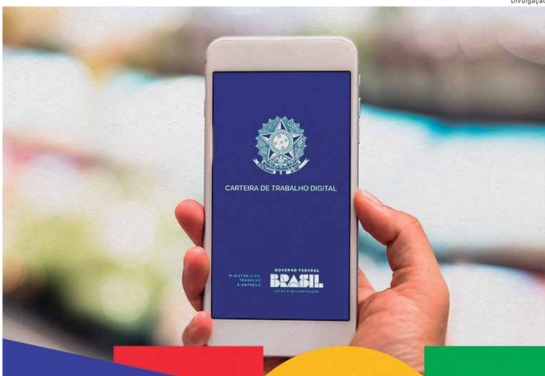
Modalidade cresce no Brasil com possibilidade de salários maiores, mas sem a segurança da CLT

CLT (Consolidação das Leis do Trabalho): Trabalhar com carteira assinada proporciona benefícios como férias remuneradas, 13º salário, FGTS e seguro-desemprego, além da estabilidade financeira. No entanto, há uma retenção de impostos e contribuições que pode reduzir o salário líquido do trabalhador. Por exemplo, um trabalhador com salário bruto de R$ 10 mil recebe, em média, R$ 7,5 mil líquidos mensais após os descontos.