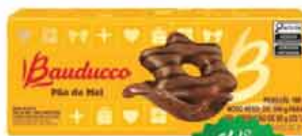
Pão de Mel Bauducco 180g Cob. Choc. Ao Leite