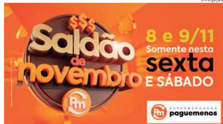
Saldão acontece nesta sexta e sábado, dias 8 e 9 de novembro

racicaba podem ser consultados no site https://piramobilitade.com.br/linhas-e-horarios/ . Para mais informações, os contatos são pelo telefone 0800 121-8484 ou pelo WhatsApp (19) 99635-6587.