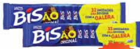
Choc.Wafer Bis 201,6g