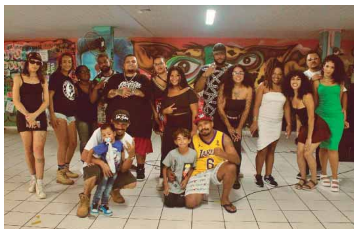
Evento acontece sábado, dia 9, às 13h, na praça Gustavo Teixeira

Sarau Mulheres da Leste - 110 anos de Carolina de Jesus Data: 9 de novembro Horário: 13h Local: Praça Gustavo Teixeira