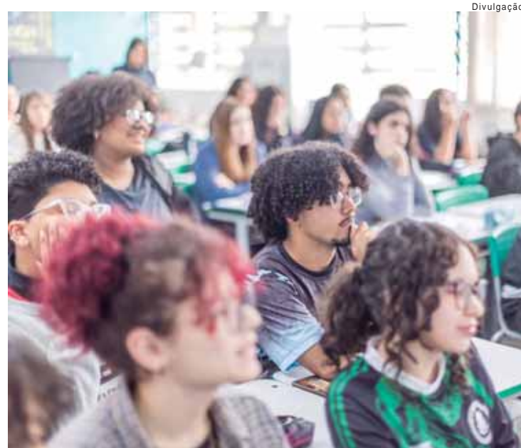
Disciplinas terão duas aulas a mais cada no 9º ano do Ensino Fundamental e na 3ª série do Médio; tempo de aula passa de 45 para 50 minutos

Calendário 2025 - A Seduc-SP também definiu o calendário do próximo ano. Em 2025, as aulas do primeiro semestre terão início em 3 de fevereiro. O recesso escolar do meio do ano está previsto para o período entre os dias 1º e 20 de julho. Para o cumprimento dos 200 dias letivos, estabelecido pela Lei de Diretrizes e Base (LDB), o fim das atividades está agendada para 9 de dezembro.