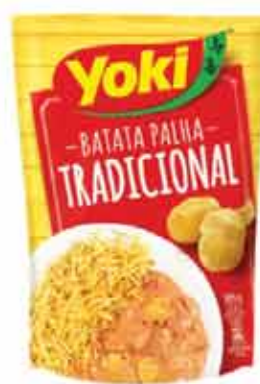
Batata Palha Yoki 105g