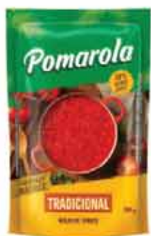
Molho Tomate Pomarola 300g Sc.Trad.