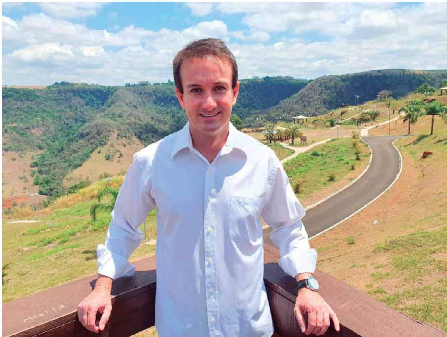
Prefeito Thiago Silva fala das melhorias na infraestrutura que também fortalecem o turismo