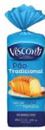
Pão de Forma Visconti Trad. 400g