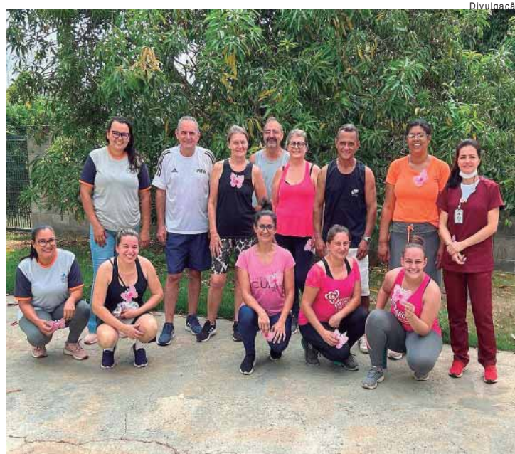
As aulas gratuitas acontecem todas as sextas-feiras, das 8h às 9h, na UBS Primavera

RESPIRAÇÃO - uma inspiração e expiração completas e consistentes ajudam o sistema circulatório a nutrir todos os tecidos do corpo; Concentração - onde é possível perceber o próprio corpo e manter a conexão corpo e mente durante os exercícios; Controle e centralização - ativação dos músculos do tronco para estabilização da coluna, ajudando restabelecer a postura adequada; Aprende - se a se movimentar com menor gasto de energia e ao mesmo tempo maior eficiência. A UBS Primavera fica na rua Jota, s/nº - Chácara Primavera. Telefone: (19) 3481-9479.