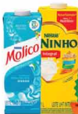
Leite Longa Vida Ninho/ Molico 1L

Clube R$ 5,99 R$ 4,99 Limite por cliente: 24 unid.