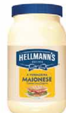
Maionese Hellmann's 500g