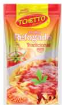
Molho Tomate Tchitto 300g SC Trad