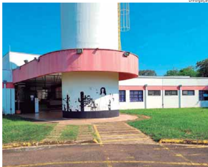
Os interessados poderão se inscrever através do site www.vestibulinhoetec.com.br

Técnico em Administração no período da noite. As inscrições vão até às 15h do dia 26 de novembro. Os interessados poderão se inscrever através do site www.vestibulinhoetec.com.br . Para realizar a inscrição é preciso CPF do candidato e pagamento, em rede bancária, da taxa de inscrição (R$39,85). O exame será presencial e ocorrerá no dia 15 de dezembro. A equipe da Etec ressalta: "Não perca a oportunidade de realizar cursos gratuitos e de qualidade!".