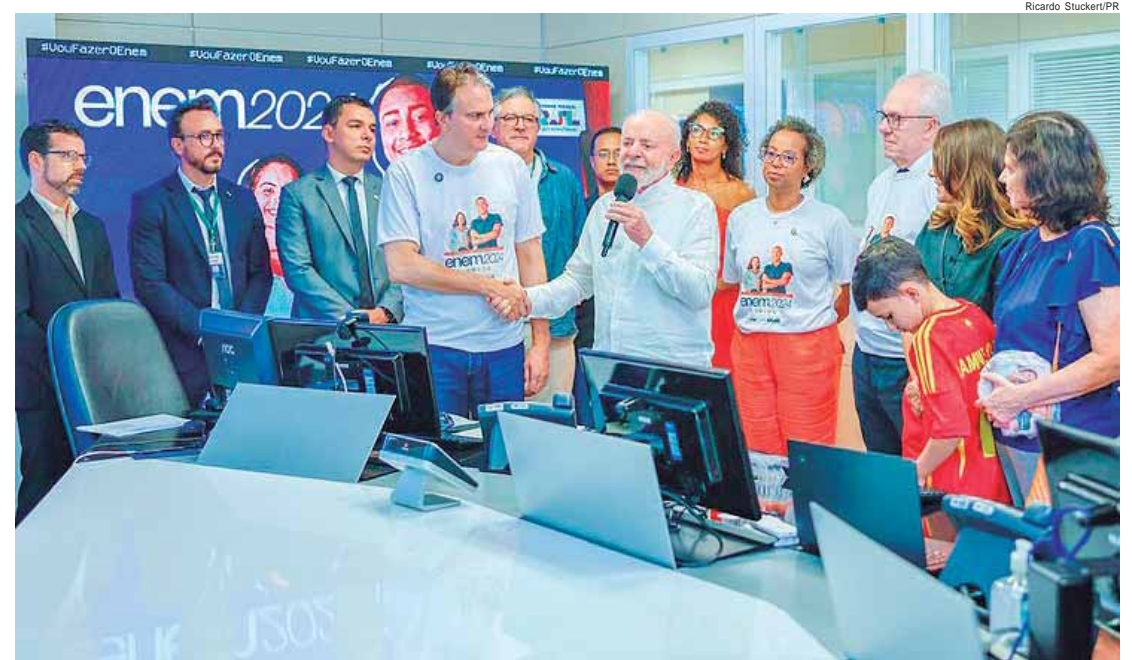
Presidente Lula e ministros durante visita à Sala de Situação e Monitoramento do Enem, em Brasília

"Vocês estudaram, se dedicaram, investiram muitas horas que vocês queriam fazer festa, participar de alguma atividade e, em vez disso, vocês se dedicaram a estudar. Agora é hora de bom humor e de agradecimento às pessoas que ajudaram vocês. É hora de beijar o pai e a mãe e agradecer pela dedicação. É hora de dedicarem os esforços que vocês vão fazer, meninos e meninas, aos pais de vocês. Se tem uma coisa que todo pai e toda mãe deseja é que seu filho e sua filha estejam formados. Por-