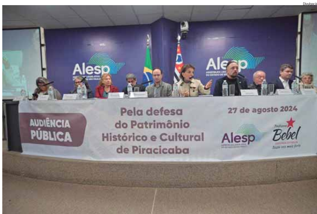
Audiência pública na Assembleia Legislativa alertou para os impactos que o projeto Boulevard Boyes provocará na orla do Rio Piracicaba