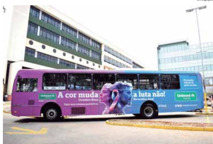
População poderá fazer exames de aferição de pressão no ônibus da saúde

Dentro da programação, haverá apresentação da Banda do Instituto Formar apresentando parte de seu repertório durante a ação, com temas nacionais e internacionais.