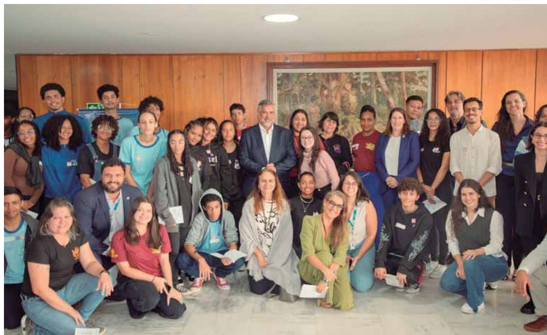
Encontro com ministro da Secom-PR encerrou dia de visitas e oficinas com foco no fortalecimento das habilidades em educação midiática

"São inúmeros os casos e vocês devem ter tido essa oportunidade de debaterem, de discutirem, de conhecerem. Nós apostamos muito que esse trabalho de educação midiática possa servir para a criação de uma cultura, para que as pessoas tenham