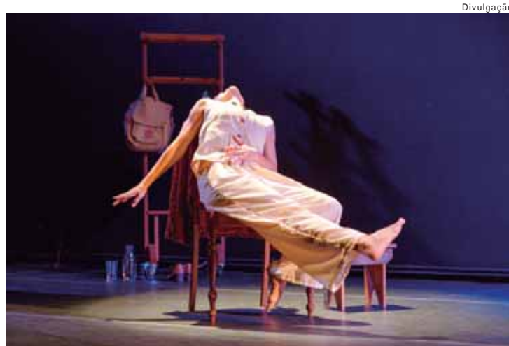
Espectáculos teatrais e oficinas integram a programação do Festival que tem entrada gratuita

A realização é da Prefeitura do Município de Piracicaba por intermédio da Secretaria Municipal da Ação Cultural, em parceria com SESI Piracicaba, SENAC Piracicaba, SESC Piracicaba, Movimento Liberdade Liberdade, Apite - Associação Piracicabana de Teatro e os teatros municipais Dr. Losso Netto e Erotides de Campos.