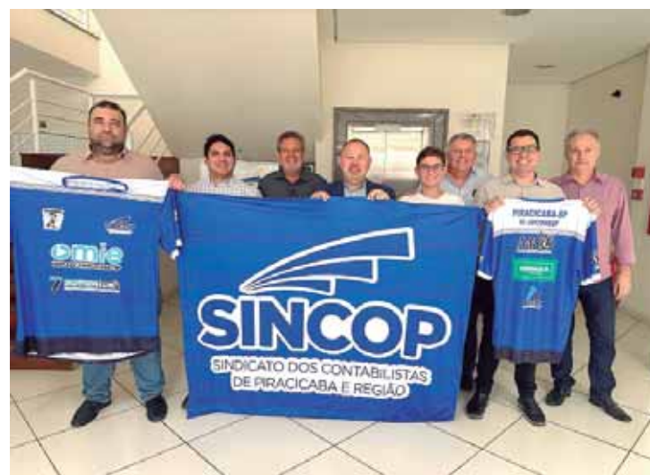
A delegação piracicabana estará no evento com mais de 120 representantes

HISTÓRICO - O Sincop conquistou o título da competição em 2012 (Campinas), 2013 (Piracicaba), 2015 (São Paulo),