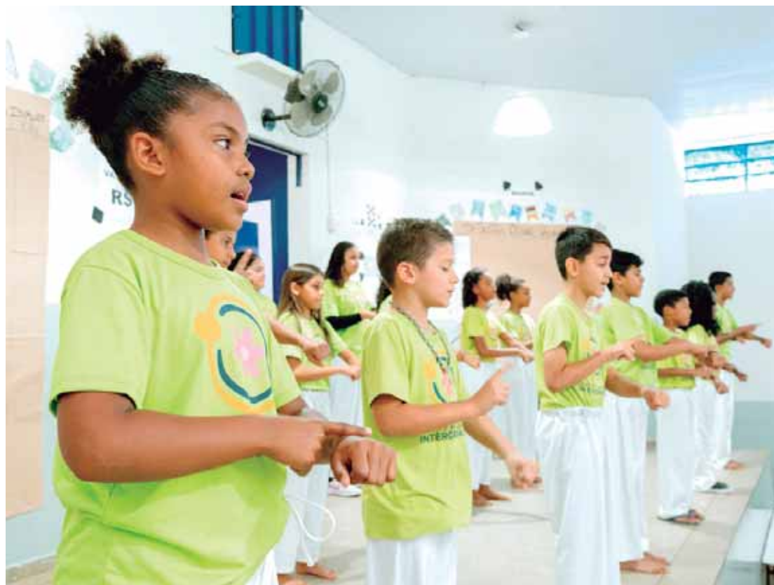
Apresentação cultural com crianças e adolescentes do CCInter