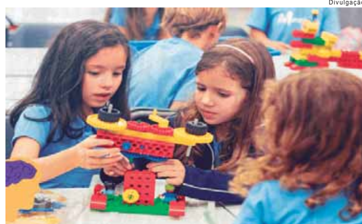
Prefeitura de Macatuba adotou aulas de robótica em três escolas do município

"A robótica exige colaboração constante e ativa entre os participantes, o que contribui para a ca-