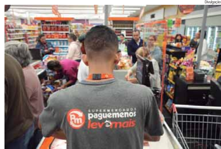
Com inauguração prevista para início de 2025, sexta loja em Campinas está com vagas abertas