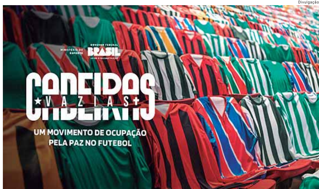
Jogo do Brasileirão entre Bahia e São Paulo será marcado por ação do Governo Federal