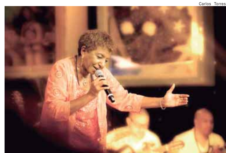
O show de Leci Brandão é destaque da programação da 11ª edição do Festival AfroPira

Para o ministro, a inelegibilidade exigiria que a petição tivesse força para abrir um processo político-administrativo antes da renúncia, o que não aconteceu no caso de Gesiel. A decisão destacou que o TSE não examina a fundo a tipicidade do fato que gerou a renúncia, mas apenas a existência ou não dos requisitos legais para inelegibilidade, os quais, segundo Nunes Marques, não se verificaram na situação do candidato.