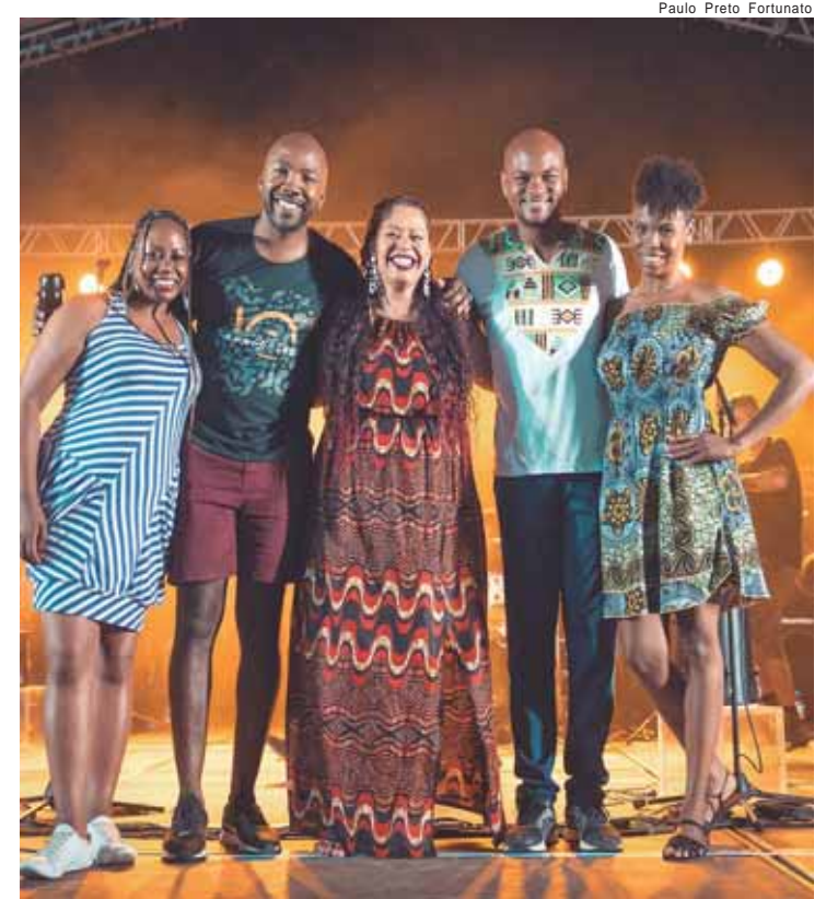
Diretores do Instituto Afropira

KIT - O Instituto Afropira está realizando a venda de um kit referente ao Festival Afropira 2024, com uma camiseta e uma caneca.