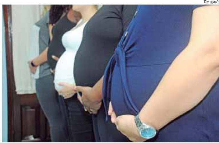
Curso de gestantes está com inscrições abertas no Santa Casa Saúde para novembro