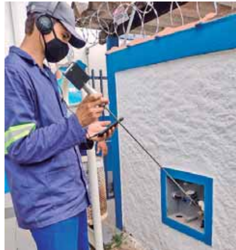
Cliente utilizando 4Fluid