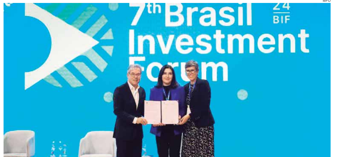
O Memorando de Entendimento formaliza estrutura para colaboração e cooperação que visa promover metas e objetivos compartilhados relacionados à Integração Regional Sul-americana

ROTAS - O projeto das cinco rotas de Integração e Desenvolvimento Sul-Americano busca incentivar e reforçar o comércio do Bra-