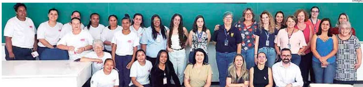
A palestra contou com a participação de 31 pessoas