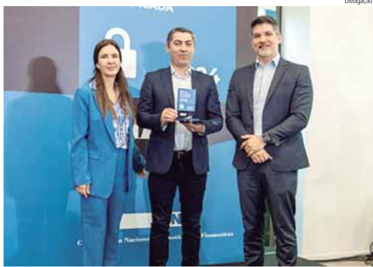
Sicredi é reconhecido pela CNF e Febraban pelo rigoroso combate e prevenção a fraudes e golpes