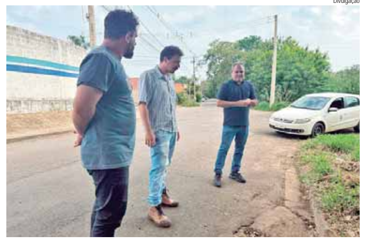
Projeto para a área prevê a instalação de um parque multifuncional, que incluirá pista de caminhada, parquinho, sanitários, quiosques, lanchonete e pedalinhos