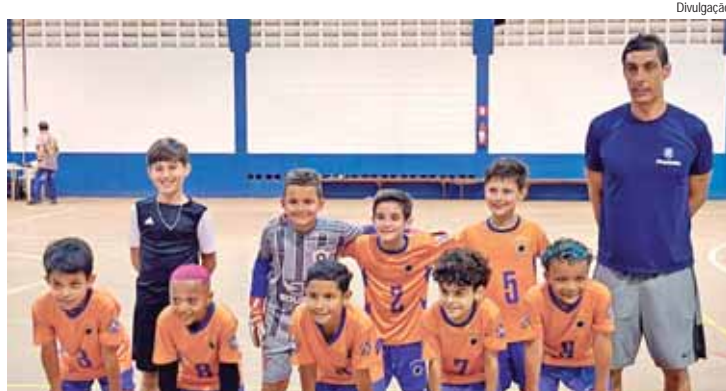
Elenco de futsal masculino sub-8 decide título, em Saltinho

A equipe de futsal masculino sub-8 do PDB (Programa Desporto de Base), mantido pela Prefeitura de Piracicaba, por meio da Selam (Secretaria de Esportes, Lazer e Atividades Motoras), decide nesta quarta-feira, 30, o título da Copa Portal Nova 15.