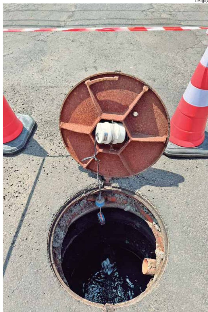
Medidores de nível são instalados nos PVs, identificando alteração nos níveis do esgoto