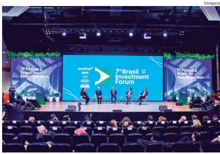
No 7º Fórum Brasil de Investimentos, presidente Décio Lima participou de painel que debateu os caminhos da indústria para a inovação sustentável