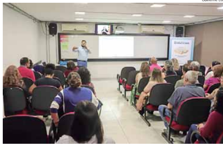
Oficina conduzida por especialista explorou normas de acessibilidade e práticas de inclusão em espaços públicos

Durante o evento, foram discutidos tópicos como a necessidade de terminologias corretas ao se referir a pessoas com deficiência e