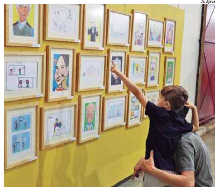
22º Salãozinho de Humor também foi inaugurado no Armazém 14

MURAL DO ZIRALDO - O 51º Salão de Humor marca o retorno do famoso mural Canecão do Ziraldo ao Engenho Central, exposto no Armazém 9. A obra, que foi