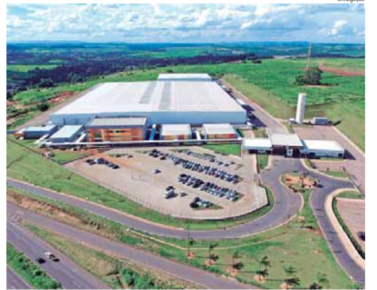
Chegada a Ribeirão Preto marca novo capítulo de crescimento na história de 35 anos