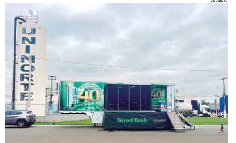
Agência móvel possui 15 metros de comprimento e está estacionada na entrada do Distrito Industrial Uninorte

A agência Smart Móvel está toda adesivada com a campanha do próximo aniversário da cooperativa de crédito intitulada Sicredi Dexis - 40 anos: Muda a Vida da Gente! A iniciativa que começou no último dia 25 de setembro, ao celebrar os 39 anos de história da Sicredi Dexis, segue até 25 de setem-