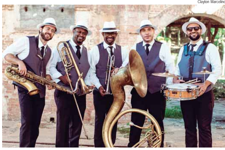
Banda Máfia do Jazz se apresenta no dia 2 de novembro, às 21 horas, em Águas de São Pedro