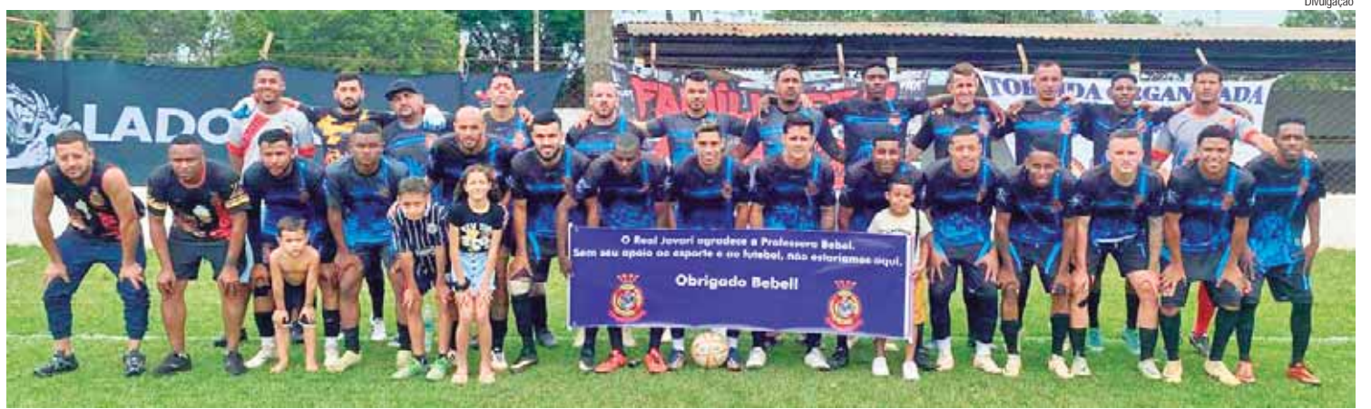
Equipe do Real Javari com faixa de agradecimento pelo apoio da deputada Professora Bebel

Para denunciar imóveis abandonados ou locais que tenham possíveis criadouros da dengue basta registrar solicitação no SIP 156 e outras orientações no PMCA pelo telefone (19) 3427-3351.