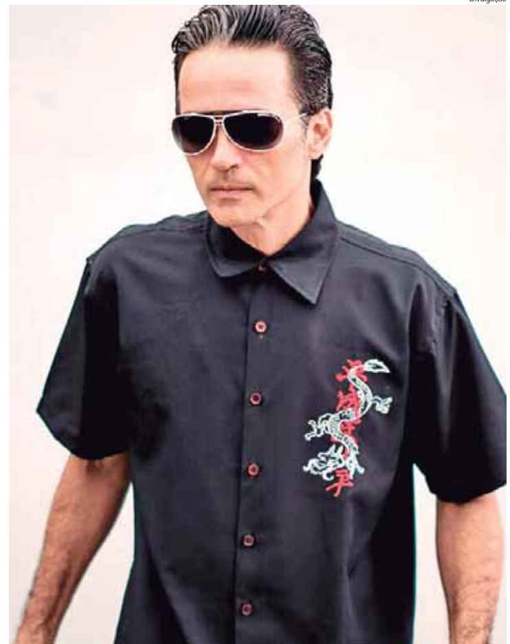
O músico Lúcio Maia, ex-Nação Zumbi, encerra o evento com sua badalada DJ Session

SERVIÇO In-Edit Day, dia 1º de novembro, no Sesc Piracicaba e Estaiada Beira Rio. Entrada gratuita. Programação: 18h30, Luiz Melodia - No Coração do Brasil" (Sesc); 20h15, Manguêbit (Sesc) e 22 horas, DJ Session com Lúcio Maia (Estaiada Beira Rio).