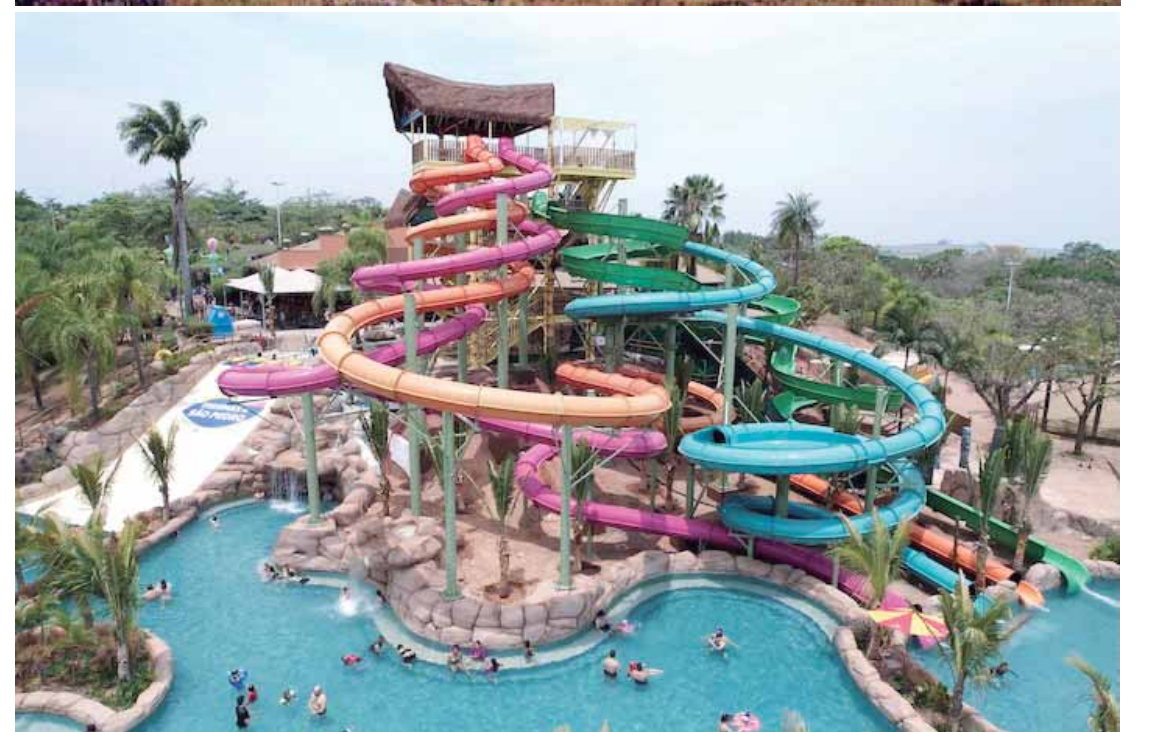
A Estância Turística reúne atrativos para quem busca relaxar, curtir uma aventura e ainda aproveitar um dos melhores parques aquáticos do Brasil

palmeiras que compõem sua paisagem exuberante. A atração reúne um complexo de tobogãs de padrões internacionais, com 17 metros de altura e arquitetura inspirada na região da Polinésia, que se integra ao cenário tropical pa-