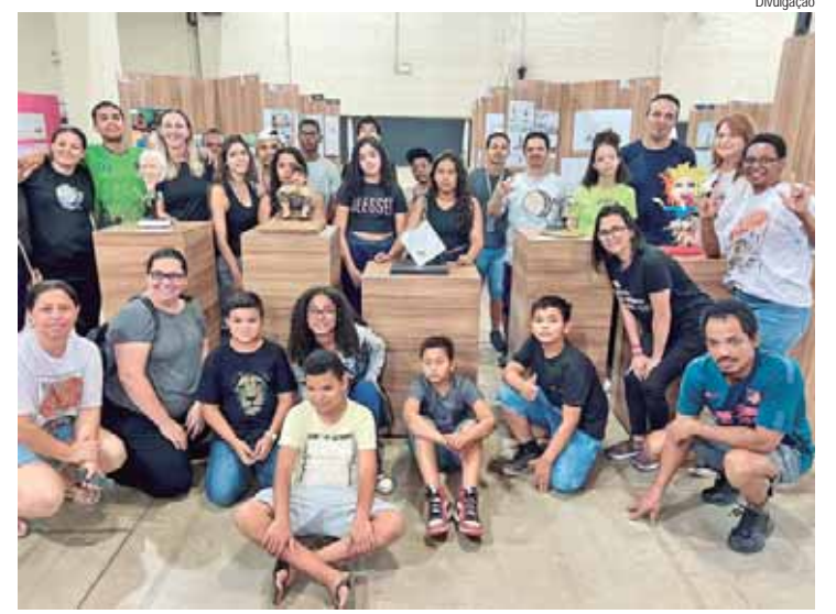
Grupo atendido pela Assupira durante visita ao Salão de Humor