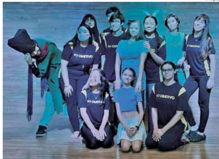
Alice – Uma Travessia Sobre a Imaginação, do grupo Skatá, encerra a mostra

Tradicionalmente, a mostra não possui caráter competitivo e após cada apresentação, os