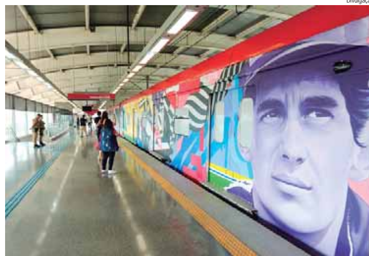
Um trem com 8 carros e 170m de pintura transforma-se na maior arte urbana em movimento e irá circular na Linha 13-Jade e no Expresso Aeroporto

Para retratar a primeira vitória de Ayrton Senna na Fórmula 1, durante o Grande Prêmio de Portugal em 1985, o artista Filite foi o responsável. Com um estilo que mescla realismo renascentista e abstrato experimental, Filite cria retratos híbridos e composições que exploram temas existenciais. O Tricampeonato Mundial é exaltado por Carlos Esquivel, conhecido como Acme, um dos precursores