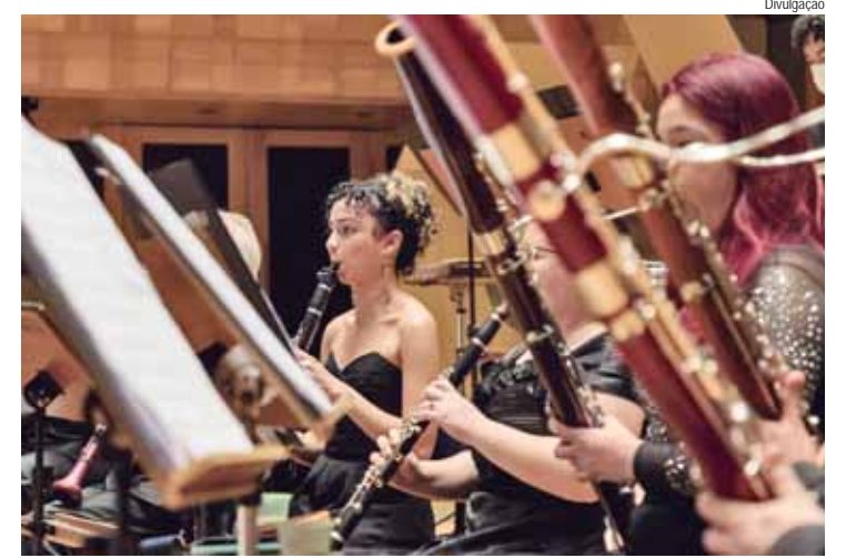
Serão selecionados 49 músicos, sendo 40% das vagas exclusivas para pessoas com deficiência