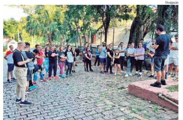
Passeio começa na portal do Engenho, na avenida Maurice Allain

A Prefeitura, por meio da Sema (Secretaria Municipal da Ação Cultural), promove a primeira edição noturna do passeio histórico no Engenho Central amanhã (30), às 19h, com participação gratuita da população. Nesta edição, chamada edição de Halloween, são 50 vagas e os interessados podem fazer as inscrições a partir de hoje (29), às 9h, pelo site https://doity.com.br/passeio-historico-do-engenho-central-edicao-halloween .