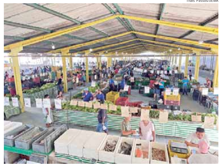
Varejão Central passou por reforma de piso inédita neste ano

O biografado, por sua vez, foi profissional da empresa francesa Rhodia, onde fez a sua vida ganhar em amplitude teatral em um palco imaginário do tamanho de Brasil. Esta história de Arthur Maurano poderá ser conhecida com a leitura da obra, a ser lançada no dia 7 de novembro, no teatro da Società Italiana di Mutuo Soccorso de Piracicaba, às 19 horas. O evento será aberto a todos os interessados e terá distribuição gratuita do livro.