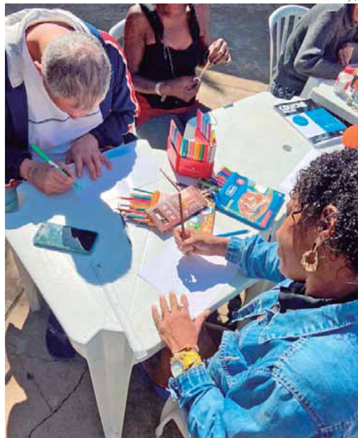
De acordo com o balanço divulgado pela equipe, foram abordadas aproximadamente 1.300 pessoas, incluindo homens (1.125), mulheres (167) e pessoas transgênero (8)

O segundo monitoramento das ações está previsto para janeiro de 2025, e as expectativas são de ampliação no alcance e na efetividade das ações preventivas.