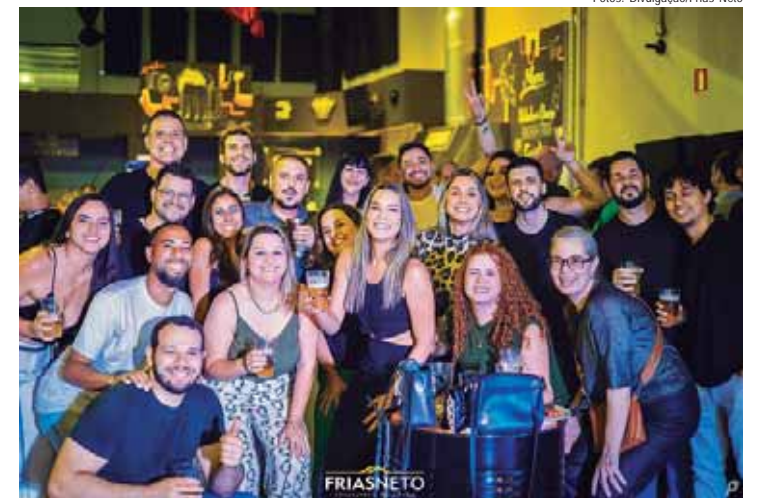
Equipe de locação Frias Neto