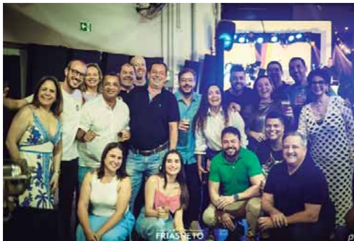
Equipe de vendas Frias Neto