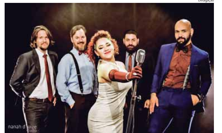
No sábado, dia 19, tem a banda Blood Mery e os Dry Martinis

A estância de Águas de São Pedro vai ficar repleta de atrações musicais e artísticas nos próximos três finais de semana. E quando acontece o Festival de Jazz 2024, na praça Dr. Otávio de Moura Andrade, no palco do Boulevard e também em apresentações itinerantes pela Avenida Carlos Mauro.