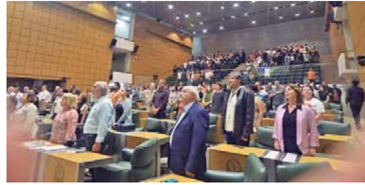
Autoridades e convidados prestigiaram a solenidade em homenagem ao Dia do Professor