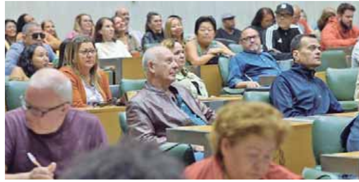
A solenidade destacou a importância dos professores na arte de ensinar