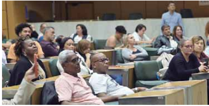
Professores e lideranças de diversas regiões do Estado de São Paulo prestigiaram a solenidade