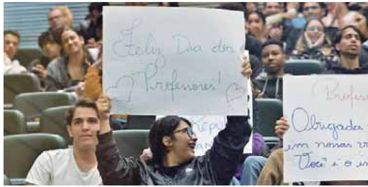
Na sessão, estudantes prestam homenagem aos professores