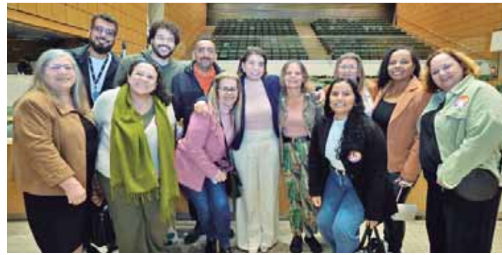
Bebel com um grupo de professores e assessores