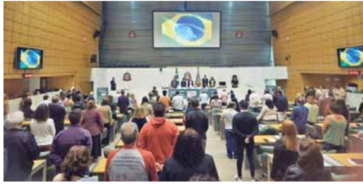
A sessão solene em homenagem ao Dia do Professor foi realizada no plenário Juscelino Kubitschek