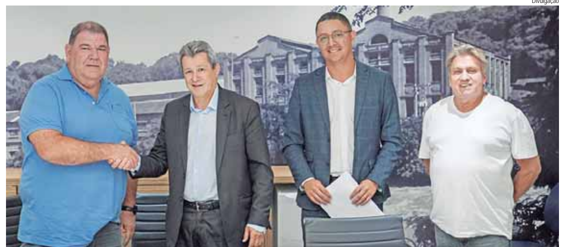
Aproximação com a Hyundai foi o principal motivo de escolher Piracicaba

A vinda da nova planta em Piracicaba é comemorada pelo