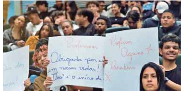
Diversos cartazes de homenagem a professores foram exibidos durante a solenidade