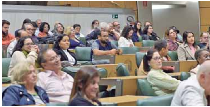
Diversos professores de Piracicaba e região estiveram na solenidade de homenagem à categoria