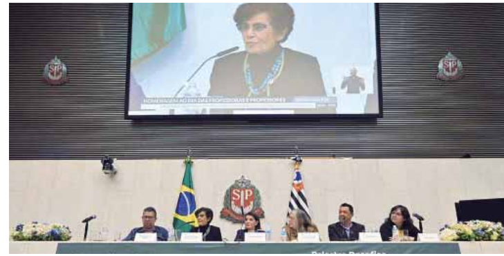
Sessão solene na Alesp em homenagem aos professores