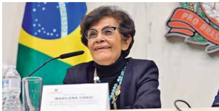
A filósofa Marilena Chauí que proferiu palestra durante a solenidade