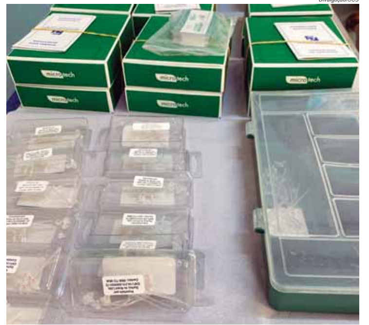
SMS adquiriu aparelhos auditivos em três modelos, sendo tipo A, B e C

ACESSO – Para os usuários do SUS terem acesso aos aparelhos