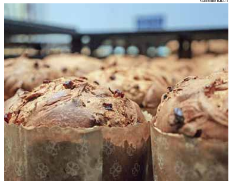
O panetone é um dos produtos de marca própria Coop mais antigo

Filho das Águas, dias 18 e 19 de outubro, às 20 horas, na Sala 2 do Teatro Municipal Dr. Losso Netto. Entrada Franca. Os ingressos devem ser retirados com uma hora de antecedência.