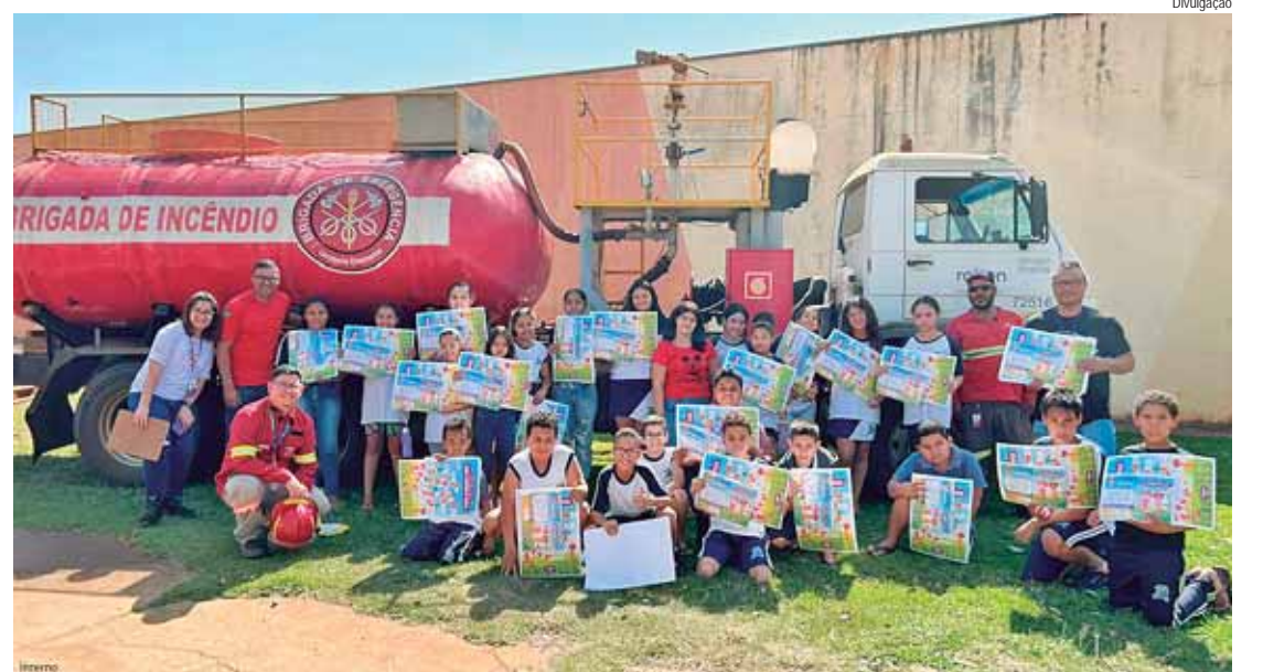
Campanha Quem ama a terra não chama o fogo em Jaú

"Engajamos nossos colaboradores e as comunidades para construir um futuro mais seguro e sustentável. A conscientiza-