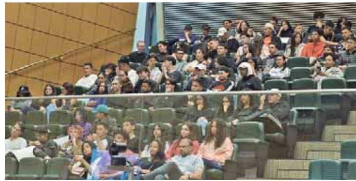
Estudantes também estiveram prestigiando a sessão solene na Assembleia Legislativa do Estado de São Paulo