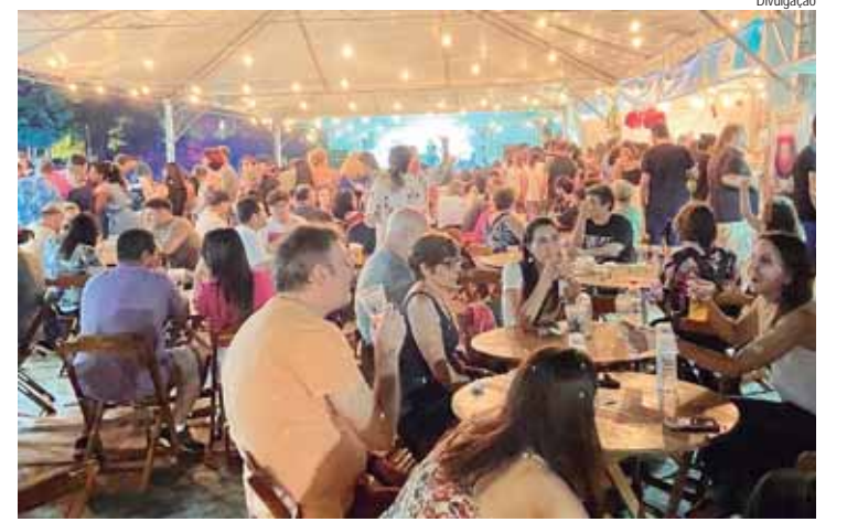
Evento com entrada gratuita acontece na Praça Doutor Otávio de Moura Andrade

Nos dias 19 e 20 de outubro, Águas de São Pedro se transforma no epicentro da gastronomia paulista com a realização da 9ª edição do Festival Gastronômico Sabores de Águas. Com entrada gratuita, o evento promete encantar os visitantes com uma experiência culinária única, celebrando a rica diversidade gastronômica local.