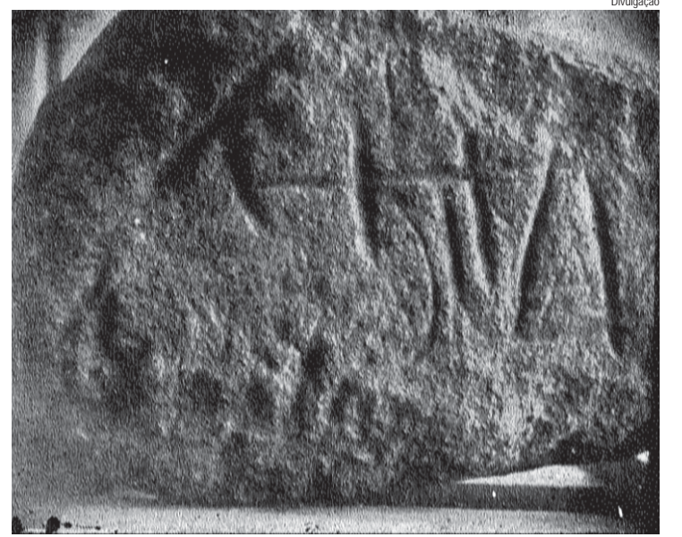
Pedra com gravura encontrada em Piracicaba está no documentário