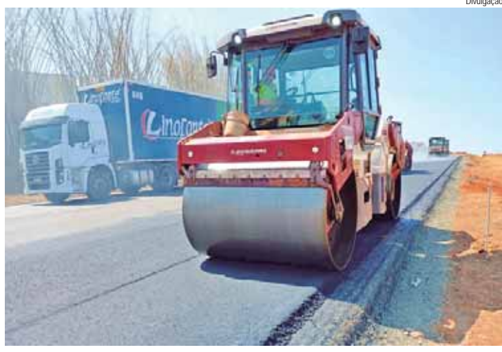
Trecho entre Corumbataí e Cordeirópolis ganhará terceira faixa em toda sua extensão, além de outras melhorias