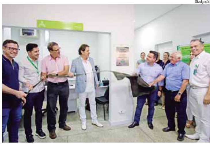
Posto Unimed Unileste foi inaugurado na terça-feira