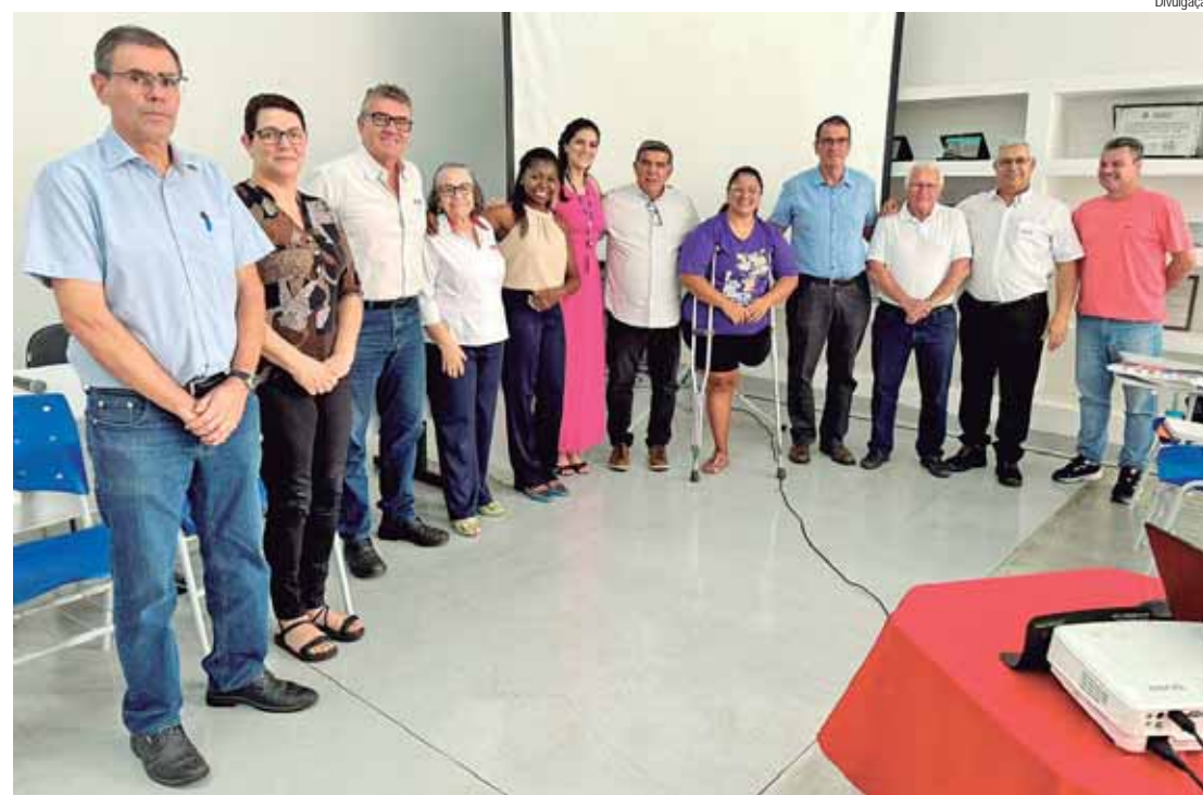
Luciano Almeida, prefeito de Piracicaba junto com membros e convidados que estiveram no SindBan nesta quarta (9) para discutir emprego e renda

O prefeito de Piracicaba, Luciano Almeida, esteve presente na reunião, e fez importantes contribuições para as discussões sobre a geração de emprego e renda na cidade. Almeida destacou a falta de mão de obra especializada como um desafio para as empresas, agravado pela falta de acesso de muitas pessoas ao ensino fundamental e médio. Para resolver esse proble-