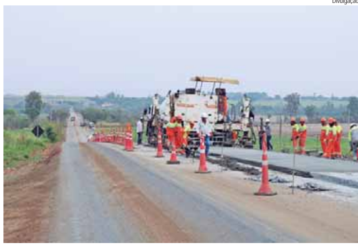
Pavimento atual encontra-se em situação precária, gerando constantes manutenções