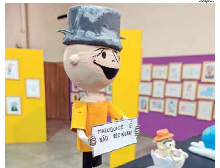
O Salãozinho conta com 153 trabalhos feitos por estudantes de escolas públicas e privadas da cidade

4º Concurso de Caipirinha da 17ª Festa do Peixe e da Cachaça. Inscrições até o dia 6. Ficha disponível no link https://forms.gle/DZ6HsixTFp6WB7DEA ou diretamente na Semdettur, rua Capitão Antonio Correa Barbosa, 2.233, 5º andar – Departamento de Turismo. O regulamento completo do concurso pode ser acessado no Diário Oficial do Município desta terça-feira, 08/10.