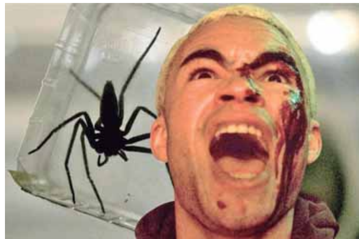
No terror francês Infestação, aranhas mortais que se reproduzem rapidamente causam pânico em prédio de apartamentos em Paris