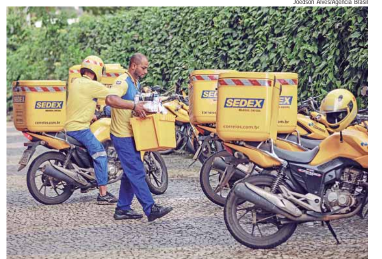
Unidade de distribuição dos Correios em Brasília

cia nacional, poderá ser feito em até 306 localidades espalhadas em todos os estados e o Distrito Federal, com as provas previstas para 15 de dezembro.