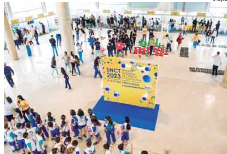
Entre os dias 15 e 19 deste mês acontece a 21ª Semana Nacional de Ciência & Tecnologia

Além da programação na sede do Instituto Pecege, a 21ª SNCT oferecerá exposições itinerantes nas cidades vizinhas como Limeira, Rio Claro e Capivari, assim como no Museu Luiz de Queiroz da USP/Esalq, em datas posteriores ao evento. Em 2023, o Pecege e as instituições parceiras realizaram a primeira edição do SNCT no Instituto, com diversas ações