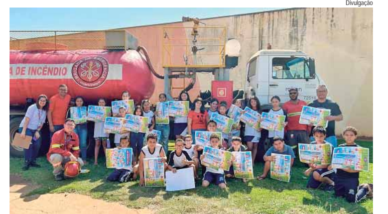
Voluntários da companhia estão visitando escolas infantis com jogos, histórias e apresentações para conscientização ambiental

A campanha inclui visitas a 16 escolas em cidades como Araraquara, São Carlos, Barra Bonita e Piracicaba, onde os estudantes participam de atividades educativas e assistem a demonstrações de segurança e equipamentos de combate a incêndios. As ações, que também contam com o apoio das