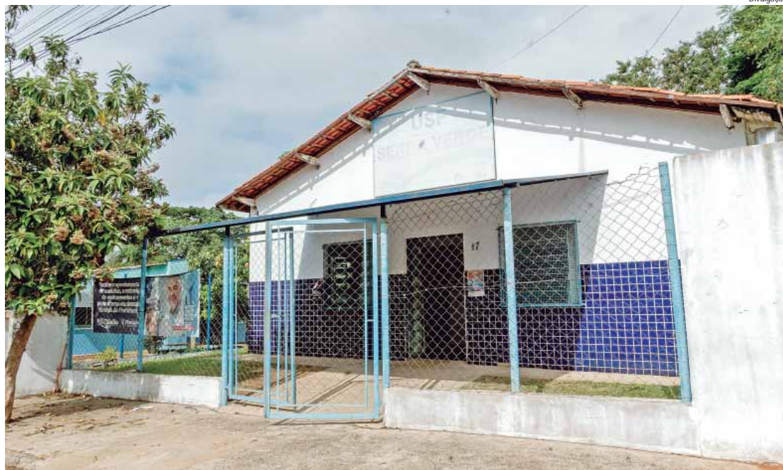
Obras na USF Serra Verde terão início no próximo dia 21