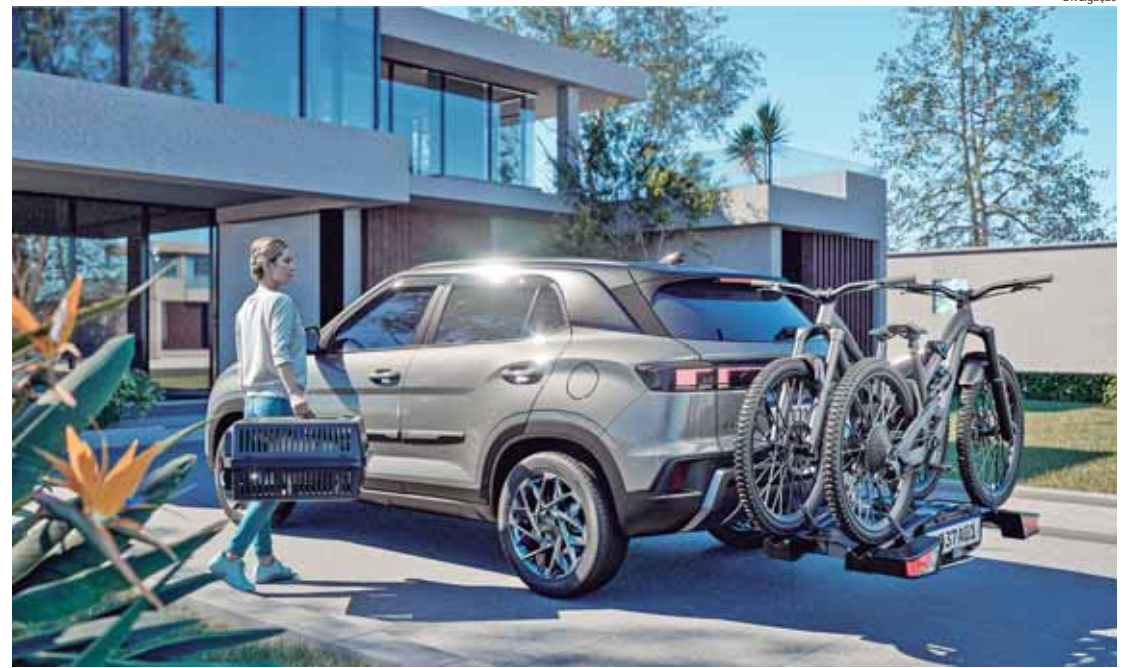
Suporte traseiro para bicicletas permite acesso fácil ao porta-malas e possui trava de segurança

REDE ORGANIZADORA DE PORTA-MALAS: Direta com tranquilidade. Seus