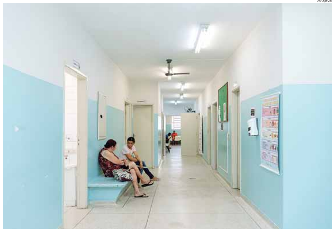
USF Jardim Esplanada passará por reforma completa

Conforme edital, na UBS Jardim Esplanada será feita a alteração do layout da recepção, trocando a posição da porta de entrada da unidade de local, reforma nos banheiros da recepção e banheiro no corredor. A área de armazenamento da farmácia será ampliada, será reformulada a sala de ginecologista. Todas as esquadrias, incluindo portas e janelas, serão trocadas. O piso da nova recepção será nivelado, e em toda unidade será feita a estuagem, polimento e aplicação de nova camada de resina em toda a unidade. Execução de novo muro de divisa e instalação de lixeira para lixo comum e lixo contaminado. Além disso, toda a unidade receberá nova pintura. Na UBS Vila Cristina (anti-