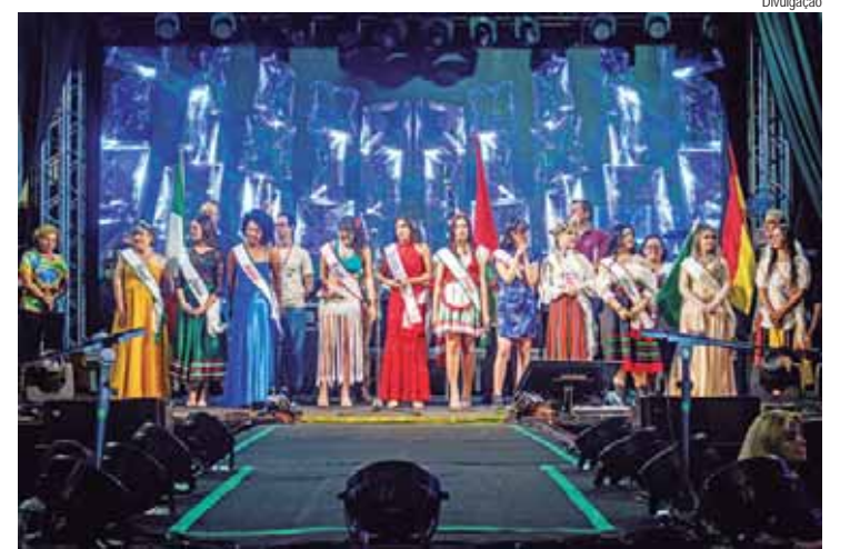
A 36ª Festa das Nações Beneficente de Nova Odessa acontece neste final de semana

As 11 entidades participantes da 36ª Festa das Nações Beneficente de Nova Odessa, que acontece neste final de semana, dias 11, 12 e 13 de outubro, já iniciaram a montagem da infraestrutura das barracas e do recinto da Praça dos Três Poderes. Quem passa pelo local já pode ter uma ideia do maior evento anual da cidade, junto à Festa de Aniversário de maio.