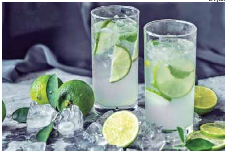
Caipirinha é tema de concurso que abre a Festa do Peixe e da Cachaça de Piracicaba

“A Festa do Peixe e da Cachaça é uma festa tradicional da Cidade e traz a união de dois importantes símbolos locais. A realização do concurso visa valorizar e demonstrar a versatilidade da be-