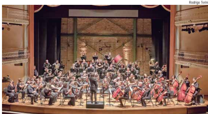
OEP faz Concerto da Primavera no domingo, 13, na Estação da Paulista

Com um repertório todo dedicado a esta estação do momento, a Orquestra Educacional de Piracicaba (OEP) apresentará o Concerto da Primavera neste domingo, 13, a partir das 10 horas, na Estação da Paulista. A entrada é gratuita.