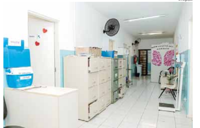
USF Serra Verde receberá obras de melhorias nas próximas semanas

É importante lembrar que nos dias 17 e 18/10, a unidade estará fechada para o atendimento ao público devido à mudança de prédio. Outras informações pelo telefone (19) 3428-8314.