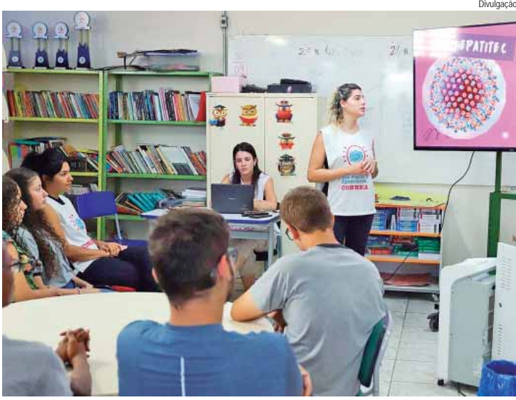
Iniciativa busca orientar adolescentes sobre ISTs e temas relacionados ao cuidado com o corpo e diversidade