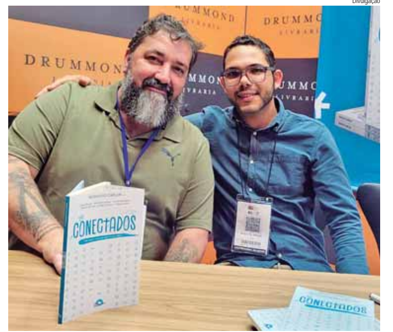
Lançamento da obra em São Paulo, durante a Bienal

Segundo o Governo de SP, são considerados cinco eixos estratégicos para formação de uma cadeia produtiva local: fornecimento de insumos; produção; transformação industrial; distribuição e comercialização; e apoio institucional (academia, setor público, terceiro setor, centros de educação e pesquisa, outros similares).