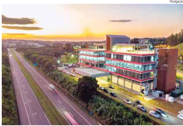
Graduação do Pecege utiliza tecnologias inovadoras e estratégias empresariais