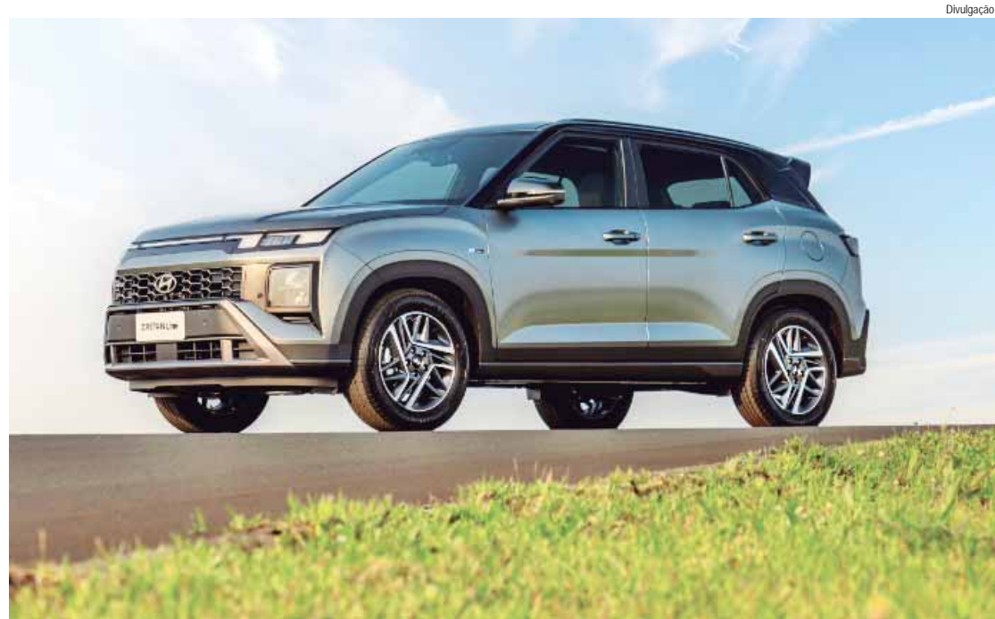
Preços de lançamento das versões com motor 1.0 turbo não sofrem alteração em relação à geração anterior

seguir as diretrizes apresentadas no aditamento intitulado "7 de setembro/12 de outubro" no site sincomerciopiracicaba.com.br, em Convenções Coletivas. Em caso de dúvidas ou mais informações, entrar em contato pelo telefone: (19) 3422- 0808.