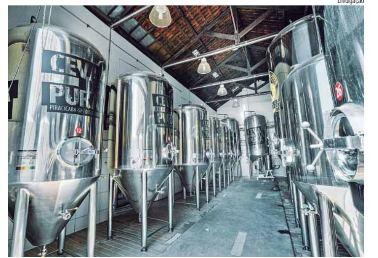
O tour é uma experiência pelas cervejarias artesanais de Piracicaba

O passeio tem três horas de duração e o embarque é feito em um dos bolsões de estacionamento da Rua do Porto, em frente ao Ca-