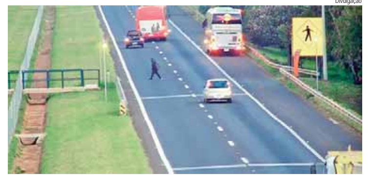
Novidade foi implantada pela Rodovias do Tietê em trecho da rodovia Marechal Rondon (SP-300), em Lençóis Paulista

A Rede de Supermercados Pague Menos tem metas desafiadoras, e cada nova loja que inaugura é um passo importante para estar ainda mais presente na vida de tantas outras famílias. O trabalho é feito com muito carinho e dedicação para cumprir o planejamento estratégico e levar a qualidade e os preços que muitos já conhecem para mais lugares. Cada novo espaço é pensado para oferecer uma experiência de compra ainda melhor, sempre com aquele atendimento que faz os Clientes se sentirem em casa.