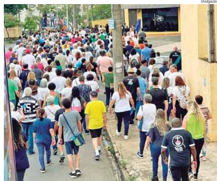
Caminhada Mariana é um ato de fé

Acontece no feriado de 12 de outubro, Dia de Nossa Senhora Aparecida, a 3ª Caminhada Mariana. A caminhada vai percorrer sete quilômetros e a saída é do ginásio municipal de esportes às 15h30. O término