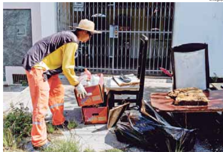
Arrastão da Dengue que passou pelo bairro de Anhumas no último sábado, 5

VACINAÇÃO - A aplicação da vacina contra a dengue em crianças e adolescentes na faixa etária entre 10 e 14 anos segue em Piracicaba. Para receber o imunizante é necessário apresentar documento de identificação com foto, Cartão Pira Cidadão ou Cartão Nacional do SUS. A imunização acontece em todas as unidades de