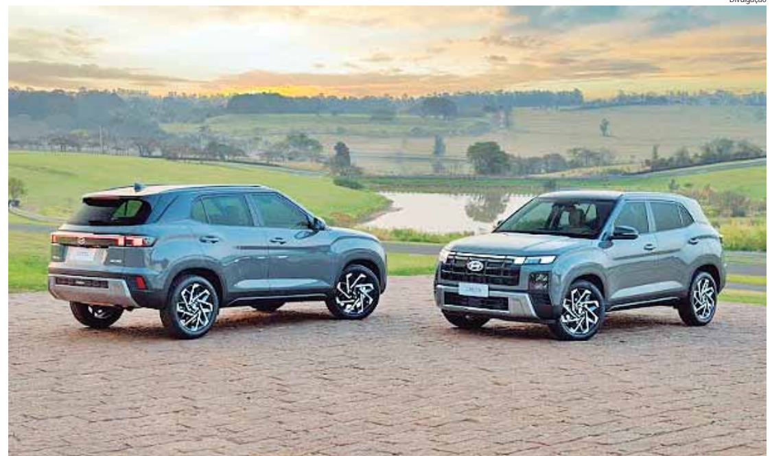
Pacote completo de segurança Hyundai SmartSense inclui funcionalidades como frenagem autônoma, permanência e centralização em faixa

A grande novidade da nova geração fica por conta da inédita