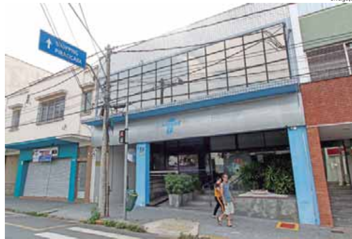
SP Produz tem como objetivo fortalecer as cadeias produtivas locais do estado

PROGRAMA SP PRODUZ - O Programa SP Produz tem como objetivo fortalecer as cadeias produtivas locais do estado, estimulando a auto-organização de aglomerações produtivas setoriais e promovendo o desenvolvimento econômico regional, que contribui para reduzir as desigualdades entre as regiões do estado. A organização em cadeias produtivas tem o objetivo também de diminuir os custos de