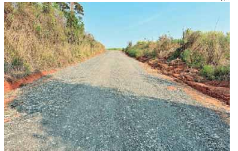
Manutenção na estrada do Horto Florestal de Tupi

Atendendo ao cronograma diário de atividades e solicitações de moradores da zona rural, a Prefeitura de Piracicaba, por meio da Sema (Secretaria Municipal de Agricultura e Abastecimento), esteve na última semana, de 30/09 a 04/10, realizando melhorias em quatro bairros rurais. A equipe está realizando a manutenção com lajão britado na estrada PIR 080, que