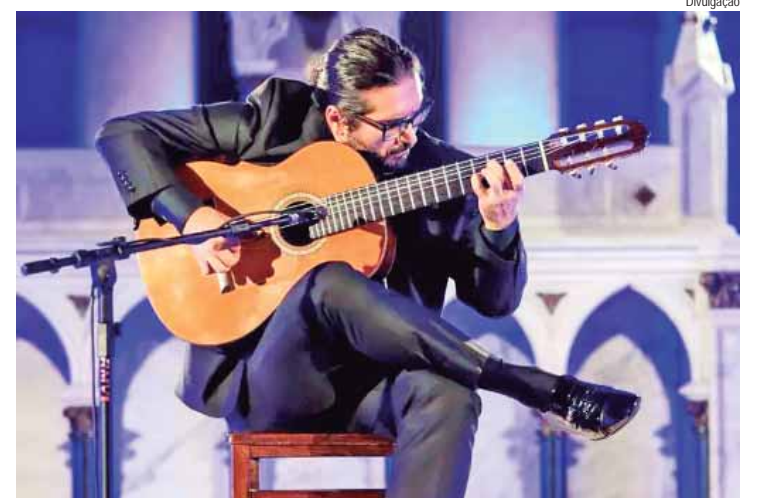
O músico Alessandro Penezzi durante apresentação

O Teatro Erotides de Campos, no Engenho Central, recebe hoje, 9, às 20 horas, o 2º Encontro Penezzi Choro Camp - Festival de Choro. O espetáculo será uma celebração da tradição do choro, com interpretações de clássicos e composições originais. Os ingressos podem ser retirados uma hora antes do espetáculo, na bilheteria do Teatro do Engenho. A entrada é gratuita.