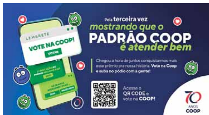
A Coop possui mais de 1 milhão de cooperados ativos e 35 unidades

"Desse volume, as reclamações não chegam a 1%. Podemos afirmar que são questões de fácil solução ou apenas de um mal-entendido. A indicação da Coop para esse importante prêmio é o reconhecimento de seu comprometimento e respeito a cada um de nossos cooperados e clientes", reforça Monique Mendes Roque.