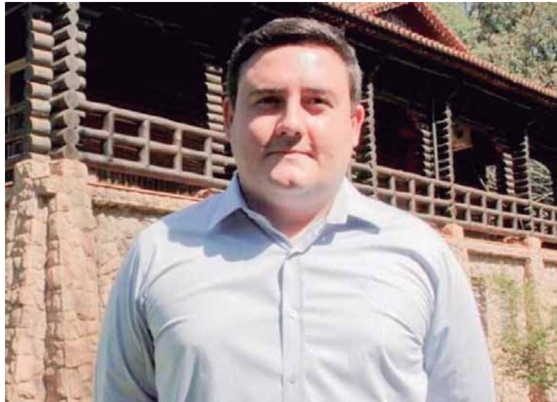
Denúncia do Ministério Público Eleitoral foi feita dia 9 passado