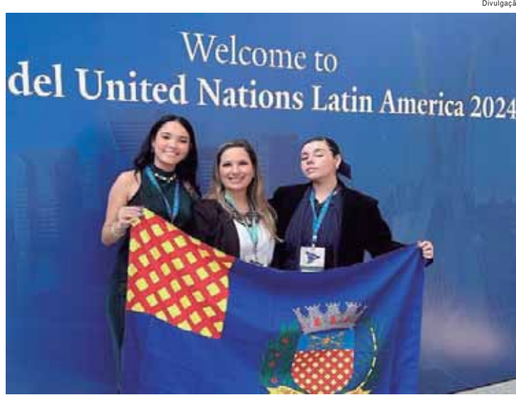
As estudantes participaram da primeira simulação YALE MUN Latam no Brasil