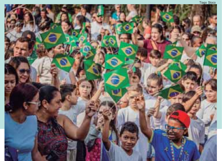
Tema deste ano foi "Gigante pela Própria Natureza - O Resgate do Nosso Legado Verde"

estimado de 6 mil espectadores, o evento cívico-militar contou, ainda, com cerca de 3 mil pessoas desfilando em uma vibrante celebração que reuniu estudantes, militares e representantes da sociedade civil. A5