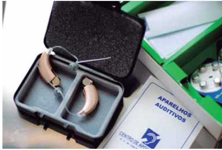
A ação aconteceu na quarta-feira, dia 11, na segunda unidade do Hospital São Lucas