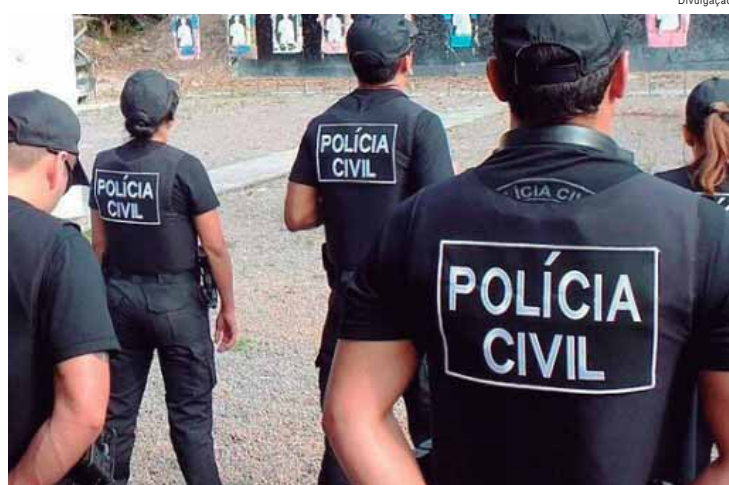
São Paulo continua pagando mal a Polícia Civil e sem apresentar propostas efetivas de reestruturação dos salários e da carreira

A presidente ainda reforça que, a falta de uma política de progresso na carreira da Polícia Civil, com critérios objetivos e transparentes, também desmotiva e leva às baixas na instituição. "Como já falado anteriormente, a evasão continua faz com que os policiais civis que estão em atividade sejam submetidos a uma alta sobrecarga de trabalho, o que também leva ao adoecimento de muitos profissionais".