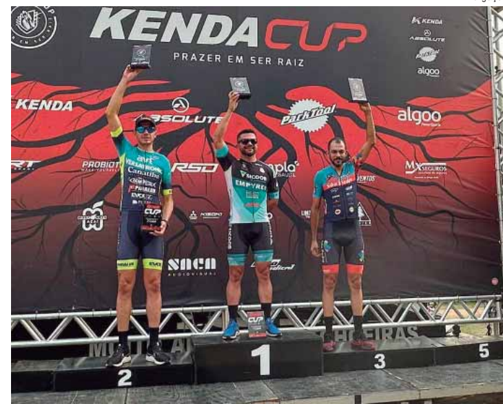
Competidores de São Pedro conquistam bons resultados na Kenda Open Kup, uma das principais maratonas em Mountain Bike