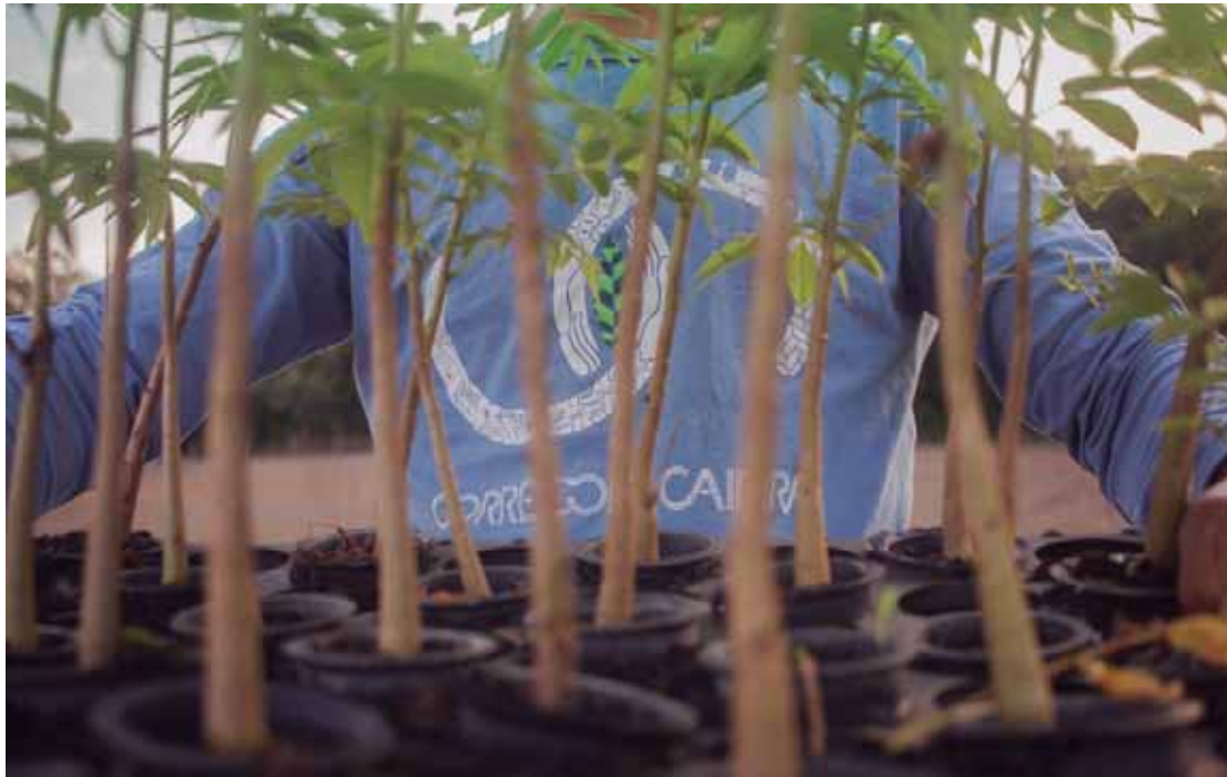
Iniciativa desenvolveu propostas para a recuperação de áreas degradadas na região

Para especialistas do projeto, é fundamental considerar políticas