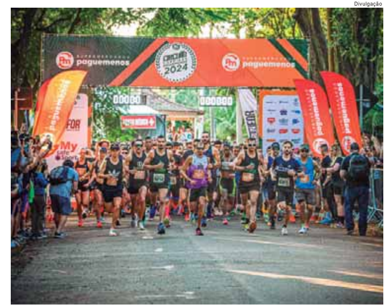
A próxima parada é em Piracicaba, no dia 29 de setembro, com largada às 7h

(ABRAS). Atualmente, possui 36 lojas em funcionamento nas cidades de Americana, Araras, Artur Nogueira, Boituva, Campinas, Hortolândia, Indaiatuba, Itu, Limeira, Mogi Guaçu, Nova Odessa, Paulínia, Piracicaba, Santa Bárbara d'Oeste, Salto, São João da Boa Vista, São Pedro, Sumaré, Tietê e Valinhos. A empresa possui um Complexo Administrativo, Logístico e Entrepósito de Carnes em Santa Bárbara d'Oeste, com 200 mil m². Com mais de 7 mil colaboradores, segue em constante expansão. A fórmula do bom atendimento, somada aos produtos de qualidade e aos preços imbatíveis, faz da varejista sinônimo de qualidade, economia, comodidade, competência e variedade. Supermercados Pague Menos "Faz Sua Vida Melhor".