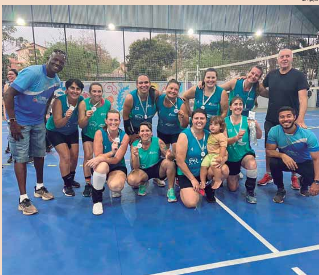
A competição foi realizada em parceria com a Associação Desportiva Vôlei Mãozinha