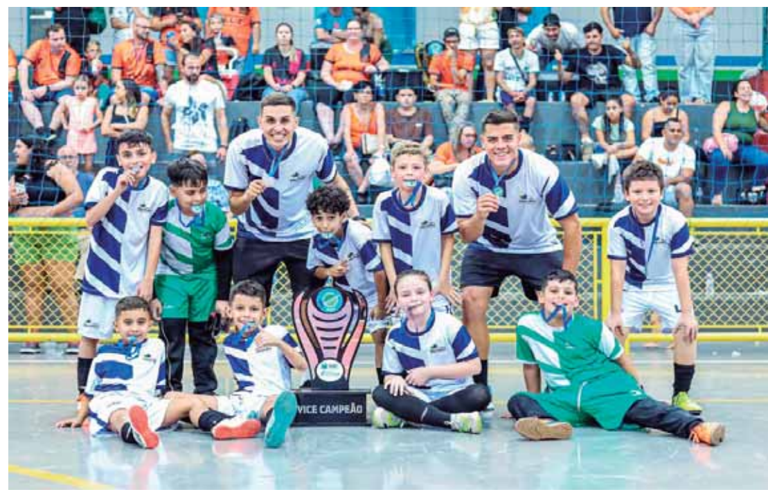
Tuma da Sub 9 ficou com o vice-campeonato