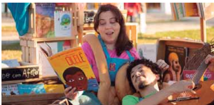
Teatro, música, literatura, passeio cultural e as finais dos tradicionais concursos de poesias são os destaques da programação

Contação de histórias também é o tema da atividade do dia 25, quando a Cia Clara Rosa realiza leituras com afeto, um circuito com atividades lúdicas e brincantes que oferece experiência acolhedora para protagonizar o livro, o leitor e a literatura para infâncias. A atividade acontece na Biblioteca Municipal Gustavo Teixeira, às 10h e às 14h.