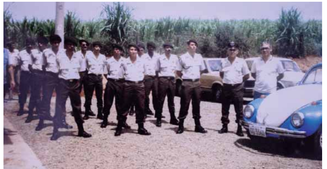
A Guarda Civil Municipal de São Pedro foi criada em 12 de setembro de 1984, por meio do Projeto de Lei 1439/84, pela então prefeita Antonieta Eliza Ghirotti Antonelli

priedades e imóveis na central de monitoramento, com localização via GPS para o pronto acionamento das forças policiais.