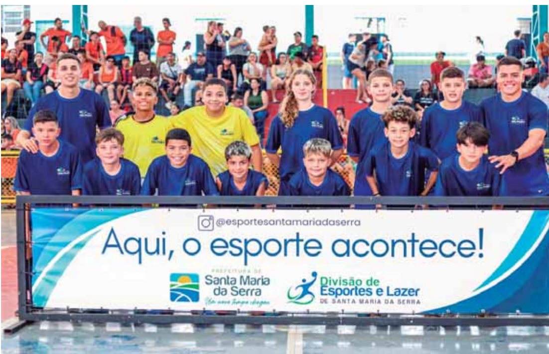
Equipe da Sub 13 também foi campeã