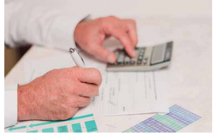
Plataforma beneficia transportadores autônomos, pequenos produtores rurais e microempreendedores individuais (MEIs)

O Corredor Caipira é realizado pela Fundação de Estudos Agrários Luiz de Queiroz (Fealq) e pelo Núcleo de Apoio à Cultura e Extensão Universitária em Educação e Conservação Ambiental (Nace-Pteca) da Escola Superior de Agricultura Luiz de Queiroz/Universidade de São Paulo (Esalq/USP). O patrocínio é da Petrobras, por meio do Programa Petrobras Socioambiental.