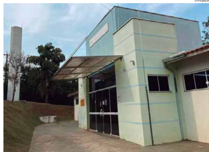
Vacinação será neste sábado, dia 14, das 8h às 12h

Cães bravos ou mordedores, de qualquer raça, devem utilizar focinheira apropriada e guia. Os gatos devem ser levados em caixas de transporte, gaiolas ou fronhas. A ação faz parte de cronograma planejado para todo o ano. A UBS Primavera está na rua Jota, sem número. Mais informações (19) 3481-9473.