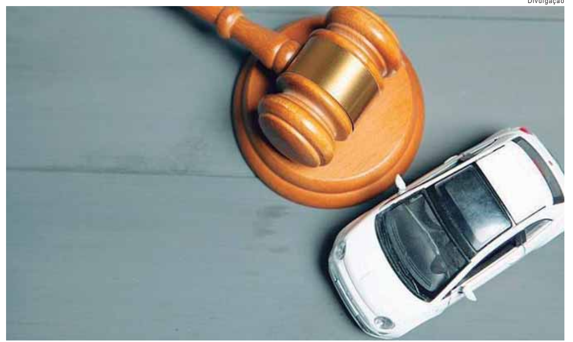
Ao todo, serão 625 veículos com condições de circular pelas ruas em Itapeçerica da Serra e Jujutiba, além de lotes de sucata para desmonte ou reciclagem

Há regras para o lance. No caso dos carros em condições de circular, de acordo com o edital, o valor entre um incremento e outro