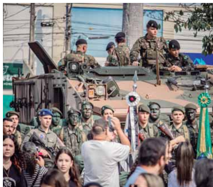
Caracterizados com os temas do desfile, aproximadamente 2 mil alunos, representando as 23 escolas da rede municipal de ensino, desfilaram pelas ruas de São Pedro