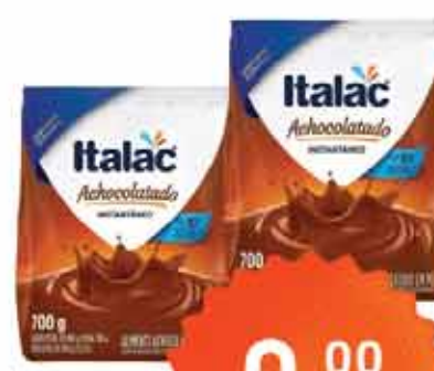
Achocol Italac 700g SC Inst. Emb. Econ.