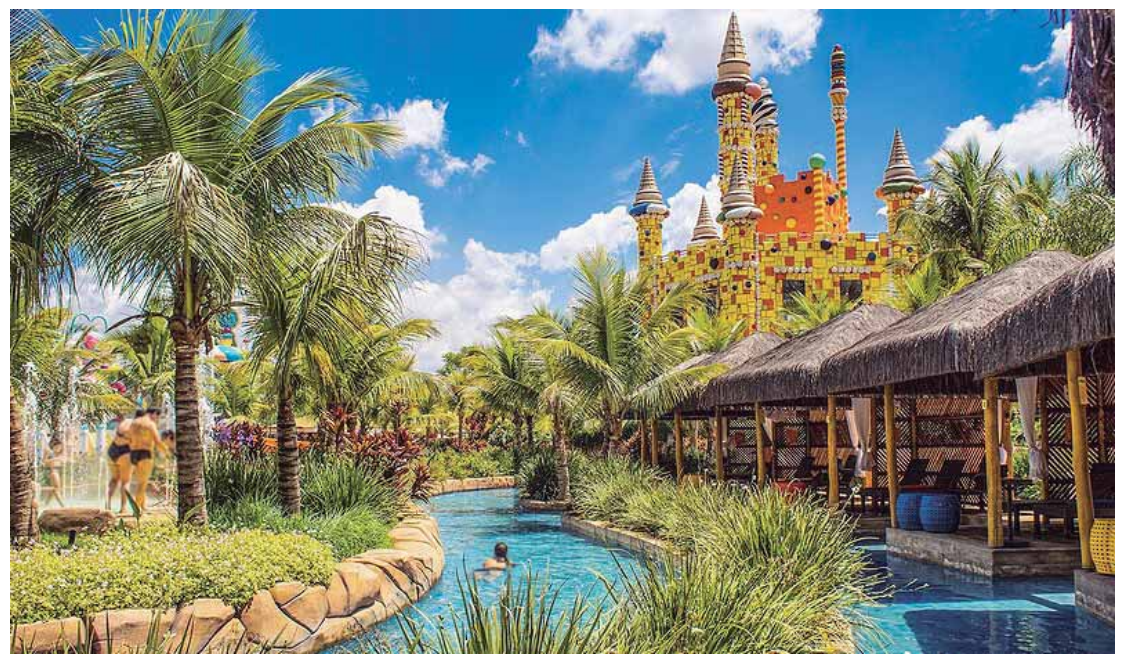
O evento terá início no feriado de 7 de setembro e acontecerá aos sábados e domingos do mês

Em setembro, o parque aquático Thermas de São Pedro levará seus visitantes para uma jornada ao redor do mundo, sem sair do lugar. O festival gastronômico Thermas das Nações promoverá uma experiência por diferentes culturas, reunindo cores, sabores e ritmos para explorar o melhor que cada país tem a oferecer, em uma celebração da diversidade que nos une. A cada final de semana, uma nação estará muito bem representada no parque, com comidas típicas, música ao vivo, apresentações culturais e atividades divertidas para a família toda curtir junto.