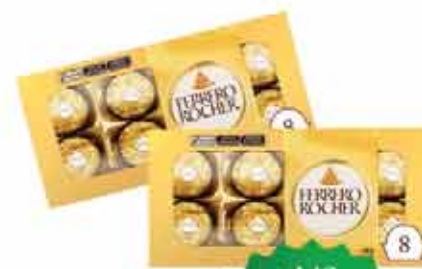
Chocolate Ferrero Rocher 100g