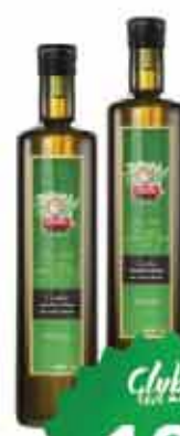
Óleo Misto Faisão 500ml