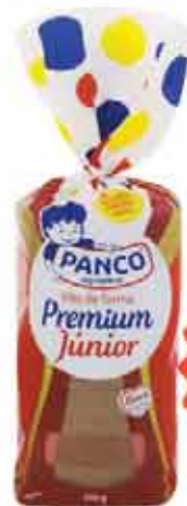
Pão Forma Panco 350g Junior