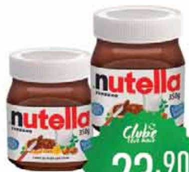
Cr. Avelã Nutella 350g