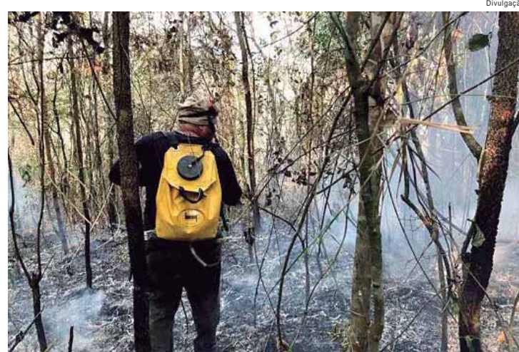
São 15 novas equipes, mais equipamentos e veículos em ação nos próximos 2 meses para evitar queimadas nas áreas de conservação