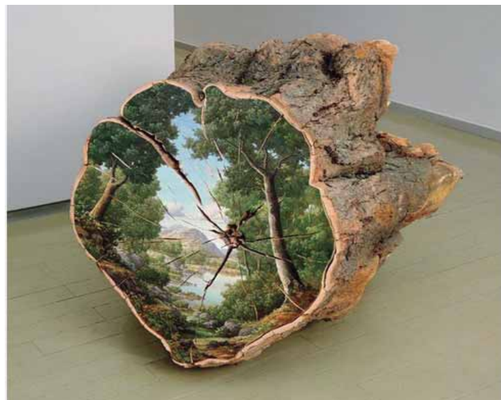
Exemplo de pintura