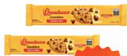
Bisc Cookie Bauducco original 100g