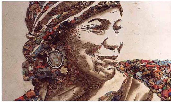
Exemplo de colagem

Com essa iniciativa, a Prefeitura de São Pedro visa engajar jovens e a comunidade em uma reflexão mais profunda sobre questões ambientais, usando a arte como meio de expressão e transformação social. "SustentARTE" promete ser um marco na mobilização para a sustentabilidade, inspirando o público a adotar atitudes mais conscientes em suas rotinas.