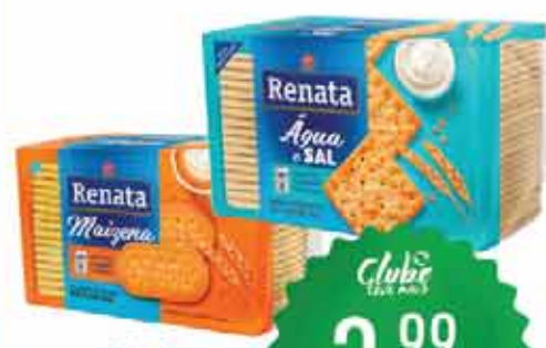
Bisc Renata 360g Maizena/ Cracker