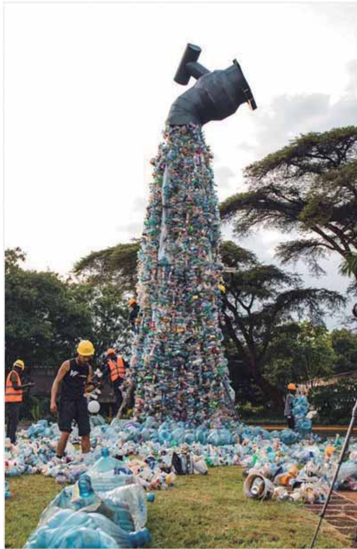
Exemplo de instalação de objetos