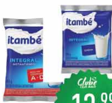
Leite Pó Itambé 400g Sc.Int/Inst.