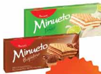
Biscoito Wafer Minueto 115g