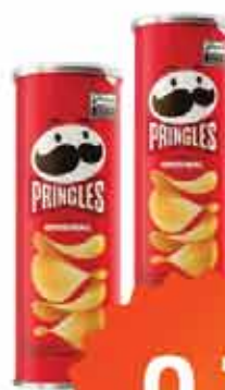
Salg Batata Pringles 104g Orig