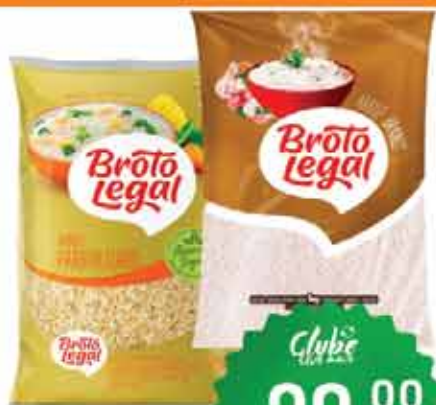
Arroz Broto Legal 5kg