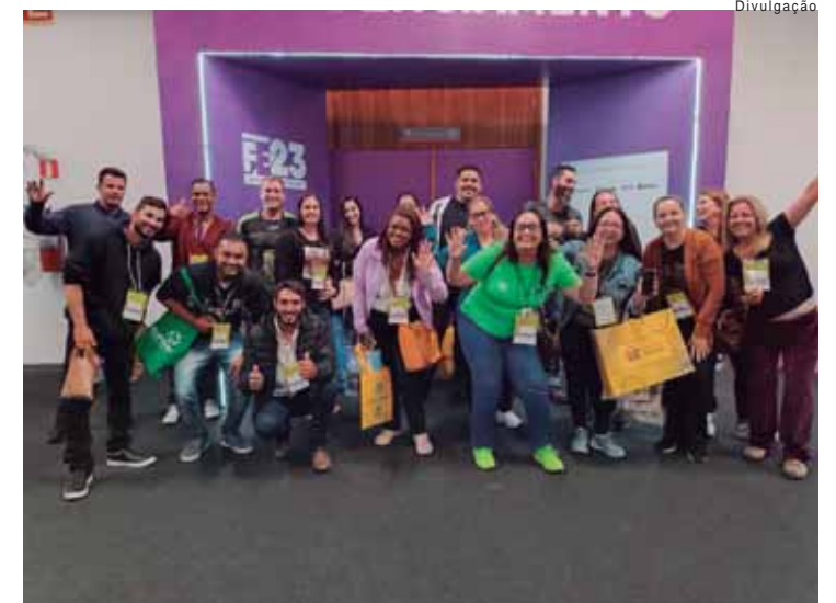
A participação é gratuita e as inscrições devem ser realizadas na própria unidade Sebrae Aqui

ção. Durante a Feira, os visitantes vão ter a oportunidade de conhecer produtos e serviços inovadores, fazer network e participar de palestras e consultorias em temas como gestão, inovação, marketing, finanças, exportação, sustentabilidade, transformação digital, entre outros. Em 2023, a caravana reuniu dezenas de empreendedores do município que tiveram diversas oportunidades de aprender e interagir com as novidades. Mais informações estão disponíveis em https://feiradoempreendedor.sebraesp.com.br/