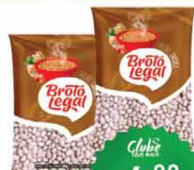
Feijão Carioca Broto Legal 1kg