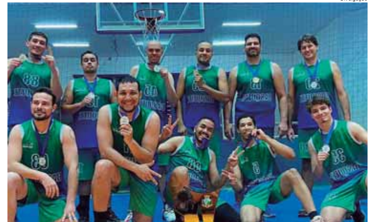
Time de São Pedro venceu a equipe de Itirapina por 45 a 37 e se consagrou campeão