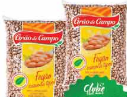
Feijão Carioca Grão de Campo 1kg