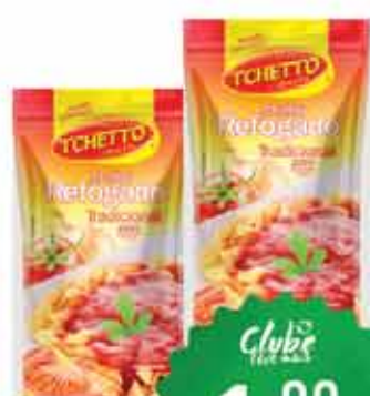
Molho Tomate Tchitto 300g SC Trad