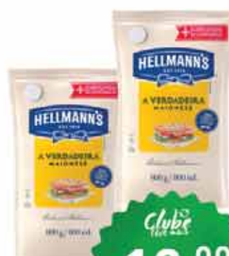
Maionese Hellmann's SC 800g