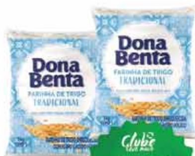
Farinha de Trigo Dona Benta 1kg Trad.