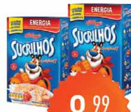
Cereal Kelloggs 240g/200g