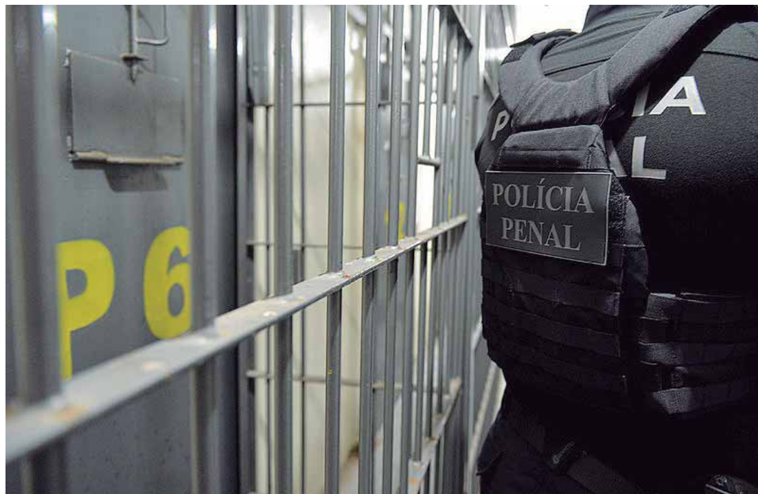
Unidades do regime fechado operam acima da superlotação máxima definida pelo Conselho Nacional de Justiça

"Em breve teremos problemas com a redução de vagas no sistema fechado porque a legislação que regula as saídas temporárias foi modificada, aumen-