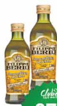
Azeite Filippo Berio 500ml Tipo Único