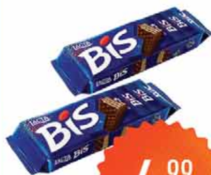
Bisc. Wafer Bis Choc. 100.8g