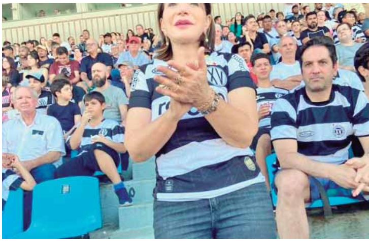
Bebel tem paixão pelo XV de Novembro de Piracicaba, o principal time de futebol da cidade