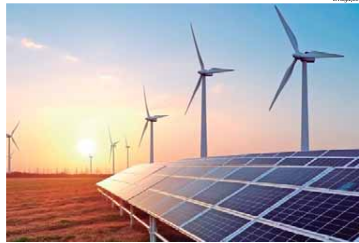
Um dos maiores desafios que cidades em todo o Brasil enfrentam é a melhoria dos sistemas de transporte público

Com eventos climáticos extremos cada vez mais frequentes, como as enchentes que assolaram o sul do Brasil, e ondas de calor recorde em várias regiões, a resiliência climática deve ser amplamente debatida em fóruns municipais. "Os gestores devem estar atentos às políticas de mitigação climática, porque o im-