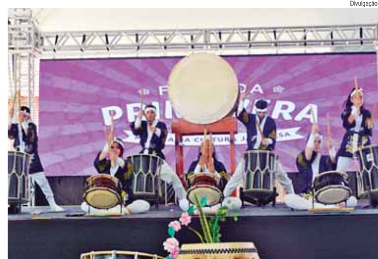
Festa da Primavera que foi realizada em 2023

“A implementação da política é pedagógica e, aos poucos, todos vão compreender. No fim, pretendemos promover um ambiente de igualdade para as mulheres e, principalmente, a igualdade salarial”, estima a representante do MTE.