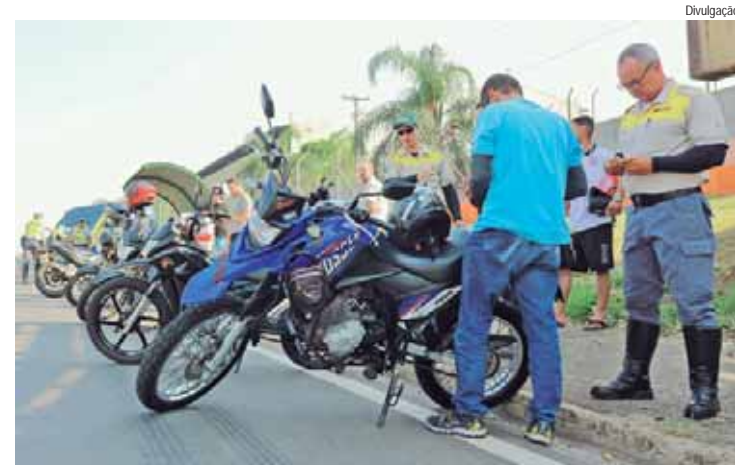
As motocicletas foram fiscalizadas durante a operação