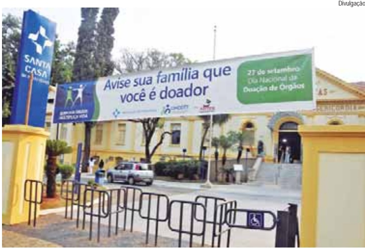
O evento celebra o Dia Nacional da Doação de Órgãos

O 10º Encontro de Doadores e Receptores de Órgãos acontece hoje, 27, no Salão de Convenções da Santa Casa de Piracicaba. O evento celebra o Dia Nacional da Doação de Órgãos e vai reunir profissionais de saúde, doadores, receptores e familiares.