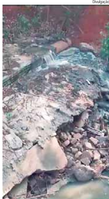
Ribeirão deságua no Piracicaba; Cetesb foi acionada para investigar o descarte de resíduo que aponta ser esgoto doméstico e MP também foi oficiado sobre o caso

Em julho deste ano, descarte irregular também no ribeirão