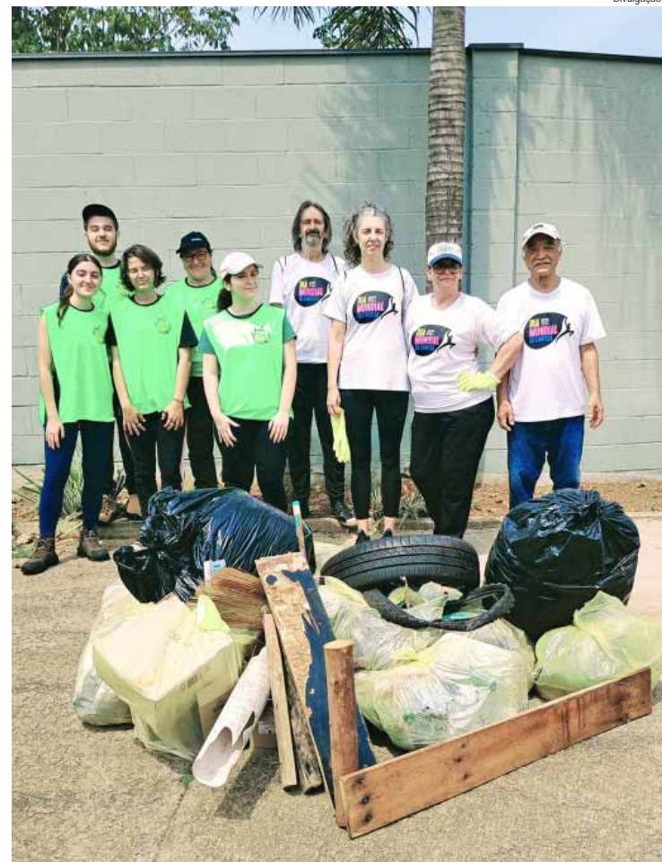
Mutirão recolheu cerca de 10 toneladas de resíduos na cidade

O MOVIMENTO – O Dia Mundial da Limpeza, liderado pelo movimento Let's Do It World, une 191 países e milhões de pessoas em todo o mundo para limpar o planeta em apenas um dia. O movimento começou na Estônia em 2008 como uma iniciativa para limpar todo o país em cinco horas. Na ocasião, 50 mil pessoas se reuniram no movimento naquele dia. Porém, em 2018, oficialmente ocorreu o primeiro Dia Mundial da Limpeza, nascendo, assim, a ação global. No Brasil, o Dia Mundial da Limpeza é coordenado pelo Instituto Limpa Brasil.