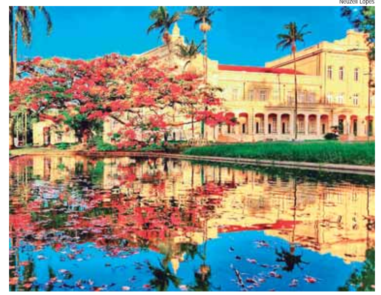
Capa do calendário será ilustrada pela foto da vencedora Neuzeli Lopes

As empresas brasileiras interessadas em integrar-se ao projeto setorial devem ser vinculadas ao setor sucroenergético e apresentar um portfólio de produtos, serviços ou soluções com potencial exportador. Entre em contato pelo www.portalapla.org.br .