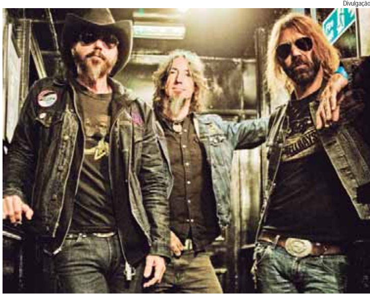
Roqueiros norte-americanos do Supersuckers tocam em Piracicaba dia 17 de outubro