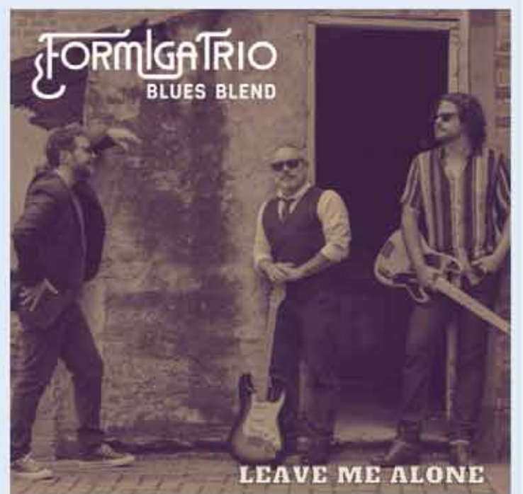
de streaming do Formiga Trio Blues Blend. Espero que vocês gostem e curtam. Valeu!"

"Essa é a primeira de um conjunto de seis músicas que compõem um EP. No dia 20 de outubro lançamos o segundo single e em novembro, o resto das músicas. Na letra, é como se outra pessoa tentasse me convencer. Aquela história do 'você é músico, mas trabalha com o quê?'. A pessoa tenta me questionar nesse sentido e mostro que é isso o que faço mesmo. Quer me convencer de uma coisa, sendo que eu sei do que preciso, qual é minha reza, minha prece. Então, 'me deixe em paz!'. O single está disponível em todas as plataformas