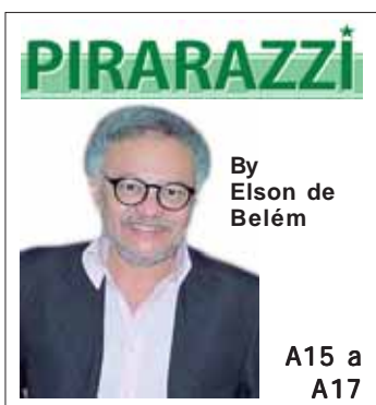
By Elson de Belém

O 2º Relatório de Transparência Salarial e de Critérios Remuneratórios aponta que as trabalhadoras mulheres ganham 20,7% menos do que os homens, em 50.692 empresas com 100 ou mais empregados, no Brasil. O estudo foi apresentado pelos ministérios das Mulheres e do Trabalho e Emprego (MTE), em Brasília. O documento considera os dados informados pelos empregadores na Relação Anual de Informações Sociais (RAIS) de 2023. A situação piora em caso de mulheres negras. A10