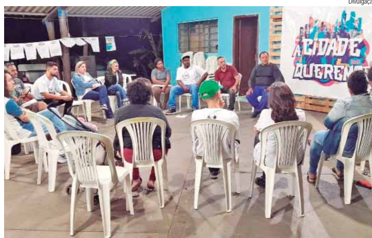
Iniciativa popular e comunitária apresenta carta de recomendações e promove debate com candidatos à Prefeitura

"Apesar do fato da possível assinatura da carta de recomendações representar um certo compromisso político, mas não garantir a execução das ações presentes na mesma, a carta é uma ferramenta que potencializa e facilita o controle social dos cidadãos, bem como