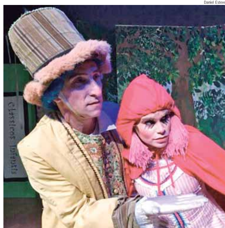
Espectáculo contemplado em 2020, 'Chapeuzinho Vermelho e o Lobo'

Os editais também cumprem a cota mínima de cotas: 25% das vagas a pessoas negras, 10% a pessoas indígenas e 5% a pessoas com deficiência.