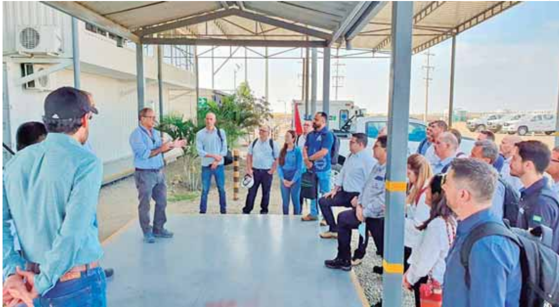
Projeto Brazil Sugarcane vai levar 11 representantes de empresas do Brasil na missão internacional

As exportações peruanas de açúcar devem atingir 100 mil to-