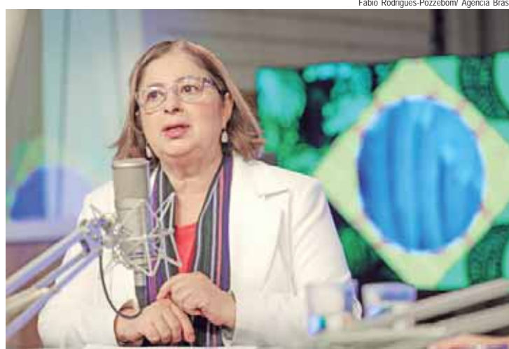
A ministra Cida Gonçalves, do Ministério das Mulheres, participa do programa Bom Dia, Ministra

Se consideradas somente as trabalhadoras negras, a diferença de remuneração se acentua. No geral, as mulheres negras ganhavam R$ 2.745,26, no ano passado, o que equivalia a metade (50,2%)