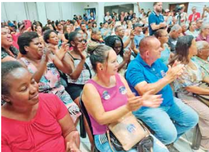
Povo, entre militantes e convidados, na Escola de Mães, durante visita do ministro do Trabalho, Luiz Marinho