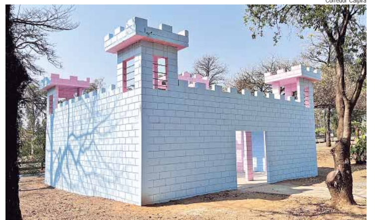
O Castelinho, no Paraíso das Crianças, recebeu pintura nova e teve o piso reformado

A Prefeitura, por meio da Secretaria Municipal de Obras e Zeladoria (Semozel), realizou pequenas obras de melhoria no Paraíso das Crianças e no Zoológico Municipal. Os espaços são dois dos locais mais procurados pelos piracicabanos e turistas dos municípios vizinhos para passeios por mês, juntos. Em 2023, passaram pelos espaços 338.507, enquanto que em 2024 já são mais de 214 mil visitantes.