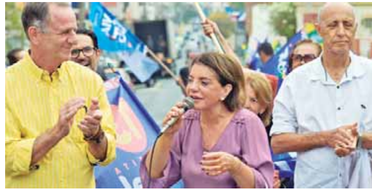
Bebel destacou o seu compromisso de revitalizar a região central da cidade