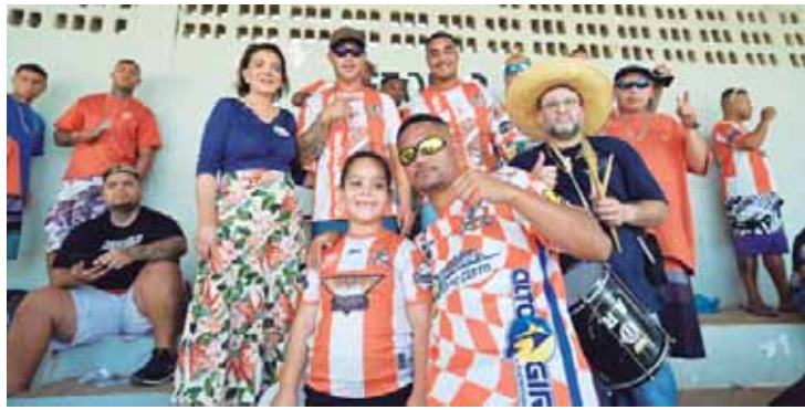
Bebel com torcedores no Estádio Barão da Serra Negra