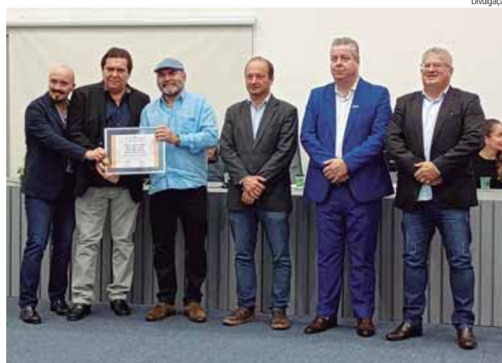
Honraria reconhece o talento e a dedicação de líderes empresariais, em Santa Bárbara d'Oeste

Sobre a Rede - Inaugurada em 1989, a Rede de Supermercados Pague Menos está entre as 40 maiores empresas supermercadistas do