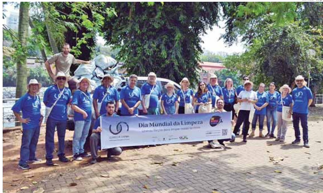
Equipe realiza coleta às margens do Rio Piracicaba

Ação voluntária - A ação voluntária contou com a participação da Cooperativa Reciclar Solidário, que auxiliou na captação,