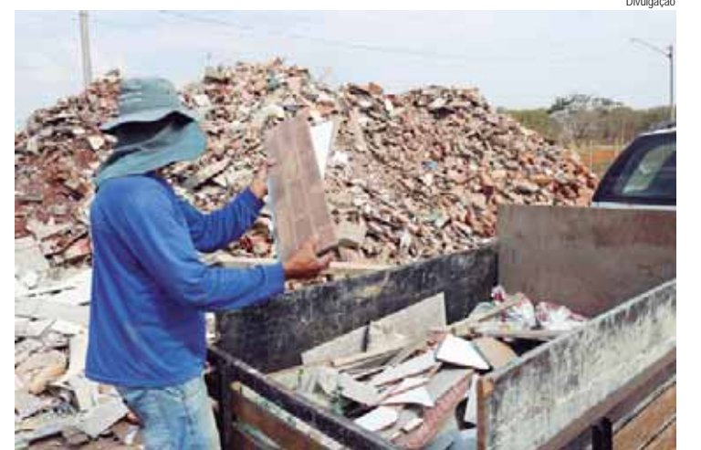
Resíduos da construção civil estão entre os materiais recebidos nos ecopontos

MODERNIZAÇÃO - A Simap já deu início ao Ecopira, projeto que tem como objetivo tornar os sete ecopontos do município mais eficientes. Dessa forma, já foi realizada adequação da iluminação nos sete equipamentos, construído platô elevatório nos ecopontos do Jardim Oriente e Santo Antônio e compra de 9 caixas de 39 m3 para esses dois ecopontos, nos quais a população poderá descartar os resíduos separadamente, sendo uma para entulhos, uma para madeiras, uma para massa verde (restos de poda de árvore,