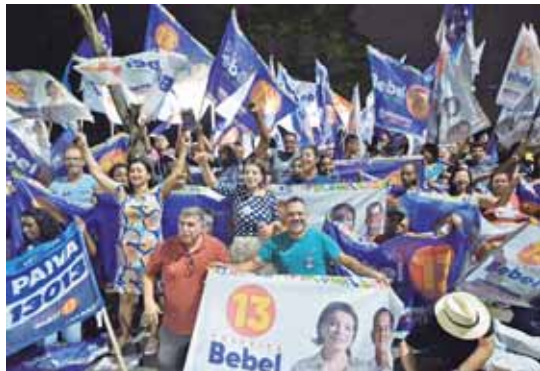
Bebel também fez caminhada pelo tradicional bairro do Cecap