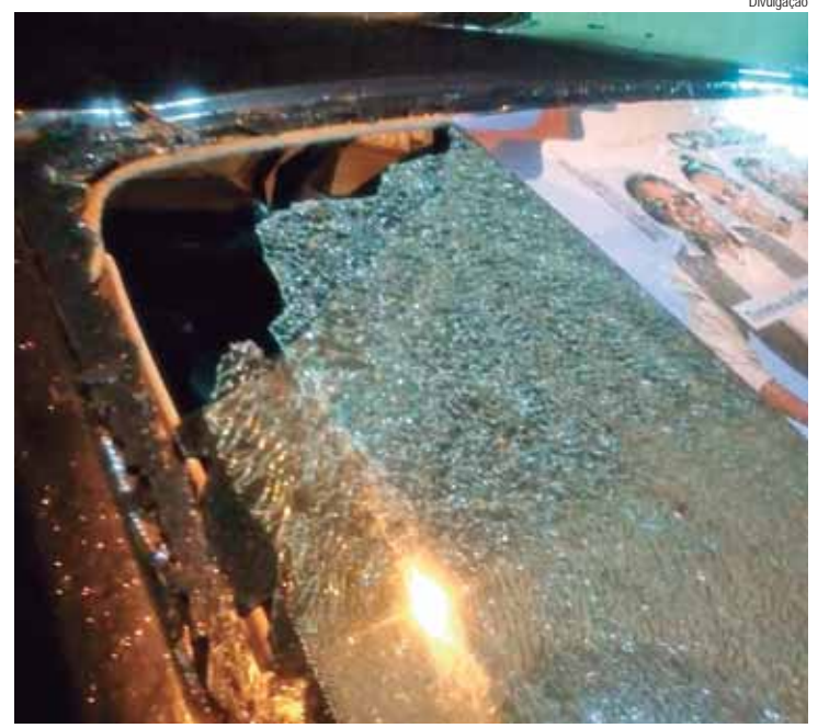
Campanha de Edvaldo Brito trata caso como uma forma de terrorismo eleitoral

Mais informações e agendamento de grupos: expomuseu90anos.usp.br/