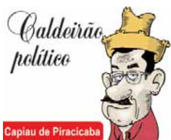
Capiau de Piracicaba