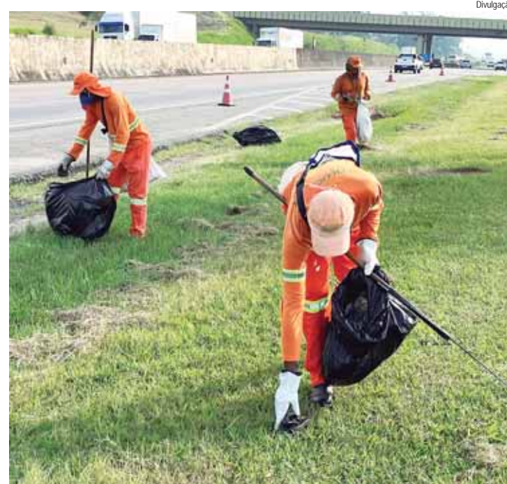
Concessionárias removem toneladas de materiais inservíveis todos os meses ao longo dos trechos concedidos

TONELADAS DE LIXO – Confira a quantidade e os principais resíduos recolhidos no primeiro semestre deste ano por algumas concessionárias em suas rodovias: AUTOBAN: em média, 600 toneladas por mês, como papel, plástico, papelão, madeira, borracha (ressolagem); ECOPISTAS: mais de 3,5 toneladas de pneus, destinados à reciclagem; ECOVIAS: a concessionária recolheu mais de 26,9 toneladas de pneus no primeiro semestre, destinados à reciclagem; ENTREVIAS: 261,4 toneladas de materiais recolhidos de todo o trecho concedido, como sacolas plásticas,