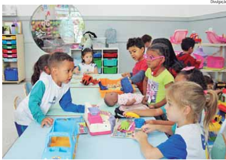
O agendamento é exclusivo para alunos que irão ingressar na rede municipal de ensino de Piracicaba