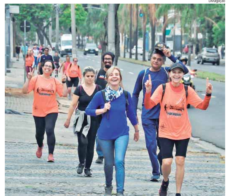
Terceira edição do Caipirandando 2024 teve roteiro urbano

A Secretaria de Esportes, Lazer e Atividades Motoras promoveu no último sábado, 21, o tradicional Caipirandando, que tem como objetivo o desenvolvimento de caminhadas de longa distância. O evento tem trajetos que percorrem normalmente as estradas de terra da região mas, desta vez, o cronograma foi montado para privilegiar as principais pontos turísticos da cidade, numa caminhada de 14 quilômetros.