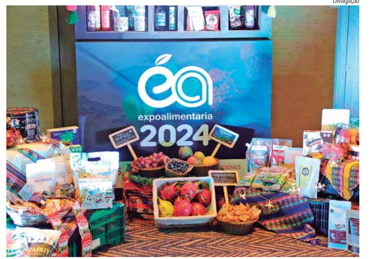
Empresas farão parte de grupo que vai visitar a feira Expoalimentaria em Lima