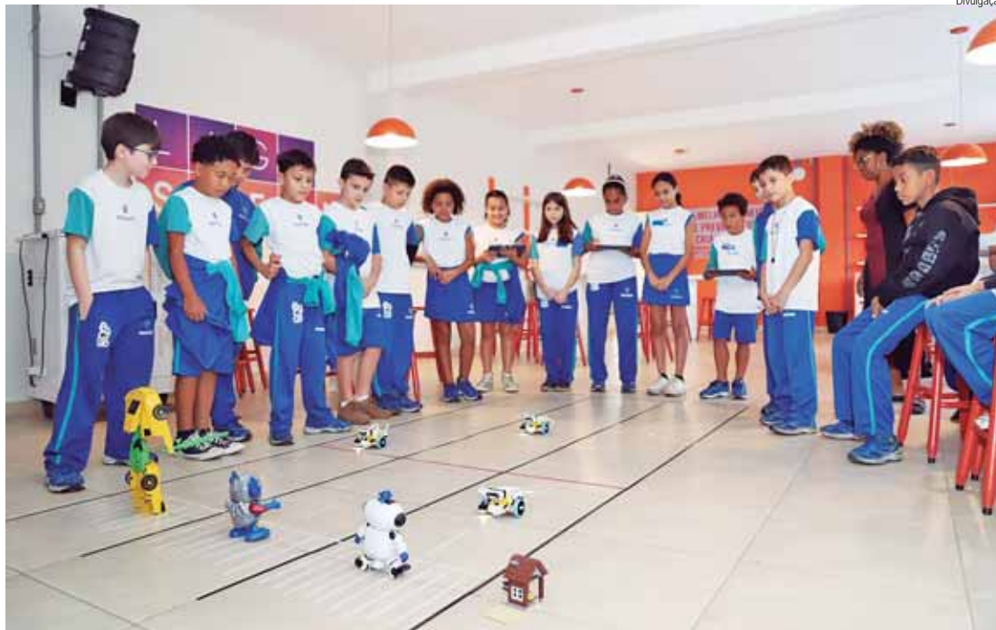
As aulas estão programadas para ocorrer até o final do ano, e cada turma visita o laboratório duas vezes

O laboratório, fruto de uma parceria da SME com a Fundação ArcelorMittal, está equipado com kits de robótica Lego e notebooks, e oferece aos alunos as ferramentas necessárias para aprender programação e robótica de forma dinâmica. O conceito Steam, que integra as áreas de Ciência, Tecnologia, Engenharia, Artes e Matemática, é a base da metodologia aplicada nas aulas, que envolvem atividades práticas para estimular o pensamento crítico e a resolução de problemas.