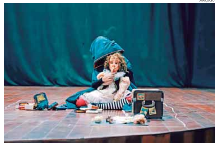
Espetáculo tem única apresentação gratuita dia 29 de setembro, às 19h, no espaço Garapa Arte e Cultura