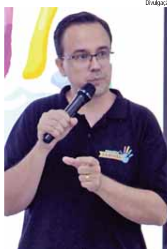
Projeto Samuel inclui atendimentos gratuitos, como Neurologia e Psiquiatria Infantil

O Projeto Samuel já realizou mais de 2.500 atendimentos, incluindo especialidades que o SUS de Piracicaba não atende, como Neurologista e Psiquiatra Infantil, por exemplo. Mais informações podem ser obtidas por meio do site: www.projetosamuelautismo.com.br ou no Instagram - @projetosamuel.autismo.