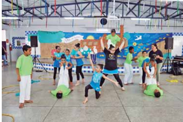
Crianças fizeram apresentação de ginástica

balhar para resgatar o comércio do centro da cidade. Para ela, o fortalecimento do comércio da região central da cidade é fundamental para a geração de empregos, principalmente para a juventude. A9