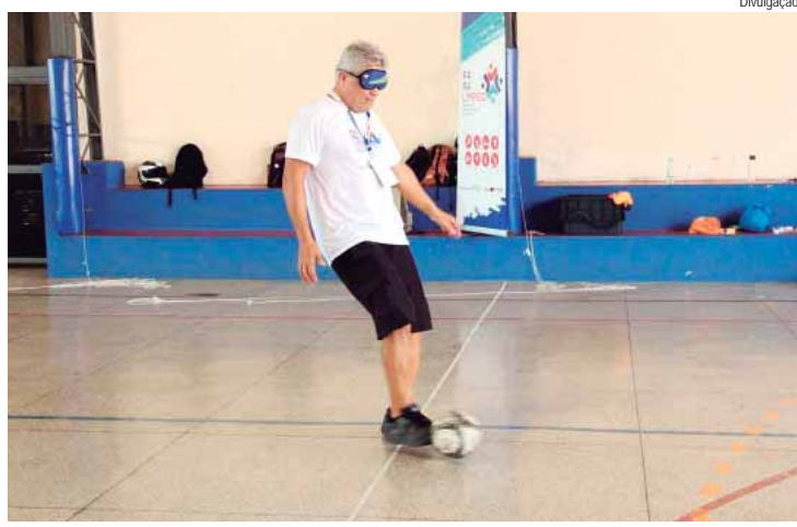
Formação do Governo de São Paulo promove prática dos esportes adaptados para a inclusão de estudantes com deficiência