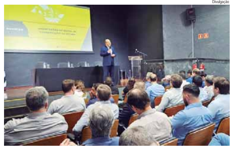
Com transmissão pela internet, apresentação desta sexta-feira (20), reafirmou compromisso da atual gestão com a transparência

A moção passará pelas comissões permanentes da Alesp e ainda não tem uma data para ser votada.