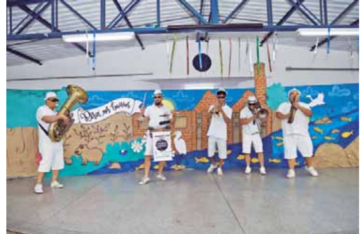
Banda Mississippi Jazz Band foi a atração musical do evento