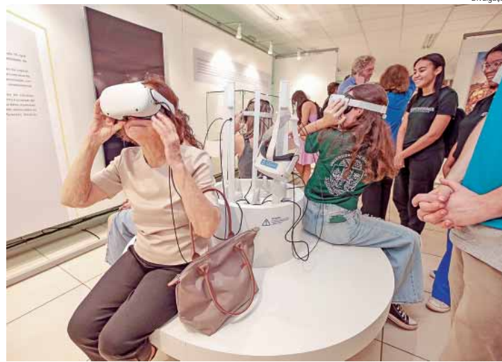
A mostra ocorrerá entre 2 e 31 de outubro, das 9h às 18h

para a diversidade da sociedade paulista por meio de retratos históricos e coleções de porcelanas, além de levar o visitante a conhecer parte das salas expositivas do Museu do Ipiranga e a célebre obra Independência ou Morte!