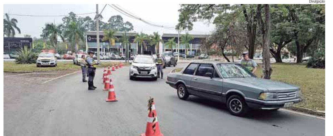
A Semana Nacional de Trânsito acontece entre 18 e 25 de setembro

As blitzes têm o intuito de abordar o cidadão, reforçar sobre a prevenção de acidentes de trânsito e óbitos em decorrência dos sinistros. Entre os aspectos aborda-