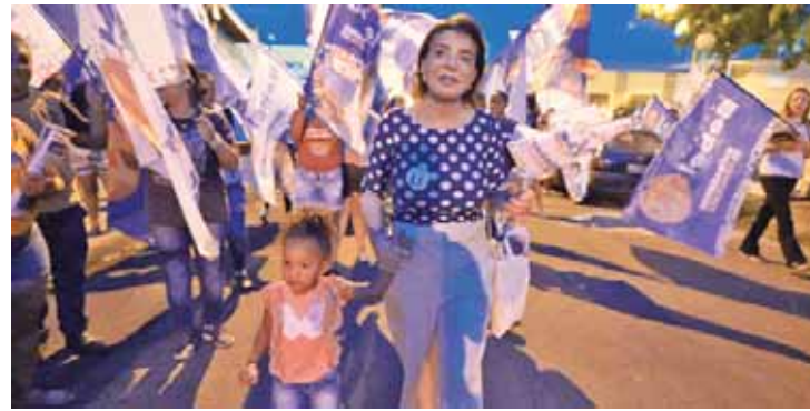
Bebel em caminhada pelo tradicional bairro do Cecap, na sexta-feira à noite, que sofre com as constantes falta d'água