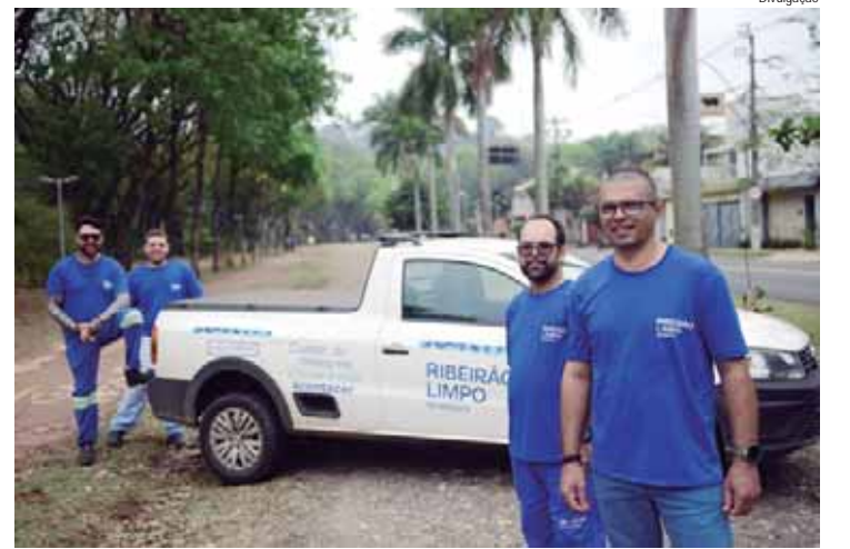
Mirante reforça o time nas ruas com a ampliação do programa Ribeirão Limpo