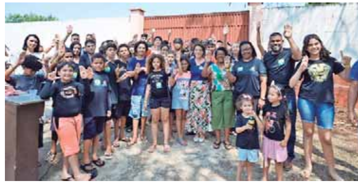
Bebel com grupo de crianças e jovens, em encontro no domingo