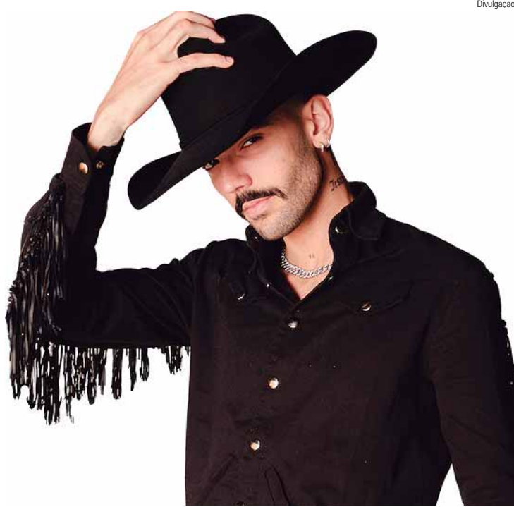
O fenômeno sertanejo vai estreiar o novo palco, que está sendo instalado na piscina de ondas para receber grandes shows