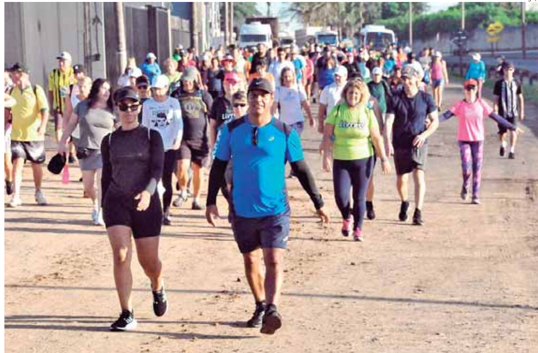
Caipirandando deste sábado tem percurso totalmente urbano

A Casa do Povoador será o primeiro destino a ser alcançado pelos participantes da caminhada, chegando depois a Catedral de Santo Antônio e ao Mercado Municipal. O trajeto segue até a Igreja Metodista, localizada a rua Governador Pedro de Toledo, 1417 e depois para a Igreja do Bom Bosco Assunção, na rua Boa Morte, 1835, e até a Estação da Paulista, que fica a avenida Dr. Paulo de Moraes 1580.