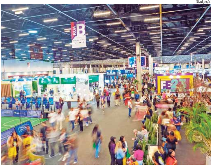
Empresas terão a chance de expor nas arenas Crie Sebrae e Crie Games