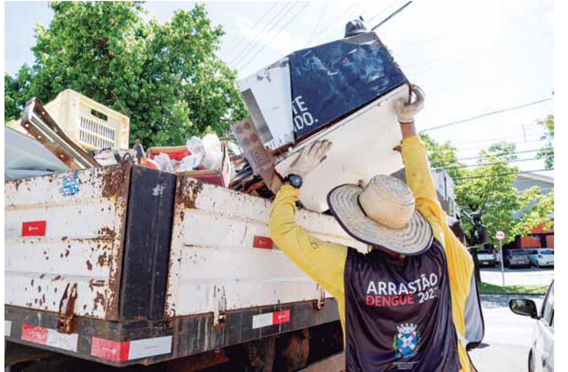
Arrastão da Dengue retorna a região de Santa Teresinha no próximo sábado (21)

De acordo com a Vigilância Epidemiológica (VE), de 01/01 a 17/