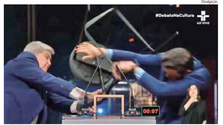
Advogados destacam que as ações de ambos os candidatos comprometem a integridade do processo eleitoral

Podem se inscrever no Fies quem tiver participado do Exame Nacional do Ensino Médio (Enem) a partir da edição de 2010 e tiver obtido média aritmética das notas nas provas igual ou superior a 450 pontos, bem como nota superior a zero na redação. Também é necessário possuir renda familiar mensal bruta por pessoa de até três salários mínimos.