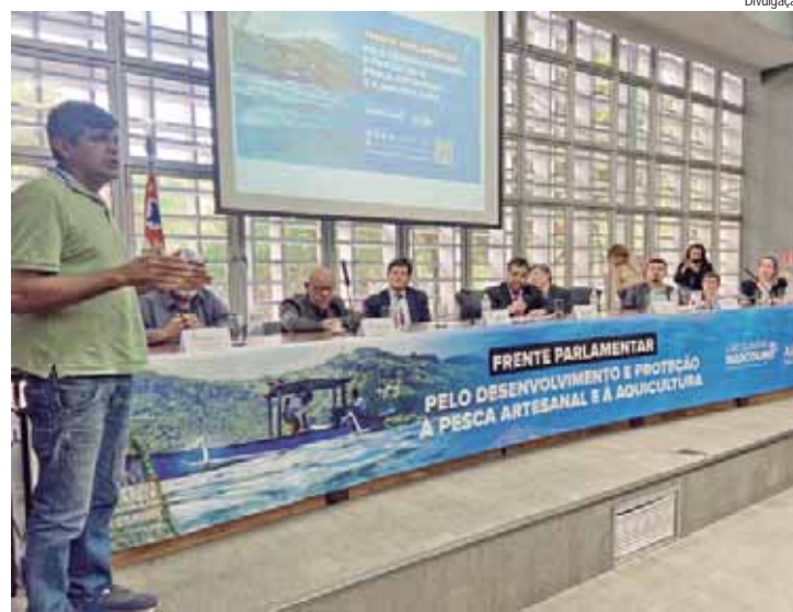
A proposta de novas regras para a pesca artesanal está sendo discutida pela Secretaria Estadual de Agricultura