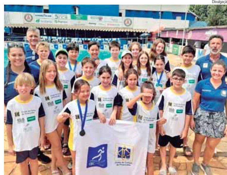
Equipe de Natação do CCP brilha em Torneio com 15 Medalhas