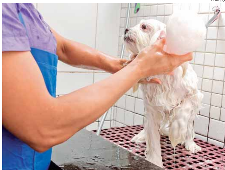
Em Piracicaba são mais de 500 empresas voltadas ao segmento pet

Ele também explica que o nível de consciência da população a respeito dos animais de estimação aumentou. “Algumas décadas atrás, matar um passarinho com estilingue era alguma coisa muito aceitável, às vezes estimulada até