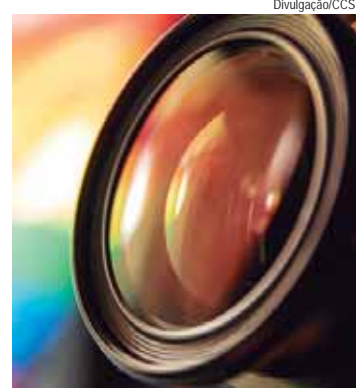
Biblioteca Municipal recebe oficina sobre a linguagem visual das cores

Para participar, recomenda-se que cada participante tenha um celular com câmera ou uma câmera digital para realizar as atividades propostas e aplicar o tema proposto produzindo imagens.