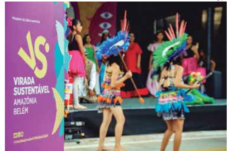
Com atividades gratuitas, a Virada Sustentável estreia na capital paranaense no próximo mês de novembro

A Virada Sustentável é o maior festival de sustentabilidade do