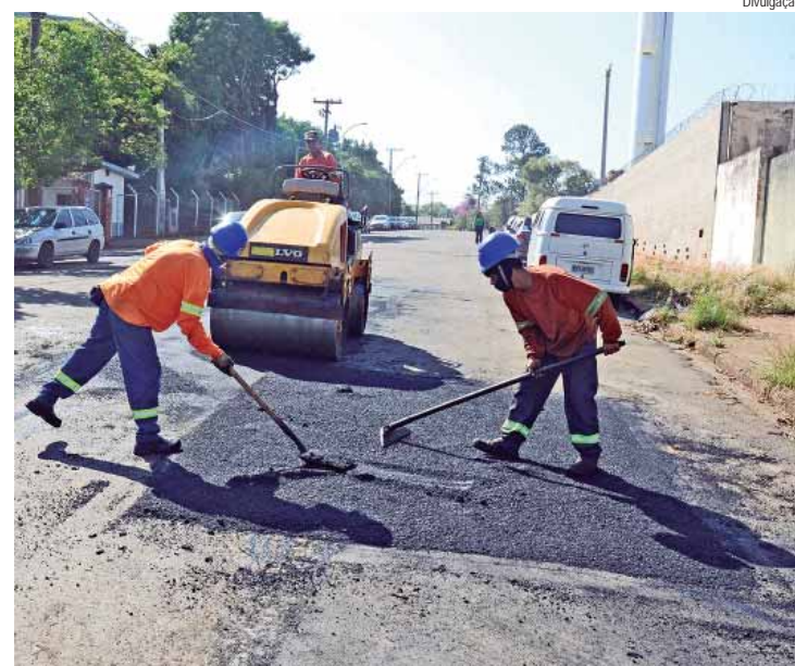
Entre os dias 2 a 6 de Setembro, 21 bairros foram atendidos

“Fui convidado a participar e estar no caminhão juntamente com o Jair Bolsonaro, o governador Tarcísio de Freitas, o pastor Silas Malafaia, o senador Marcos Pontes, o deputado federal Nikolas Ferreira entre tantas outras lideranças da direita brasileira. Foi muito honroso representar Piracicaba em uma manifestação tão simbólica como é o 7 de setembro”.