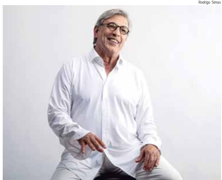
Ivan Lins apresenta o show "Abre Alas", uma viagem musical e afetiva que explora o vasto repertório da dupla ao longo das últimas cinco décadas

Em 2024, uma das parcerias mais icônicas da Música Popular Brasileira completa 50 anos. Ivan Lins e Vitor Martins, conhecidos por suas composições memoráveis, lançaram o clássico "Abre Alas" no álbum Modo Livre em 1974. Para celebrar este marco, Ivan Lins apresenta o show "Abre Alas", uma viagem musical e afetiva que explora o vasto repertório da dupla ao longo das últimas cinco décadas. O show "ABRE ALAS" promete