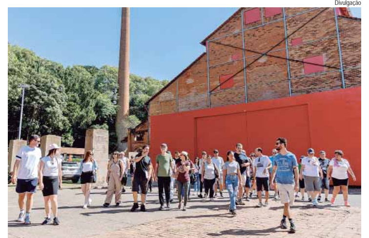
Passeio leva os participantes a diversos espaços

prego Frente de Trabalho, da Smads, participam, desde o mês de agosto, dos cursos viabilizados por meio do Plano de Ação de Inclusão Productiva. Durante todo o ano, os bolsistas terão a oportunidade de participar de cursos de qualificação profissional, realizados uma vez por semana, como incentivo de aperfeiçoamento e aprendizagem para melhores chances no mercado de trabalho.