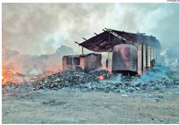
Chamas atingiram espaço onde funciona um ferro velho e não há registro de vítimas