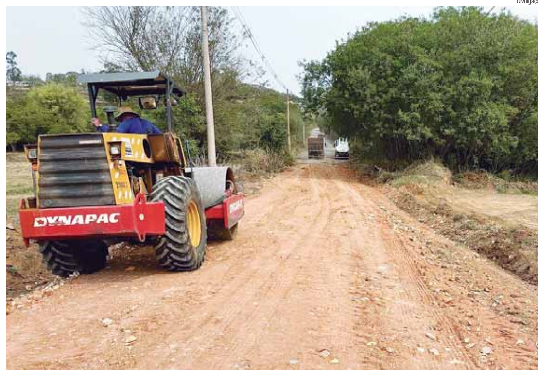
Manutenção na estrada que liga os bairros Ibitiruna e Anhumas

A Secretaria possui uma equipe especializada na construção de pontes de madeira que faz, diariamente, a manutenção, conservação e monitoramento recorrente de cerca de 150 pontes rurais. O trabalho artesanal feito com eucalipto tratado e pela equipe de servidores garante a