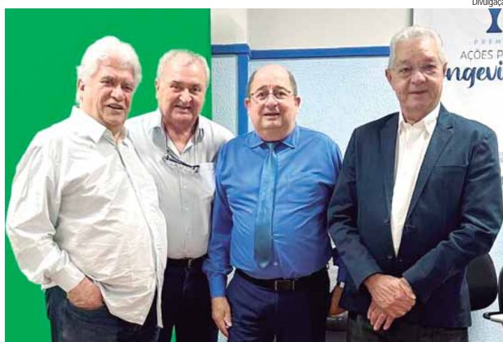
Diretoria do Sindicato das Santas Casas e Hospitais Filantrópicos do Estado de São Paulo

SINDHOSFIL - O Sindhosfil, fundado em 1988, representa os interesses das Santas Casas e hospitais filantrópicos no estado de São Paulo. Nas últimas duas décadas, o Sindhosfil fortaleceu sua atuação junto ao Ministério do Trabalho e Emprego. Por meio de propostas de