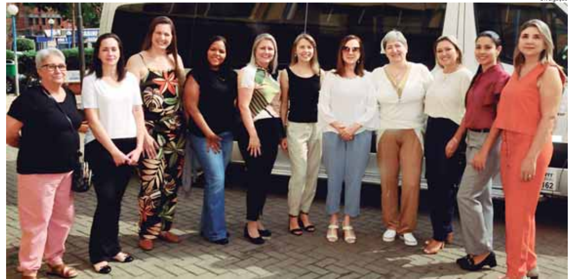
No total, 11 funcionárias prestigiam o evento em busca de networking e inovação

Segundo ela, este ano, o tema do Congresso focará na atualização de faturistas, administradores, auditores e profissionais da área financeira dos hospitais, que terão exposições aprofundadas