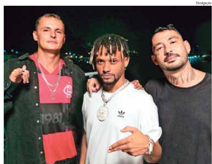
Os cariocas do Oriente são os representantes do rap no evento

CONSCIENTIZAÇÃO - Embora em grande parte das áreas atingidas pelos incêndios o manejo do fogo esteja proibido, a pesquisadora considera que ainda é necessário melhorar a conscientização das pessoas. "Do jeito que estamos vivendo essa crise, os contingentes governamentais, sejam eles da esfera federal, estaduais, ou municipais, não serão suficientes para conter o que está ocorrendo, a não ser que haja o engajamento da sociedade", diz.