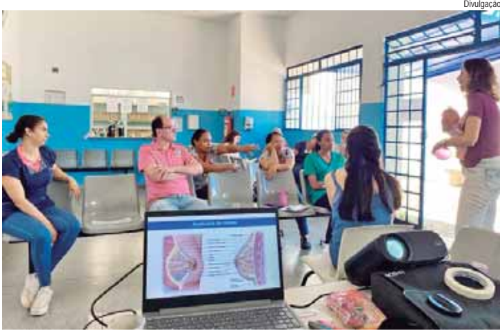
Próximas capacitações de equipes pelos tutores da EAAB passarão por quatro USFs