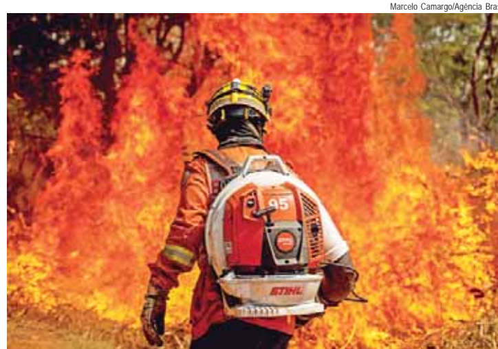
Brigadistas do Instituto Brasília Ambiental e Bombeiros do Distrito Federal combatem incêndio em área de cerrado próxima ao aeroporto de Brasília