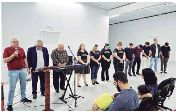
Momento de oração, agradecendo a Deus pelos colaboradores da entidade