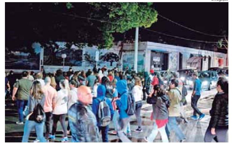
São 100 vagas e a adesão deve ser registrada via internet