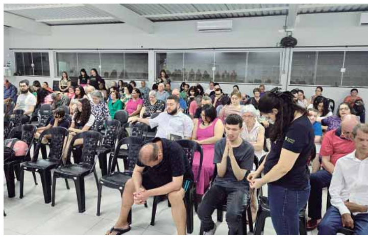
Colaboradores e familiares de assistidos em momento de gratidão a Deus