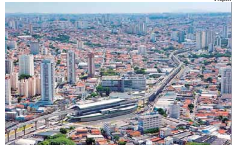
Ramalho da Construção fala que audiências públicas e consultas populares são ferramentas importantes

O planejamento urbano de longo prazo, feito para atender demandas atuais e já considerando as futuras, com práticas sus-