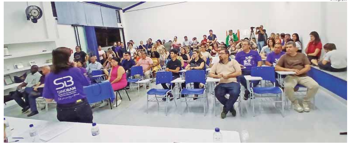
Bancários participaram de assembleia no SindBan nesta quarta (4)

Entre os bancos privados, a aprovação foi unânime. Na Caixa, a proposta foi aprovada por 58% dos presentes. No Banco do Brasil, os bancários rejeitaram as propostas e estão aguardando os resultados das votações que acontecem hoje em todo o país para tomar uma decisão. A Convenção Coletiva de Trabalho venceu em 31 de agosto, encerrando o período de prorrogação automática das cláusulas até a conclusão de um novo acordo. Com a rejeição da proposta