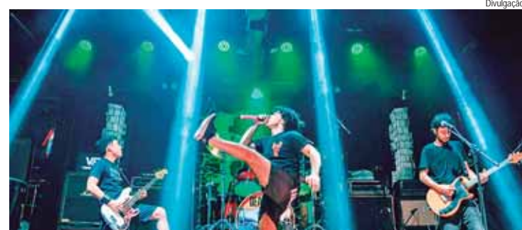
Entre as atrações, a banda Dead Fish sobe ao palco para encerrar a primeira noite do festival

A cidade de Brotas sedia a 11ª edição do Brotas Rock, evento gratuito que acontece entre os dias 14 e 15 de setembro e promete agitar a região com duas noites de muito som, reunindo bandas consagradas e novos talentos no Ginásio de Esportes Jorge Atalla (Brotão).