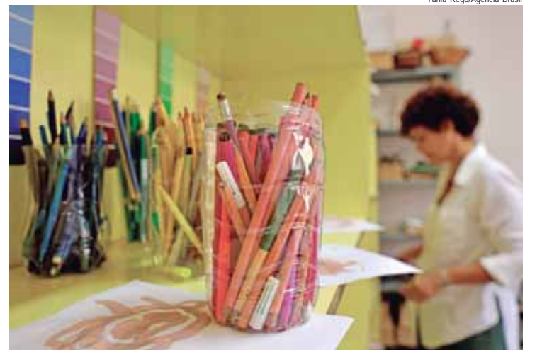
Espaço de Desenvolvimento Infantil (EDI) Claudio Cavalcanti, no bairro de Botafogo, no Rio de Janeiro

“A gente tem um desafio da garantia da educação infantil com qualidade. Não basta oferecer uma vaga. Essa educação tem que ser uma educação de quali-