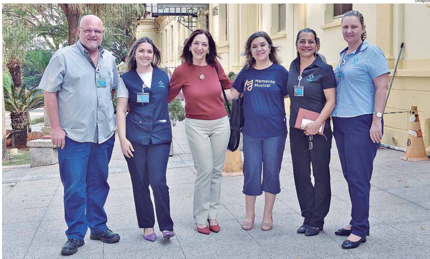
Equipe técnica e coordenadoras da Noiva da Colina visitam a área externa da Santa Casa, onde ocorrerá a apresentação

Hospital, marcando um momento único em que música, voluntariado, caridade e assistência se unem de forma holística com vistas ao bem-estar das pessoas. A10