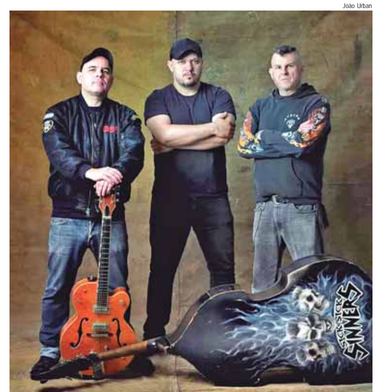
ick Sick Sinners se apresenta hoje, 6, no Oficina Bar

Abanda de psychobilly Sick Sick Sinners se apresenta hoje, a partir das 19 horas, no Oficina Bar (rua Riachuelo, 1138), em Piracicaba.