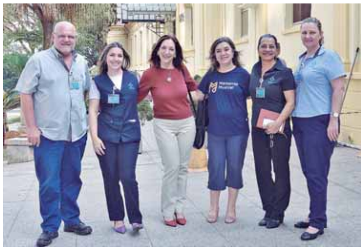
Equipe técnica e coordenadoras da Noiva da Colina visitam a área externa da Santa Casa, onde ocorrerá a apresentação