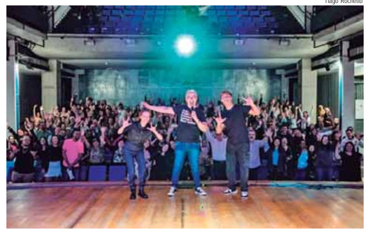
Espectáculo contou com 325 espectadores

pela Polícia Militar, além das equipes do Corpo de Bombeiros e Samu (Serviço de Atendimento Móvel de Urgência) estarem de prontidão para qualquer ocorrência. A equipe do Departamento de Saúde do Escolar, vinculada à Secretaria Municipal de Educação, estará em pontos estratégicos do Barão com equipes para atender casos emergenciais.