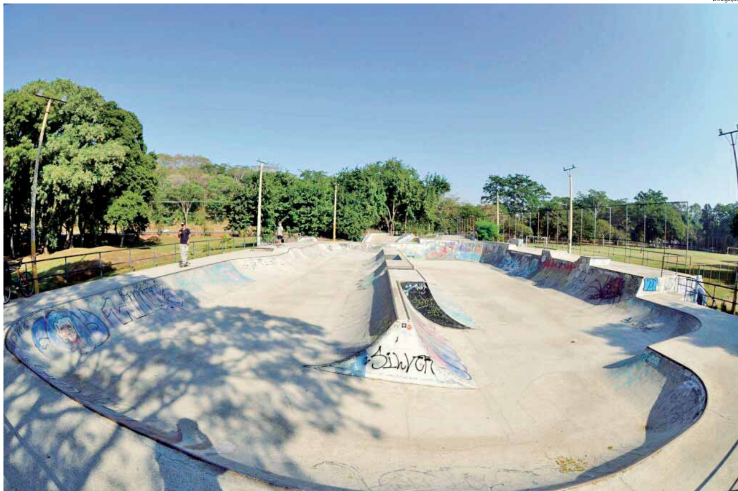
As obras na Área de Lazer do Trabalhador tem valor estimado em R$ 1.179.15390