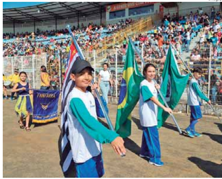
O desfile contará com a participação de cerca de 90 escolas da Rede Municipal de Educação

que irá acompanhar o desfile, estarão disponíveis pontos de água e banheiros nas estruturas do Barão, contando com bebedouros em pontos estratégicos. Além disso, os banheiros do Ginásio de Esportes José de Oliveira Garcia Neto também estarão disponíveis para uso. SEGURANÇA - A segurança do evento será realizada pela Guarda Civil Municipal e