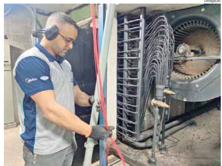
Funcionário da Ar Centro vistoria peças de uma das self contained com condensação à água

Com as melhorias, essa será a primeira vez que o palco receberá climatização. Três equipamentos de ar-condicionado serão instalados na altura do palco da Sala 1 e irão climatizar tanto o palco quanto a coxia. A sala da Técnica, que fica a cima do espaço das