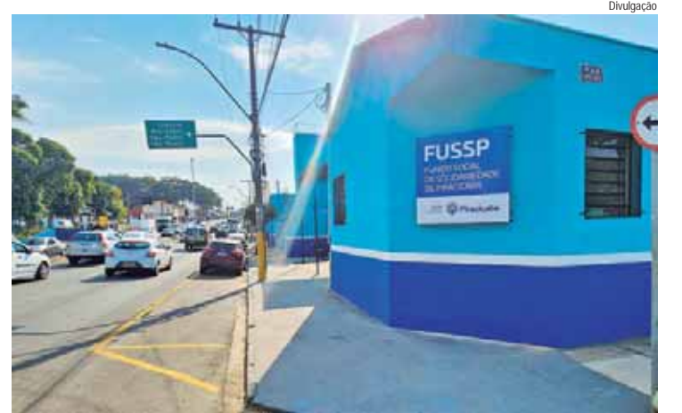
O novo espaço está localizado na avenida Dr. Paulo de Moraes, 2.073

O Fundo Social de Solidariedade de Piracicaba (Fussp) desde ontem, 5, atende via três novos números de telefone: (19) 3422-9677, (19) 3422-6170 e (19) 3434-6332. Com a mudança de sede, os servidores estavam atendendo a população, empresas e instituições de forma presencial ou por meio do número de whatsapp: (19) 99184-7822, que também segue disponível para contato.