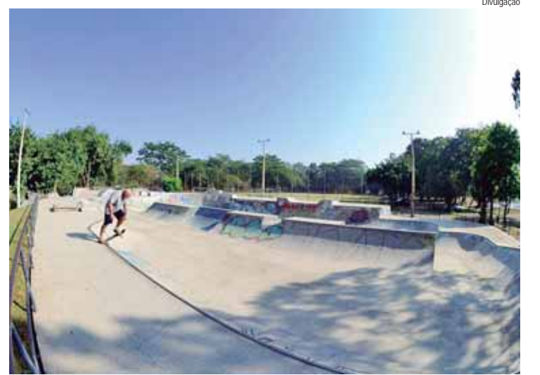
As obras na Área de Lazer do Trabalhador tem valor estimado em R$ 1.179.153,90

Ainda foi realizada a revitalização nas duas quadras poliesportivas, com troca das tabelas e reforço na demarcação das linhas com nova pintura e a recuperação dos bancos de madeira existentes. Também foi feita a substituição da iluminação de 48 refletores vapor metálico 450w por 16 refletores de LED 120w, que têm maior durabilidade e menor consumo de energia. Os pos-