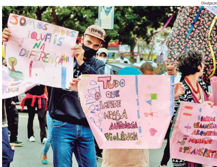
Caminhada inclusiva pela luta da pessoa com deficiência de 2023