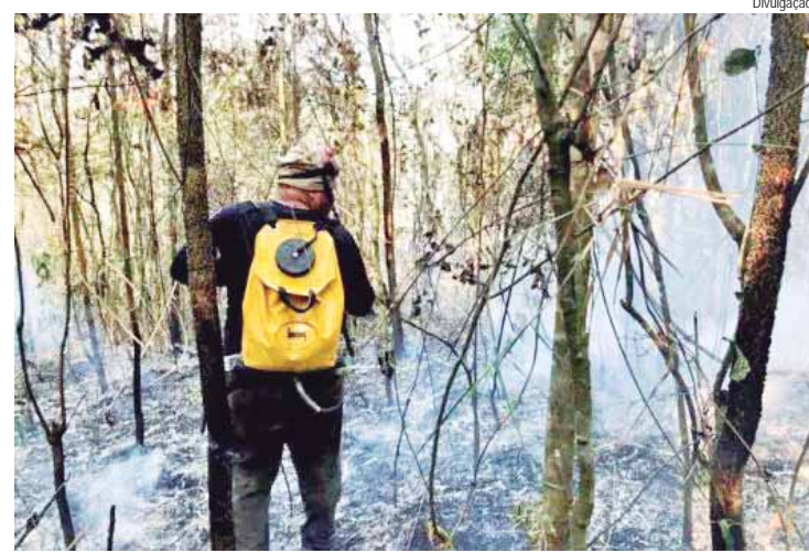
São 15 novas equipes, mais equipamentos e veículos em ação nos próximos 2 meses para evitar queimadas nas áreas de conservação