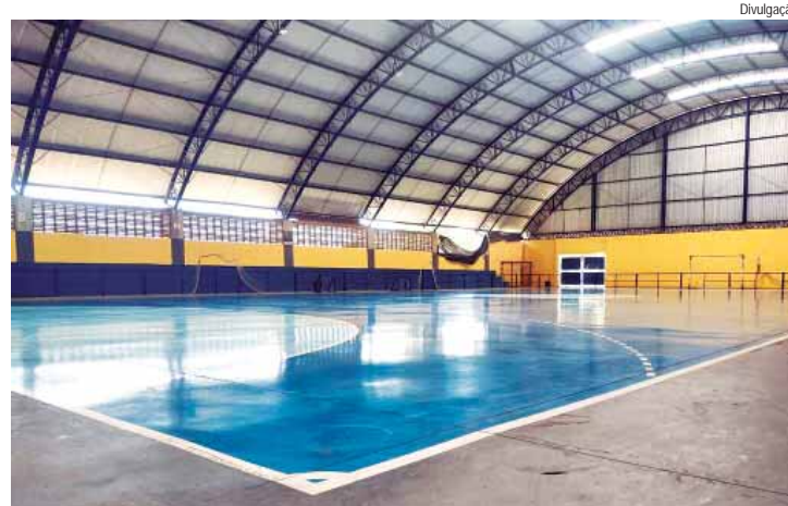
Parte de uma das paredes cedeu com fortes ventos

MELHORIAS - A Prefeitura de Piracicaba realizou outras obras de melhoria no Ginásio do Prezotto, entre elas a reforma da cobertura. A obra finalizada em julho de 2023 fez parte de um pacote que também atendeu o Centro Esportivo Dirceu de Toledo, no Jaraguá, e o ginásio José de Oliveira Garcia Neto (miniginásio 1 e 2), no Bairro Alto.