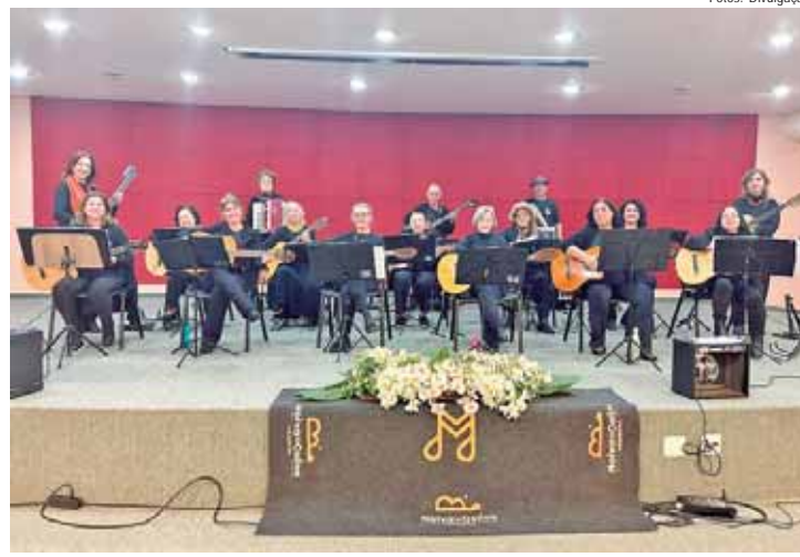
Orquestra Noiva da Colina: o grupo é composto por 35 instrumentistas, sendo 14 violas, 14 violões, duas percussões