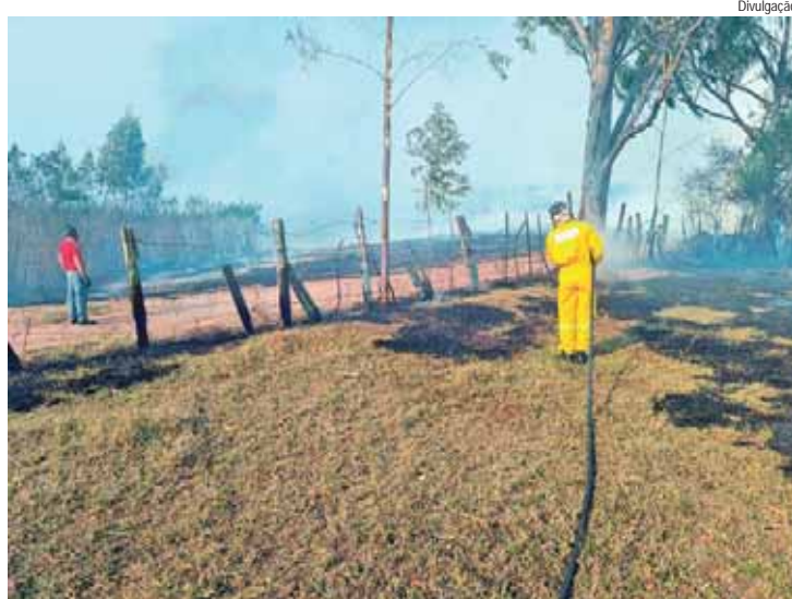
A situação está sob controle, segundo a Defesa Civil