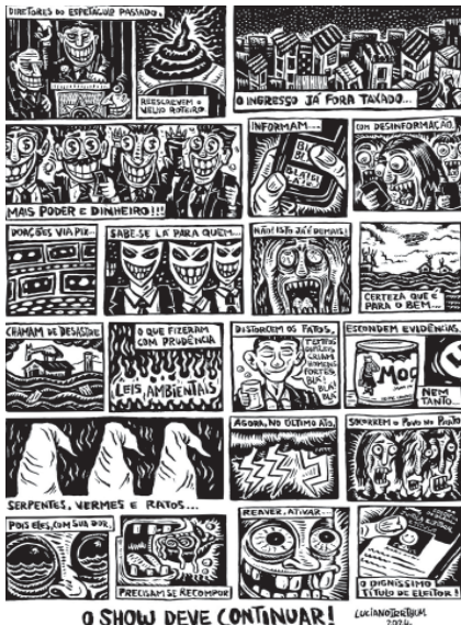
Luciano Irrthum -Brasil Premio Tiras (parte 2)