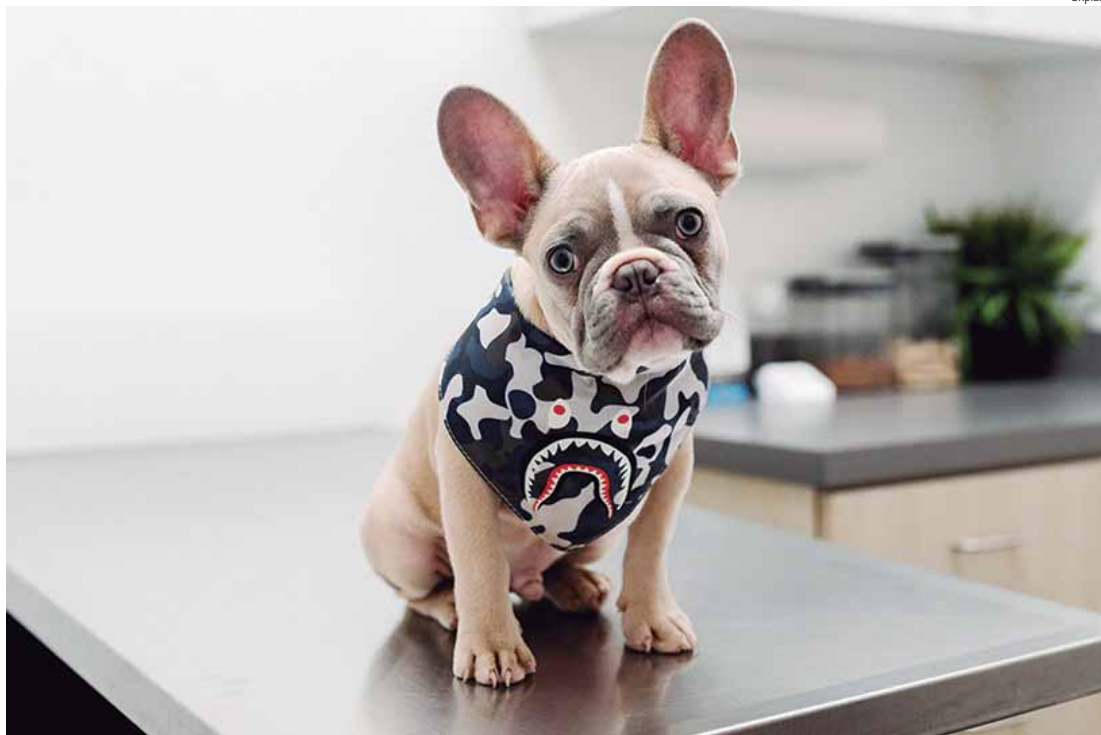
O número de animais perdidos diariamente é alto, o que reforça a necessidade da identificação