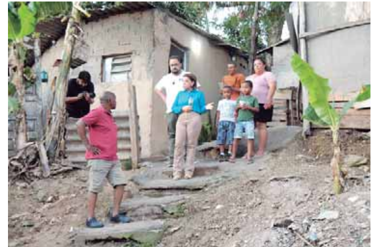
Bebel na comunidade Três Porquinhos, aonde o esgoto corre a céu aberto