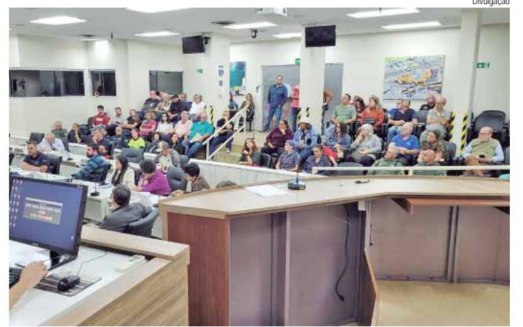
Audiência sobre mortandade de peixes no Tanquã foi no último dia 28

até mesmo pássaros e peixes. Além do microchip, o tutor recebe uma placa com QR Code para uso na coleira de cães e gatos. Ao escanear a medalha, a pessoa que encontrou o animal visualiza os dados cadastrais e o tutor recebe a localização onde foi feita a leitura. “Os microchips ainda não funcionam como GPS, porém a leitura do QR Code da medalha que acompanha o conjunto fornece a informação do local atual do pet e agiliza o contato com quem resgatou o animal”, revela o engenheiro mecânico e fundador da empresa, Carlos Gustavo de Camargo Ferraz Machado. O microchip acompanha ainda um certificado, que é obrigatório para viagens internacionais e como prova de propriedade do animal, em caso de furto ou roubo.