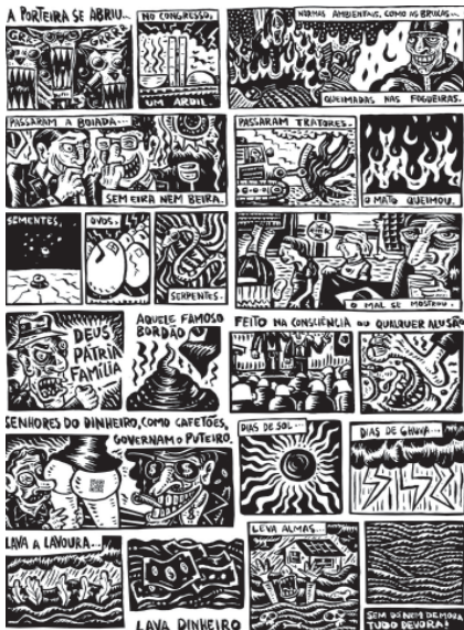
Luciano Irrthum -Brasil Premio Tiras (parte 1)