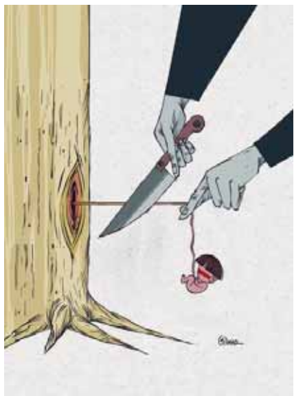
Gilmar Machado - Brasil Premio cartum e Grande Premio