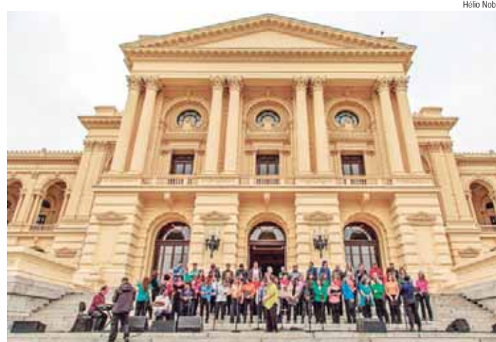
O evento contará também com jogos e desafios, oficinas, caminhadas, contação de histórias e intervenções artísticas

Em colaboração com o Sesc Ipiranga, o dia contará com oficinas, contação de histórias e vivências culturais. Os horários das atividades podem ser consultados nos sites do Museu do Ipiranga e do Sesc Ipiranga.