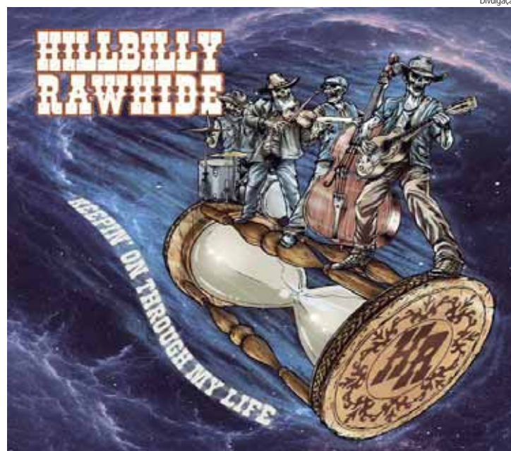
O novo disco tem arte da capa assinada por Anderson Natureza Morta

O lançamento é dia 20 de outubro no festival Lucky Friends Rodeo, que acontece dias 19 e 20 em Sorocaba. O lançamento também pode ser acompanhado pelas plataformas digitais do festival.