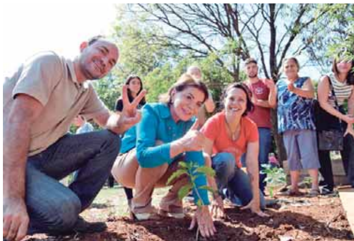
Bebel participa do bairro do Piracicamirim do plantio de muda de árvore no 'Dia da Sustentabilidade'