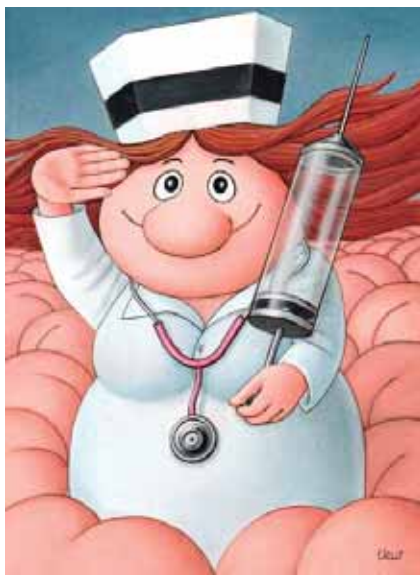
Izabela Kowalska Wiecezrek Polonia - Premio Saude Unimed