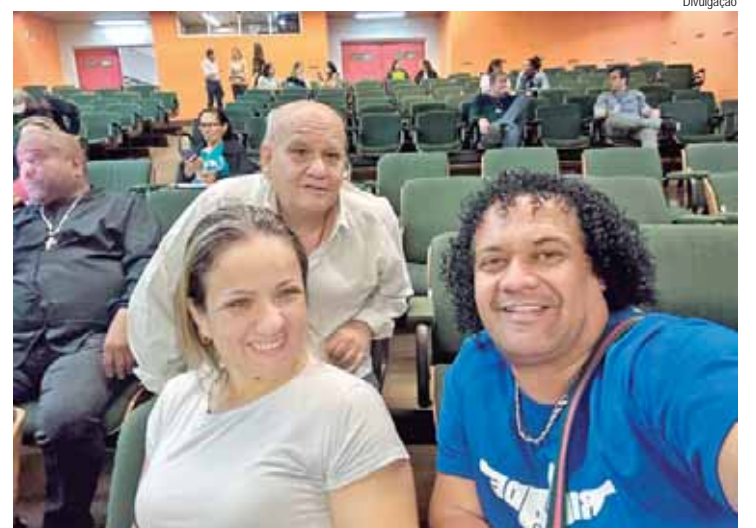
Soares participou do workshop 'Saúde digital: modernidade no SUS'

Projetada originalmente para ser um monumento em comemoração à Proclamação da Independência, a construção foi aberta ao público como sede do Museu do Estado (Museu Paulista) em 1895. Desde então, o Museu do Ipiranga se mantém como uma das sedes do Museu Paulista. Atualmente, é um Museu especializado em história e cultura material, integrando a Universidade de São Paulo desde 1963.