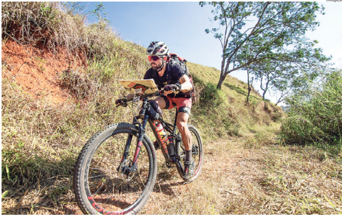
Na quarta etapa do maior circuito de aventura do Brasil, estância recebe cerca de 300 atletas

A presença massiva de atletas e turistas reflete diretamente na economia local. Hotéis e pousadas têm alta taxa de ocupação, enquanto bares e restaurantes são tomados por uma clientela animada para experimentar a gastronomia local. O comércio, incluindo lojas