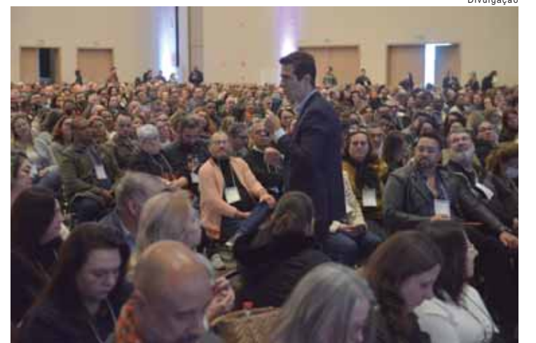
Encontro acontece em Campinas e tem foco na melhora do aprendizado no Estado

Ou seja, com o Gabinete 3D, o Governo de SP vai levantar quais são os pontos de melhorias e de crescimento de cada região e discutir ações regionalizadas. Para a gestão estadual, o diálogo propiciado pelos encontros dos secretários com as lideranças locais será essencial para entender e solucionar problemas, melhorar serviços e ter o senso de urgência necessária para cuidar das pessoas.