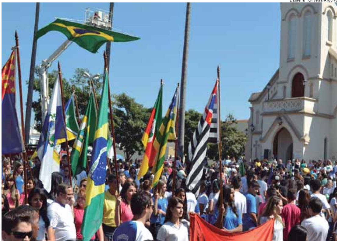
Concentração será às 7h30 e início às 8h; evento vai percorrer a rua Veríssimo Prado com destino a praça Matriz

O desfile tem início na rua Veríssimo Prado, passando pelas ruas Malaquias Guerra, Joaquim Teixeira de Toledo e terminando em frente à Igreja da Matriz. No desfile, o público poderá acompanhar a passagem de carros, ciclistas, cavalaria, Corpo de Bombeiros e batalhões da Polícia Militar. Os alunos da rede municipal de Educação vão fazer no desfile um convite para que todos observem a importância da preservação ambiental. Fazendo alusão à letra do hino nacional, "gigante pela própria natureza", vão contar em 4 alas, sobre "O resgate do nosso lado verde".