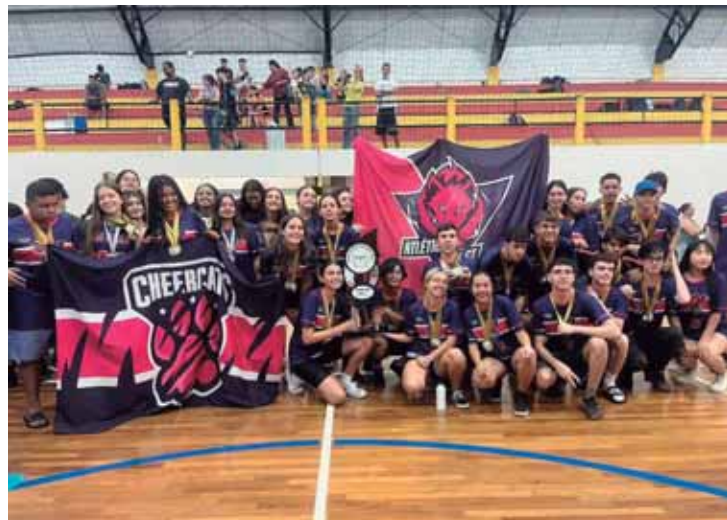
2º lugar Escola ETEC Gustavo Teixeira