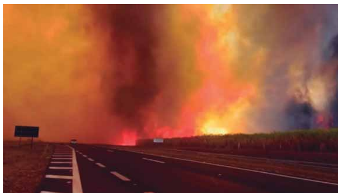
Queimadas provocaram prejuízos de mais de R$ 1 bilhão ao agro de SP

A Defesa Civil do Estado alerta que os últimos dias do mês de agosto serão mais quentes e com grande risco de queimadas nas regiões produtivas do Estado. Para evitar o cená-