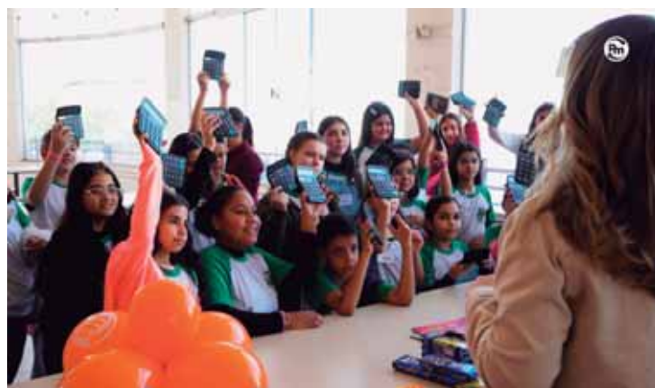
Trata-se de um projeto de Educação Financeira e Consumo Consciente

Para tornar a experiência ainda mais real, cada aluno recebeu um cartão vale-compra e utilizou carrinhos infantis para simular uma compra completa. A Rede de Supermercados Pague Menos, presente em 20 cidades do interior de São Paulo com 36 lojas físicas e e-commerce, vai além do papel de um simples comércio varejista alimentar. Comprometida com o desenvolvimento social das comunidades onde atua, a rede promove o consumo consciente e saudável através de diversos apoios e patrocínios, além de iniciativas como o projeto "Economizando com a Família". Neste contexto, a educação financeira se torna um pilar essen-