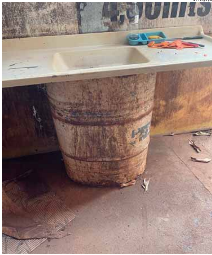
Ação foi a maior da história no Brasil, com 593 resgatados

Em depoimento prestado às autoridades, a empregada disse que continuava cuidando dos afazeres domésticos, além de cuidar do empregador idoso, e que recebia ordens do casal. Ela trabalhava de segunda a sábado, das 7 às 21 horas, e aos domingos "passava um pano na casa e lavava a louça". Trabalhava no Natal, 1º de janeiro, carnaval, e recebia um "agrad" de R$ 500,00 por mês. Nunca tirou férias, e nas vezes em que viajou, o fez para cuidar do empregador idoso. Nesse caso, a família se comprometeu a comprar uma casa para a trabalhadora, além de pagar uma indenização de R$ 50 mil, a título de dano moral individual.