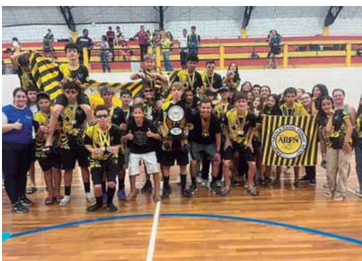
3º lugar Escola Abdala Rahal Farhat Neto