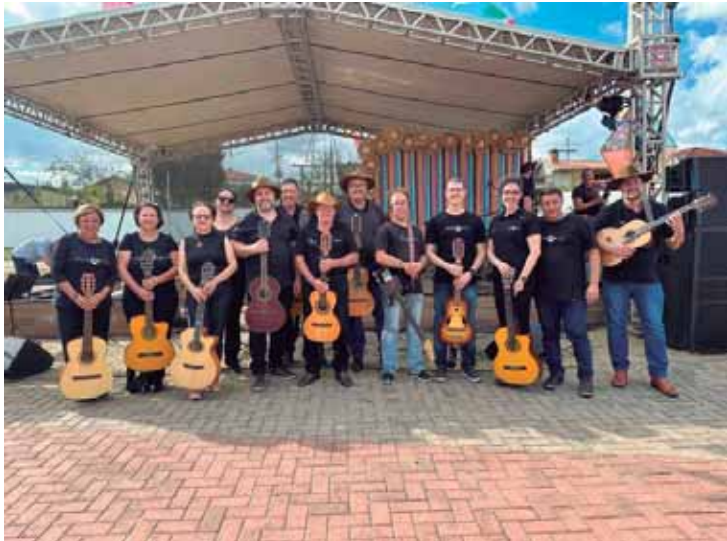
Apresentação será no coreto da praça Gustavo Teixeira