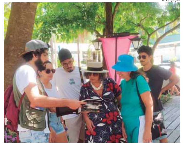
Turismólogos de plantão farão bate papo no sábado