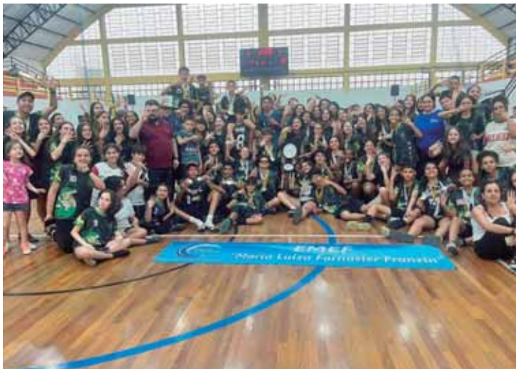
1º lugar Escola Maria Luiza Fornazier Franzim

competições foi: 1º lugar Escola Maria Luiza Fornazier Franzim, 2º lugar Escola ETEC Gustavo Teixeira, 3º lugar Escola Abdala Rahal Farhat Neto e 4º lugar Escola Gustavo Teixeira.