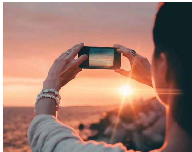
Os interessados devem se inscrever na Coordenadoria de Cultura