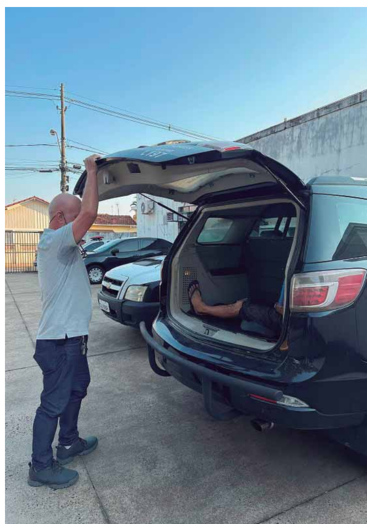
O homem de 56 anos foi preso por furtar várias casas dos bairros Mariluz e Botânico

"O Conseg (Conselho de Segurança), composto por moradores da cidade, vinha há meses aguardando a prisão do autor de tais delitos que estava tirando a paz dos moradores do bairro Mariluz e Botânico. Após os atos de polícia judiciária o capturado será encaminhado para uma cadeia em Piracicaba", informou a Polícia.