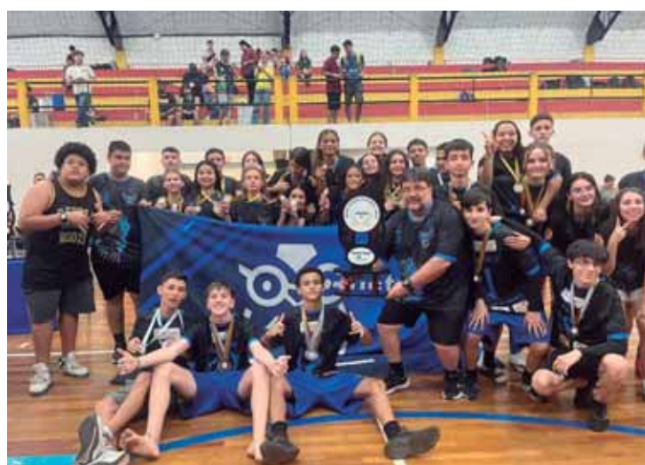
4º lugar Escola Gustavo Teixeira