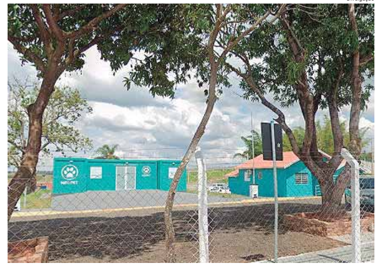
Meu Pet Vanessa Targher fica na avenida Paschoal Antonelli, 345, bairro Colinas

entre o Estado de São Paulo, pela Secretaria de Turismo e Viagens com o Município de São Pedro; Termo Aditivo respectivo convênio com seus anexos; Projeto básico da Obra; e Diário de obra. "A nossa intenção é de concluir todo processo em 120 dias, mas também dependemos das respostas e dos documentos da Prefeitura", ressaltou.