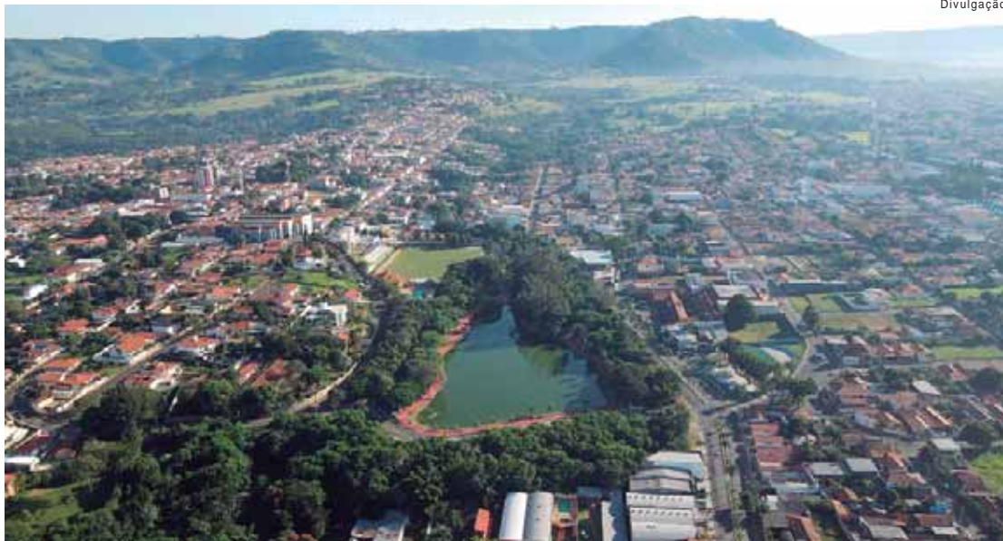
Atualmente estão registradas em São Pedro 5.209 pequenas e médias empresas, aumento de 256% na última década

Para manter esse cenário atrativo, a administração municipal aderiu a dois programas de referência nacional, que visam abreviar, simplificar e digitalizar os procedimentos para a abertura de empresas e diminuir o tempo e o custo para o registro e legalização dessas empresas, reduzindo a burocracia ao mínimo necessário: o Redesim (Rede Nacional para a Simplificação do Registro e da Legalização de Empresas e Negócios),