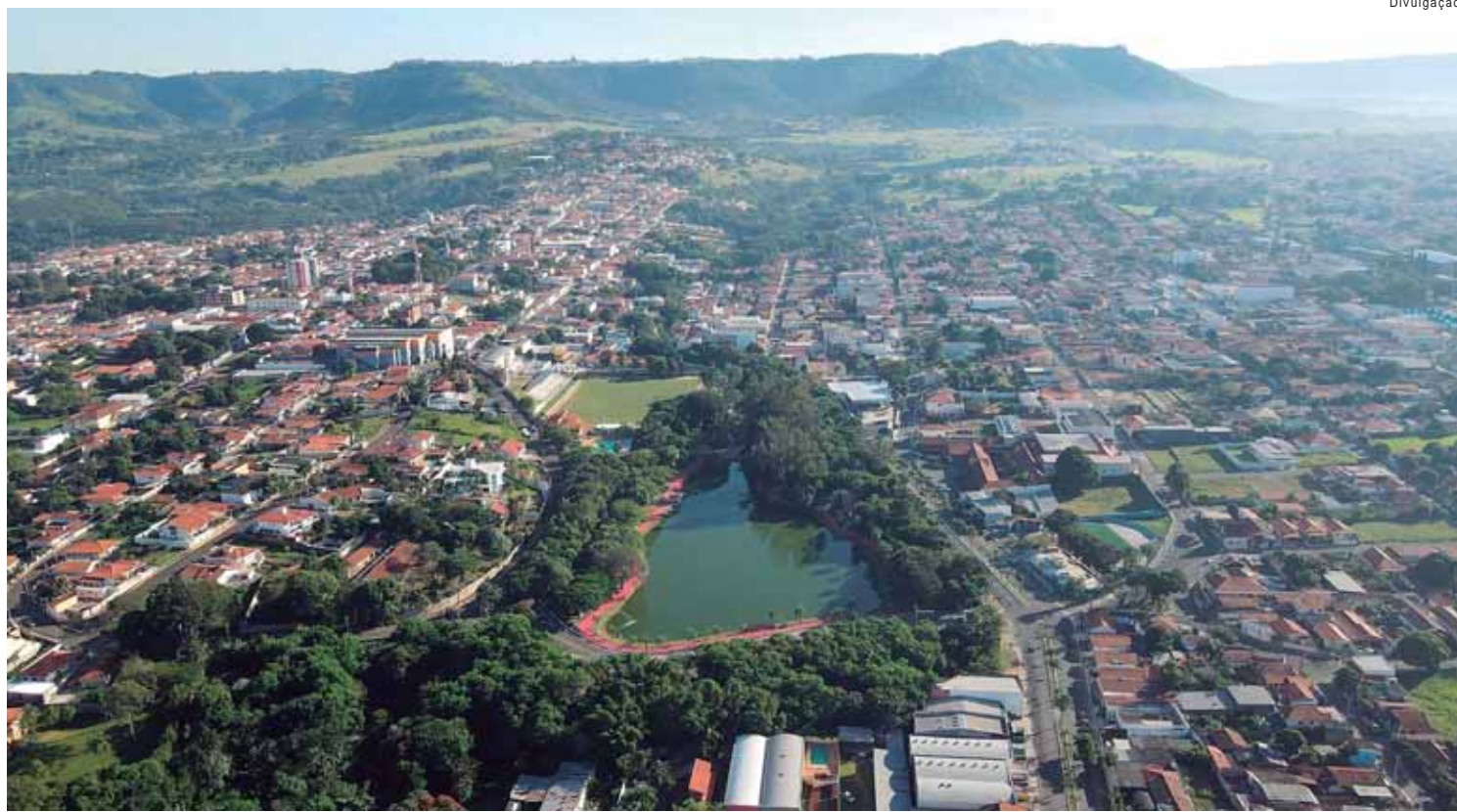
Atualmente estão registradas em São Pedro 5.209 pequenas e médias empresas, aumento de 256% na última década

A cidade conta com 5.209 pequenas e médias empresas, um aumento de 265% na última década; crescimento de 36,2% no número de assalariados