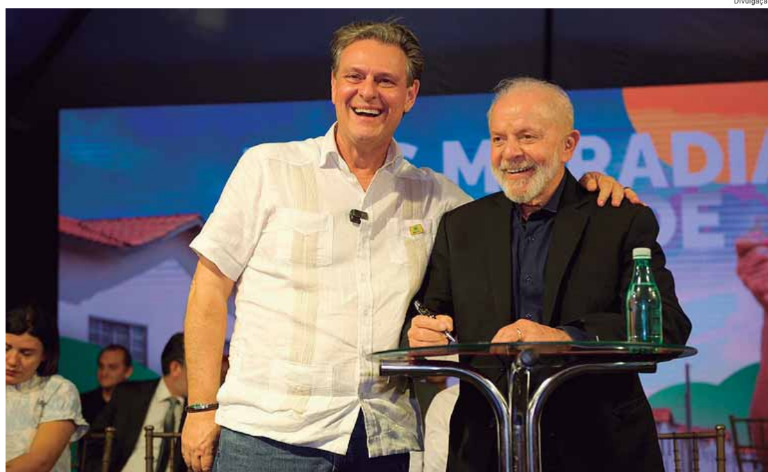
A ampliação foi assinada pelo presidente da República, Luiz Inácio Lula da Silva, na quarta-feira (29)

"Desde o início da gestão do presidente Lula, temos batido recordes de aberturas de mercado,