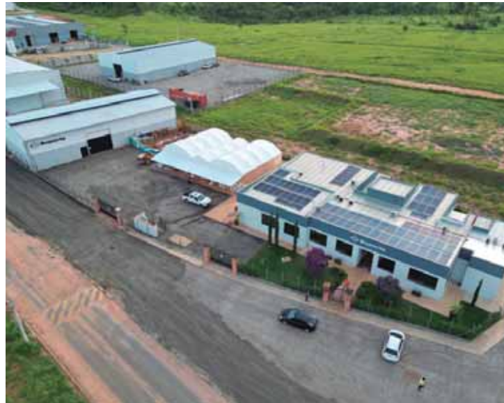
Com atuação no setor de infraestrutura, a empresa de São Pedro ocupa a 27ª posição no ranking de empresas com faturamento entre R$ 20 e R$ 150 milhões