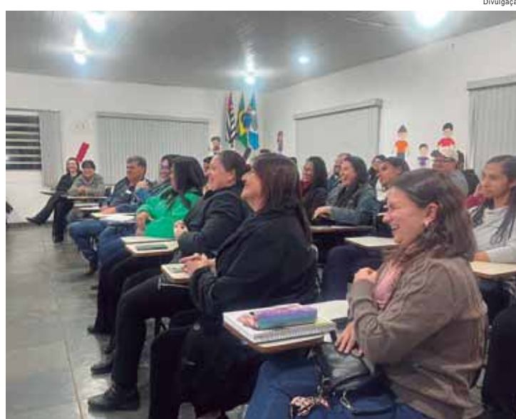
São 26 alunos matriculados no primeiro curso de graduação público oferecido na cidade

O polo local da Univesp oferece os cursos de administração, letras, matemática, engenharia de produção, entre outros. Os alunos matriculados e que começaram o curso nesta semana fizeram processo seletivo através de vestibular, amplamente divulgado no primeiro semestre.