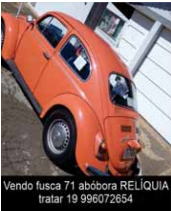
Vendo fusca 71 abóbora RELÍQUIA tratar 19 996072654