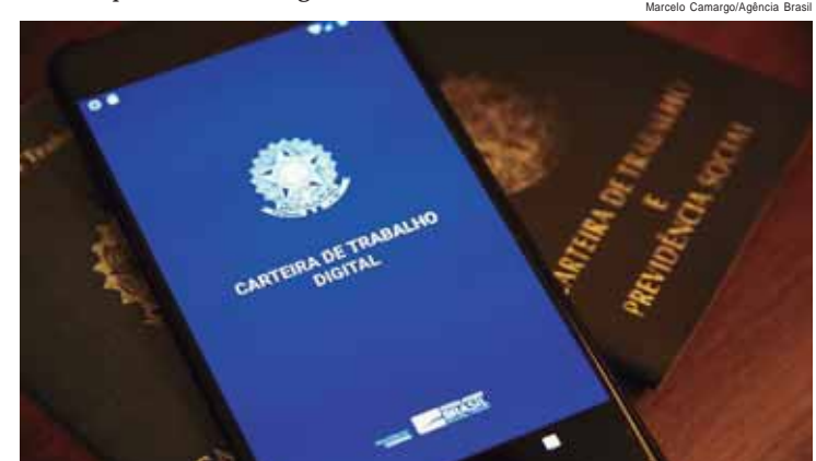
O Brasil já criou, no acumulado do ano, 1,3 milhão de empregos formais e, nos últimos 12 meses, o total chega a 1,7 milhão

OUTROS DADOS - O salário médio real de admissão em junho ficou em R$ 2.132,82, com estabilidade (queda de R$ 5,15, -0,2%) em comparação com maio (R$ 2.137,97). Já em comparação com o mesmo mês do ano anterior, o que desconta mudanças decorrentes da sazonalidade do mês, o ganho real foi de R$ 43,28 (+2,1%). O saldo também ficou positivo para mulheres (89.616), homens (112.089) e para população com deficiência (+363).