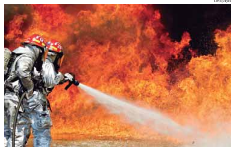
A ação acontece no sábado, dia 3 de agosto, em Piracicaba

RAÍZEN CONVIDA - A empresa convida a população a participar e contribuir na disseminação de dicas de segurança e práticas de prevenção, além de reforçar os cuidados necessários com as doenças respiratórias que ocorrem neste período.