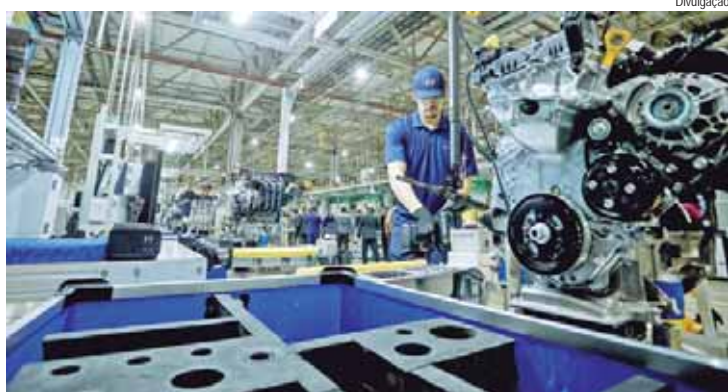
O setor com maior destaque na empregabilidade em julho de 2024 foi o da Indústria, com saldo positivo de 330 vagas

Piracicaba registrou um saldo positivo de 796 novos postos de trabalho formais em julho, segundo dados divulgados pelo Caged (Cadastro Geral de Empregados e Desempregados) do Ministério do Trabalho, com o setor de Indústria liderando a criação de vagas. De janeiro a julho deste ano já foram criadas 4.130 vagas de emprego no município.