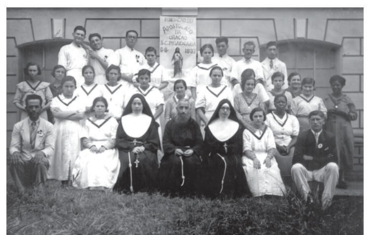
Fundação do Apostolado da Oração da Santa Casa, em 1937