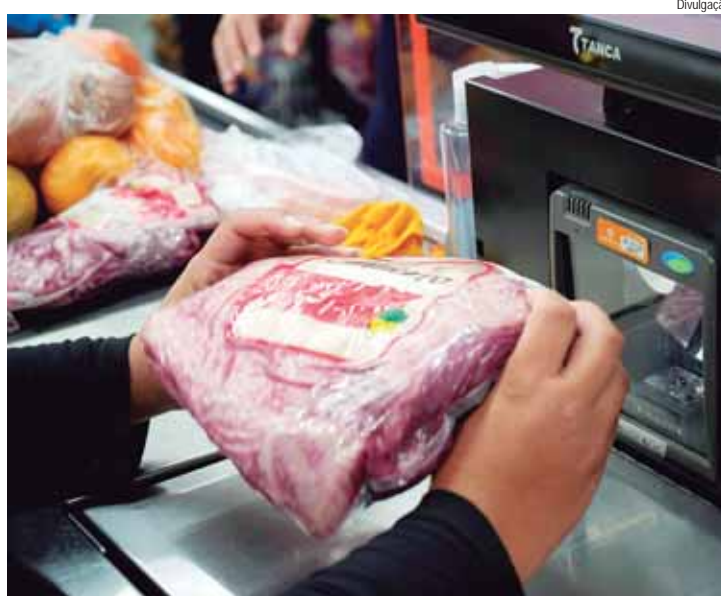
Lojas do Parque Prado, em Campinas, e unidade de Valinhos, terão ação de vagas nesta sexta-feira, dia 30 de agosto

As ações de emprego representam uma valiosa oportunidade para candidatos e empregadores se conectarem e explorarem possibilidades mútuas. Para o candidato é uma chance de avançar em suas carreiras; para a empresa é uma maneira eficaz de identificar e atrair talentos de alta qualidade. Com a preparação adequada e um engajamento ativo, as feiras de emprego podem ser uma experiência mutuamente benéfica, promovendo o crescimento e a inovação no mercado de trabalho.