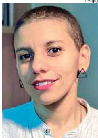
Antropóloga vai debater o tema "Masculinidades e violência(s)" hoje (29), 19h, no Instituto CPFL, com entrada gratuita e transmissão via Youtube

Os encontros são presenciais e gratuitos, com entrada por ordem