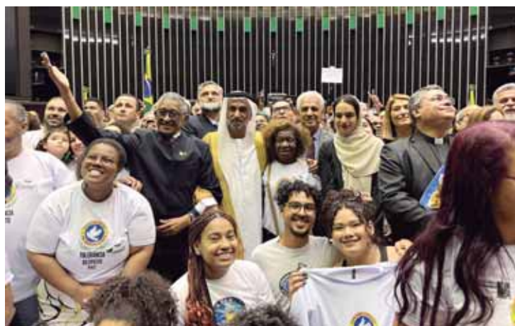
Sessão solene na Câmara dos Deputados

Vicentinho ainda participou de uma reunião com o presidente do Supremo Tribunal Federal (STF), Luís Roberto Barroso, e parlamentares latinoamericanos. O presidente do STF, Barroso manifestou apoio às iniciativas discutidas e destacou a importância do diálogo internacional para enfrentar os desafios contemporâneos.