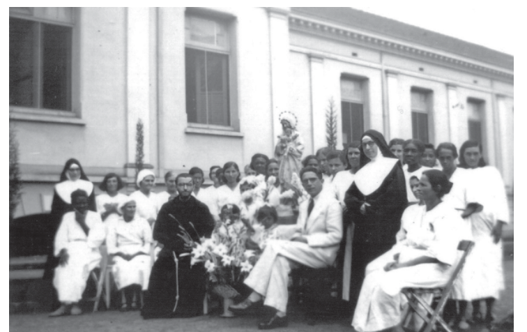
Frei, freiras, autoridade e pacientes durante procissão na Santa Casa