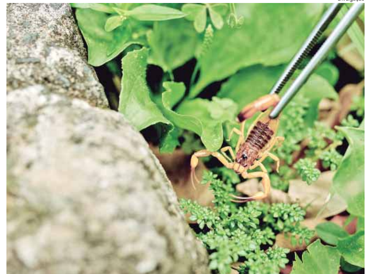
Período entre setembro até março é considerada de maior ocorrência de acidentes uma vez que os escorpiões costumam se reproduzir nesta época

CCZ – Outras informações e orientações sobre prevenção, educação e orientação sobre animais peçonhentos deve ser buscadas pelo SIP 156 e, caso seja necessá-