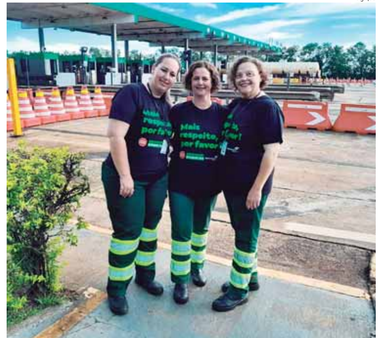
As ações contam com comunicados internos para a conscientização dos funcionários

PROJETO "NÃO SE CALE" - Um aspecto importante da campanha é a capacitação obrigatória por lei para a aplicação do protocolo