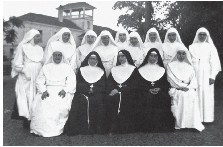
Atuação das irmãs foi fundamental à Irmandade, que crescia, consolidando seu perfil de referência regional já em 1936