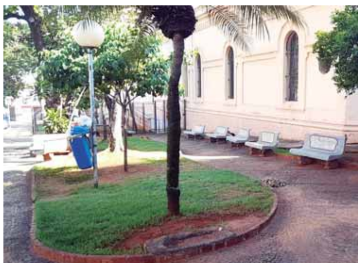
Bancos com publicidade, marcas de um tempo