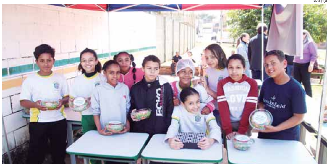
Os alunos do 5º ano da escola Maria Aparecida realizaram uma venda de saladas como parte de um projeto voltado para o aprendizado de sustentabilidade e empreendedorismo

Durante a atividade, os alunos aprenderam a adquirir insumos, embalar e preparar os produtos, desenvolver estratégias de marketing e controlar o caixa e o volume de vendas. O evento contou com a presença de secretários municipais, coordenadoras da educação, diretoras, professoras e as famílias dos alunos.