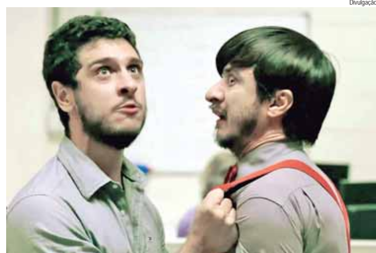
O filme Na Pressão é inspirado nos filmes dos irmãos Coen

é uma produção documental de ficção, com direção de Guilherme Martins, de 25 minutos. Aborda o dia a dia de Alex, um trabalhador rural e lavador de pratos, retratado no campo e na cidade grande.