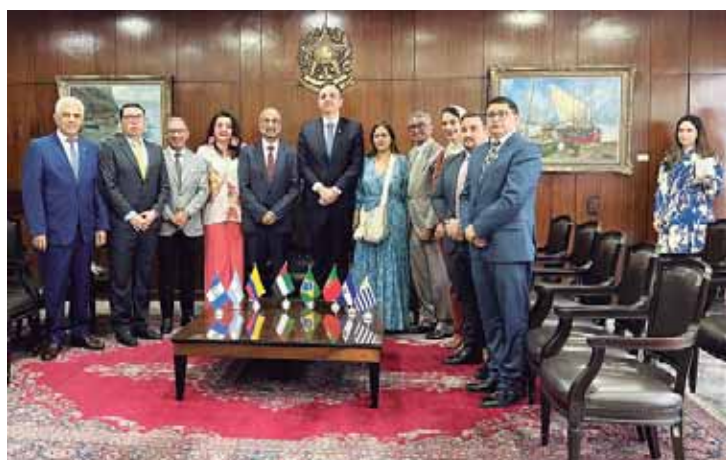
Sessão com o Presidente do Senado brasileiro, Rodrigo Pacheco