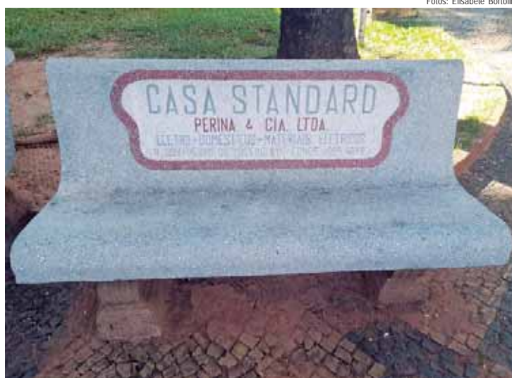
Casa Standard, da família Perina, comércio de aparelho de TV