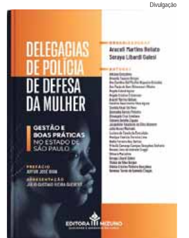
Dirigentes do Sindicato dos Delegados de Polícia do Estado de São Paulo (Sindpesp) estão entre as autoras da obra

"Lançamos mão de um atendimento holístico e que melhorou, e muito, o acolhimento às vítimas", defende.