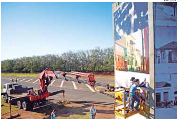
Previsão é que o trabalho de revitalização dure cerca de três semanas

O Portal de Entrada Pilé Degaspari, um dos principais símbolos de Rio das Pedras, está passando por um processo de revitalização. A área ao redor do portal, que frequentemente recebe manutenção como corte de grama e poda de árvores, agora está recebendo também uma atualização das fotos que revestem a estrutura.