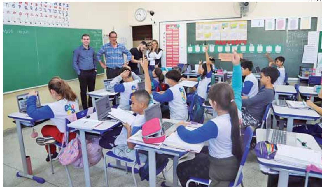
A Escola Municipal Maria Benedicta Pereira Penezzi, localizada no Bairro Campestre, teve a melhor nota do município no Ideb 2023