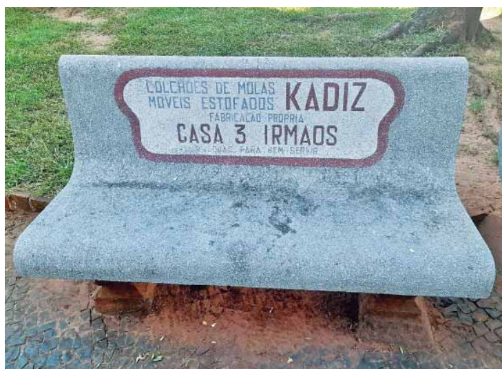
Casa Três Irmãos, família Sturion, tradicional no ramo de móveis