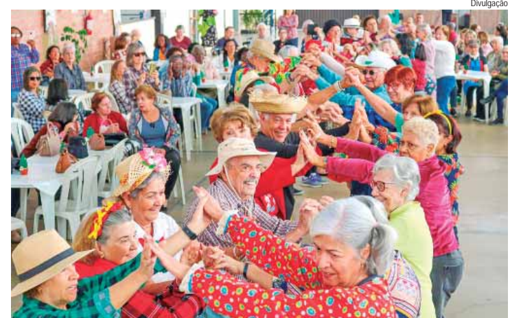
Projeto com pessoas idosas; mostra irá reunir propostas de trabalhos e experiências com diferentes temas

O objetivo é promover ações e discussões para aprimorar e fortale-