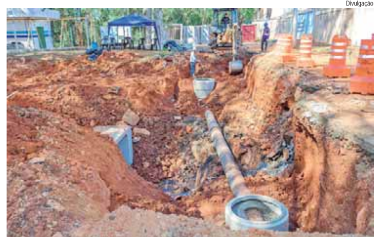
Objetivo é ampliar o sistema, para facilitar o suporte do fluxo durante chuvas intensas

A Prefeitura de Piracicaba, por meio da Secretaria de Mobilidade Urbana, Trânsito e Transportes (Semuttran), iniciou obras de drenagem na região do bairro Areão, com instalação de rede de águas pluviais em um total de 375 metros de extensão. A nova tubulação será complementar à rede já existente, para que, assim, o sistema de drenagem consiga suportar o fluxo durante chuvas intensas.