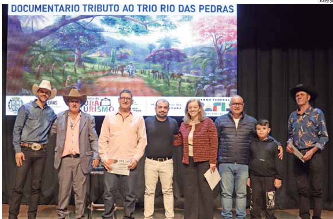
Projeto foi apresentado ao público no sábado (24)

Após a exibição do documentário, o Trio Rio das Pedras realizou uma apresentação, com a participação de um músico convidado. Ao final da noite, o trio foi convidado pelo Secretário de Cultura da cidade para se apresentar na FIACOM, prevista para o mês de setembro.