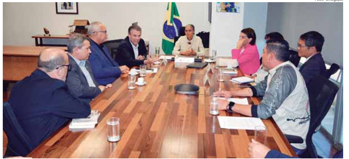
A audiência contou com a participação da ministra do Meio Ambiente, Marina Silva, e do ministro da Pesca, André de Paula