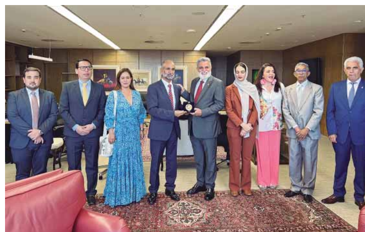
Encontro com ministro Lelio Bentes Corrêa