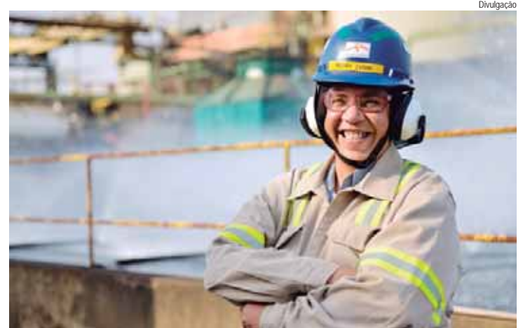
Programa Expert 2024 está com inscrições abertas até 06 de setembro e a admissão das pessoas selecionadas está prevista para novembro

São disponibilizadas vagas nas áreas de Aciação, Laminação, Redução, Logística, Manutenção, Qualidade, CTO, Beneficiamento, Renováveis, Processos e Geologia na Siderurgia, Mineração e Bio-Florestas. Os pré-requisitos para os interessados são: mínimo de 5 anos de formação acadêmica e solidez de experiência na área de interesse. "Nos primeiros dois me-