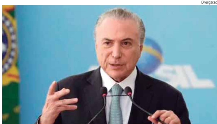
Associação dos Procuradores do Estado de São Paulo fará tributo ao ex-presidente da República

O ex-presidente da República, Michel Temer, será homenageado pela Associação dos Procuradores do Estado de São Paulo (APESP) nesta quinta-feira (29), às 13h, no Espaço APESP, localizado na Rua Tuim, nº 932, em Moema. O evento vai homenagear os associados recém-aposentados da Procuradoria do Estado de São Paulo (PGE/SP).