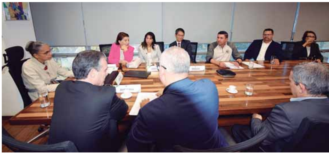
A audiência em Brasília foi realizada no Ministério do Meio Ambiente, com os ministros Marina Silva e André de Paula