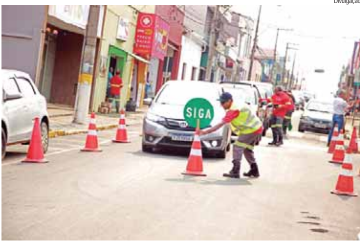
A iniciativa ocorreu na rua principal da cidade