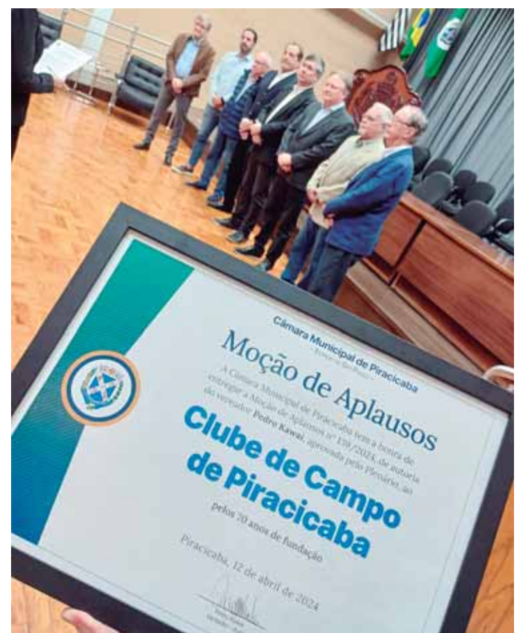
A Moção de Aplauso destaca a importância histórica e social do Clube de Campo de Piracicaba