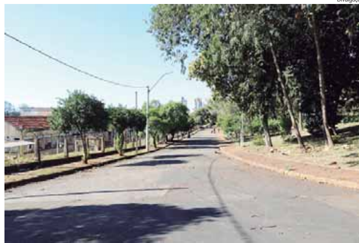
Rua Benedicto Lucio Maciel será parcialmente interditada para a operação

AUXÍLIO - Durante esse período de adequação da ETA Luiz de Queiroz e até que seja necessário durante a estiagem, uma transportadora de água potável contra-