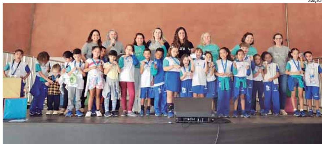
O primeiro dia da feira foi marcado por uma cerimônia especial de abertura, que contou com a entrega de medalhas para os alunos da Rede Municipal

Ao final do evento, a escola que elaborou o projeto mais votado receberá um kit de ciências e matemática da abordagem STEAM (acrônimo para Ciênci-