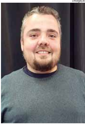
Denis quer motivar os professores do ensino fundamental com a iniciativa

"Ao desenvolver esse trabalho buscamos compreender como a Educação Ambiental é trabalhada nas escolas. Esperamos que este conteúdo seja um instrumento para motivar professores e gestores da educação na