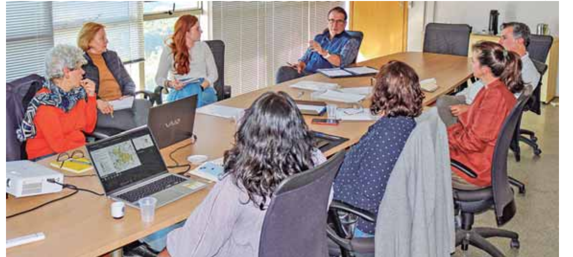
Para acompanhar a evolução urbana, Executivo recebe Diagnóstico Técnico e Comunitário de Piracicaba