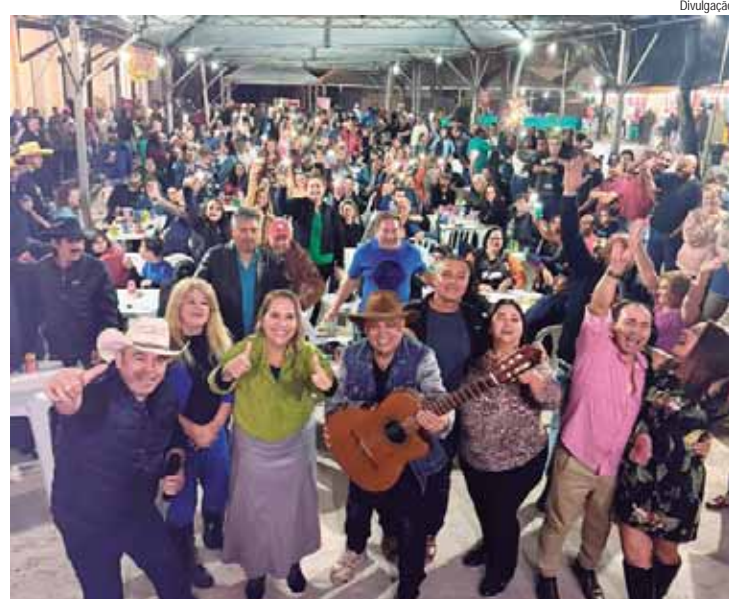
Foram três dias de festa no Distrito de Ártemis

No último final de semana ocorreu a 18ª Festa da Mandioca de Ártemis. Neste ano, o evento voltou à praça João Alfredo, resgatando uma tradição. A festa foi organizada pela associação de moradores União para o Desenvolvimento Sustentável do Distrito de Ártemis, com entra-