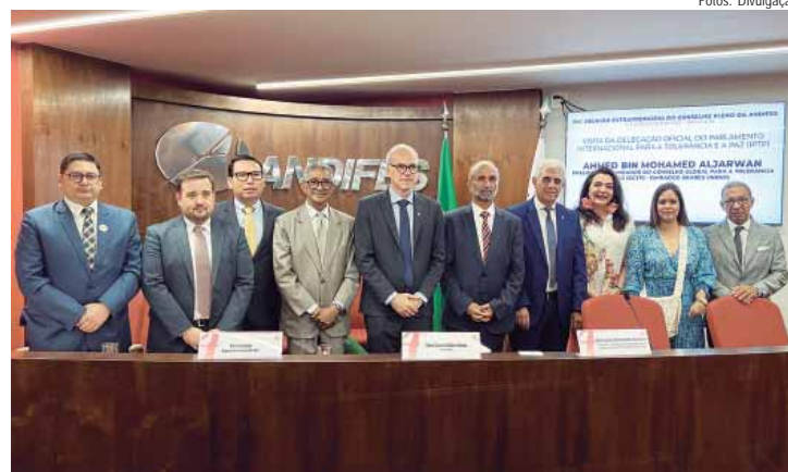
Reunião do Conselho Pleno da Associação Nacional dos Dirigentes das Instituições Federais de Ensino Superior