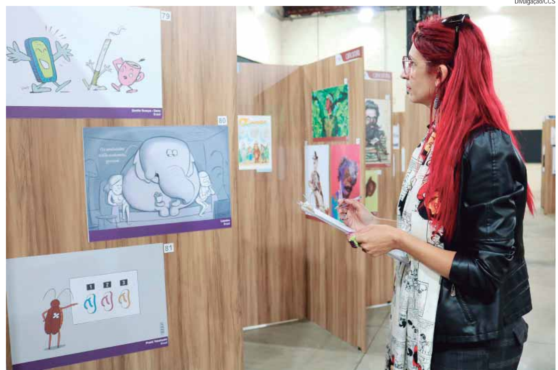
Thina Curtis escolhe obras premiadas da 51ª edição

QUADRO ATÍPICO — Segundo a diretora de Ciência do Ipam, Ane Alencar, se trata de um quadro atípico. “É como se fosse um Dia do Fogo exclusivo para a realidade do estado, evidenciado pela cortina de fumaça simultânea que surge visualmente a oeste”, observa, em referência ao episódio, em agosto de 2019, quando fazendeiros do Pará provocaram incêndios na Amazônia, atingindo unidades de Conservação e terras indígenas. (Letycia Bond, da Agência Brasil)