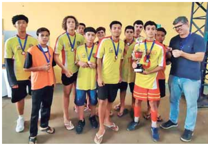
Saltinho levou o bronze no futsal masculino

"A grande importância desse trabalho é tentar elucidar o que pode contribuir para o desencadear da doença no organismo de um indivíduo, ou seja, qual via no organismo está desregulada e pode ocasionar a origem da doença. Com o aumento da expectativa de vida da população já sendo uma realidade, e considerando que doenças relacionadas ao envelhecimento, como o Alzheimer, irão aumentar exponencialmente, torna-se cada vez mais necessário reunir esforços para entender a origem dessa doença. Assim, será possível desenvolver medicamentos que possam diminuir a probabilidade de uma pessoa desenvolver Alzheimer ou, até mesmo, a possibilidade de cura, visto que, até o momento, a doença de Alzheimer não tem cura e leva à incapacidade cognitiva e funcional do indivíduo acometido. Além disso, gera uma sobrecarga para seu cuidador, que normalmente é um cuidador familiar e que, na maioria dos casos, precisa abdicar de suas demandas laborais para assumir os cuidados integrais da pessoa com Alzheimer. E não somente isso, mas também é uma doença que gera altos custos para as políticas públicas de saúde", explica a pesquisadora.