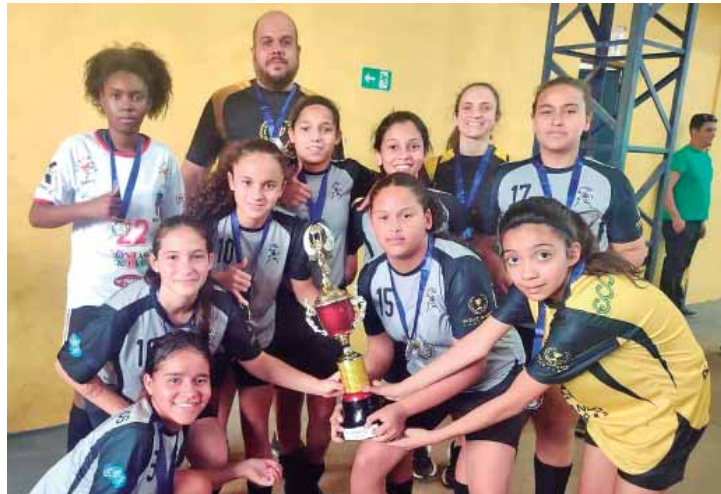
Rio Claro, medalha de prata do futsal feminino