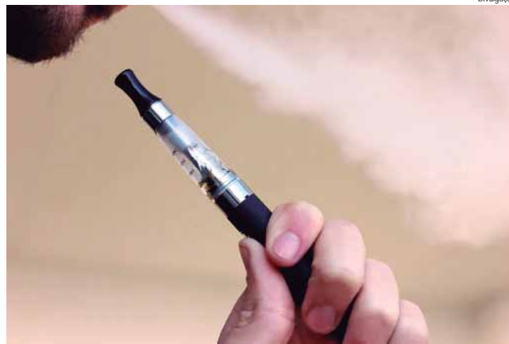
Em 29 de agosto é celebrado o Dia Nacional de Combate ao Tabagismo

O comércio ou distribuição dos cigarros eletrônicos é proibido no Brasil, desde 2009, pela Anvisa. Mas o projeto de lei (PL 5008/2023) em andamento no Senado Federal, se aprovado, irá autorizar a produção, o consu-