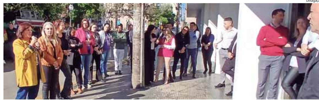
O Sindban tem mobilizado a categoria para que todos participem das ações

O Sindban tem mobilizado a categoria para que todos participem das ações e possam integrar o movimento que reivindica reajuste salarial que corresponde à reposição pelo Índice Nacional de Preços ao Consumidor (INPC)