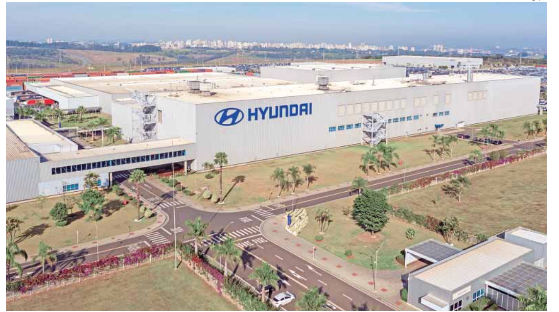
Hyundai recebe pelo sexto ano consecutivo o Selo Ouro no Programa Brasileiro GHG Protocol

"A renovação do Selo Ouro GHG comprova o trabalho contínuo da Hyundai para otimizar as emissões provenientes de nossas operações. Nosso objetivo é inspirar o setor através do exemplo, promovendo uma relação cada vez mais harmoniosa entre a indústria e o meio ambiente, e caminhando em direção a um futuro melhor para as próximas gerações. A certificação de grau máximo é nossa meta anual e continuará a servir como guia para nossas futuras iniciativas de sustentabilidade", afirma Ricardo Mar-