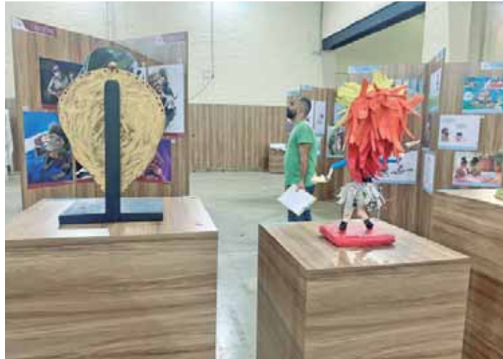
Rafael Coutinho, filho da Laerte, é um dos juris desta edição