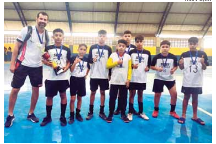
Águas de São Pedro, vice-campeã do torneio de futsal masculino