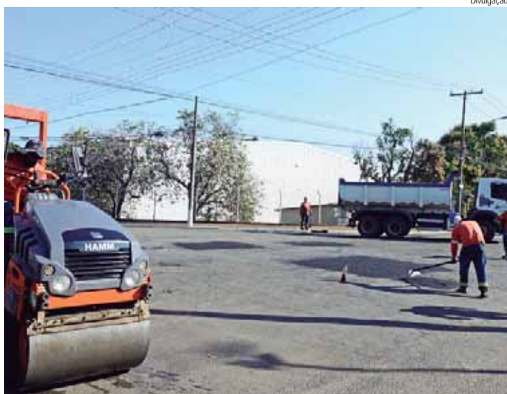
Operação tapa-buraco atendeu 20 bairros na última semana

A Prefeitura de Piracicaba, por meio da Secretaria Municipal de Obras e Zeladoria (Semozel), executou serviços de tapa-buraco na semana de 19 a 23/08 em 24 vias do município, entre avenidas, ruas, travessas e rodovias. Ao todo, as equipes percorreram 20 bairros. Por meio da operação Tapa-buraco, a Semozel atende solicitações via SIP (Serviço de Informações à População) - 156 e vereadores, além das necessidades pontuais que as equipes verificam nas vias que percorrem.