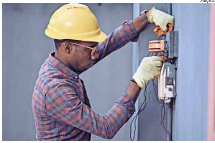
Aulas ofertadas em parceria com o Senai serão realizadas na Casa do Amor Fraterno