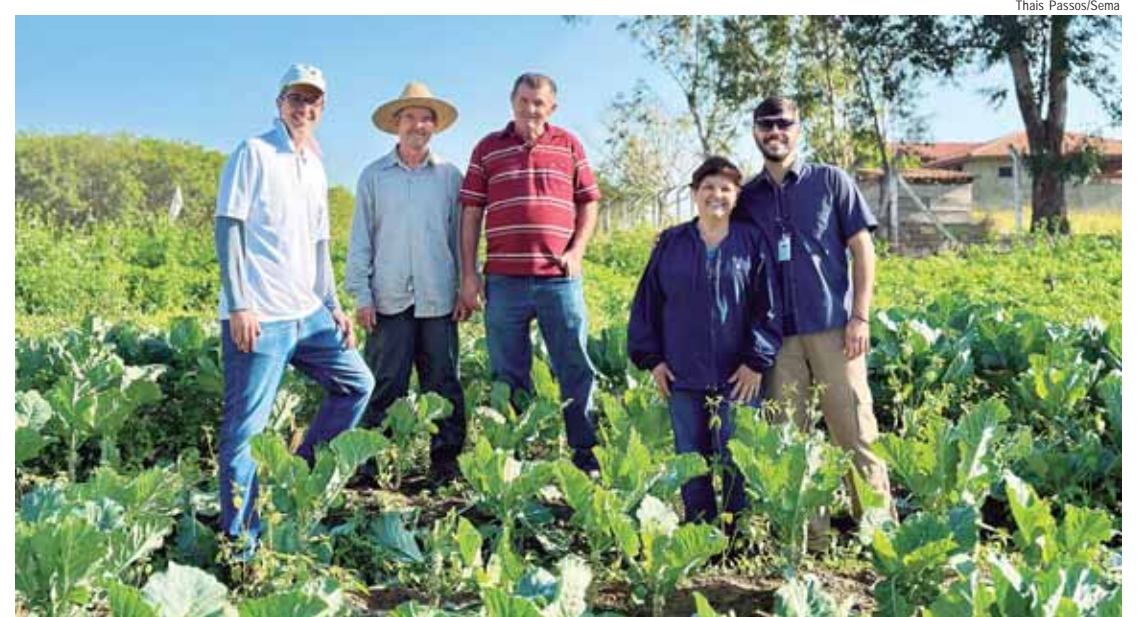
Programa Municipal de Adequação Ambiental Rural será coordenado pela Sema