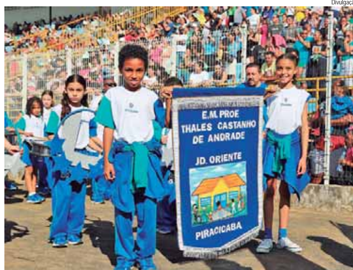
O desfile cívico contará com as escolas da Rede Municipal de Educação

ESTRUTURA - Ao público que irá acompanhar o desfile, estarão disponíveis pontos de água e banheiros nas estruturas do Barão, contando com bebedouros em pontos estratégicos. Além disso, os bebedouros e banheiros do Ginásio de Esportes José de Oliveira Garcia Neto também estarão disponíveis para uso. A segurança do evento será realizada pela Guarda Civil Municipal e pela Polícia Mili-