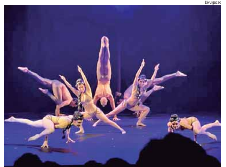
A companhia apresenta as obras Shakti e Déjà-Vu dia 7 de setembro, às 19 horas no Sesi Piracicaba

Déjà Vu é uma obra coreográfica que explora a complexidade das memórias e a jornada de autoconhecimento, refletindo sobre a formação da identidade por meio