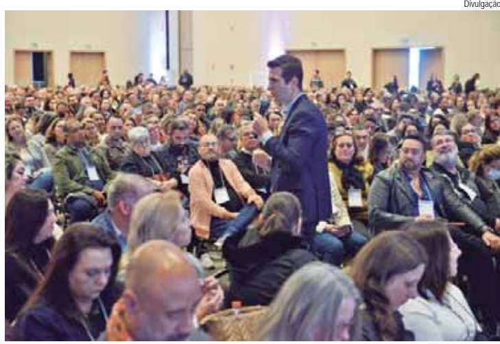
Encontro acontece em Campinas e tem foco na melhora do aprendizado no Estado