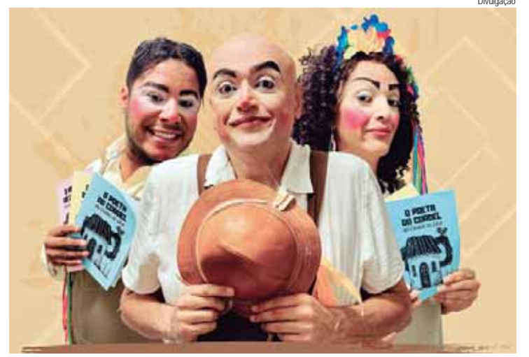
A montagem do espetáculo teve início há dois anos com a pesquisa bibliográfica relacionada ao cordel

meses em andamento, sendo um dos temas a desconexão e ressalta a importância de os bancos permitirem que os trabalhadores se desconectem", esclarece.