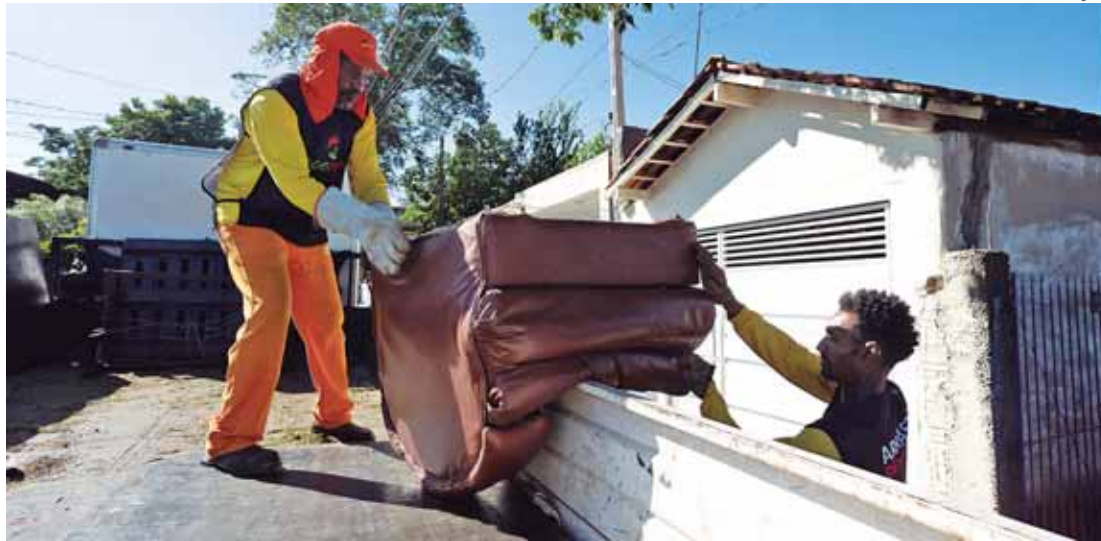
Arrastão da dengue estará na região do Algodual no próximo sábado (31)

abandonados ou locais que tenham possíveis criadouros da dengue basta registrar solicitação no SIP 156 e outras orientações no PMCA pelo telefone (19) 3427-3351.