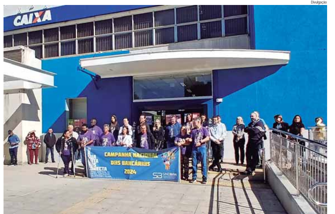
O ato ocorreu antes da próxima rodada de negociações da Fenaban, marcada para terça-feira (27)

Embora o diálogo com a Caixa esteja progredindo, muitas das reivindicações ainda dependem da evolução das negociações na mesa única com os outros bancos. Isso inclui questões como o índice de reajuste salarial, a Participação nos Lucros e Resultados (PLR), os valores refeição e alimentação, além de outras cláusulas econômicas. Ubiratan Campos do Ama-