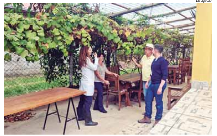
Técnicos da Sema durante visita à videira