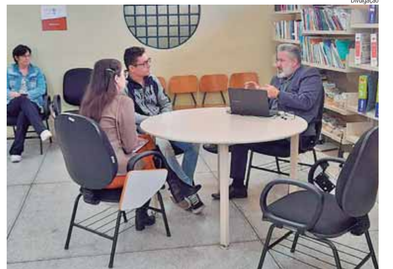
Caravana do Crédito trouxe facilidades a MEIs e auxílio para não-formalizados na região da Pauliceia

CAPACITAÇÕES - Os empreendedores que passarem pela Caravana do Crédito podem se inscrever, gratuitamente, em duas capacitações. O curso Organize Seu Negócio vai tratar temas como comportamento empreendedor, marketing digital, fluxo de caixa e formação de preço de venda de produtos e serviços. Ele será aplicado em quatro dias, de 16 a 19 de setembro, em duas turmas: uma no período da manhã, das 8h30 às 12h; e outra à noite, com aulas das 19h às 22h30. Ao todo são 60 vagas, sendo 30 por turma. As au-