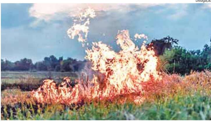
Saiba quais são as principais medidas preventivas para evitar queimadas em áreas urbanas e rurais