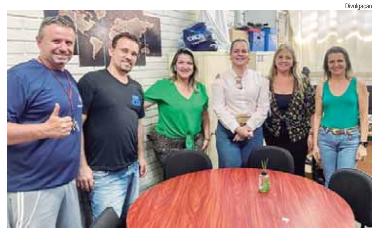
Escola Estadual Prof. Hélio Nehring é palco de palestra sobre a campanha Agosto Lilás

Hoje e amanhã, dias 27 e 28, a Escola Estadual Prof. Hélio Nehring é palco de uma importante palestra sobre a campanha Agosto Lilás, promovida pela Escola da Mulher Piracicabana. O evento visa sensibilizar e educar os estudantes sobre a prevenção da violência doméstica, o apoio às vítimas e o enfrentamento às masculinidades tóxicas. Devem participar aproximadamente 570 alunos do Ensino Médio.