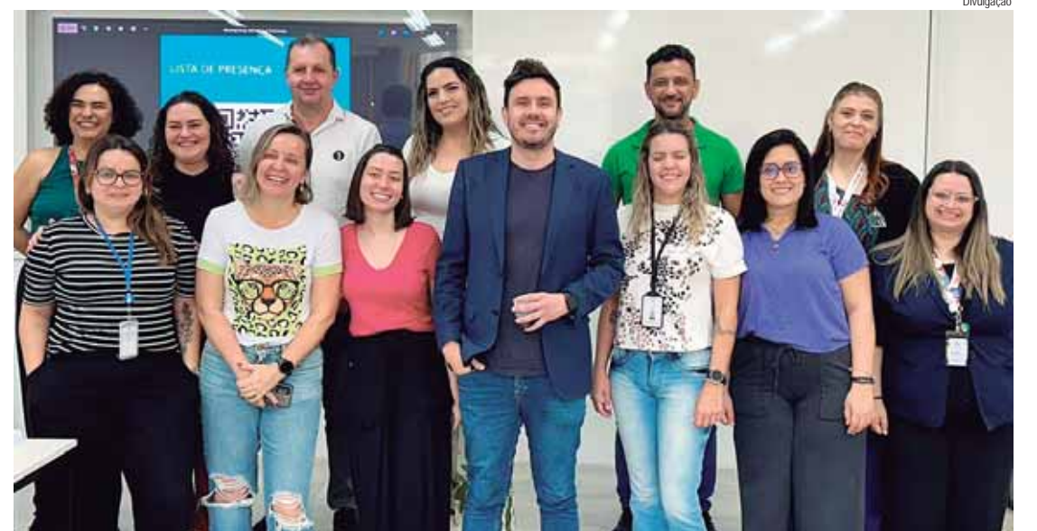
A iniciativa, fruto da parceria entre Pecege e Sicoob Cocre, busca melhorar a gestão de pessoas

"A liderança não é apenas uma questão de exercer autoridade ou gerir equipes, mas também