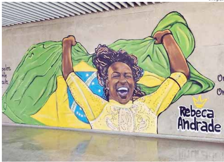
Rebeca Andrade está em uma parede da Estação Aeroporto-Guarulhos

Desde sábado, 24, a maior medalhista olímpica brasileira, Rebeca Andrade, estará eternizada em uma grafite com imagem em uma parede da Estação Aeroporto-Guarulhos, da Linha 13-Jade da CPTM. O rosto sorridente da atleta com os braços abertos erguendo a bandeira do Brasil ganhou espaço no mezanino da área livre da estação. A expressão artística em homenagem à ginasta Rebeca Andrade tem dimensões de 3,80 de altura por 5,80 de largura, uma forma de destacar a magnitude da atleta com maior número de medalhas olímpicas em nosso país. A escolha da estação tem um significado especial, uma vez que ela é natural de Guarulhos.