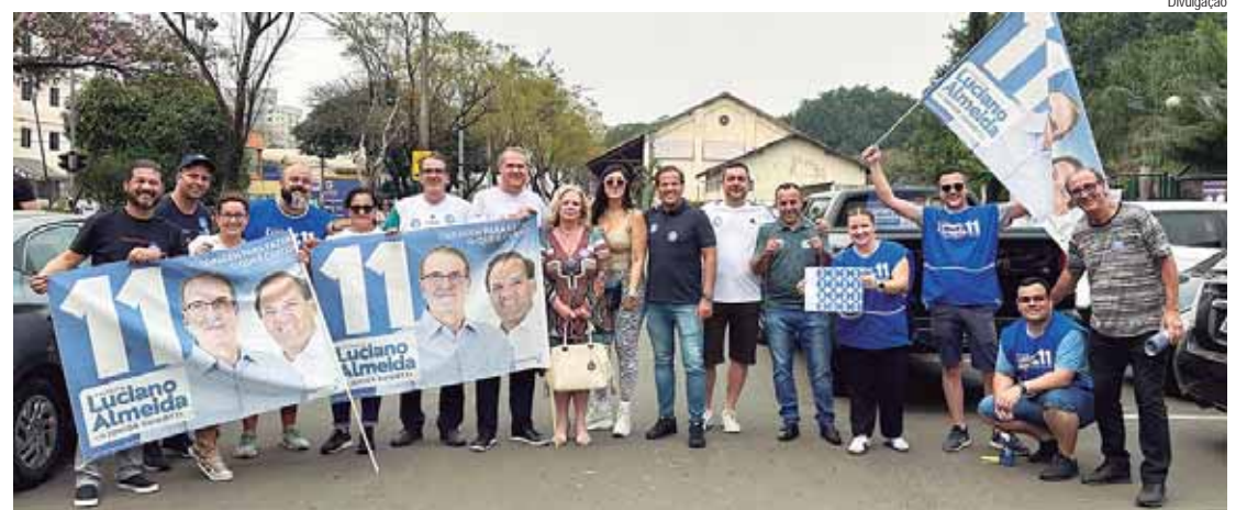
A concentração aconteceu no estacionamento da Estação da Paulista