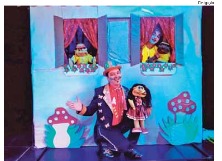
Betinho, o Menino Valente retrata a história de um menino que sofre bullying na escola

Betinho, o Menino Valente. Hoje (27), às 16h, no Teatro Municipal Erotides de Campos, o Teatro do Engenho. Avenida Maurice Alain, 454. Classificação livre. Entrada gratuita. Informações: 3403-2600.