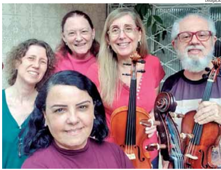
Evento ocorrerá no próximo sábado, 31, no Salão Nobre da Esalq