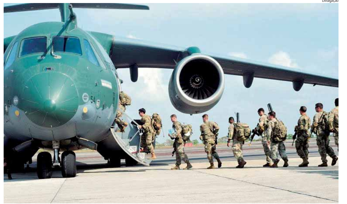
A operação ocorre desde quinta (22) e conta com cinco helicópteros e com a aeronave KC-390 Millennium

tução, o governo de São Paulo decretou situação de emergência em 45 cidades por causa dos incêndios florestais e anunciou o uso de aviões das Forças Armadas para conter as chamas, principalmente em Ribeirão Preto — onde o governo estadual montou um posto avançado de monitoramento.