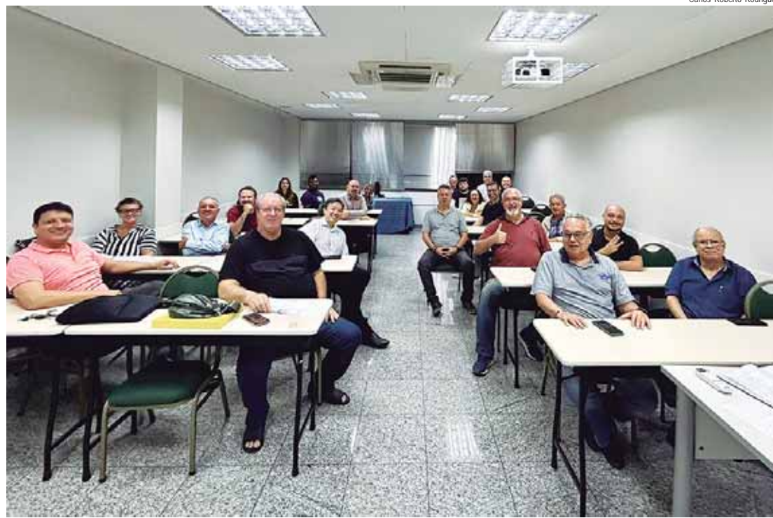
Conselho aponta para adiamento para o próximo ano das discussões

Assim são oferecidos melhores serviços com qualidade, atendendo às demandas da sociedade e ao mesmo tempo trans-