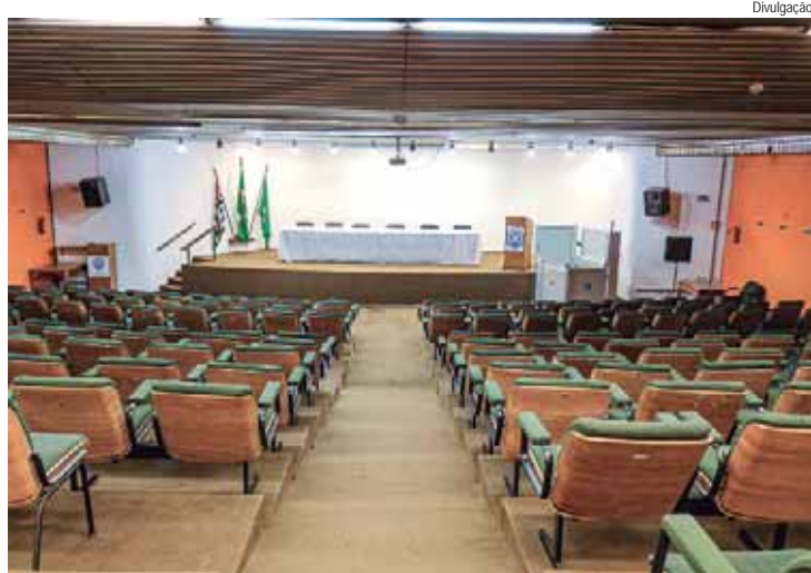
Reformas contemplam troca de piso, forro e poltronas, além de revestimento das paredes e troca da fiação elétrica

A Prefeitura de Piracicaba, por meio da Semad (Secretaria Municipal de Administração), abriu licitação para a execução de reforma no Anfiteatro Ary Telles de Oliveira, no Centro Cívico, prédio da Prefeitura, localizado na rua Antônio Corrêa Barbosa, 2.233.