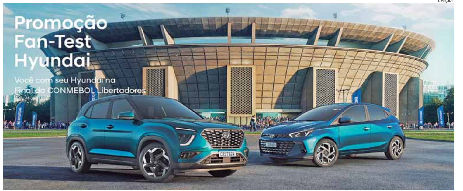
A promoção é válida para todos os test drives realizados até 30 de setembro