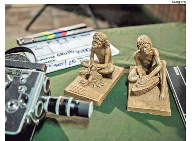
Festival Independente de Cinema dos Interiores Kino - Olho acontece de 13 a 17 de agosto em Rio Claro

O penúltimo dia de programação, 16 de agosto, também começa às 14h, com a Mostra não-competitiva Kino-Olho, uma seleção de cinco filmes produzidos por integrantes do coletivo organizador do Festival. Às 19h, tem o Noite Imersiva, projeto voltado a espetáculos de arte sonora, mú-