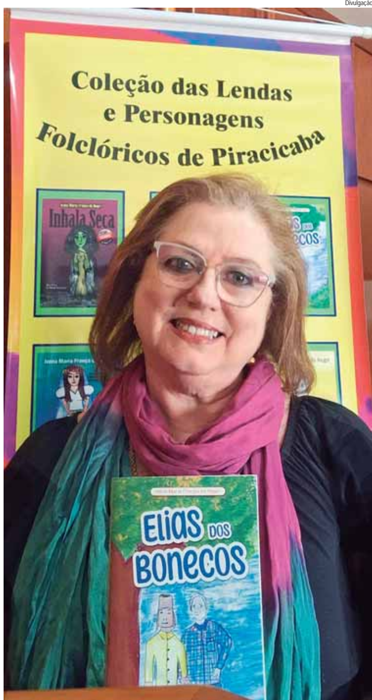
Novo livro faz parte da coleção "Lendas e Personagens Folclóricos de Piracicaba"