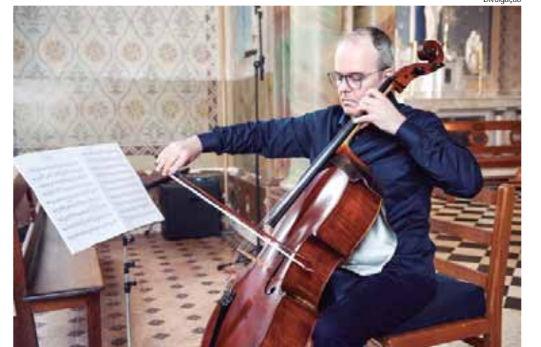
Apresentação é realizada pela Academia Jovens Músicos no dia 16 de agosto, às 20 horas, com entrada gratuita