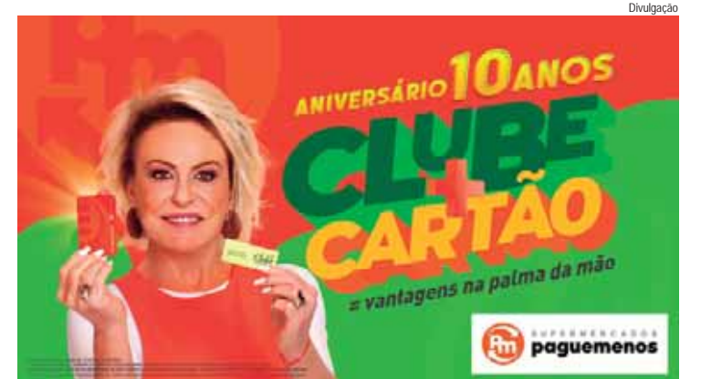
Campanha Promocional Clube+Cartão 10 anos que vai premiar cinco Clientes com um ano de compras grátis

Após a compra em uma das 36 lojas físicas, o participante deve se cadastrar no site www.superpaguemenos.com.br/clubecartao ou nos totens das lojas físicas do Supermercados Pague Menos, informar o CPF e preencher todos os dados solicitados. É necessário va-