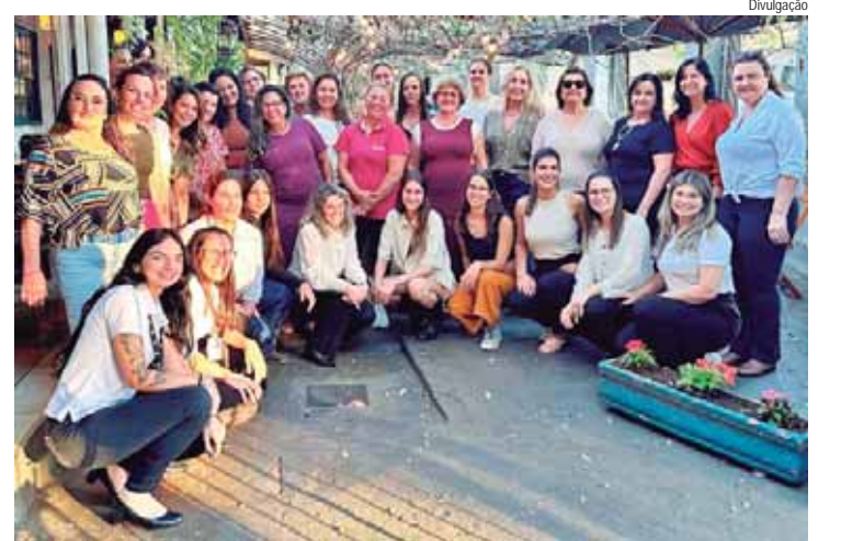
AFO&Elas reconhece e fortalece a contribuição das mulheres nas atividades agrícolas

As mulheres desempenham um papel essencial na sustentação e desenvolvimento da agricultura. O projeto Afo&Elas surge com o propósito de valorizar e dar visibilidade a essas mulheres que, com dedicação e competência, são verdadeiras parceiras dos produtores rurais.