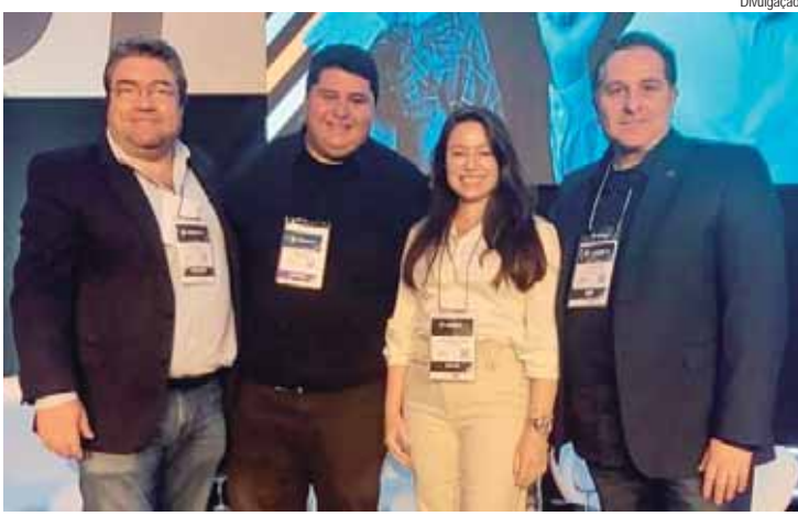
O Congresso Construindo Conhecimento aconteceu em São Paulo, entre os dias 6 e 9 de agosto