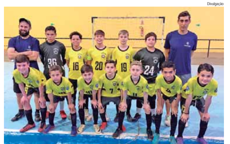
Equipe piracicabana venceu Americana por 2 a 1, em jogo disputado, no dia 8, no ginásio do Pretzotto