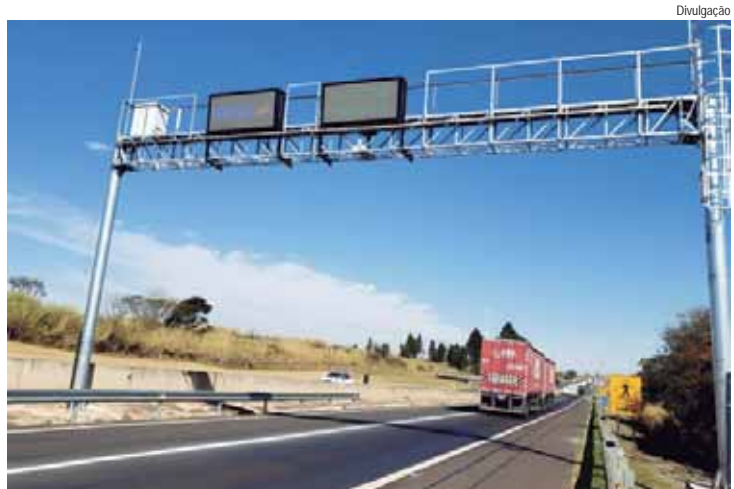
Trabalhos terão início a partir desta terça-feira e motoristas precisam ficar atentos às alterações no tráfego

A concessionária Eixo SP inicia nesta terça-feira (13) a implantação do segundo sistema de pesagem em movimento (WIM) de caminhões na SP 310 - Rodovia Washington Luís. Os equipamentos serão instalados no km 180+500, próximo à praça de pedágio de Rio Claro, na pista sentido Interior. Os serviços serão executados em duas etapas visando a menor interferência possível no tráfego do trecho.