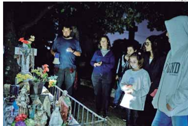
Roteiro Saudade e Suas Vozes conta histórias e lendas urbanas de Piracicaba no Cemitério da Saudade