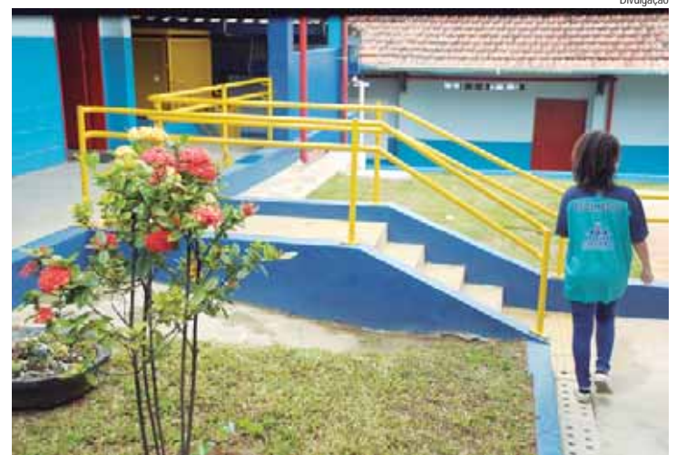
Cadastro pode ser feito nas escolas e em unidades do Poupatempo; alunos que já estão na rede estadual neste ano têm vaga garantida e não precisam fazer rematrícula

Caso o aluno queira mudar de escola, o período para solicitação de transferência, que geralmente acontece no mês de janeiro do ano seguinte, foi antecipado pela Secretaria e vai seguir o mesmo da matrícula (19 de agosto e 13 de setembro). Os interessados devem fazer o pedido também na página da SED — em "Intenção" pelo perfil do responsável ou aluno maior de 18 anos. O