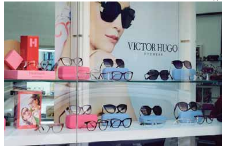
Os preços dos produtos estarão na mira dos agentes do Procon

É importante que o consumidor verifique se há política de troca no estabelecimento, pois o lojista não é obrigado a trocar produtos por erro do consumidor na escolha (como preferência, cor ou tamanho do produto). De qualquer forma, se no momento da venda houve a promessa da possibilidade da troca, esta deve ser cumprida.