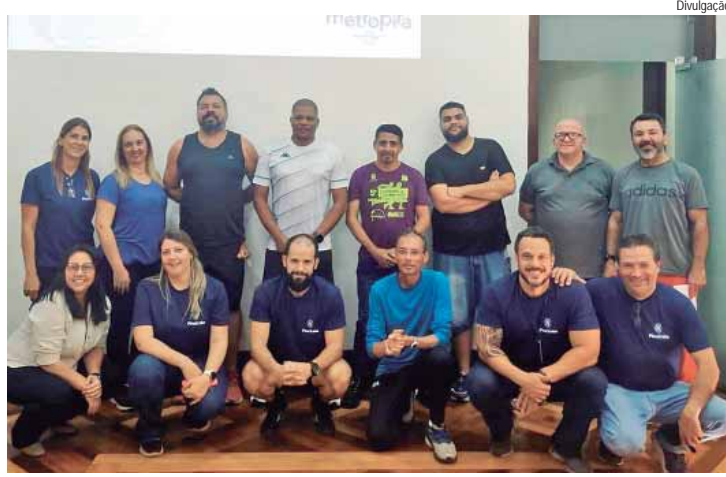
Evento aconteceu no dia 7, na sede da Secretaria de Esportes, no Engenho Central