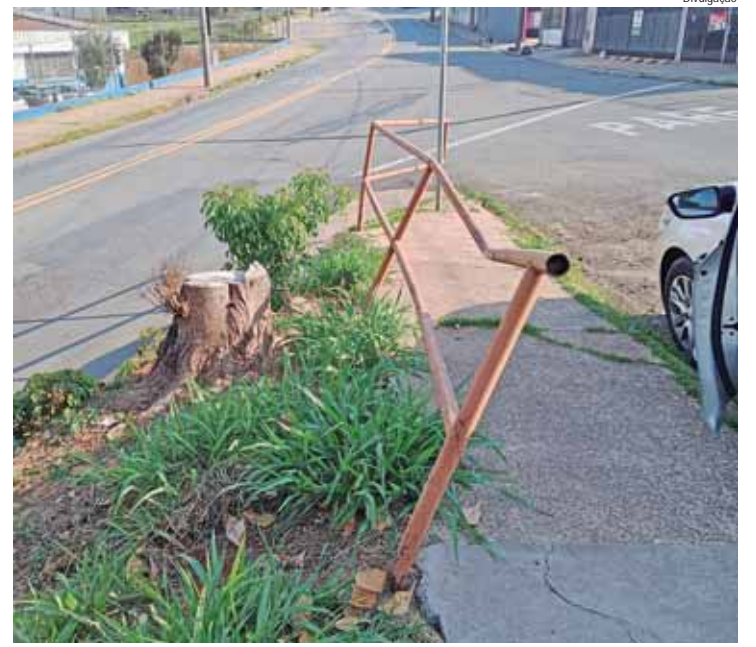
Vereador aponta que equipamento está em estado de deterioração

ção à população em situação de rua e demais pessoas interessadas, com enfoque nas questões de gênero, raça e classe, compreendendo as estratégias de atendimento, cuidado e atenção para a estruturação de projetos ampliados e singularizados. O próximo encontro formativo acontece no dia 11/10, com o tema Sexualidade das Pessoas com Deficiência.