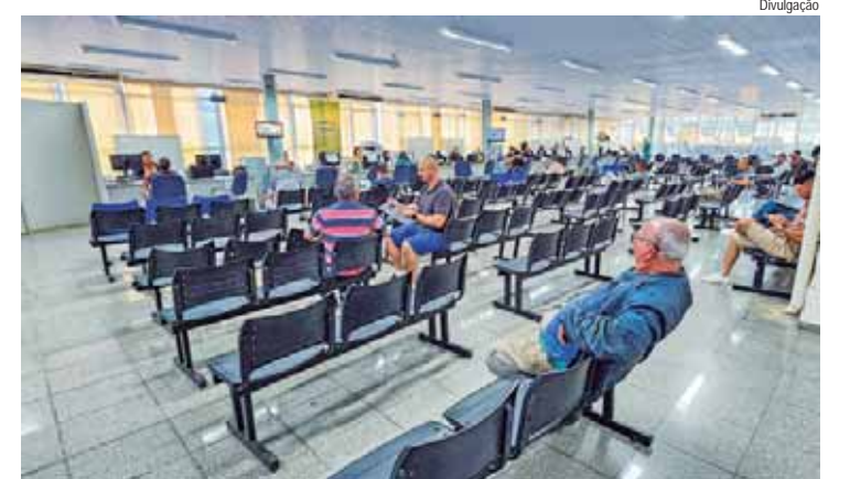
Atendimentos das Salas 24 e 25 do Postão saem do prédio atrás do Mercado Municipal e passam a acontecer no Térreo 2 (T2) da Prefeitura

A mudança acontece para melhorar o atendimento ao público, que agora terá ampla recepção e sala de espera, atendimento digital por senha (totens), além de estacionamento e transporte público em frente ao prédio da Prefeitura. O prédio atrás do Mercado Municipal (Postão) já não com-