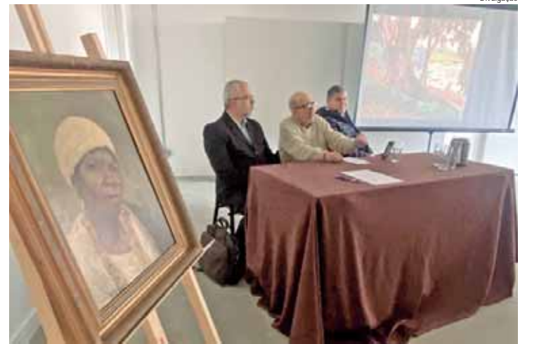
Obra foi doada à Nova Pinacoteca no último sábado