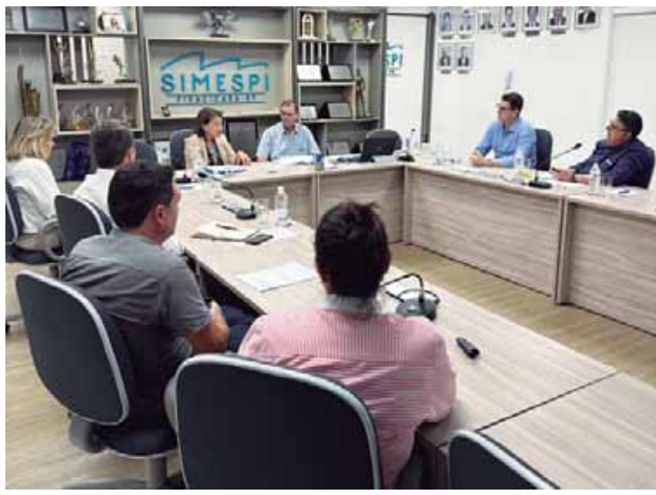
A deputada estadual Bebel durante visita ao Simespi, quando se reuniu com empresários da cidade