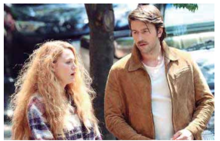
No drama romântico É Assim Que Acaba, uma mulher insegura quer superar traumas da infância e adolescência e começar uma nova vida