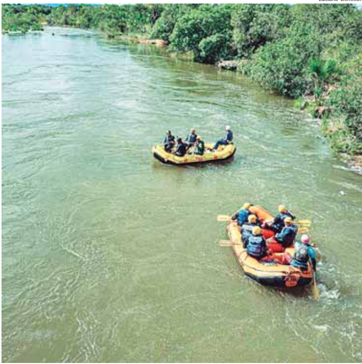
Equipe no rio Novo, um dos maiores rios de água potável do mundo