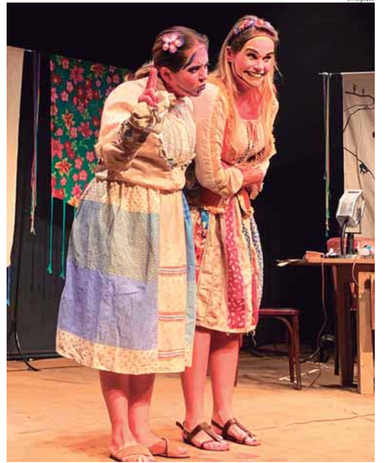
Cia. de Teatro Tragatralha apresenta o espetáculo Cordel do Mistério de Caiatú na Sala 2

Cordel do Mistério de Caiatú, da Cia. de Teatro Tragatralha. Data: sexta-feira e sábado, dias 9 e 10. Local: Sala 2 do Teatro Municipal Dr. Losso Netto. Rua Gomes Carneiro, 1212. Entrada gratuita. Informações: 3403-2600. Horário: às 20 horas