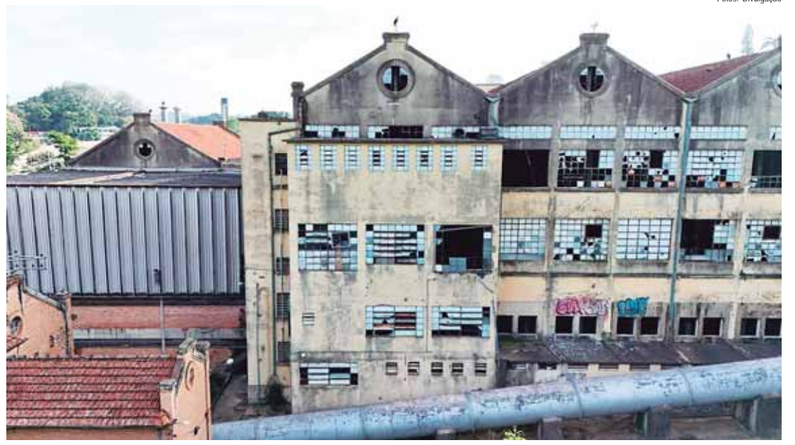
A fábrica da Boyes foi fundada por Luiz de Queiroz há mais de 150 anos