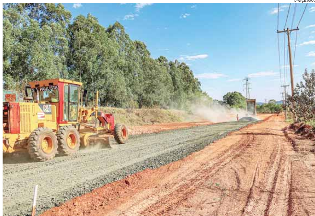
Via de grande circulação será beneficiada com 2,3 km de pavimentação de concreto

O pavimento de concreto possui maior durabilidade, diminui o custo com manutenção de veículos e a possibilidade de ocorrência de acidentes, agiliza o trânsito e diminui a poluição, não deforma quan-