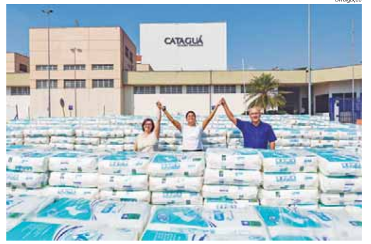
13ª Corrida Turística Fussp recebe mais de 153 mil unidades de fraldas da Cataguá Construtora