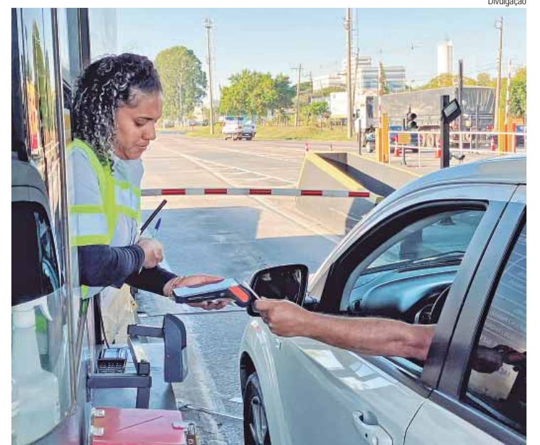
Mais de R$ 21 milhões das tarifas arrecadadas no primeiro semestre foram repassadas pela Via Colinas para as 17 cidades do trecho

Todos os serviços de pavimentação integram o pacote de revitalização da malha asfáltica, que vai beneficiar, ao todo, 258 km de vias do município com pavimento entre concreto e asfalto.