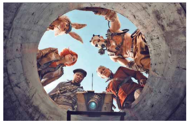
No filme Borderlands, uma equipe de desajustados é formada para encontrar a filha do homem mais poderoso do planeta Pandora

lescente Tiny Tina (Ariana Greenblatt), e seu protetor monstruoso Krieg (Florian Munteanu). Juntam-se a eles a excêntrica cientista Dra. Tannis (Jamie Lee Curtis) e o robô falante Clapton (Jack Black). Esta aliança de desajustados enfrenta uma série de desafios, desde ameaças alienígenas até perigosos bandidos, enquanto tentam desvendar um dos maiores segredos de Pandora. Filme com muita ação e um ótimo elenco. O público jovem vai adorar, principalmente os fãs do game.