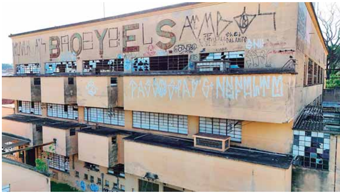
Antigo conjunto fabril corre risco de pegar fogo