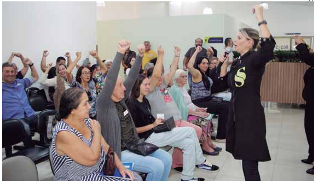
Pacientes do Cecan durante ginástica laboral, com movimentos feitos na cadeira