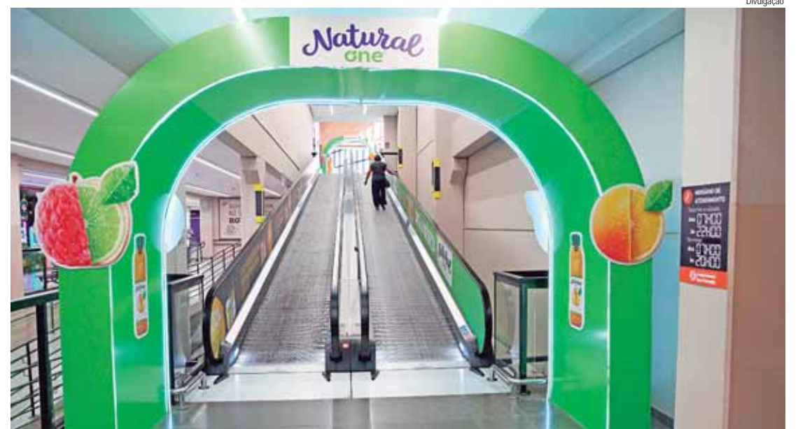
Clientes que visitarem a unidade Castelo, em Campinas, poderão conferir resultado do trabalho feito pela empresa Natural One