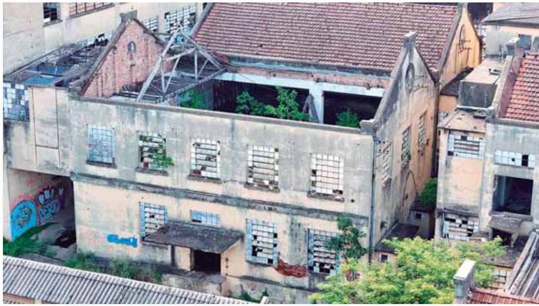
Movimento Salve a Boyes aponta flagrante degradação do patrimônio municipal