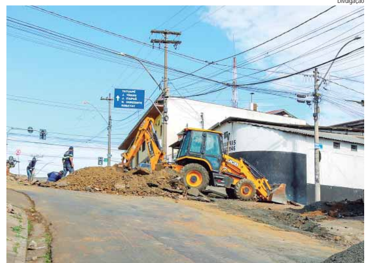
Serviços realizados consistem nas etapas de fresagem, tratamentos e recapeamento das vias

As empresas contratadas também são responsáveis por toda a sinalização e segurança da obra, devendo apresentar projeto de desvio de trânsito local, com prováveis rotas de desvio, e sinalização vertical a serem implantadas, além do projeto de implantação de sinalização horizontal para rotas de desvio, caso necessário.