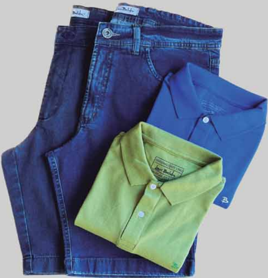
1 POLO + 1 BERMUDA JEANS