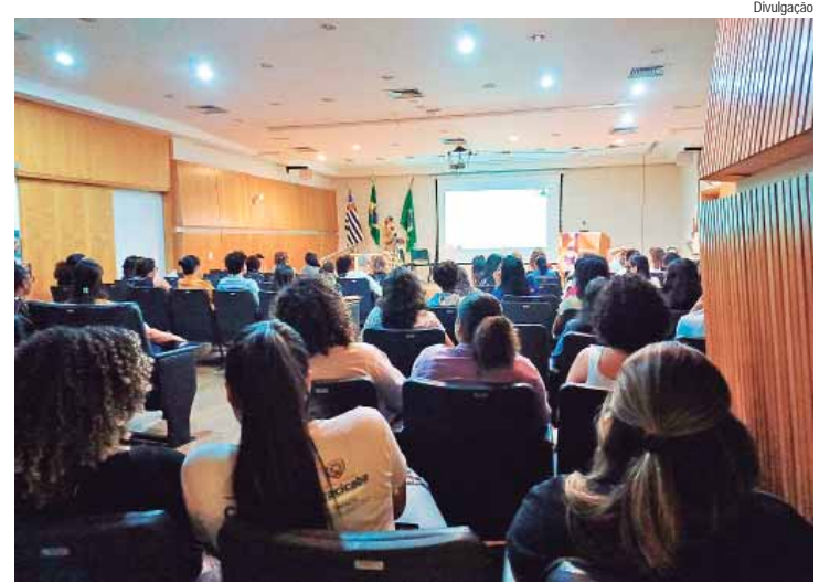
Público participante da capacitação sobre amamentação