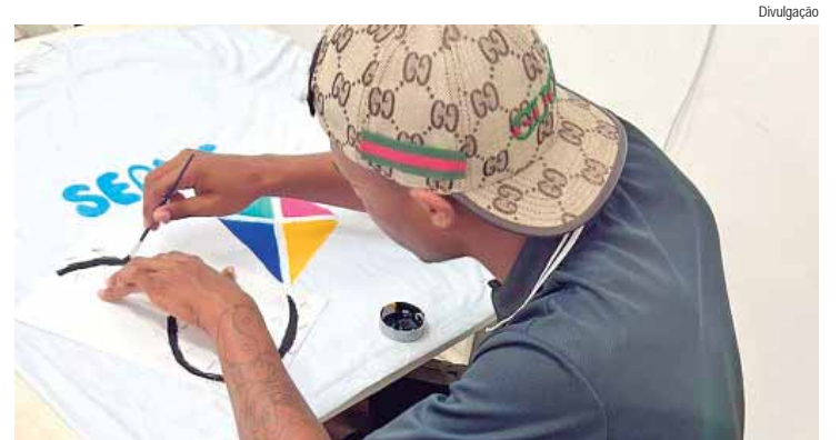
Adolescente em atividade no serviço de medida socioeducativa

Com o objetivo de ampliar o debate sobre medidas socioeducativas, na segunda-feira (12), acontece o II Seminário de Medida Socioeducativa, com abordagem na rede de proteção a adolescentes e jovens. O evento será realizado das 13h às 17h, no anfiteatro da Secretaria Municipal de Educação, localizada na rua Cristiano Cleopath, 1.902, Alemães. As inscrições estão abertas e podem ser feitas pelo link https://forms.gle/3fs8RY7xZDuesT9t7 .