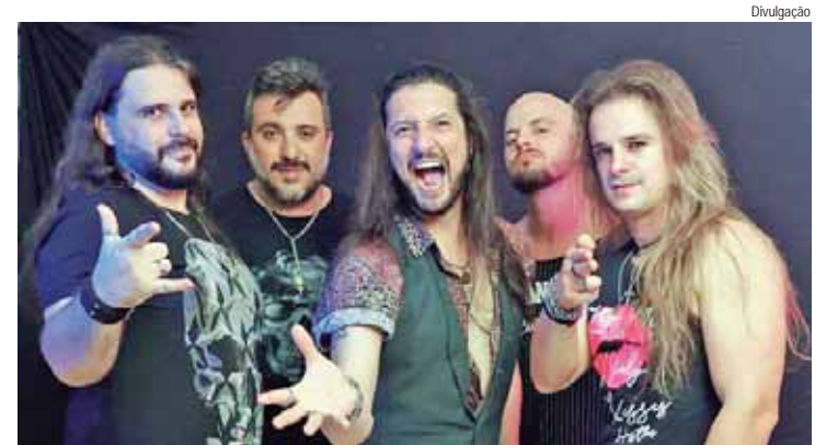
Festival de celebração ao rock terá 4 bandas e um DJ

Para os fãs de rock, o tradicional Sunset Rock do KOMtainer Beer agitará Piracicaba no próximo sábado (10). A festa, que terá início a partir das 13h e acontecerá no Terraço Vianna, onde está a mais bela vista da cidade.