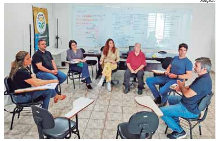
A reunião aconteceu na manhã de ontem (7) na sede da Sema

volve em diversas etapas. A primeira é a identificação do local. Depois, há o mapeamento das moradias, com o emplacamento das residências selecionadas. Em seguida, ocorre a qualificação da composição familiar. A partir disso, é realizada a vistoria, para o levantamento das melhorias das casas a serem beneficiadas. Na sequência, há o preenchimento da planilha de cálculos, constando o valor da reforma por casa para posteriormente ser encaminhado à construtora executora das obras, e a assinatura do Termo de Adesão, por parte do morador, para autorização para início das obras. Após a conclusão dos serviços, há a entrega do Termo de Aceite ao morador, finalizando o vínculo com o Programa.