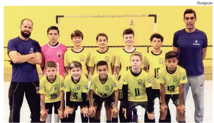
Elenco joga diante de sua torcida, às 20h30, no ginásio do Prezotto

A equipe sub-12 de futsal do PDB/Selam estreia hoje (8), em partida válida pela fase de classificação da 41ª Copa Campinas de Futsal. O confronto da estreia tem início às 20h30, diante do Instituto Jr. Dias de Americana; agendado para o ginásio do Complexo Esportivo Professor José Carlos Callado Hebling, no Parque Prezotto.