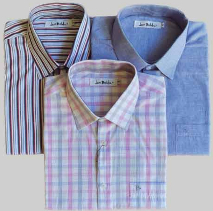
CAMISA MANGA CURTA EASY COTTON