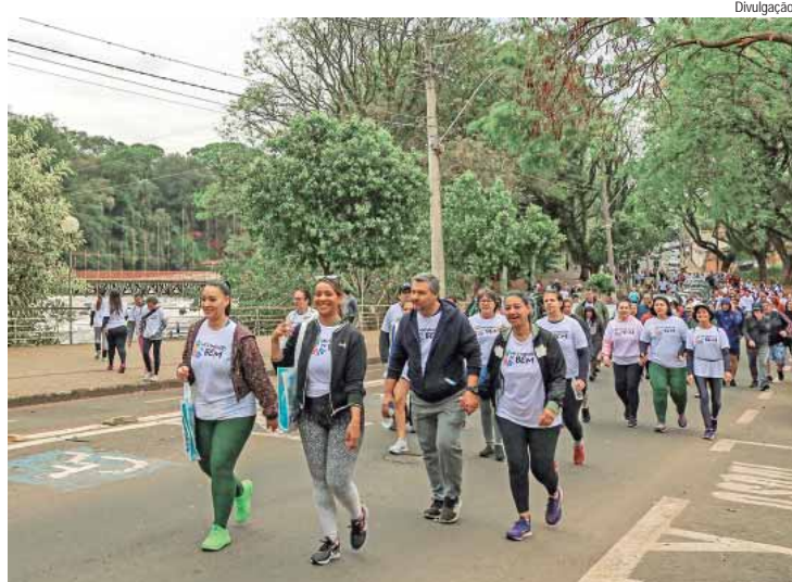
Com percurso de 5 km, a caminhada terá largada no pequeno pátio do Engenho Central

A Prefeitura de Piracicaba, por meio do Fundo Social de Solidariedade (Fussp), a Acipi (Associação Comercial e Industrial de Piracicaba), e o Simespi (Sindicato Patronal das Indústrias do Setor Metalmeccânico de Piracicaba, Saltilho e Rio das Pedras) promovem, no próximo domingo (11), a 2ª edição da caminhada Movimento do Bem. As inscrições são gratuitas mediante a doação de 2 kg de alimentos não perecíveis, que serão destinados a pessoas em situação de vulnerabilidade social, cadastradas no Cadastro Único para Programas Sociais (CadÚnico).