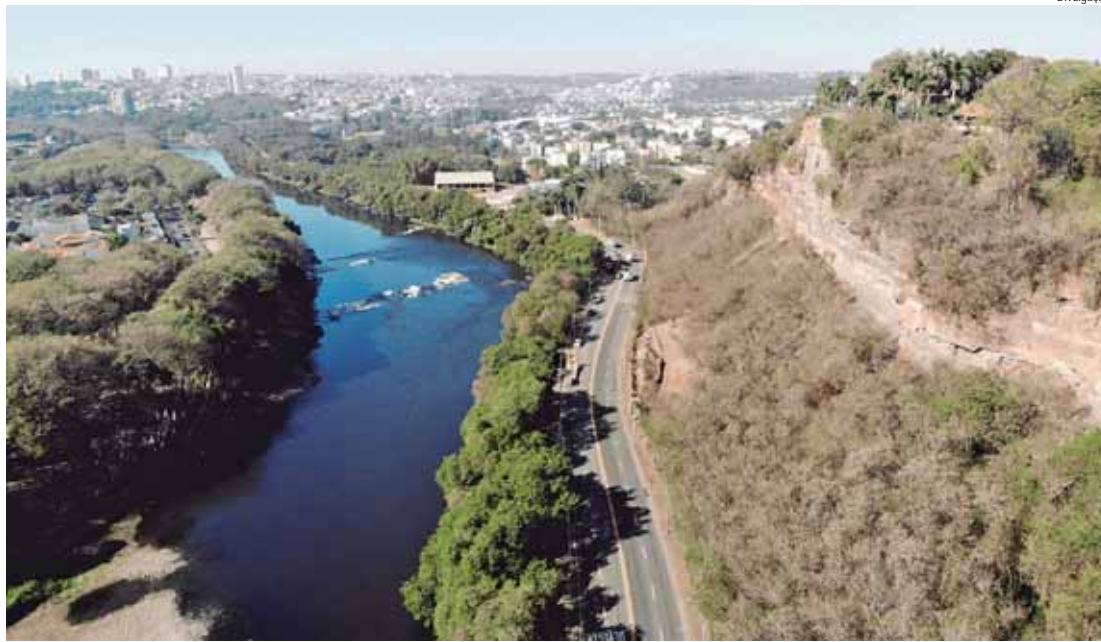
A avenida Jaime Pereira, conhecida como Estrada do Bongue, foi liberada totalmente para o tráfego de veículos perto das 12h de ontem (7)