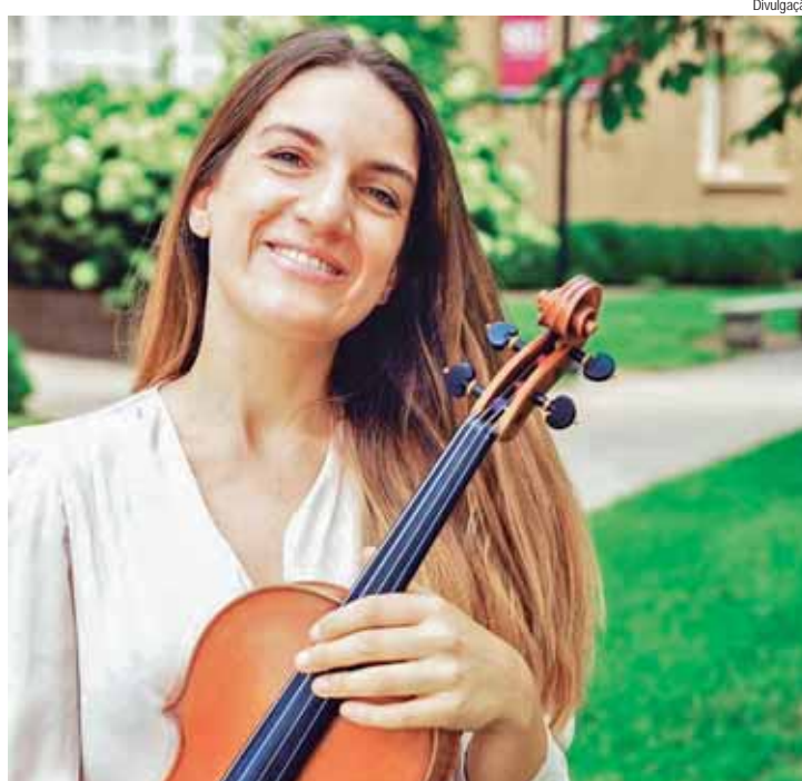
Serão realizadas seis aulas gratuitas durante o mês de agosto