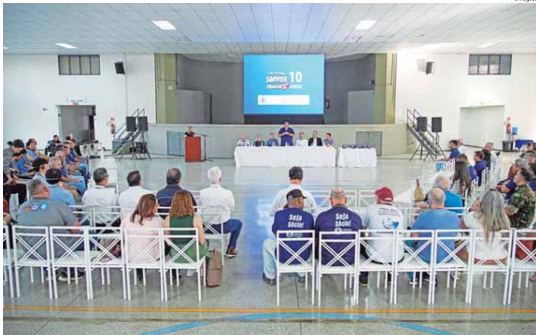
Sorriso Cidadão é uma iniciativa do Sindicato dos Trabalhadores Metalúrgicos