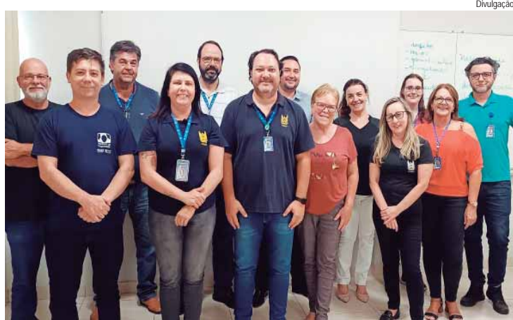
A 2ª turma de funcionários concluiu o treinamento na última terça