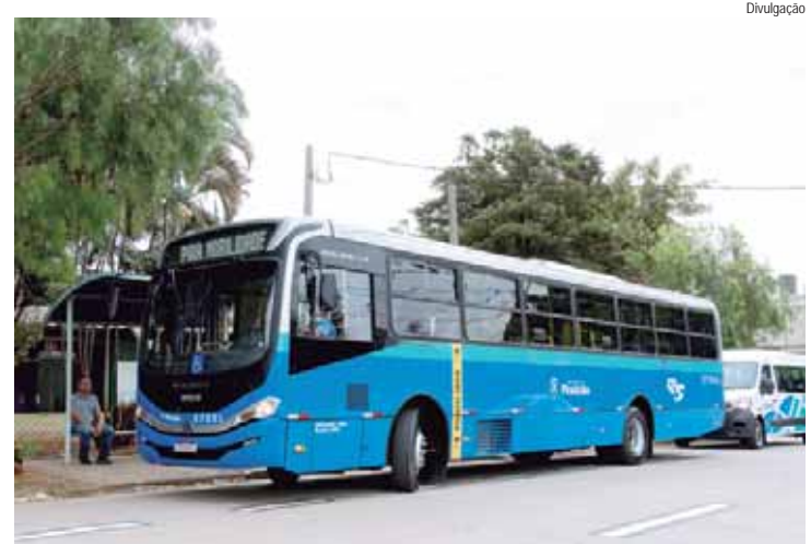
Transição gradativa dos veículos da Rápido Sumaré completa um mês

A empresa será responsável, ainda, pela construção da garagem e da manutenção dos terminais. A empresa vai operar tanto as linhas urbanas e rurais quanto o Transporte Especial Elevar, que será ampliado, serviço esse destinado a pessoas que usam