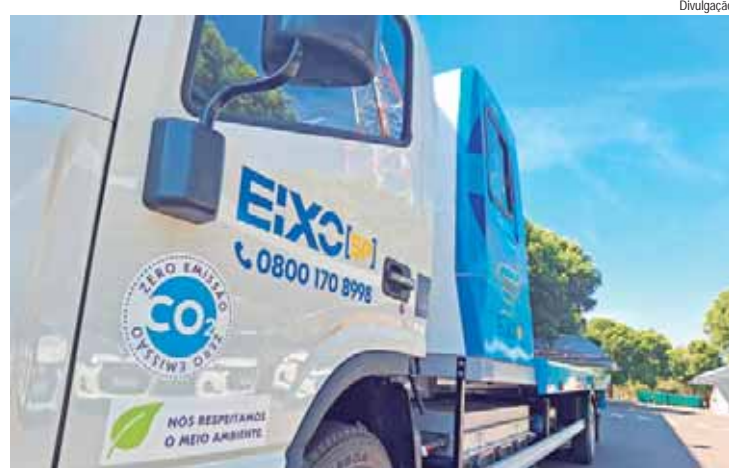
Premiação é reconhecimento das diversas iniciativas que a concessionária tem adotado para neutralizar a emissão de gases do efeito estufa