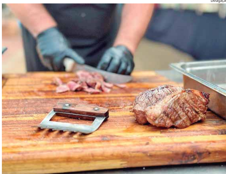
O parque preparou uma combinação de diversão, tempero e boa música, com três opções de churrasco, além de combo promocional de ingressos

Para deixar o clima ainda melhor, a seleção de churrascos preparados com maestria terá outro acompanhamento: a boa música sertaneja, com a participação de bandas regionais animando o público. E a curtidão no parque continuará nas mais de