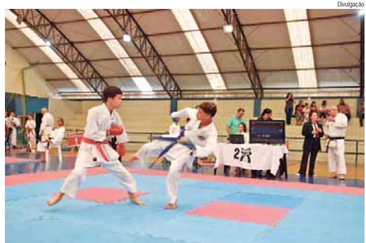
A competição reforçou os valores da Academia Washi Kan, que há duas décadas contribui para o desenvolvimento esportivo em Rio das Pedras

A Academia Washi Kan de Karate, com mais de 20 anos de tradição em Rio das Pedras, realizou no domingo, dia 5 de agosto, seu campeonato interno anual. O evento atraiu centenas de atletas de diversas idades, que competiram entre si em várias categorias.