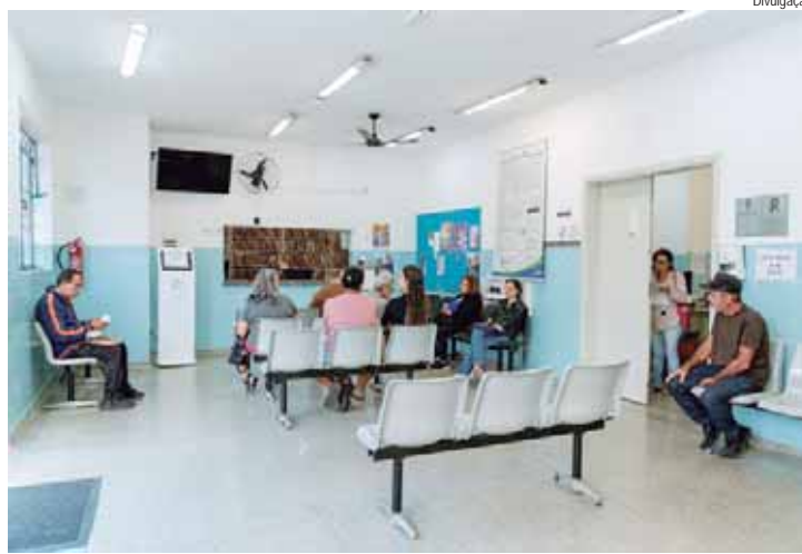
Saúde espera abrir mais de 8000 novas vagas para atendimento espontâneo na Atenção Básica

TELEMEDICINA – Cabe reforçar que a SMS também oferece o serviço de Telemedicina, no contraturno das unidades de Atenção Básica, com o conceito de ofertar mais comodidade e segurança aos pacientes, que podem cuidar da saúde sem precisar sair de casa. A consulta pode ser realizada pelo site portal.piracicaba.sissonline.com.br – recomenda-se a utilização do navegador Google Chrome – ou pelo aplicativo do cartão Pira Cidadão de segunda a quinta-feira das 17h às 8h, sexta-feira das 17h às 7h, e sábado, domingo e feriados 24h/dia. Os serviços de atendimento médico são via internet, por videoconferência e orientação médica realizada por clínico geral e pediatra para baixa complexidade. O sistema disponibiliza de forma on-line