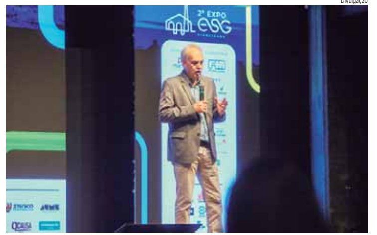
O evento já tem a sua terceira edição garantida e será realizada no ano que vem

Os ingressos estão disponíveis no site www.thermas.com.br ou na Central de Vendas via WhatsApp (19) 3112-3389. Os valores não in-