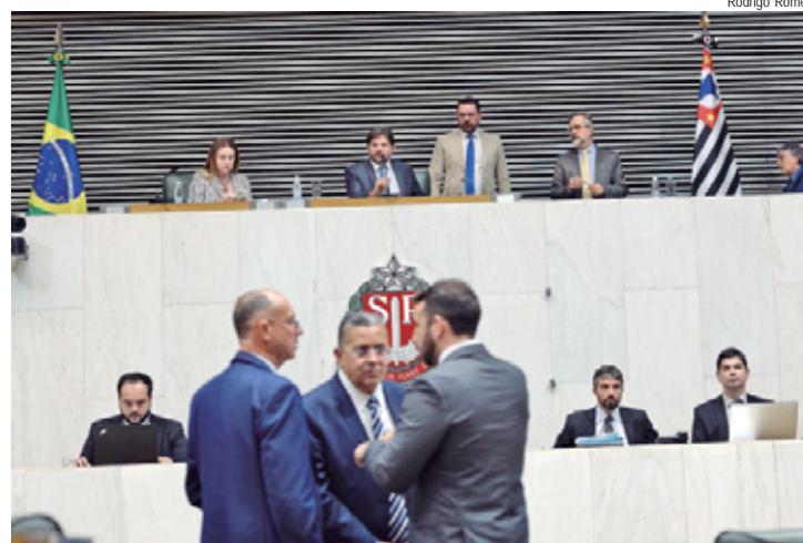
Novas Leis foram incluídas na edição desta terça (6) do Diário Oficial

Segundo o parlamentar, a nova norma vem para corrigir