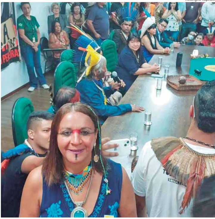
Coletivo Mulherio das Letras Indígenas