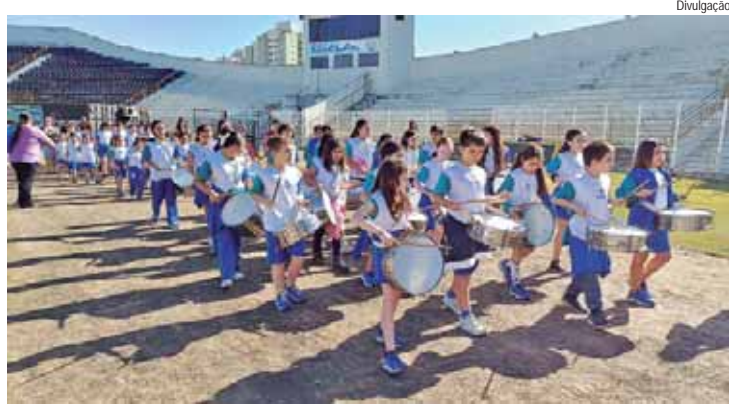
A fanfarra da Escola Municipal Joaquim Carlos Alexandrino de Souza participou do ensaio técnico