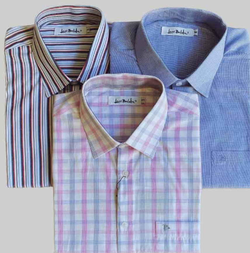
CAMISA MANGA CURTA ALGODÃO MISTO