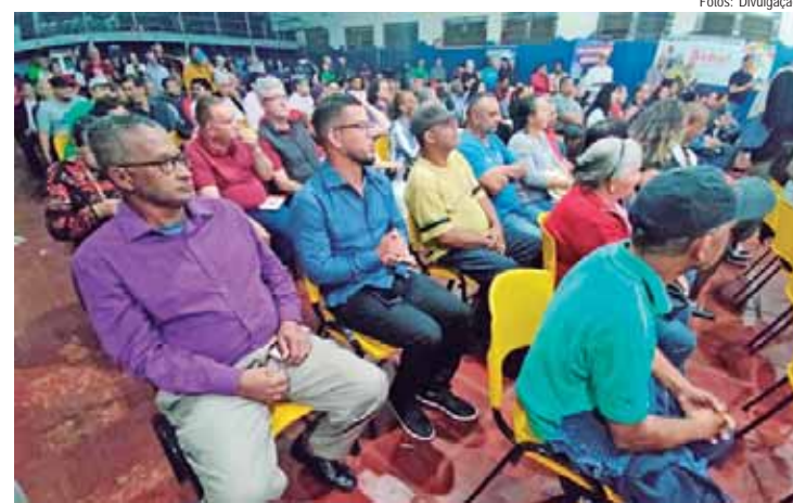
A convenção da Federação Brasil da Esperança foi no Centro Comunitário do Jardim Esplanada, reunindo lideranças partidárias de diversas associações de bairros