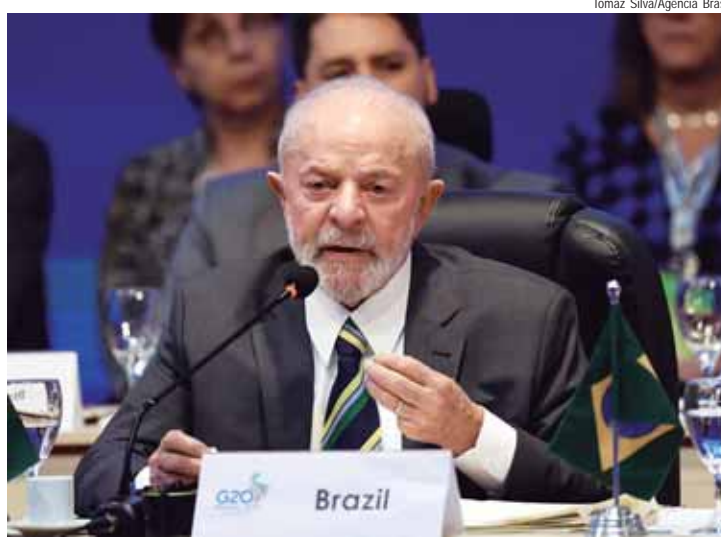
O presidente do Brasil, Luiz Inácio Lula da Silva durante a Reunião da Força-Tarefa para a Aliança Global contra a Fome e a Pobreza, na Sede da Ação da Cidadania, na zona portuária do Rio de Janeiro

Lula lembrou ainda que a presidência do Brasil no G20 defende a reforma das instituições de governança global, inclusive as financeiras. "A representação