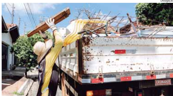
Ação acontecerá das 8h às 14h e passará pelos bairros Piracicamirim, Parque Prezotto, Maracanã, Vila Prudente, Jardim Bandeirantes, Jardim Pombeva e São Simão

As equipes do Plano Municipal de Combate ao Aedes (PMCA) – vinculado ao Centro de Controle de Zoonoses (CCZ), da Secretaria Municipal de Saúde – vão realizar mais um Arrastão da Dengue no próximo sábado, dia 27, das 8h às 14h. A ação vai passar nos bairros Piracicamirim, Parque Prezotto, Maracanã, Vila Prudente, Jardim Bandeirantes, Jardim Pombeva e São Simão, com ponto de encontro no Ginásio de Esportes do Parque Prezotto.