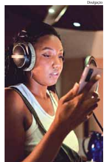
Desbravando Talentos na Perifa formou 18 artistas da periferia de Piracicaba e região

"O hip hop é fundamental na minha vida, especialmente por ser uma mulher que vem de uma família majoritariamente preta e periférica. Ele me dá voz para expressar minhas experiências e lutar por justiça social dentro e fora da minha bolha. Além de fortale-