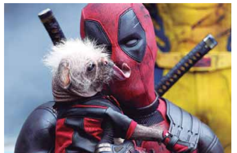
A cadela Peggy e Ryan Reynolds em Deadpool & Wolverine. Peggy, que estreia como Dogpool, ganhou popularidade na Grã-Bretanha por sua feiura

ENCONTRO COM OS FÃS - Durante o Fan Event de "Deadpool & Wolverine" realizado no último dia 15 no Rio de Janeiro como parte da turnê global da campanha da Marvel Studios de divulgação do filme, atores principais e diretor tiveram encontro com os fãs. Durante o evento, apresentado