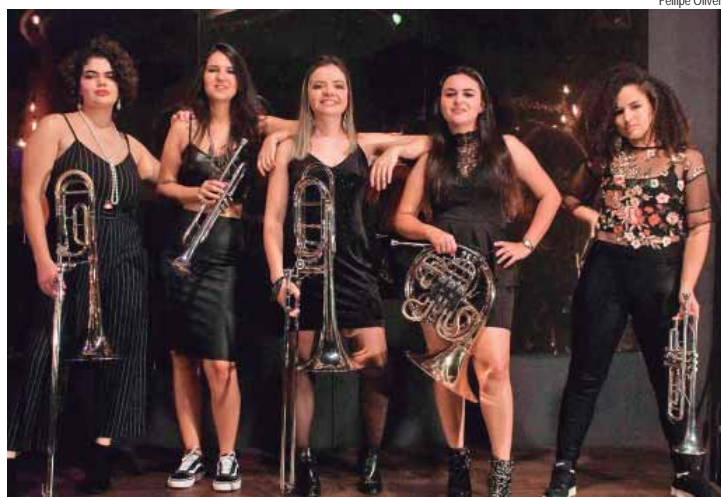
Quinteto Olympéa se apresenta hoje, às 20h, na cafeteria do local

Ainda no dia 27, sábado, 14h30 às 16h, no Espaço de Tecnologias e Artes, tem o curso O Futuro dos conteúdos digitais, com inscrições no site. Com vendas de convites, o espetáculo Dr Friky - O Naufrago acontece às 16h, no Teatro. Dia 28, domingo, das 10h às 13h, na praça tem a vivência Bora Brincar. No mesmo dia, às 14h, na Sala do Curumim, Mosaico - Crie figuras e objetos com retalhos de E.V.A.. Às 15h30, na praça, show com Renata Jambeiro. Com retirada de ingressos com 1h de antecedência, ainda no domingo, às 17h, será exibido Scarborough.