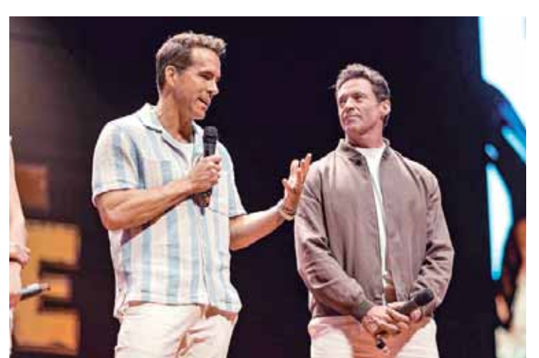
Os atores Ryan Reynolds e Hugh Jackman, de Deadpool & Wolverine, em encontro com fãs no Rio de Janeiro para promover o filme