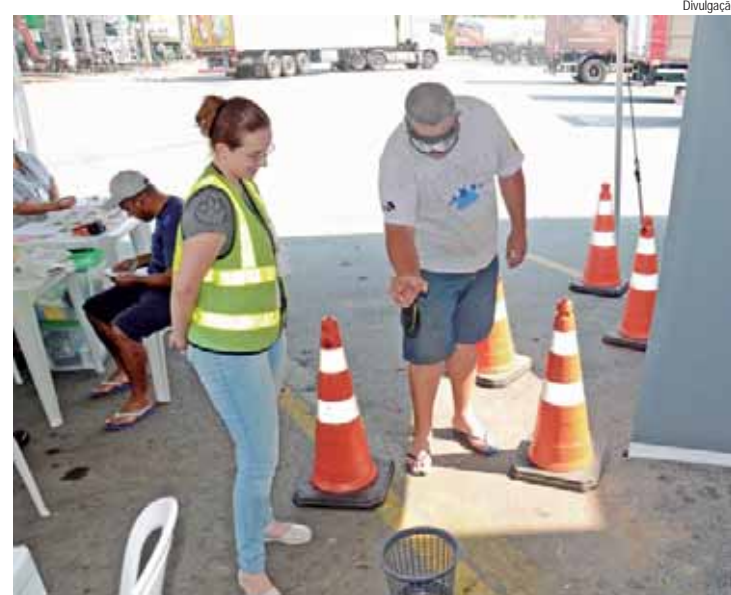
As ações são focadas na saúde e na segurança dos motoristas