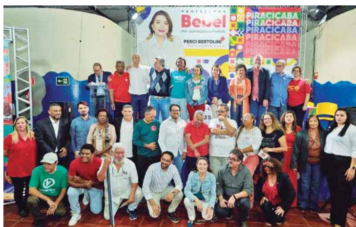
Na convenção, foram aprovados os nomes dos candidatos majoritários e da chapa de candidatos a vereador da Federação Brasil da Esperança