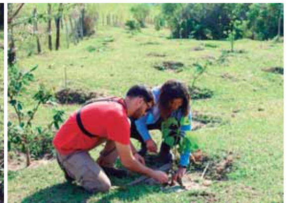
Plantio de mudas nativas foi realizado em 2022, em 21 hectares na zona rural, por meio do Programa Municipal PSA e recursos da Agência das Bacias PCJ