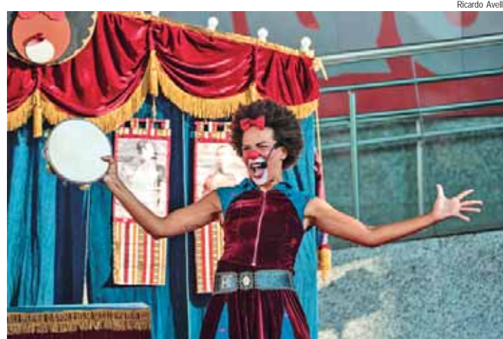
Teatro Prefeito Virgínio Ometto recebe a apresentação neste sábado, dia 27, às 16h

O Diversão em Cena, relevante projeto do país de formação de plateia de teatro infantil, apresenta em Iracemápolis neste sábado, dia 27, o espetáculo infantil Quizumba, da Indômita Cia. O repertório inclui cenas de palhaçaria, músicas, magia, mistério e eventos sobrenaturais, para dizer às crianças que as histórias não acabam, que nada se encerra, que a vida é circular e a importância de honrar os mais velhos.