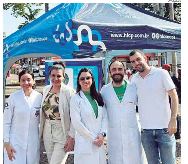
Equipe fez atendimento no Terminal Central de Piracicaba

UMA DOENÇA ÀS VEZES ASSINTOMÁTICA - Os tumores de cabeça e pescoço podem ser assintomáticos no princípio da doença. O diagnóstico das lesões iniciais é fundamental para garantir que os índices de cura se aproximem de 100%. Com o seu desenvolvimento, alguns sinais e sintomas podem aparecer, como manchas brancas na boca, dor local, lesões com sangramento ou cica-