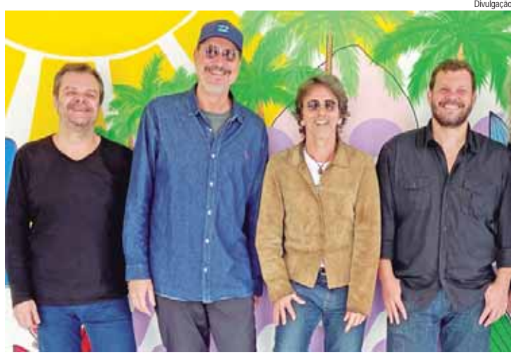
Show da banda carioca, na ativa desde a década de 1980, será no sábado (27)