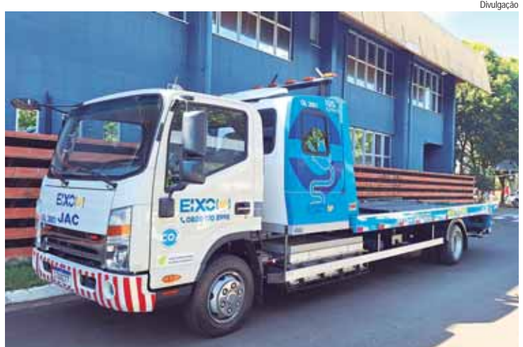
Oito novos veículos movidos a energia limpa entrarão em operação nos próximos dias

A Eixo SP Concessionária de Rodovias dá mais um passo no processo de descarbonização das suas atividades. Nesta quarta-feira (24), foi entregue mais um guincho elétrico. Até o fim do próximo mês, mais sete veículos serão incorporados à frota da concessionária. Com a chegada dos novos guinchos leves elétricos, quatro dos veículos mais antigos movidos a combustíveis fósseis serão retirados da frota. Com isso, a Eixo SP dá sequência à sua proposta de redução gradativa da emissão de poluentes nos serviços operacionais.