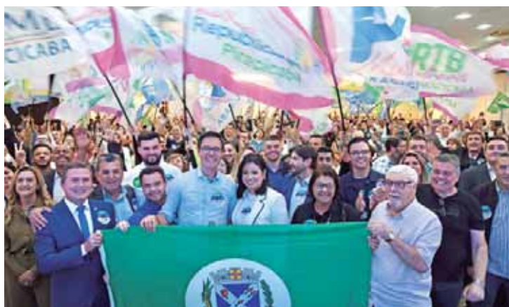
Convenções foram realizadas no Espaço Beira Rio