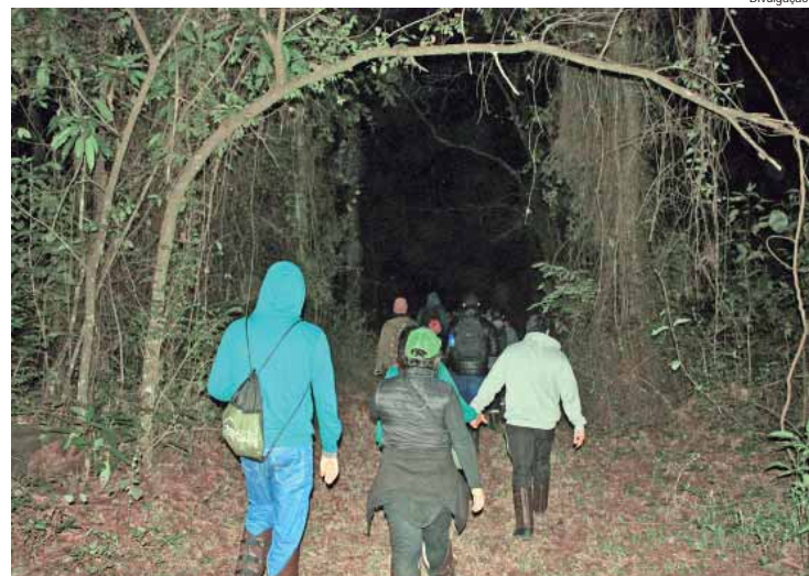
Após o filme, participantes fizeram trilha noturna de cerca de 3 km

O Horto de Tupi recebeu na última sexta-feira (19) a quarta edição da atividade Cinema e Trilha Noturna, que proporcionou a apresentação do filme Amazônia: Sociedade Anônima e contou com a presença de 60 participantes. A ação integra a agenda do programa Vem Pro Horto e foi realizada pela Prefeitura de Piracicaba, por meio das secretarias de Infraestrutura e Meio Ambiente (Simap) e da Ação Cultural (Semac), Insti-