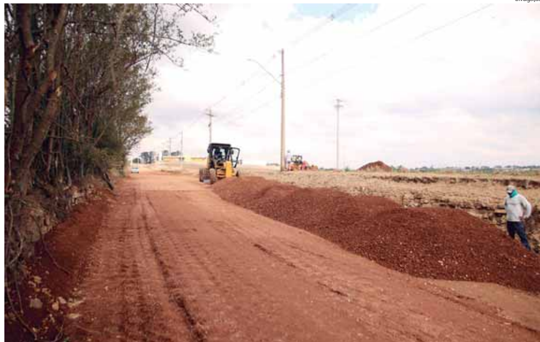
A "estrada do Borsato" tem início na continuidade da Rua Cristina Taranto Pariz e segue até a rodovia que dá acesso ao Ceasa e à Rodovia do Açúcar

A melhoria da estrada possibilitará a redução do movimento de caminhões pelo centro de Rio das Pedras, oferecendo uma via alternativa e mais curta de acesso a vários pontos