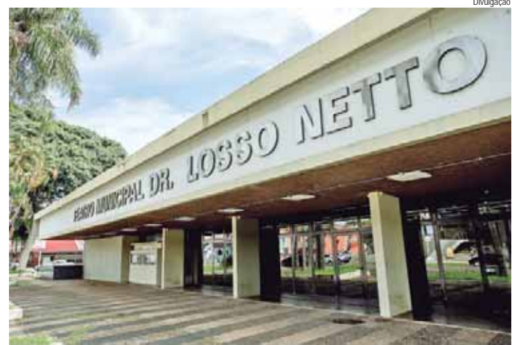
Obras de reforma serão na parte externa e interna do Teatro Municipal Dr. Losso