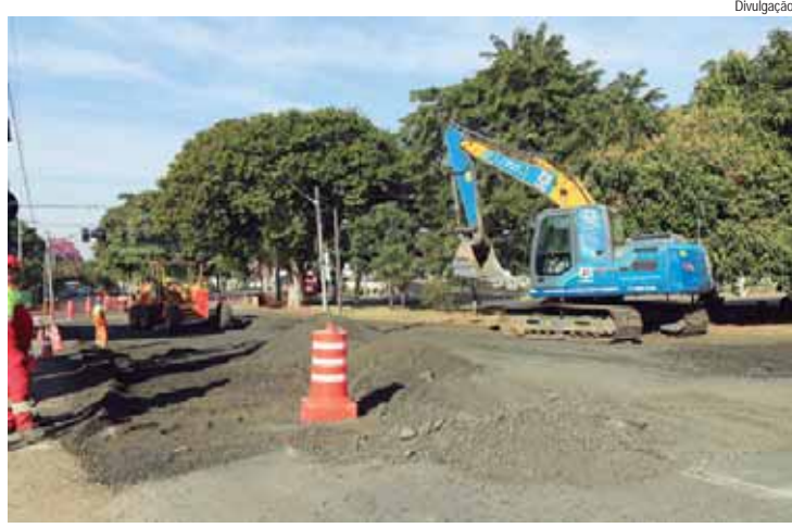
As equipes estão realizando a preparação do solo, com terraplenagem