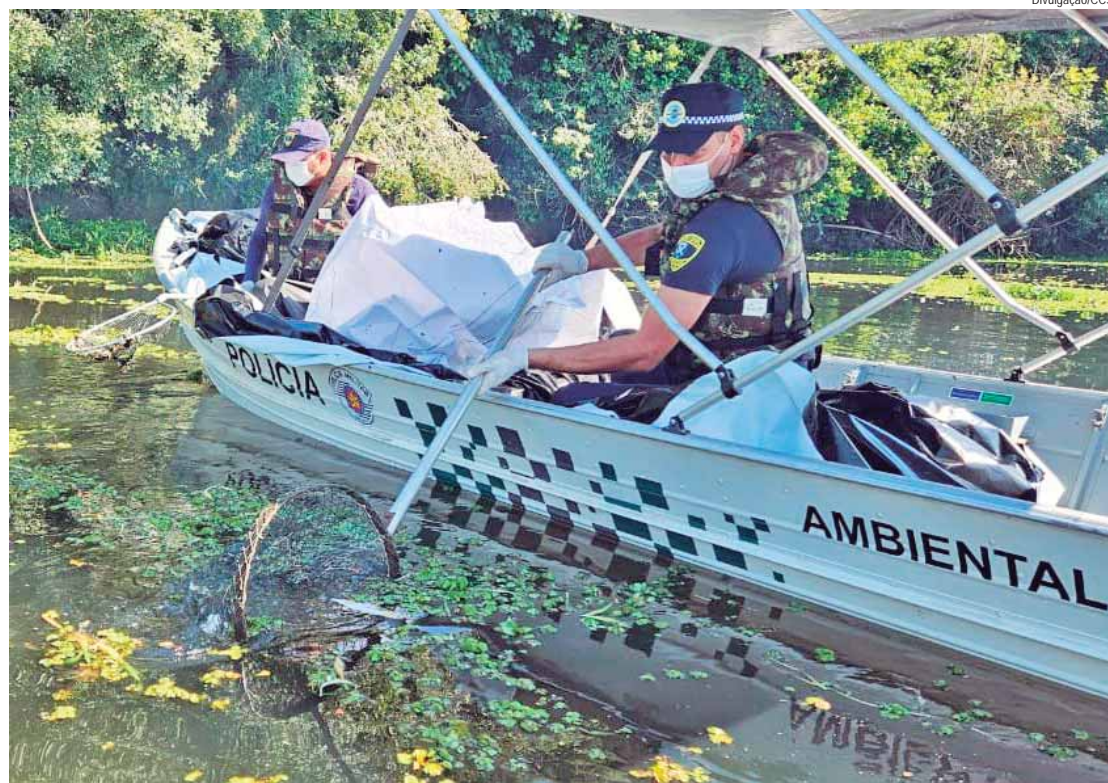
Guardas-civís de Piracicaba auxiliaram na operação de retirada dos peixes do Tanquã

A etapa emergencial da operação Pindi-Pirá, criada pela Prefeitura de Piracicaba para retirada dos peixes mortos do rio Piracicaba, no bairro Tanquã, chegou ao sétimo dia e foi concluída. Na tarde de ontem (23), o maquinário foi retirado e as equipes realizaram mutirão com coleta apenas manual, utilizando barcos e passaguás. Ao todo, operação recolheu mais de 100 toneladas de material do rio. Participaram do mutirão a Prefeitura, por meio da Defesa Civil e Secretaria de Governo, Guarda Civil Metropolitana de Piracicaba, Polícia Militar Ambiental e a empresa contratada pela usina responsável pelo descarte irregular que afetou o rio. Após uma semana de ações, já é possível observar o retorno das aves, como as garças, nas margens e pela vegetação. A operação Pindi-Pirá é idealizada pela Prefeitura de Piracicaba e tem colaboração da Cetesb (Companhia Ambiental do Estado de São Paulo) e da Fundação Florestal (FF) e coordenação da Polícia Militar Ambiental e Defesa Civil do Estado de São Paulo. Conta ainda com apoio do Porto de