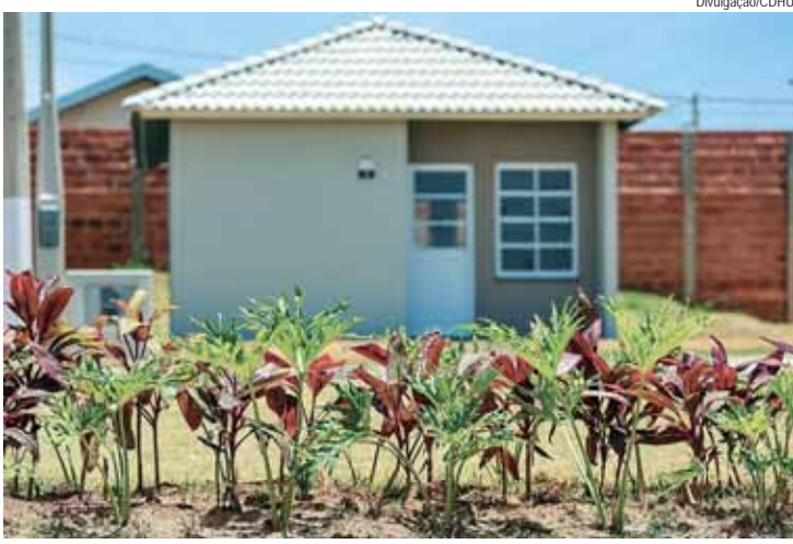
Subsídios variam de R$ 10 mil e R$ 16 mil; imóveis estão localizados em 121 cidades