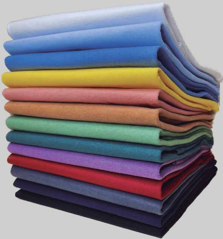
CAMISETA MASCULINA 100% ALGODÃO