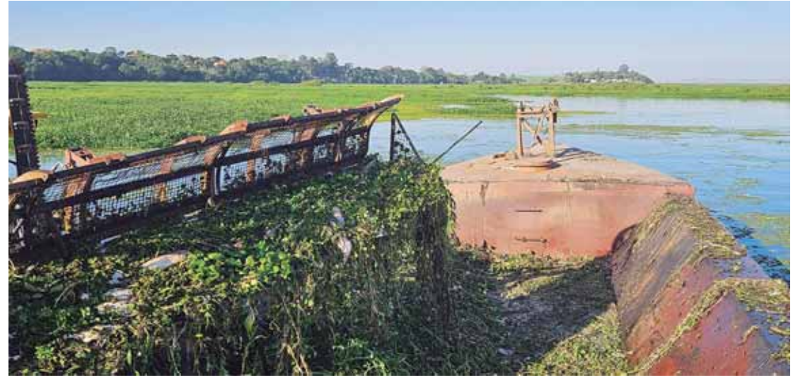
Equipes atuaram durante todo o fim de semana, com retirada manual e com auxílio de tratores aquáticos; já foram recolhidas 98,13 toneladas de material do rio Piracicaba

ração conta ainda com o apoio das empresas Hidrotractor, Ambiental, Ecoterra, Raizen, Tectextil, Grupo São Martinho - Usina Iracema.