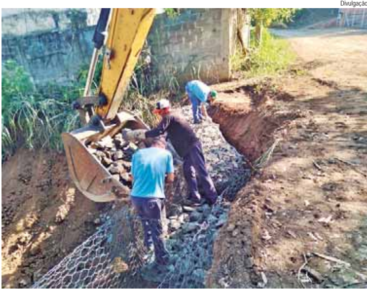
Equipe realizou serviço em quatro dias, sem prejudicar a passagem dos motoristas

A Prefeitura de Piracicaba, por meio da Sema (Secretaria de Agricultura e Abastecimento), realizou manutenções de estradas e ponte em cinco bairros rurais na última semana, de 15 a 19/07.