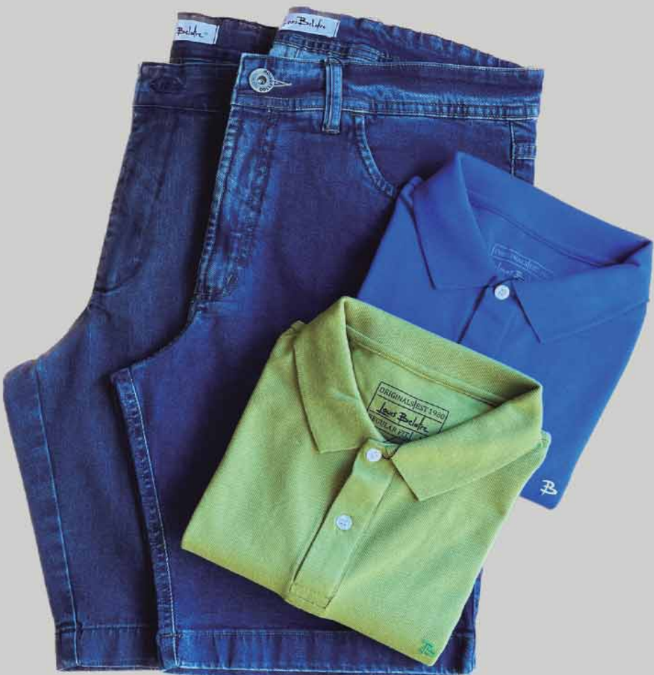
1 POLO + 1 BERMUDA JEANS