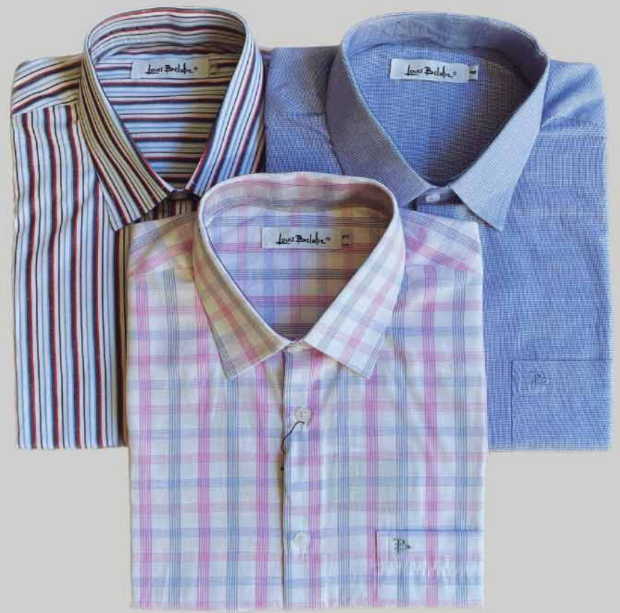
CAMISA MANGA CURTA ALGODÃO MISTO