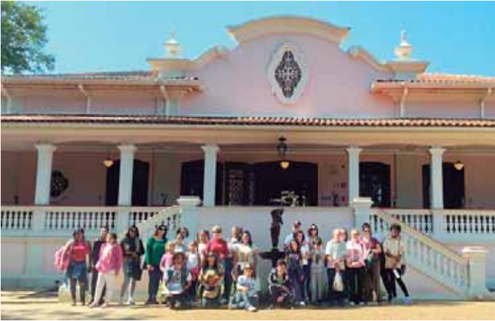
Roteiro pelo palacete do bairro histórico Monte Alegre

O marco dos 10 anos impulsionou um movimento para avaliar e dimensionar os impactos da implantação do Campus na região. Estão sendo realizados estudos junto a egressos e egressas dos cinco cursos de graduação, bem como análises a partir da produção científica e das atividades de extensão desenvolvidas pela comunidade, sob a coordenação do Núcleo de Apoio à Indissociabilidade entre Inovação, Pesquisa, Ensino e Extensão (NAIPEE), parceria da UFSCar com sua Fundação de Apoio Institucional (FAI-UFSCar).