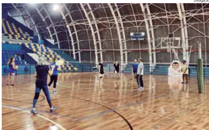
Vem Jogar movimentou o sábado com partidas de quimbol

O quimbol foi o tema da quarta edição do Vem Jogar, o programa criado pela Selam (Secretaria de Esportes, Lazer e Atividades Motoras) para proporcionar lazer e atividades físicas ao público maior de 30 anos. Nesta edição organizada no sábado (20), o Vem Jogar reuniu adeptos da modalidade para as partidas que foram disputadas no Ginásio Municipal Waldemar Blatkauskas e nas duas quadras do Ginásio de Esportes José de Oliveira Garcia Neto, os miniginásios.