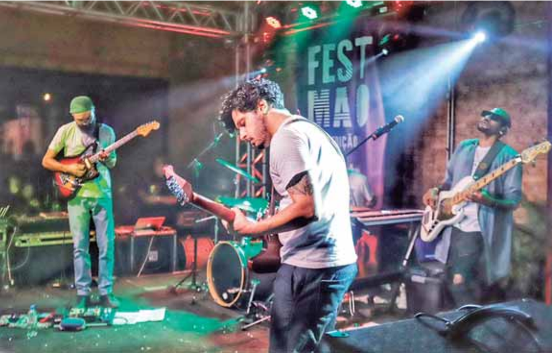
Com foco na cena paulista, curadores selecionam artistas de diferentes gêneros musicais para a Mostra Nova Cena

“Como a edição deste ano está sendo fomentada pela LPG estadual, nada mais justo do que darmos oportunidade para bandas autorais do Estado de São Paulo, convidando artistas e grupos do interior e do litoral do Estado. O objetivo é valorizar e fortalecer a cena musical regional, de forma a celebrar