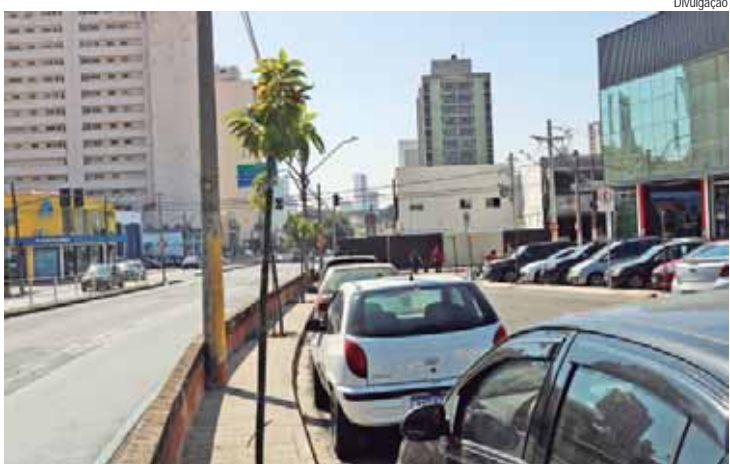
Entre as espécies plantadas estão aldrago, ipê-branco e ipê-roxo anão e magnólia

A remodelação da Praça Antônio de Pádua Dutra integrou pacote de melhorias viárias com investimento de R$ 3.669.404,55 com mais de dez intervenções em diferentes bairros.