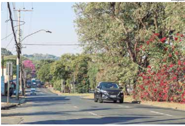
Pavimentação em concreto vai beneficiar trecho da avenida Limeira entre a avenida Monsenhor Martinho Salgot até o viaduto para a avenida 1º de agosto

A avenida Limeira já recebeu o pavimento de concreto na alça que liga a avenida 1º de Agosto até a rua Cesário Simioni. Esse é mais um dos 32 pontos do município a receber esse tipo de pavimento, mais eficiente e durável, totalizando cerca de 45km de avenidas e ruas da cidade. A obra integra pacote de recapeamento iniciado pela Prefeitura que vai beneficiar 258 km de vias, dividi-