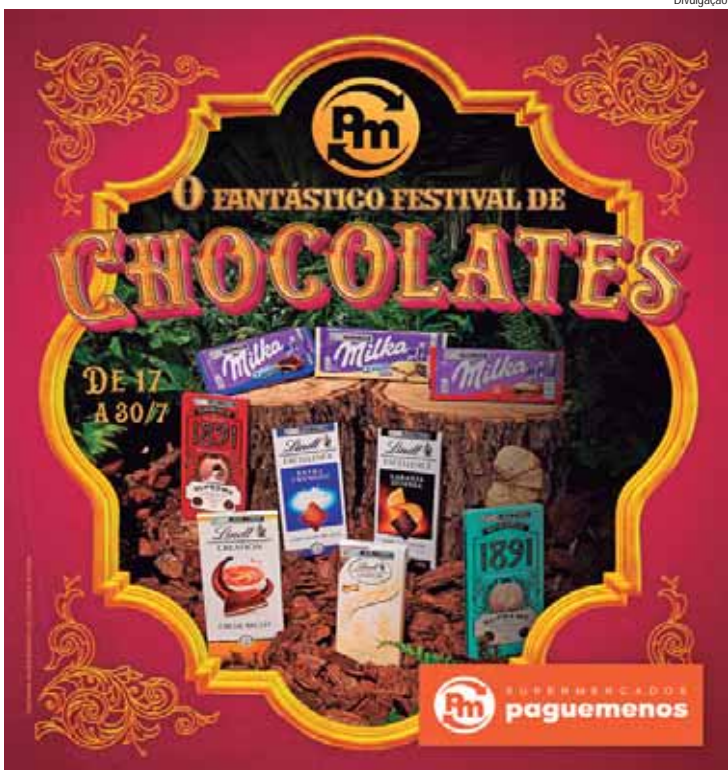
Desde o dia 17 e até dia 30 de julho, chocolates no Pague Menos têm ofertas especiais