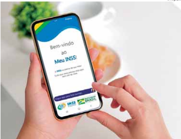
Dados da Assessoria Previdenciária do Brasil mostram que grande parte dos aposentados não checa seus dados e nem acompanha os descontos em rendimentos

“O mais comum é que as pessoas desconheçam até a sua senha de acesso, o que impede que tenham informações sobre suas contribuições previdenciárias, no caso de quem está buscando se aposentar, ou identificar descontos provenientes de empréstimos consignados, entre outros dados que estão disponíveis no aplicativo”, explica Pietro. Na rotina da consultoria previdenciária, a principal missão é a de garantir assistência em todo o processo de aposentadoria, mas também assegurar que o próprio beneficiário saiba como checar as informações referentes às aposentadorias ou aos benefícios. Os serviços incluem auxílio para garantir a aposentadoria quanto um Planejamento de Aposentadoria Personalizado. Este último foca em análises das