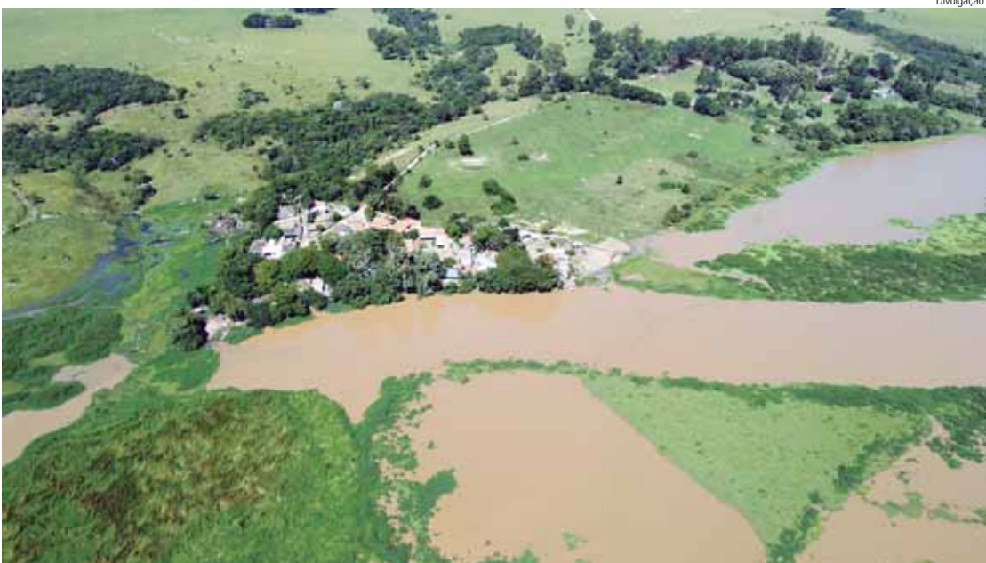
Prefeitura começa hoje (23) cadastramento de pescadores da colônia do Tanquã

De acordo com informações da Fundação Florestal, no local ocorrem 94 espécies de aves aquáticas, 16 das quais realizam movimentos migratórios e oito estão ameaçadas no estado. Entre os mamíferos e os répteis ameaçados de extinção, há a onça-parda, o lobo-guará, a jaguatirica e o jacaré-de-papo-amarelo. Já entre os peixes, as espécies piracanjuba, curimbatá-