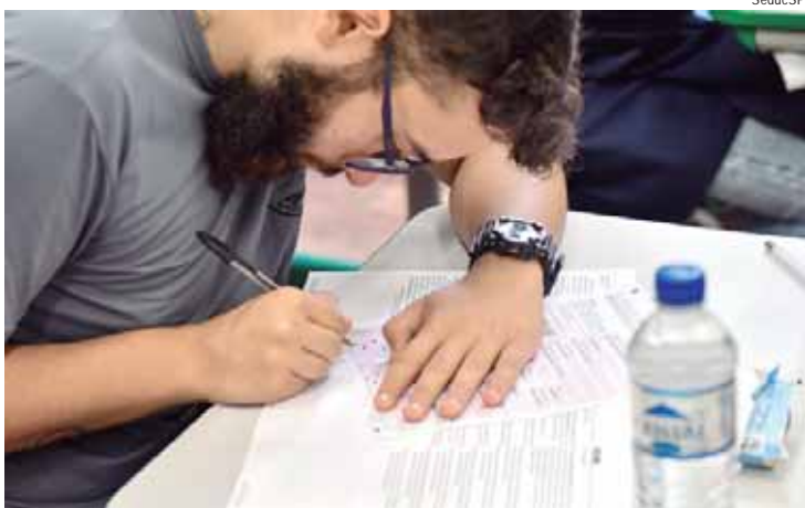
Para a 3ª série do Ensino Médio, a prova que dá acesso direto ao ensino superior será aplicada em 30 e 31 de outubro; Saresp para Ensino Fundamental também tem datas definidas