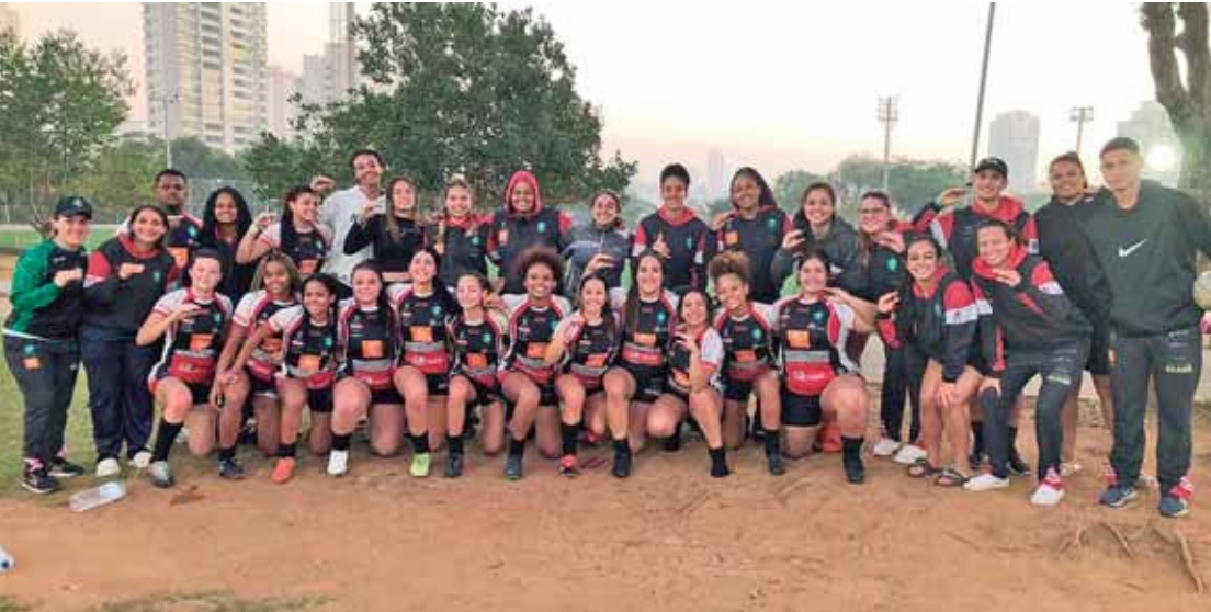
Elencos do Jacareí Rugby para a disputa da Taça Ouro e Prata do Paulista de Sevens

O Jacareí Rugby também disputou no Parque Ceret a segunda etapa do Paulista Taça Prata. Foram três jogos e duas vitórias do Jacareí Rugby: venceu