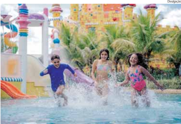
O público pode aproveitar as atrações do parque com mais conforto, em águas quentinhas

SP Jacareí, apoio de NET Jacareí, Neobetel, Sanrad, CNA Inglês Definitivo, Core Sport, Biguetti e Fisioterapia Mercadante, e Lei de Incentivo ao Esporte.