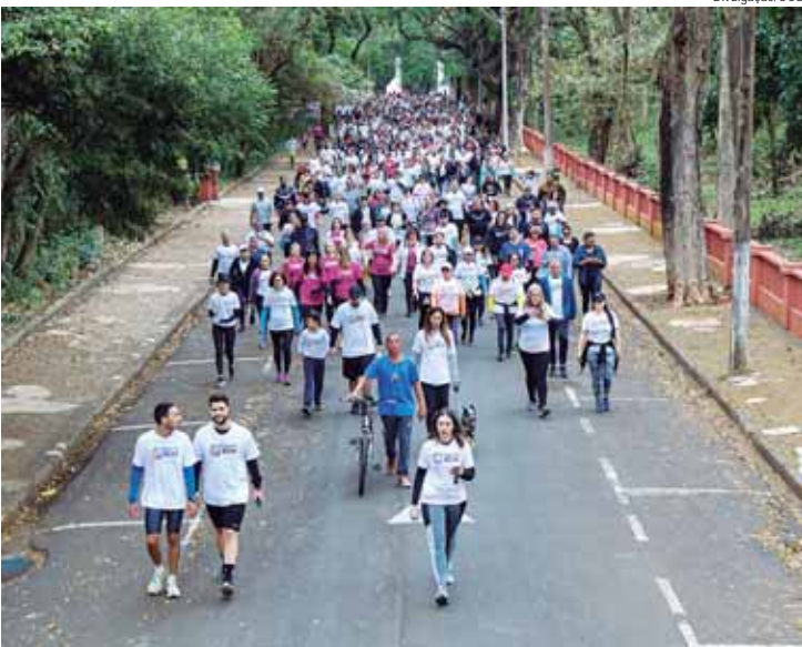
Trajetos de 5 km acontecem no dia 11 de agosto, no Engenho Central; inscrições são gratuitas mediante doação de 2 kg de alimentos não perecíveis

Nesta edição, os patrocinadores são Amplitec, Coplacana, Elring e Sindicato dos Trabalhadores Metalúrgicos (Ouro); Apparence, Bom Peixe, Cigana, CRHP