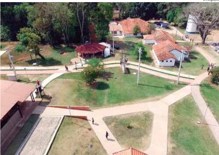
Ministério da Educação faz, durante o evento, anúncio de investimentos nos campi da Universidade