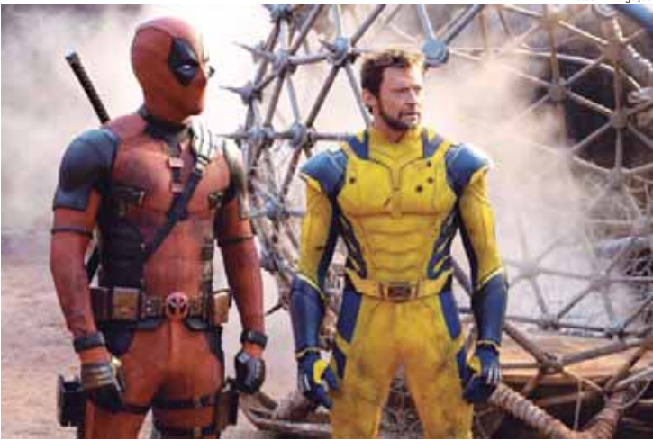
Deadpool & Wolverine reúne o icônico mercenário brincalhão Deadpool e o poderoso mutante Wolverine. A pré-esteia será na próxima quarta-feira

PRÉ-ESTREIA - Na próxima quarta-feira, 24, quase todas as salas do Cine Araújo estarão exibindo a pré-estreia da nova e muito aguardada aventura da Marvel Studios "Deadpool & Wolverine", que terá um lançamento de peso em todo o Brasil no próximo dia 25. Inclusive a Disney já promoveu no Brasil um encontro entre fãs e os atores Ryan Reynolds, Hugh Jackman e Emma Corrin, além do diretor Shawn Levy. Os fãs dos dois super-heróis vão enlouquecer com esta reunião do icônico mercenário Wade Wilson? Deadpool e o poderoso mutante Wolverine.