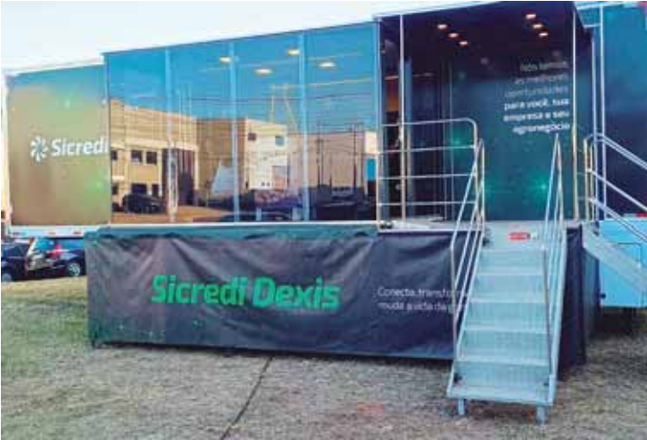
A proposta de participação do Sicredi Dexis é fixar a marca junto ao público da feira