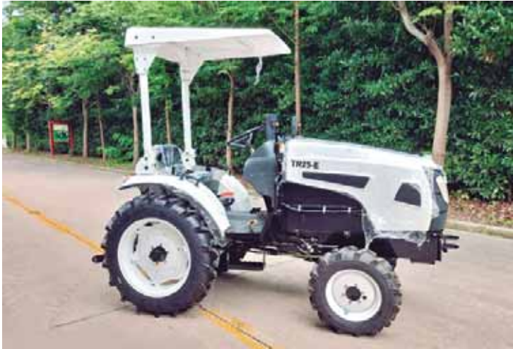
Zeepo Motors irá lançar o primeiro trator 100% elétrico da América Latina, fabricado no Brasil