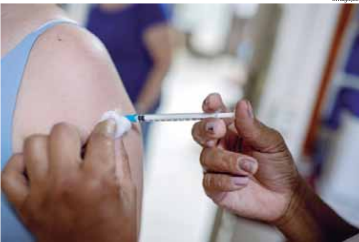
Vacinação segue em todas as unidades de saúde de Piracicaba

de, desde o início da campanha (23/03), até o encerramento em 14/07, foram aplicadas 78.033 doses na cidade; entre os grupos prioritários, já foram imunizados: 29.978 idosos (cobertura vacinal de 40,27%); 9.453 crianças de 6 meses a menores de 6 anos (39,10%); 736 gestantes (20,59%); 46 puerpéras (7,83%); e 4.706 trabalhadores da Saúde (32,91%). FRIO – Os casos de problemas respiratórios como gripe, rinite e sinusite são intensificados nos períodos de inverno devido às baixas temperaturas e clima seco. Para crianças e idosos, as doenças podem ser ainda mais graves por conta do sistema imunológico mais frágil, levando a complicações, internações e até mesmo óbito. UPA LIVRE – Instalado na quadra poliesportiva do Tiro de Guerra de Piracicaba, no bairro Morumbi, o projeto UPA Livre tem capacidade para atender até 250 pessoas por dia – em qualquer faixa etária – com funcionamento de segunda a domingo, das 7h às 18h, para pacientes sintomáticos respiratórios e, também, suspeitos de dengue. A unidade tem salas de espera, acolhimento, triagem, coleta para testes rápidos, exames de laboratório, hidratação, soro, medicação, além de três consultórios médicos. O atendimento, em parceria com o