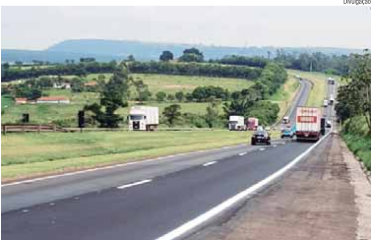
Equipamentos passam a funcionar a partir da próxima quarta em Vera Cruz, Marília, Iacri, Dracena e Itirapina

A partir da próxima quarta-feira (24), seis novos radares entrarão em operação em duas rodovias administradas pela concessionária Eixo SP. Serão cinco na SP 294 - Rodovia Comandante João Ribeiro de Barros e em na SP 310 - Rodovia Washington Luís. Os equipamentos iniciam fiscalização após homologação do Departamento de Estradas de Rodagem (DER), órgão responsável pela aplicação das multas.