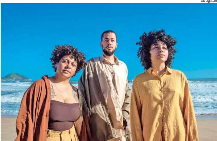
Na sexta-feira, dia 19, às 20h, acontece o show Tuyo, no Teatro