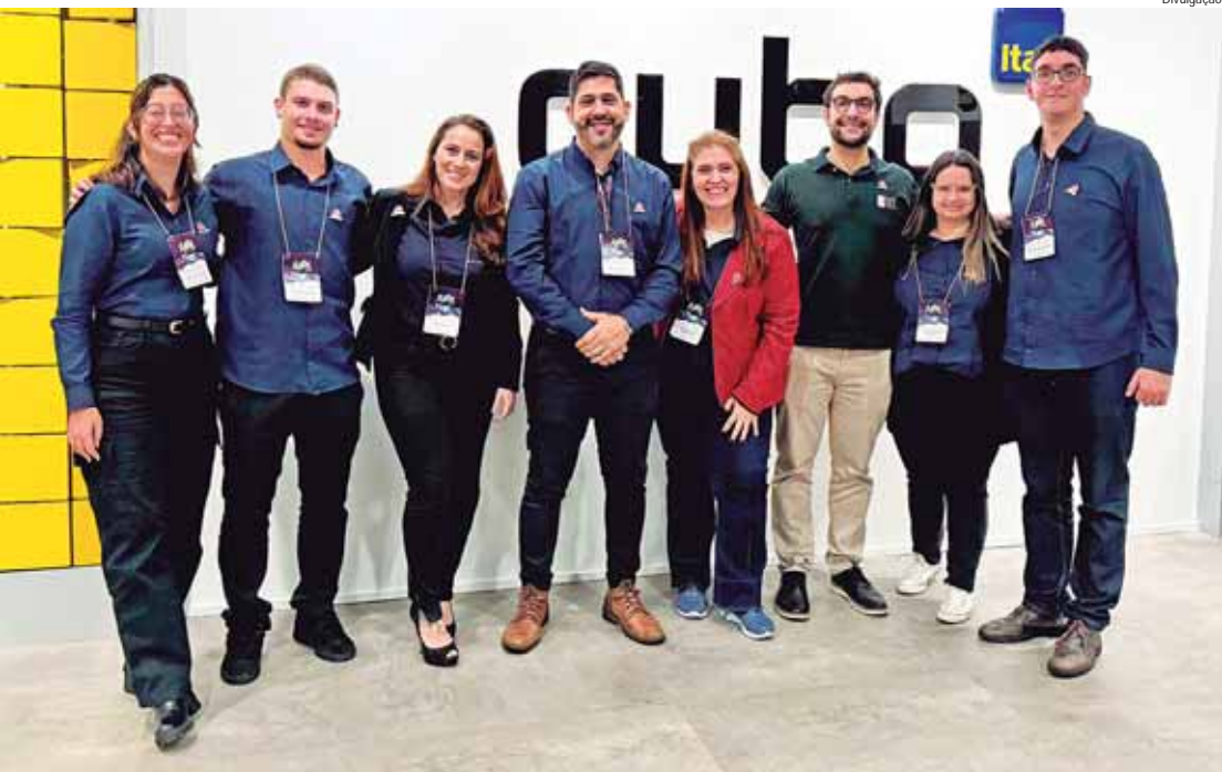
O evento reuniu profissionais, pesquisadores e empresas do setor florestal para discutir inovações, tendências, oportunidades e desafios de diversas áreas