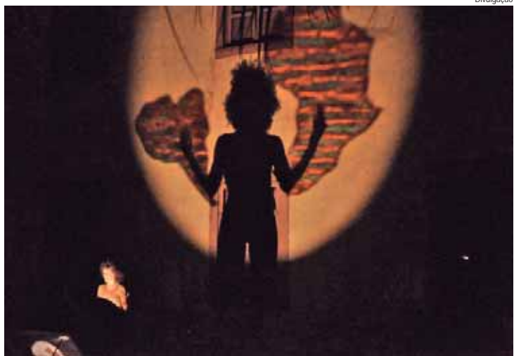
As sombras remetem ao ritual e apresentam a resistência dos negros

O Pequeno Pátio do Engenho Central, entre o Teatro Municipal Erotides de Campos e o Armazém 14, recebe amanhã (19), às 20h, o espetáculo teatro de sombras SomBRáfrica, idealizado pela Cia Quase Cinema, inspirado no universo da diáspora africana a partir do poema Navio Negreiro de Castro Alves. A entrada é gratuita e a projeção das sombras será na parede do fundo do Teatro do Engenho.