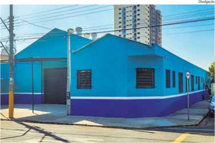
Nova sede do Fussp está na avenida Dr. Paulo de Moraes, 2073, no bairro Paulista