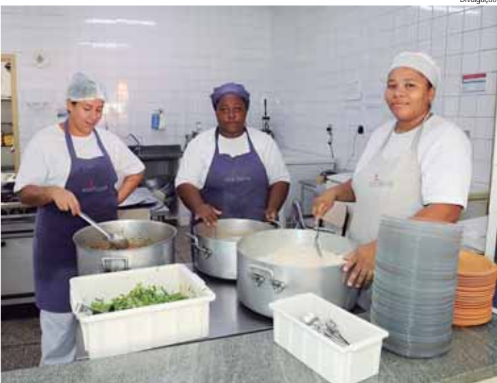
São previstas 10 vagas para o cargo de merendeiro, e haverá cadastro de reserva para suprir a demanda das escolas

avaliações em três escolas municipais: São Vicente de Paulo (Rua Dom Pedro I, 1734, bairro Cidade Alta); Prof. Walter Vitti (Rua Vinete e Um de Abril, 200, bairro Paulicéia) e João do Nascimento (Rua Antônio Augusto de Souza, 456, bairro Santa Teresinha). As provas estão previstas para ocorrer das 8h às 16h nos dois dias, com grupos de quatro pessoas por vez. Os candidatos devem estar atentos às datas, horários e locais de realização das provas, conforme divulgado no edital. São previstas 10 vagas para o cargo de merendeiro e haverá cadastro de reserva para suprir a demanda das escolas da Rede Municipal de Educação quando necessário.