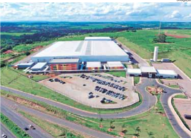
Há mais de três décadas, Rede de Supermercados Pague Menos pensa em seus clientes

Atualmente, a Rede opera 36 lojas em 20 municípios: Araras, Americana, Artur Nogueira, Boituva, Campinas, Hortolândia, Indaiatuba, Itu, Limeira, Mogi Guaçu, Nova Odessa, Paulínia, Piracicaba, Santa Bárbara d'Oeste, São João da Boa Vista, São Pedro, Salto, Sumaré, Tietê e Valinhos. Além disso, possui um Centro de Distribuição, um Centro Administrativo e um Entrepósito de Carnes em Santa Bárbara d'Oeste. O sonho de ter uma vendinha e gerar empregos tornou-se realidade. Cada nova loja contribui para a criação