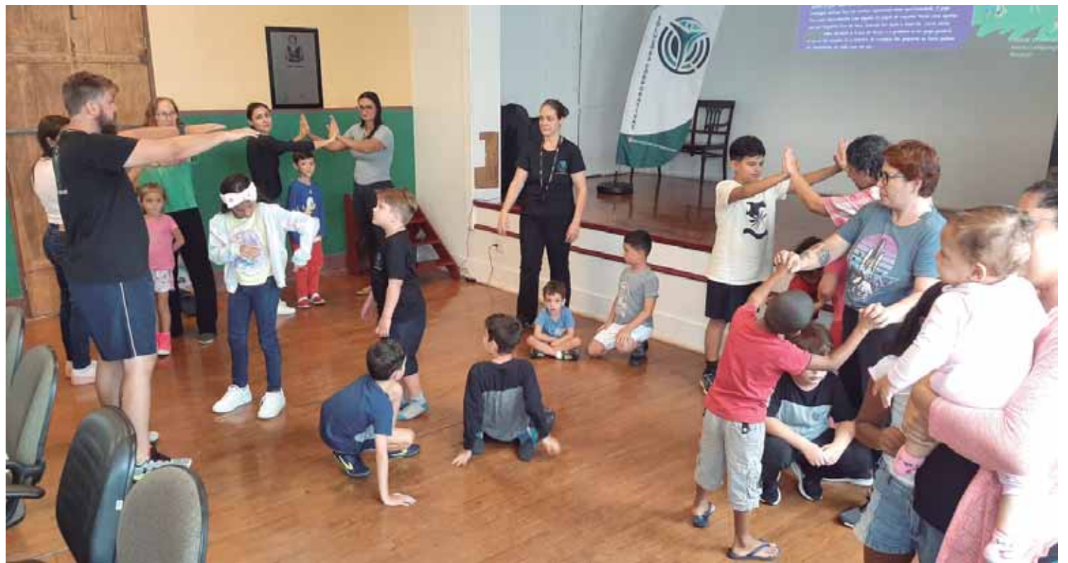
Brincadeiras antigas, com Motion Corporative, abre projeto no dia 16, no Museu Histórico e Pedagógico Prudente de Moraes