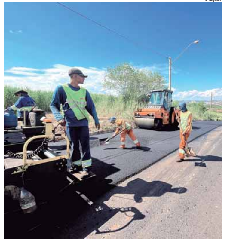
Nova Piracicaba, Dois Córregos, Vila Cristina, Vila Rezende e Centro recebem serviços de recape no fim de semana

Algodoal: rua Domingos Mazzonetto; Cecap: avenida Romeu Italo Ripoli e rua Fernando Monteiro; Dois Córregos: avenida Dois Córregos; Jaraguá: rua MMDC; Javary III: rua Caju; Jardim Ibirapuera: rua Maestro Pettermann; Jardim Itapuã: rua Pedro Habechian, rua José Alcântara Machado de Oliveira e rua Sebastião Ferraz de Barros; Jardim Primavera: avenida Marechal Castelo Branco; Monte Alegre: via Horácio Cerioni; Nova Piracicaba: rua Alceu Maynard Araujo, rua Antonio de Campos Negreiros, rua José Carlos Piffer e rua Miss Martha Watts; Piracicamirim: avenida Pompeia, rua São Dimas e rua José de Campos Camargo; Santa Teresinha: rua João Freidemberg Sobrinho e rua Manoel de Barros Ferraz; Unileste: rua João Franco de Oliveira; Vila Industrial: rua José Zaguetti; Vila Prudente: rua Iracema Pereira; e Vila Sônia: rua Francisco Gorga, rua João Stella, rua Maria de Lourdes Rocha Stolf e rua Santo Trevisan.