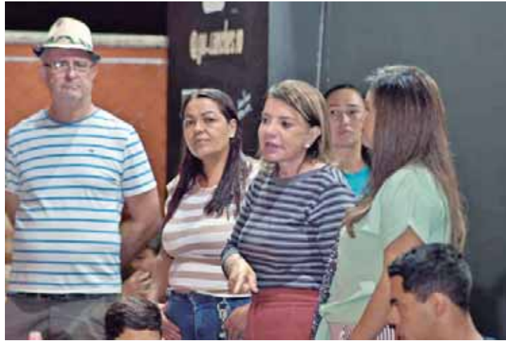
Bebel quer implementar políticas que facilitem o empreendedorismo e criem um ambiente para prosperar