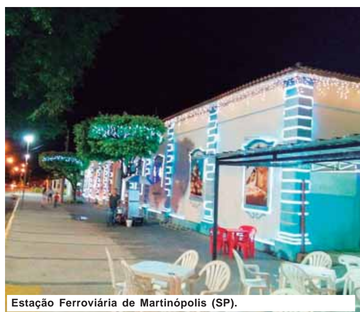
Estação Ferroviária de Martinópolis (SP).