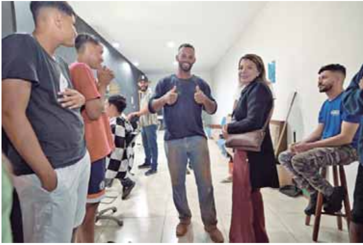
Nas visitas, Bebel destaca a importância do poder público municipal apoiar os pequenos empreendimentos