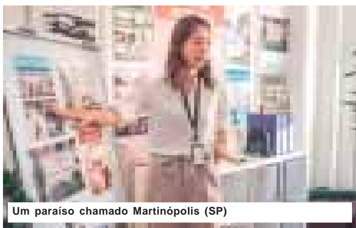
Um paraíso chamado Martinópolis (SP)