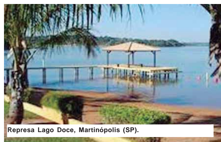
Represa Lago Doce, Martinópolis (SP).