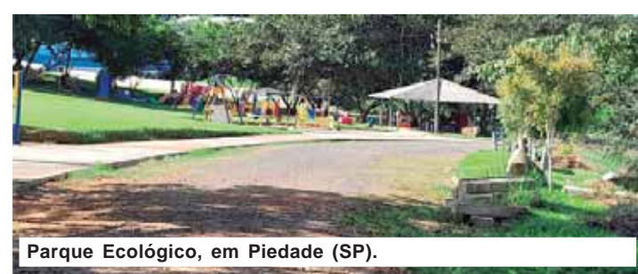
Parque Ecológico, em Piedade (SP).