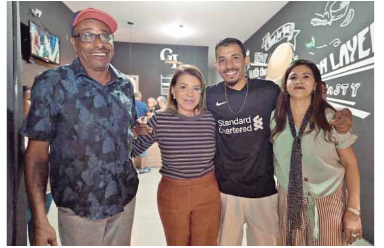
Bebel em visita a estabelecimentos comerciais na região do bairro Mário Dedini, na última quinta-feira