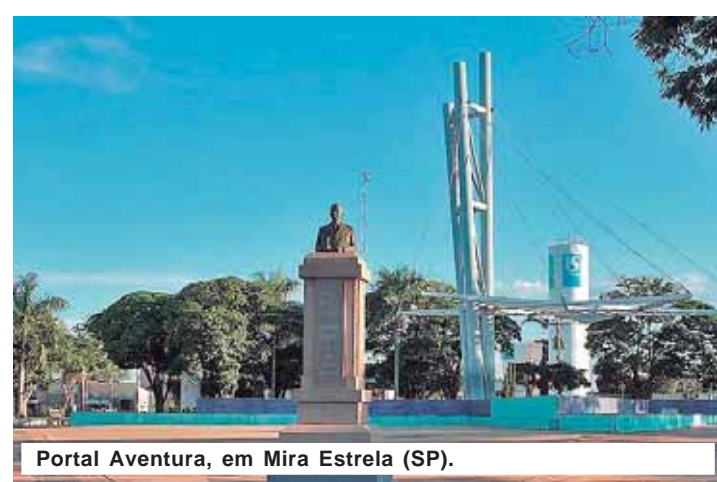
Portal Aventura, em Mira Estrela (SP).