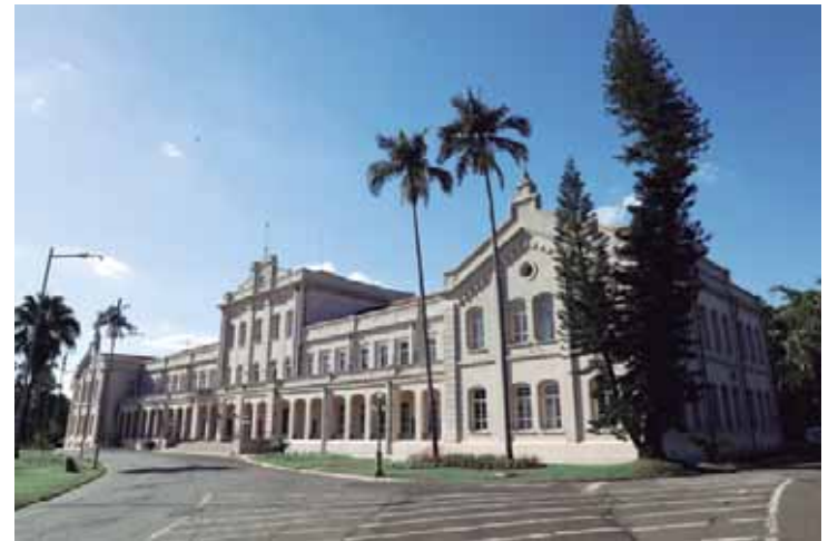
Prédio foi construído entre 1905 e 1907: Edifício Central

torno do prédio. A moldura natural da edificação símbolo da Esalq conta agora com espécies como Lavandula dentata, Agelonia Archangel Dark Rose, Impatiens Clockword e Agapanto. Foram plantadas ainda duas mudas de cycas no centro do canteiro e mais de 2.000 m 2 de grama Batatais.