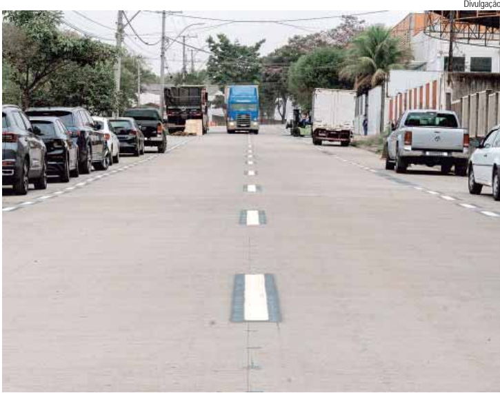
Ruas Antônio Borja Medina e Benedito de Andrade foram beneficiadas com a pavimentação