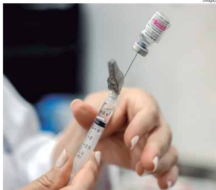
Ação será no sábado, 13, em três unidades de saúde das 9h às 14h

PREVENÇÃO – Alguns dos cuidados mais importantes para a prevenção da dengue são: Utilizar repelente, principalmente em lugares fechados; Eliminar focos de água parada; Manter os pratos de vasos de flores e