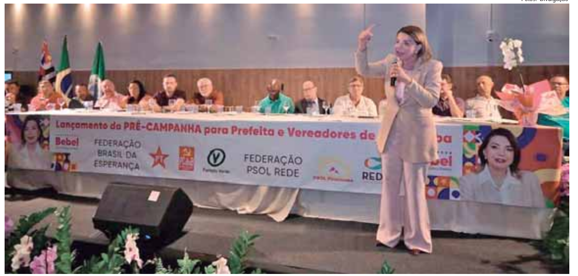
Bebel disse que irá administrar Piracicaba com os conselhos municipais, que terão papel deliberativo, elegendo prioridades