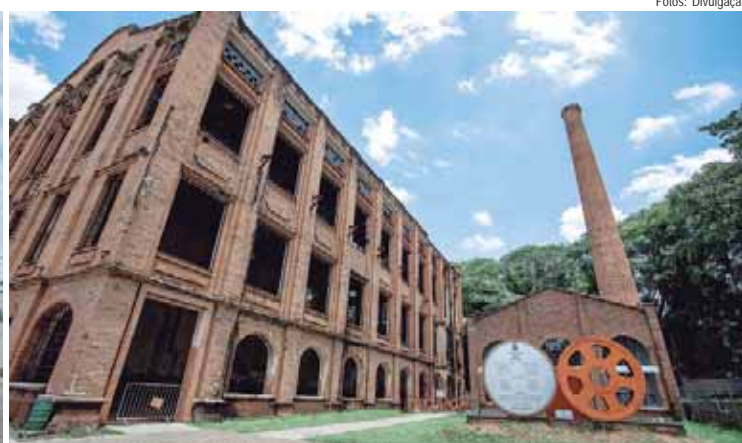
Roteiros gratuitos incluem passeios de ônibus por locais turísticos e de importância histórica, acompanhados por um guia e/ou monitores dos atrativos