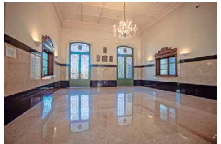
Preservação histórica garantida na reforma: Condephaat