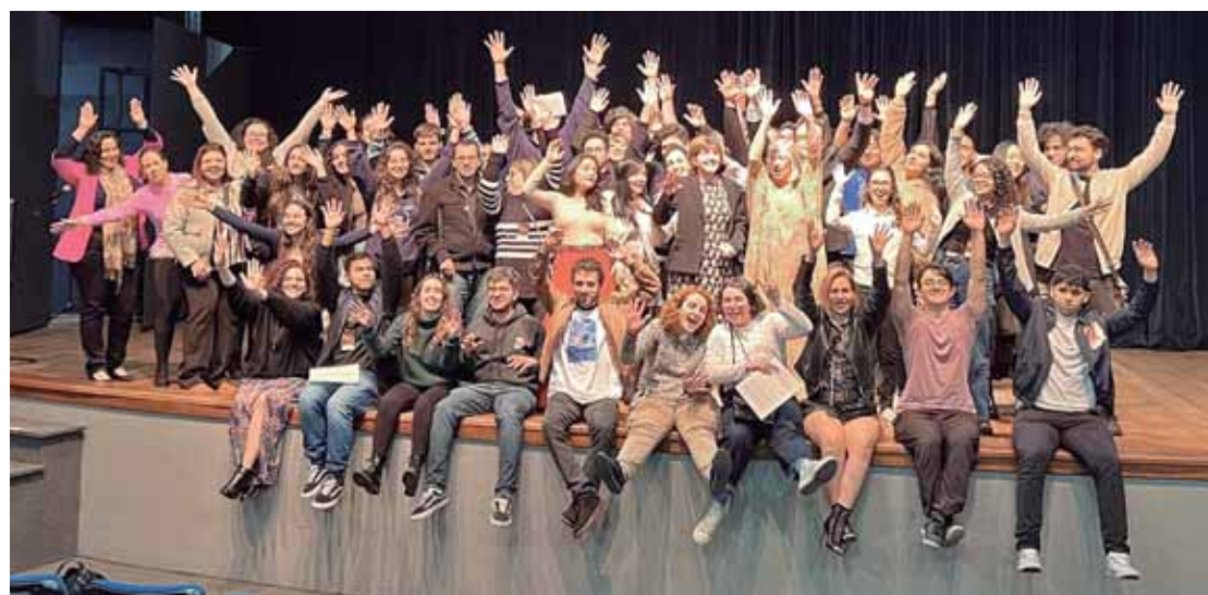
Eipianopira acontece há 11 anos: elevado padrão técnico