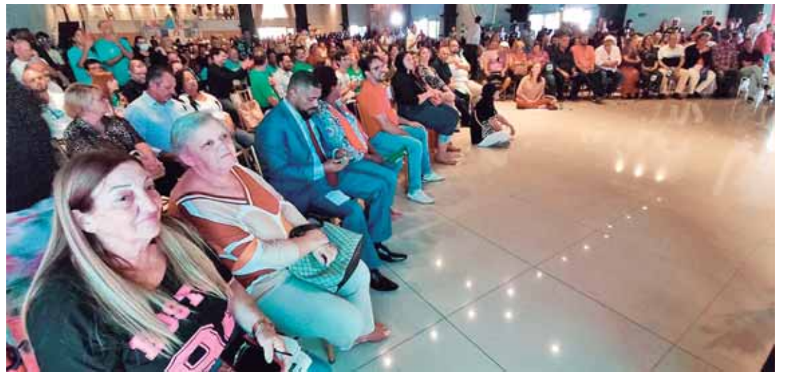
No evento também foi lançada as pré-candidaturas dos candidatos a vereador pelo PT, PV, PC do B, Rede, Psol e PCO