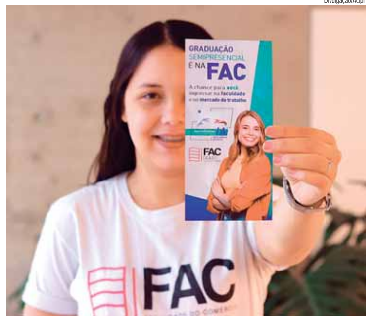
As inscrições estão abertas e as aulas começam em agosto

CURSOS RÁPIDOS — Além da Graduação, a Escola de Negócios da Acipi está promovendo dois cursos em julho. O curso "Introdução do Marketing na Prática" ocorrerá nos dias 15, 16 e 22 de julho, das 19h às 22h. A atividade é voltada para empreendedores e colaboradores de empresas de pequeno e médio porte, bem como Microempreendedores Individuais (MEIs) e visa capacitar os participantes a desenvolverem seu próprio planejamento estratégico de marketing, considerando as limitações e oportunidades de seus negócios, proporcionando autonomia e ferramentas práticas para alavancar suas iniciativas. Outro destaque é o curso "Re-