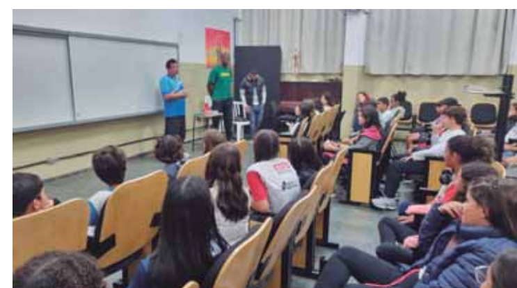
Serão lançados dois novos projetos esportivos: atletismo e futebol de campo

Sextas 15h30 às 17h30 Para alunos do ensino médio