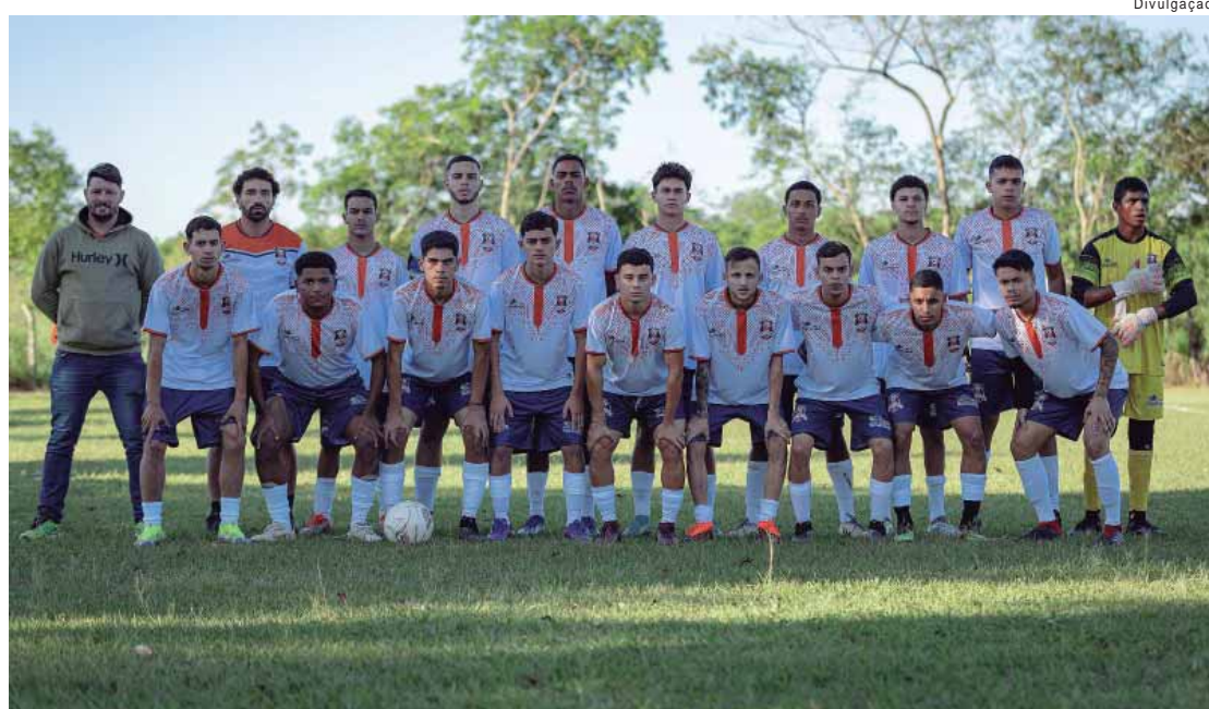
O São Pedro Futebol Clube conta com apoio da Prefeitura de São Pedro, por meio da Coordenadoria de Esportes de Lazer