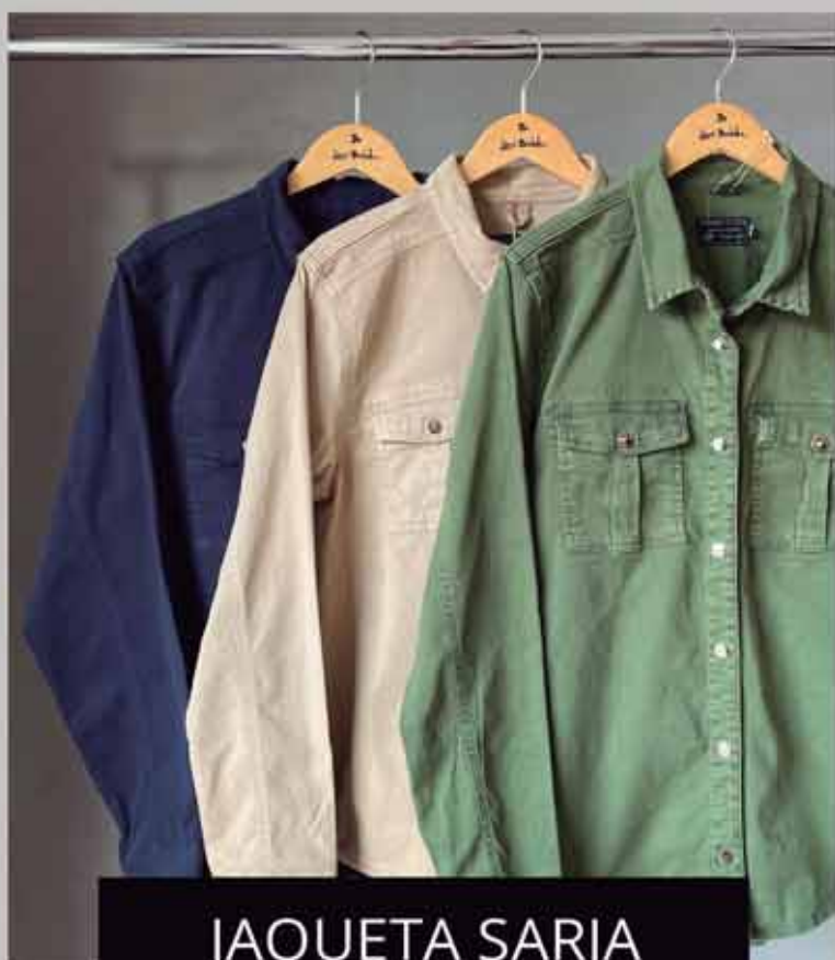
JAQUETA SARJA R$349,90