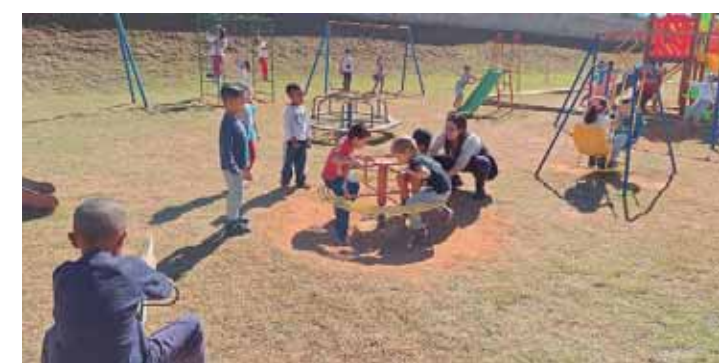
DIA DE BRINCAR - Aproximadamente 1.400 alunos de 13 escolas municipais de São Pedro celebraram o Dia Mundial do Brincar divertindo-se em diversas atividades recreativas. A12

região metropolitana de Piracicaba da qual faz parte. E a unidade 2 do hospital São Lucas representa mais um marco histórico na trajetória da unidade de saúde que correu sério risco de fechar as portas. O local vai funcionar como hospital-dia, terá 12 leitos, 3 centros cirúrgicos e muitas características de atendimento de saúde privado, mas o atendimento será 100% SUS. A8