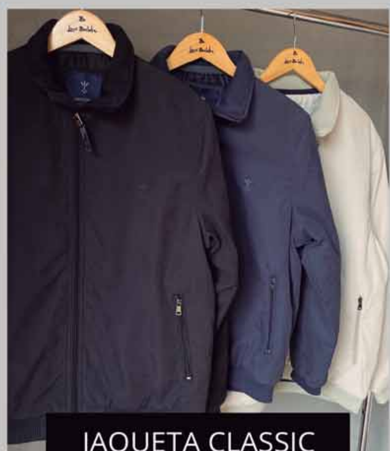
JAQUETA CLASSIC R$569,90