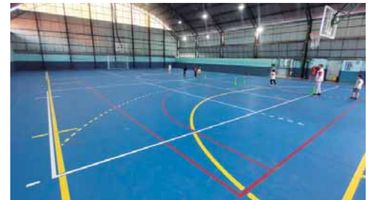
Além da reforma do piso, o espaço também recebeu novas tabelas e pintura nova

Além disso, o prefeito anunciou que já iniciaram as tratativas para a cobertura da quadra da escola municipal Emef Maria Luiza Fornasier Franzin Unidade III, o que trará mais conforto e melhores condições para a prática esportiva dos alunos e da comunidade.