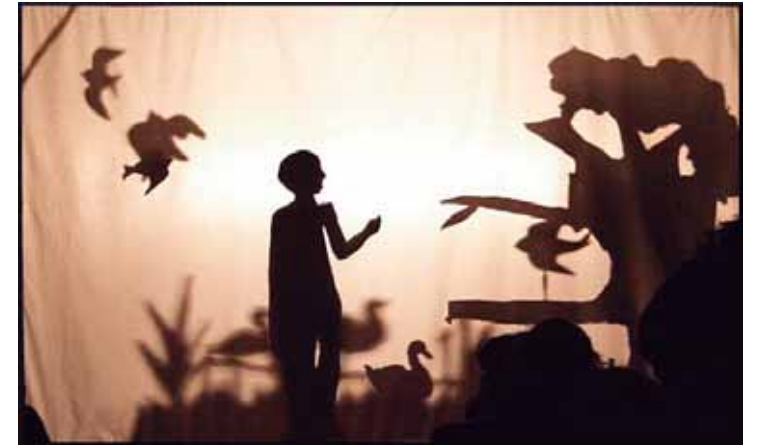
Oficina gratuita será dia 11 próximo, terça-feira

Matarazzo, localizado na rua Joaquim Teixeira de Barros, 860. Há 20 vagas disponíveis e a oficina tem duração de 4 horas. Os participantes vão criar uma história narrada por meio de personagens e cenários de silhueta (papel preto), como em um verdadeiro teatro de sombras. O próximo passo será animar a história na técnica stop-motion, resultando em um filme de animação de sombras.