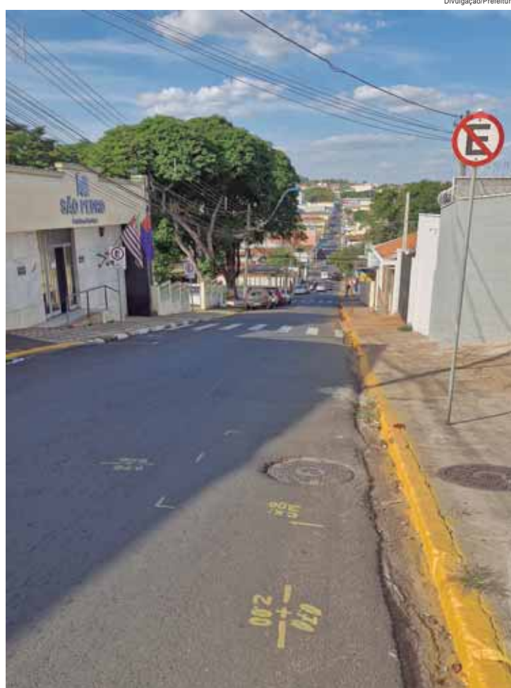
Empresa já fez as marcações na rua Valentim Amaral para dar início às obras