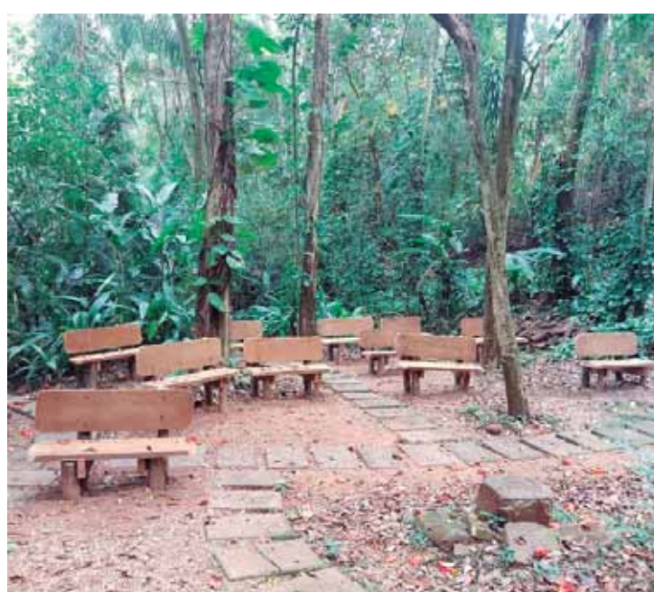
O Mini-Horto funciona todos os dias, das 8h às 17h, na rua Raul Ribeiro da Costa, s/nº, Centro

iremos realizar", disse. O Mini-Horto - O local é um verdadeiro tesouro de Águas de São Pedro. Com seus quiosques, árvores, lagos e estufa para desenvolvimento de plantas, o Mini Horto abriga cinco mil mudas de espécies como Jacarandá, Oiti, Mogno, Aroeira e Pau-Brasil. Além disso, é um ponto de descanso e contemplação para os peregrinos do Caminho do Sol, uma rota de 241 km inspirada no Caminho de Santiago de Compostela, na Espanha. Muitosromeiros visitam a Casa de Santiago todos os anos, tornando esse lugar ainda mais especial. O Mini-Horto funciona todos os dias, das 8h às 17h, na rua Raul Ribeiro da Costa, s/nº, Centro