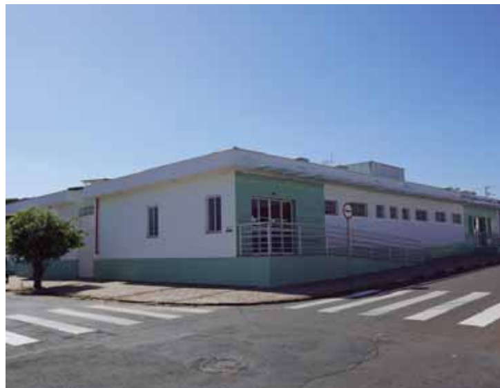
Construção contribuiu para a descentralização