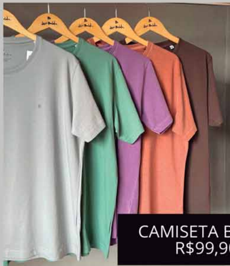
CAMISETA BÁSICA R$99,90