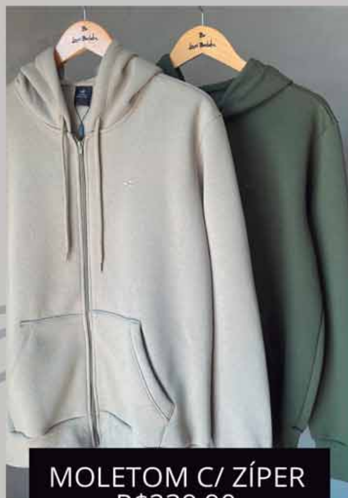
MOLETOM C/ ZÍPER R$239,90