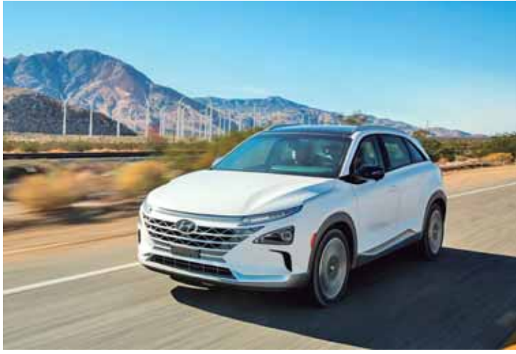
A visão da Hyundai é o veículo para futuro: carros e caminhões