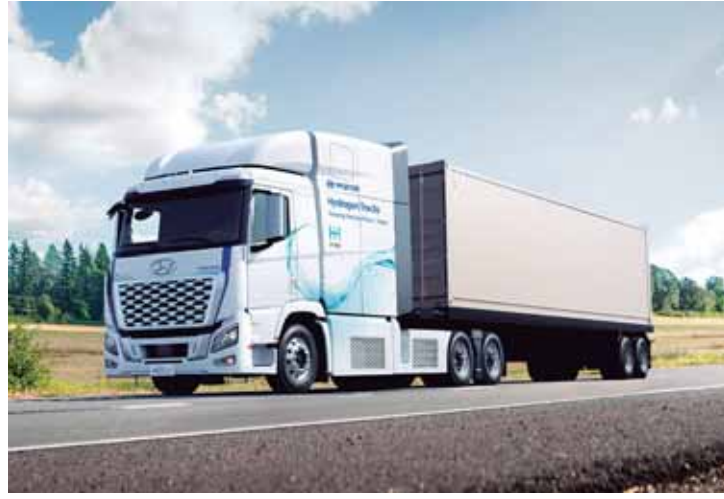
Encontro sobre carros e caminhões a hidrogênio é realizado no RJ