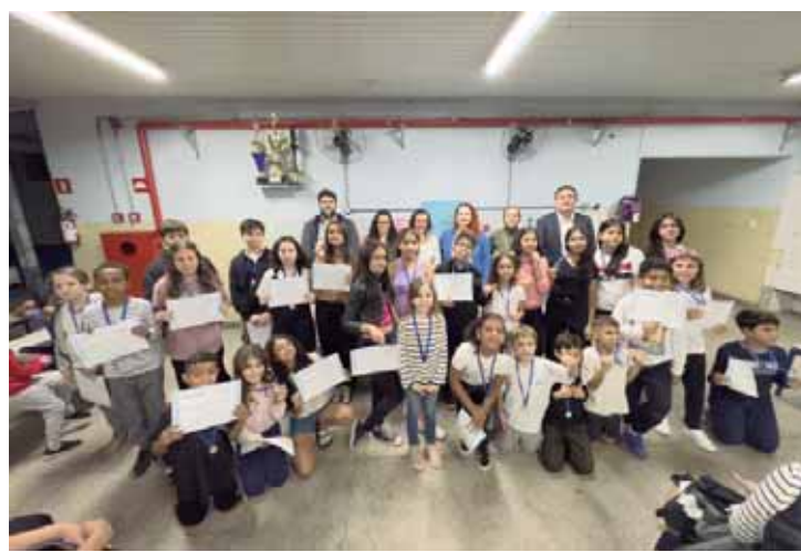
A Olimpíada Mirim é uma iniciativa do Instituto de Matemática Pura e Aplicada (IMPA) e recebe apoio da B3 Social

"Meus parabéns aos nossos alunos e também aos professores e toda equipe da educação