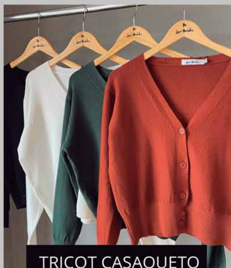
TRICOT CASAQUETO R$199,90