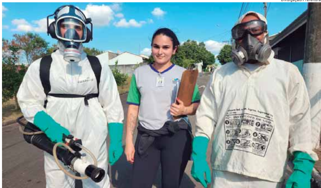
Na terça (4), agentes visitaram 28 residências em São Pedro

- Pessoas impossibilitadas de aguardarem a aplicação do inseticida do lado de fora deverão permanecer em cômodo com portas e janelas fechadas.