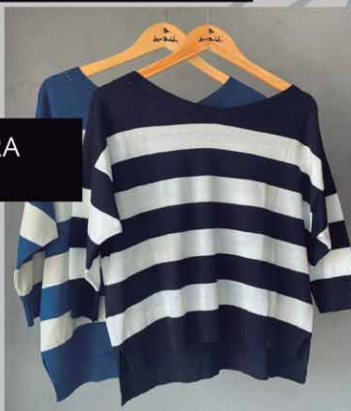
TRICOT ZARA R$149,90