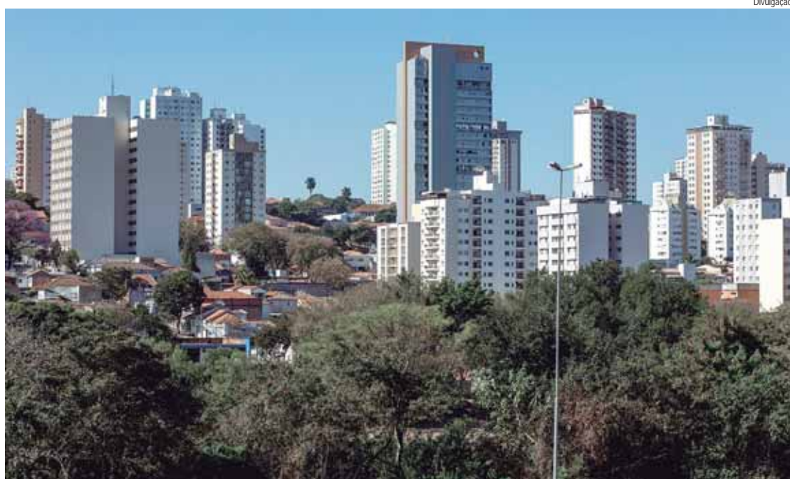
O Plano Estratégico visa atender os Objetivos do Desenvolvimento Sustentável (ODS), estabelecidos pela ONU

Lançamento do Plano de Desenvolvimento Estratégico Pira 2040. Hoje (26), 18h30, no Teatro Erotídes de Campos, Engenho Central. Inscrições no formulário: https://bit.ly/pira-2040 .