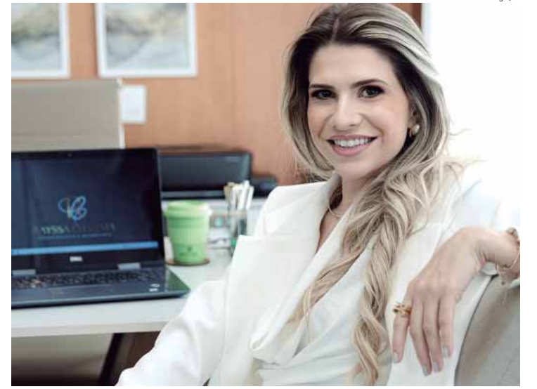
A endocrinologista fala sobre como é possível conviver com a doença de maneira positiva e ativa