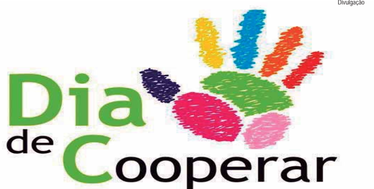
Ações voluntárias incluem arrecadação de donativos, entre alimentos, cobertores, agasalhos, brinquedos e demais itens

As 113 agências da Sicredi Dexis, em atuação em 110 municípios distribuídos nas regiões norte e noroeste do Paraná, centro e centro-leste paulista, participarão do Dia de Cooperar 2024 com ações do Dia C (Dia de Cooperar) acontecerá no dia 6 de julho.