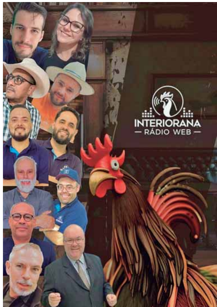
INTERIORANA RÁDIO WEB

A ação será realizada pela equipe de fiscalização da regional em Piracicaba. Em 2023, o Ipem-SP verificou 6.265 radares nos 645 municípios que compõem o Estado de São Paulo.