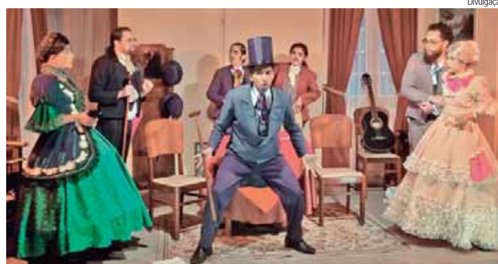
Cia Pimenta de Teatro recebe nesse sábado (29) o espetáculo “O primo da Califórnia”

O Grupo Pádua Produções Artísticas encerra sua temporada no espaço da Cia Pimenta de Teatro nesse sábado (29), com o espetáculo “O primo da Califórnia”, do autor Joaquim Manuel de Macedo, com adaptação dramática de Bêne Giangrossi, Lívia Spada e Pádua Soares.