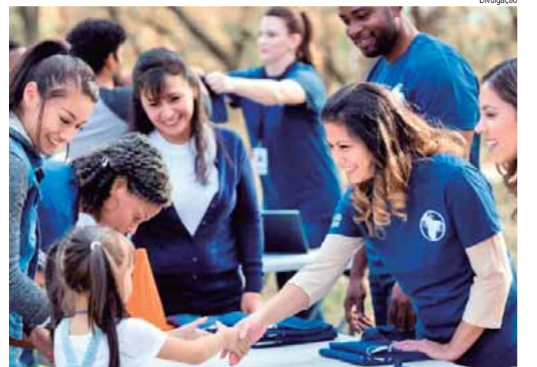
Escolas públicas e privadas podem concorrer a até R$40 mil com projetos de sustentabilidade que beneficiem comunidades locais

INICIATIVA CIDADÃ - "Esta segunda edição do Prêmio Escolas Sustentáveis valoriza com ainda mais força os projetos sociais, ambientais e de governança que