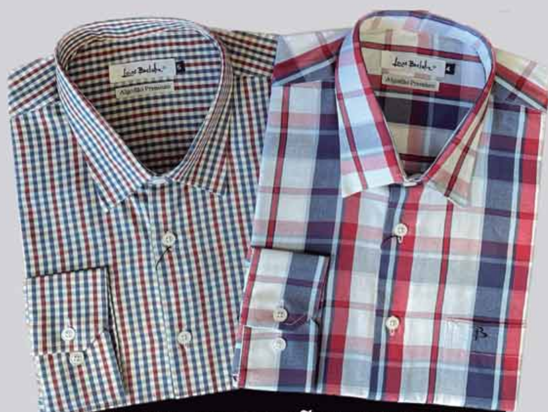
CAMISA ALGODÃO PREMIUM MANGA LONGA R$259,90