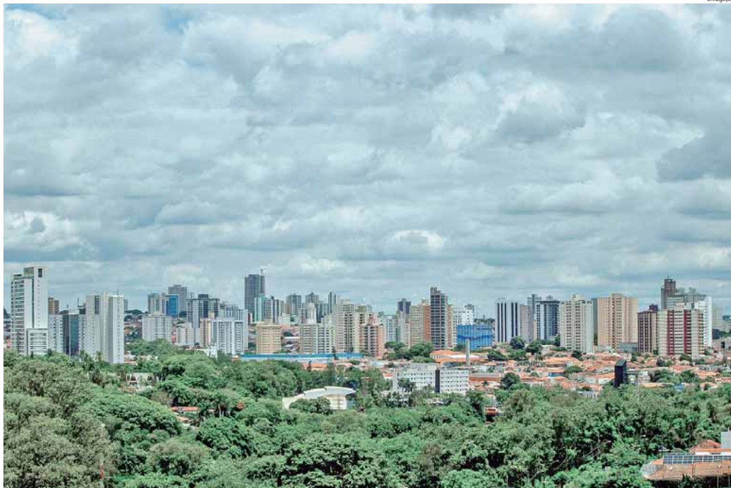
Prefeitura envia LDO (Lei de Diretrizes Orçamentárias) 2025 para análise da Câmara

Sempre atual, em Quincas Borba, 1892, Machado de Assis sentenciou: "Ouça-me este conselho: em política, não se perdoa nem se esquece nada."