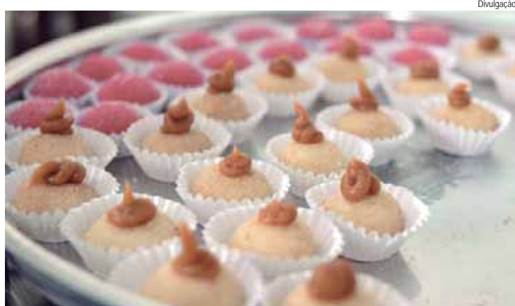
Alunos aprenderão receitas como brigadeiros tradicionais e gourmet, pão de mel, trufa, bombom trufado e beijinho de coco

Os interessados devem fazer a inscrição pelo celular, por meio do aplicativo Pira Cidadão. Basta fazer o login no app e seguir o passo a passo: Solicitações > Sema > Inscrições. Também é possível se inscrever ligando diretamente para a Sema, no telefone (19) 3437-4000.