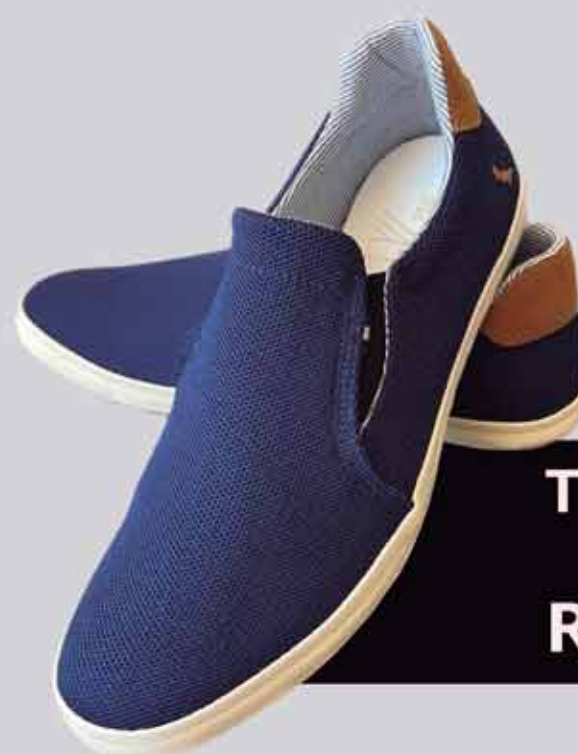
TÊNIS KNIT RESERVA R$399,90