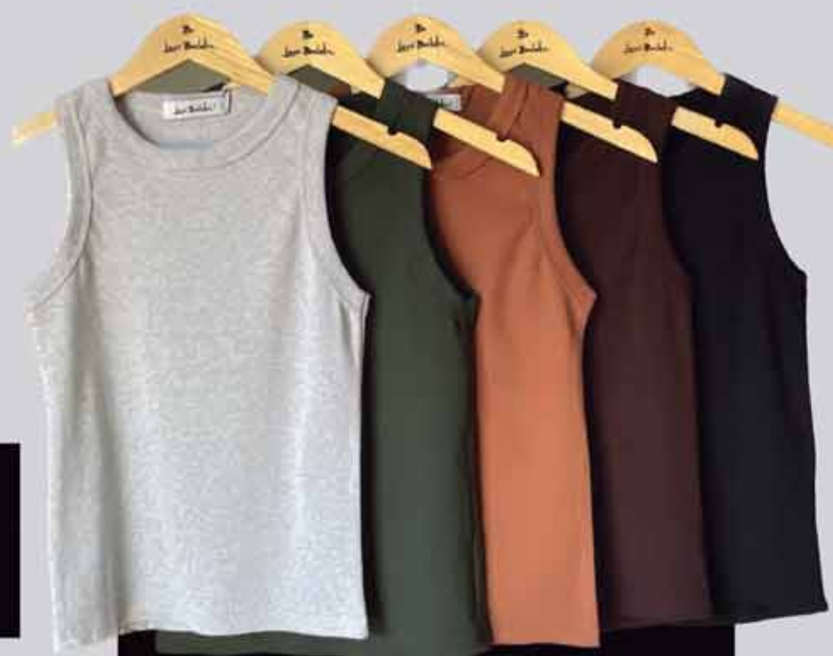
REGATA BÁSICA R$89,90