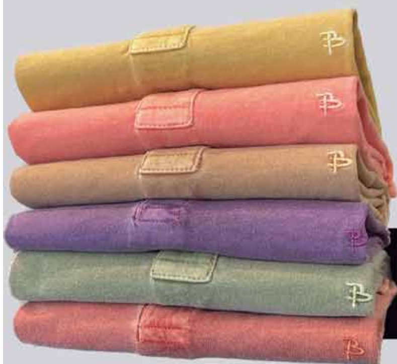
POLO MALHA STONE R$179,90