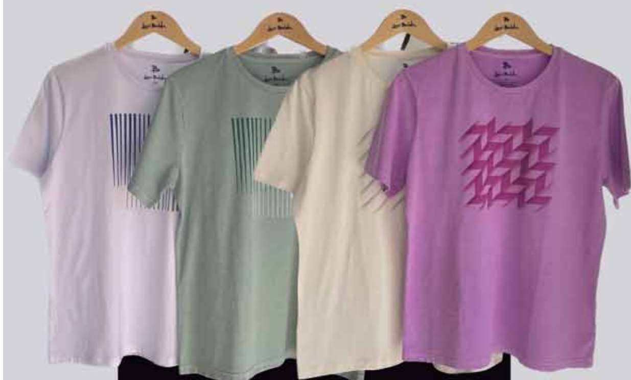
CAMISETA ESTAMPADA R$139,90