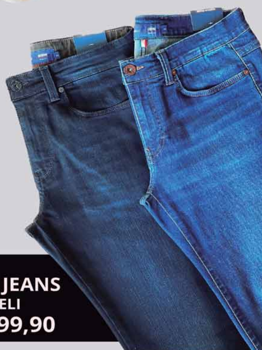
CALÇA JEANS FIDELI R$399,90