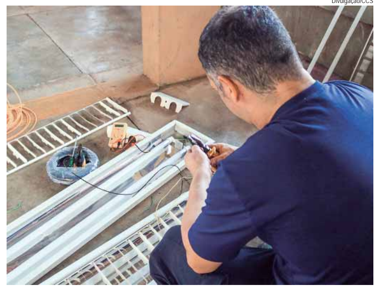
Iniciativa auxilia no processo de ressocialização do detento