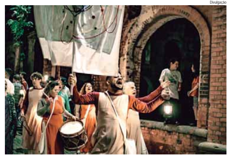
No Engenho Central, Ceta faz mais duas apresentações de Pelas Frestas do Esquecimento