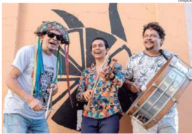
Banda formada por experientes músicos de Piracicaba toca na quinta-feira (27)