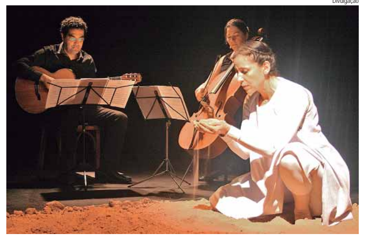
Nos dias 27, 28 e 29 de junho, Grupo Sobrevento estará em Piracicaba para realizar o Projeto Terra – Teatro para Bebês

SERVIÇO Dia 29 de junho, às 20h. Local: Rua Alfredo Guedes, 383 – Piracicaba. Informações: (19) 9.9706-3817 (Bêne).