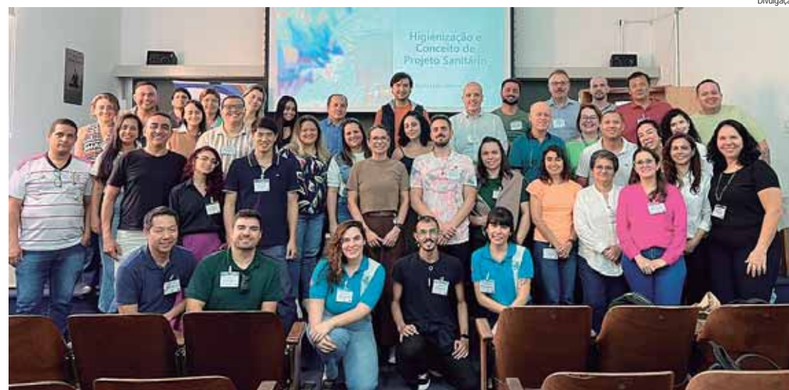
Curso teórico-prático aconteceu nos dias 10 e 11 de junho, na Esalq

Ao longo da programação, especialistas debateram sobre temas como aspectos de regulação e mercado, higienização e conceito de projeto sanitário, monitoramento ambiental e gestão de dados, abate humanitário de peixes, certificação de sustentabilidade da aquicultura, sódio em pescado, aditivos em pescado, controle microbiológico na cadeia do pescado, diagnóstico por PCR para sanidade animal, etc. Além das palestras, ocorreram atividades práticas e análises de controle de qualidade do pescado no laboratório do Getep.