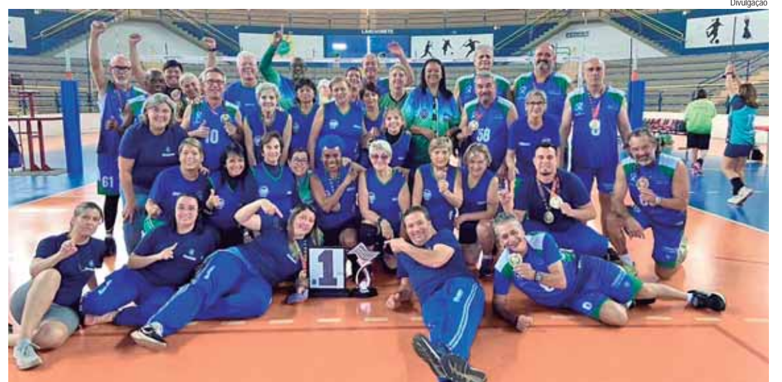
Comissão técnica e atletas na comemoração do título da fase regional do Jomi

Na segunda colocação da classificação geral no quadro de medalhas ficou o município de Botucatu, com 101 pontos e, em seguida, em terceiro lugar, a cidade de Lençóis Paulista, com 91 pontos ganhos.