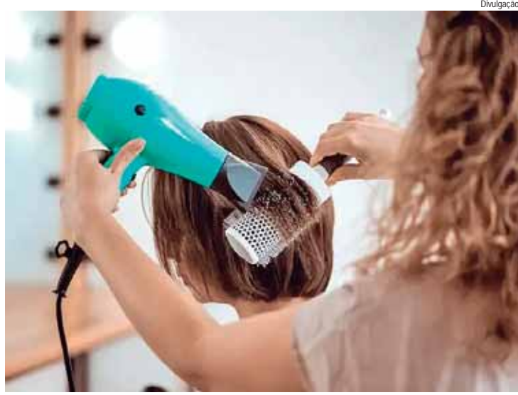
Levantamento com dados da Receita Federal mostram que no último mês foram cerca de 373,4 mil novos empreendimentos inaugurados