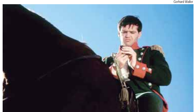
Longa-metragem Sombras do Terror, lançado em 1963, está em cartaz nesta quarta-feira (26)

O anfiteatro da Biblioteca Municipal Ricardo Ferraz de Aruda Pinto, equipamento mantido pela Prefeitura, por meio da Semac (Secretaria Municipal da Ação Cultural), exhibe na próxima quarta-feira (26), às 19h, o longa-metragem de terror/drama Sombras do Terror, que tem o ainda jovem Jack Nicholson como protagonista. A sessão de cinema tem entrada gratuita.