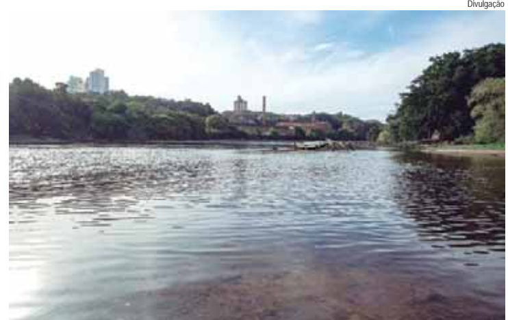
Ação, que acontece até dia 29, terá documentário, cine-debate, oficina, bate-papo e roda de conversa