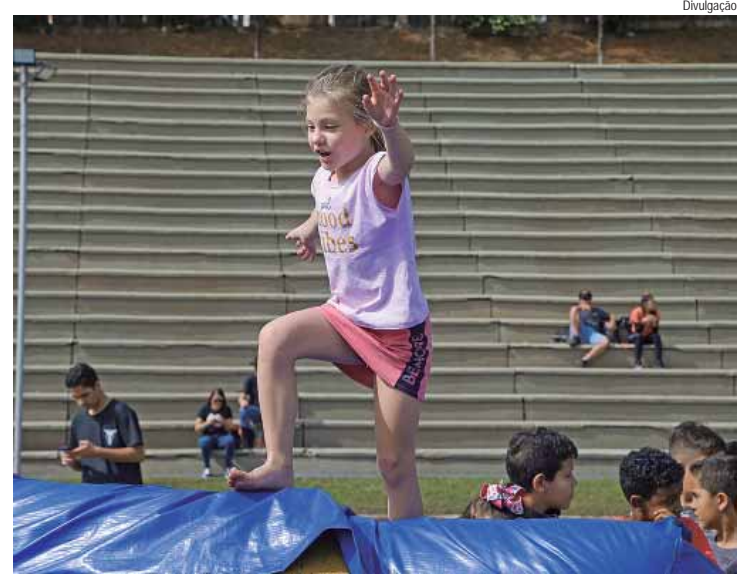
Super Férias reúne atrações para crianças no recesso escolar

4ª Feira da Empregabilidade. Amanhã (26) e quinta-feira (27), das 9h às 15h. No Engenho Central, galpões 9 e 10. Avenida Doutor Maurice Allain, 454, Vila Rezende.