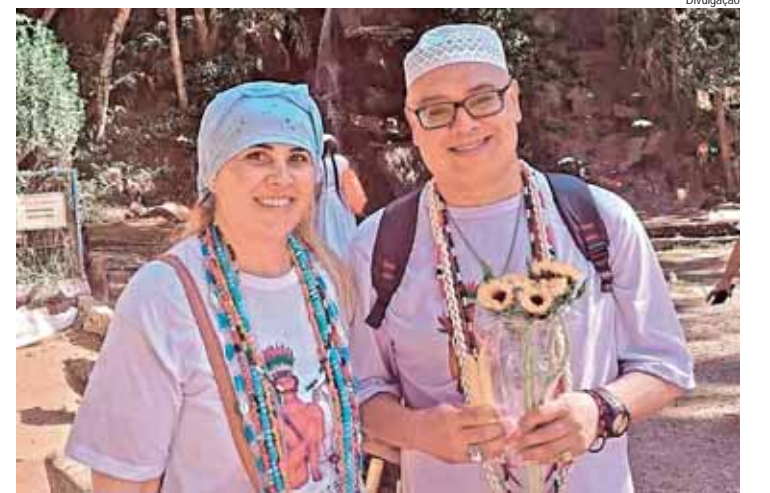
Dirigentes da TUCJZPA recebem comenda pelo respeito à diversidade e combate à intolerância religiosa

Nascido em Piracicaba em 02/8/1972, desde 2019 é patrono e titular da cadeira 62 da Academia Independente de Letras (sede em Pernambuco), com a divisa “Axé”. Em Piracicaba idealizou e coordenou inúmeros projetos culturais e o Fórum Municipal das Religiões de Terreiro (2011-2014), produziu curtas-metragens com temática dos Orixás e dirige, em Piracicaba, a Tenda de Umbanda Caboclo Jiboia e Zé Pelintra das Almas, fundada em 2015, em Blumenau - SC,