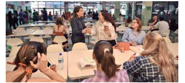
Bebel na festa junina da ETEC Cel Fernando Febeliano da Costa