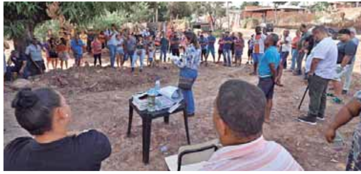
Na comunidade Renascer, Bebel destacou o seu compromisso com a habitação popular