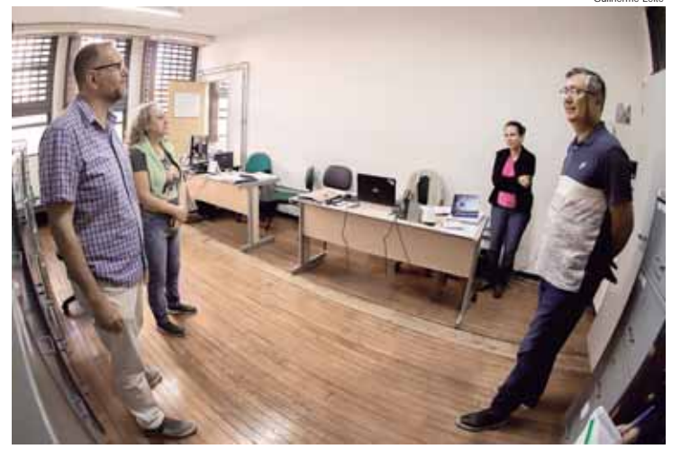
Ceeja Professor Antonio José Falcone passou a funcionar no novo espaço no fim do ano passado