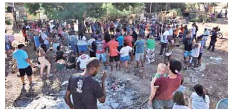
Moradores da Comunidade Renascer fizeram questão de se reunir com a pré-candidata para ouvir suas propostas para a habitação popular