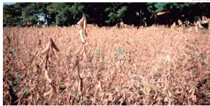
Publicado na revista Scientia Agrícola, da Esalq/USP, estudo mapeou decomposição do sorgo, capim, e sorgo consorciado com capim

Um estudo publicado recentemente, na revista Scientia Agrícola, da Escola Superior de Agricultura Luiz de Queiroz (Esalq/USP), revela que os sistemas agrícolas consorciados fazem uso mais eficiente dos nutrientes, visando uma agricultura mais sustentável no Cerrado.