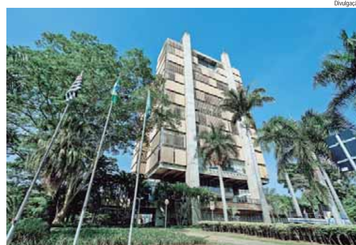
Notas funcionam como garantia para a União e referência aos Estados na liberação de financiamentos, repasse de recursos de convênios, entre outros

A metodologia analisa três indicadores do município, que são: endividamento, fazendo um comparativo entre a receita cor-