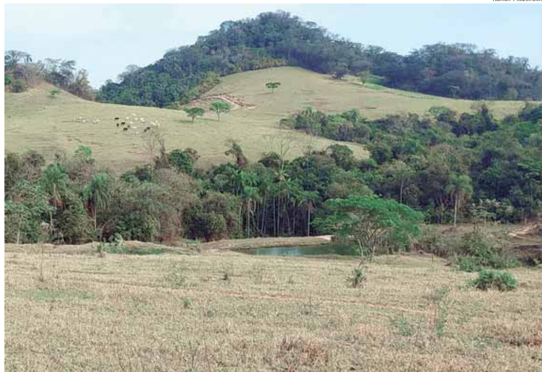
GT será composto por representantes da Prefeitura, dos Conselhos Municipais, de órgãos ou entidades e da sociedade civil organizada correlatas

Os Planos Municipais de Conservação da Mata Atlântica e Cerrado buscam retratar a realidade de cada município, no que se refere aos cenários atuais e futuros do território, sendo uma oportunidade para orientar as ações públicas e