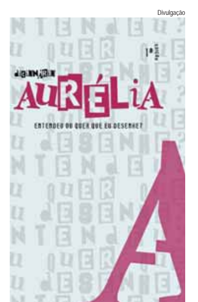
Divulgação Dicionário Aurélia explica termos machistas que as mulheres ouvem diariamente

O Dicionário Aurélia também tem uma página @dicionario_aurelia, onde todos os estudantes envolvidos no projeto mostram mais detalhes por trás do desenvolvimento do mesmo.