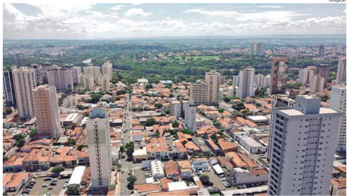
Evento acontece no Teatro do Engenho e é aberto ao público mediante inscrição prévia

“Nosso maior intuito com o plano é poder pensar Piracicaba para os próximos anos, considerando quais setores queremos desenvolver