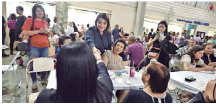
Bebel prestigiando a quermesse da Paróquia Santa Clara