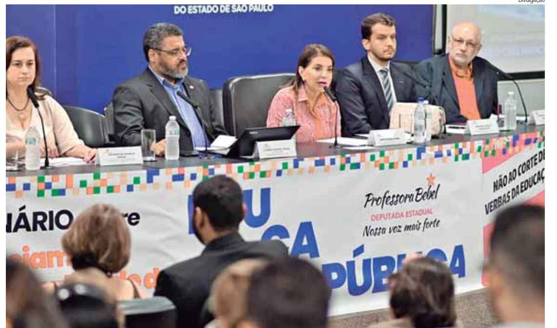
No seminário, a Professora Bebel falou sobre a luta que tem travado na Assembleia Legislativa do Estado de São Paulo (Alesp) contra o corte de recursos da educação estadual

De acordo com a deputada Professora Bebel, o monitoramento da execução do PEE e do cumprimento de suas metas, por meio de avaliações periódicas, conforme a lei aprovada, deve ser feita pela Secretaria Estadual de Educação, Comissão de Educação e Cultura da Assembleia Legislativa, Conselho Estadual de Educação, Fórum Estadual de Educação, União Nacional dos Dirigentes Municipais de Educação. Nesse trabalho, cabe