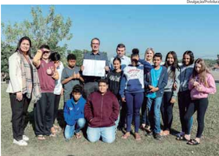
Espaço será baseado no projeto Super Arquitetos do Lazer em Defesa da Sustentabilidade